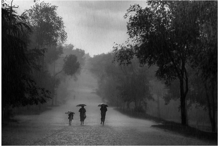
Imatge 1. La pluja moderada té efectes beneficiosos sobre el paisatge natural però, al mateix temps, incideix en la salut humana.

a la superfície terrestre, la qual cosa es tradueix en la caiguda de cent llamps per segon i vuit milions de llamps al dia (Uman, 1971). Aquesta notable freqüència fa que les fatalitats degudes a la fulminació per llamps siguin relativament comunes. Només als Estats Units s'estima que els llamps són responsables d'uns cent morts i tres-cents ferits cada any (Cherington, Yarnell i Lammereste, 1992). En el passat, la major incidència de morts per fulminació es registrava entre els pagesos (és el cas, per exemple, del besavi de l'autora) i mariners a causa de la caiguda directa del llamp sobre la persona aïllada en mig d'un espai obert i amb poc relleu (Lewis, 1997). Actualment, les víctimes inclouen també excursionistes, jugadors de golf i persones que practiquen altres activitats recreatives a l'aire lliure. Les lesions ocasionades pels llamps són les característiques d'un curtcircuit general dels sistemes elèctrics del nostre cos, com la transmissió de l'impuls cardíac o els impulsos del sistema nerviós central. Això fa que la majoria de les víctimes mortals (al voltant d'un 30% de les que han rebut l'impacte d'un llamp) (Whitcomb, et al., 2002) ho siguin a causa d'una parada cardiorespiratòria. Les víctimes que sobrevi-