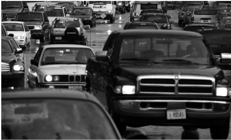
Imatge 3. Per les característiques pròpies del paisatge urbà els habitants de les grans ciutats pateixen més les altes temperatures.

paisatges urbans, provoca que els habitants de les grans ciutats pateixin les pitjors conseqüències de les onades de calor (Buechley, Van Bruggen i Truppi, 1972; McGeehin i Mirabelli, 2001). Aquest fenomen, conegut com a urban heat island (illa urbana de calor), ha estat descrit per diversos autors. A l'estat de Missouri (EUA), per exemple, un estudi sobre els efectes de l'onada de calor de 1980 va constatar que a les àrees metropolitanes de Saint Louis i Kansas City la mortalitat va augmentar un 57% i 64% respectivament, mentre que a les zones rurals del mateix estat l'augment va ser únicament d'un 10% (Jones, et al. , 1982).