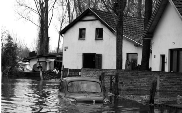
Imatge 2. Els fenòmens meteorològics extrems afecten la salut humana a través dels impactes directes però també per l'alteració dels ecosistemes locals i l'organització social.

en ocasions, tenen greus conseqüències per al paisatge i per a la salut de la població.