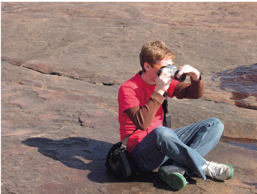
Imatge 2. La presa de fotografies per part dels alumnes pot servir d'excusa per reflexionar sobre les diferents maneres de llegir un paisatge i interpretar-lo.

diversos temes, com ara la subjectivitat de la percepció del paisatge (“vaig fer aquesta foto perquè...”, “m’agrada aquest lloc perquè...”, “no m’agrada aquest lloc perquè...”) o les diferències entre les fotos fetes per nois amb experiències i bagatges culturals diversos (què tenen en comú?, què les diferencia?, per què?), fent èmfasi especialment en les diferents maneres de llegir un mateix paisatge.