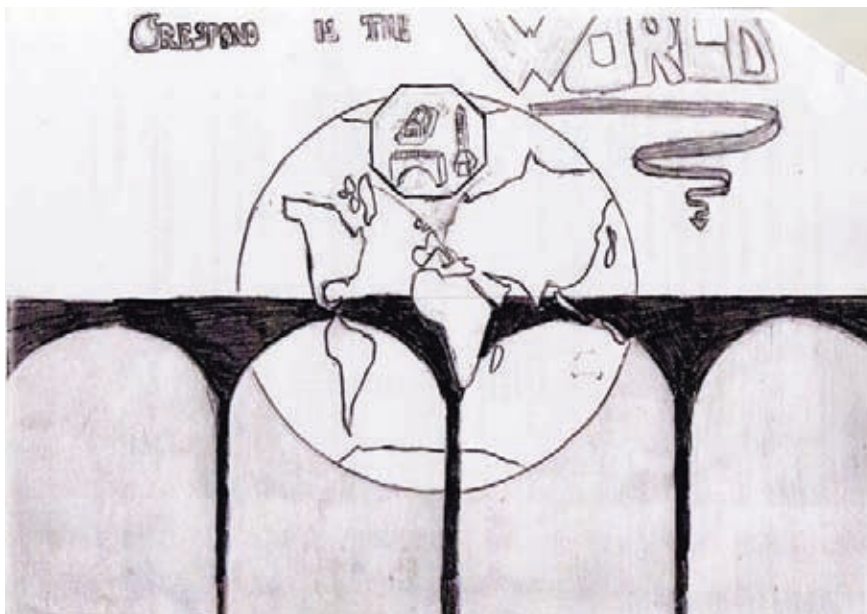
Figura 1. El microcosmos de Crespano es converteix en el món sencer en aquest dibuix d'un noi italià.

d'arribada: com el perceben? Fins a quin punt se senten encara lligats al paisatge antic ? És possible que el paisatge estimuli el sentiment de pertinença dels nouvinguts vers el seu nou entorn vital? I amb relació al territori que han deixat enrere?