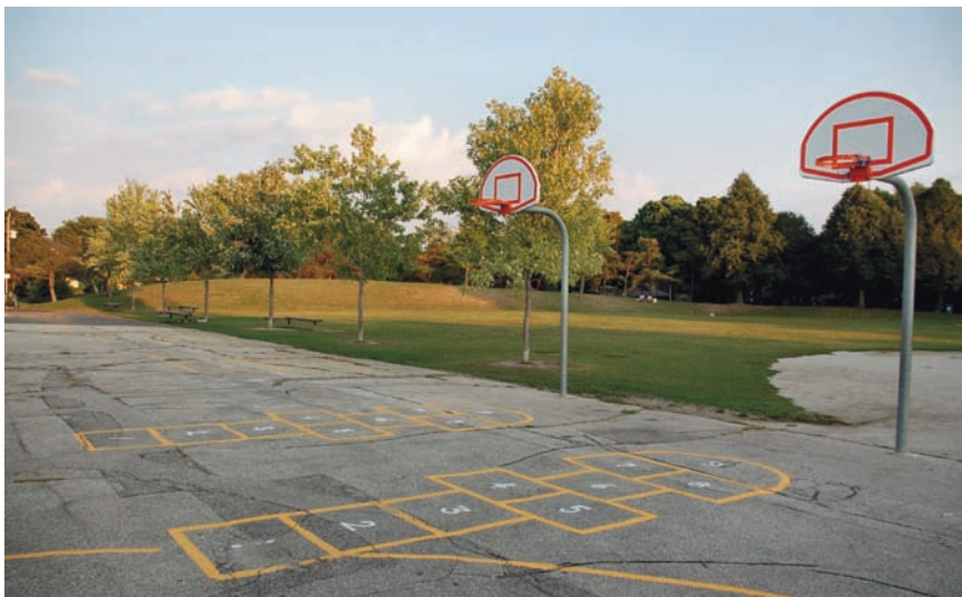
Imatge 1. El principal espai de referència dels nois nouvinguts és l'escola, seguida dels parcs públics i els equipaments esportius.

L'estudi va analitzar el concepte que els adolescents tenen del paisatge , mirant d'entendre què volen dir els nois i les noies quan fan servir aquest terme. Les conclusions demostren que, en bona part dels casos, tant italians com nouvinguts associen el terme paisatge amb idees com ara natura, espais verds, bellesa o ordre. Dins seu, un paisatge és sempre un paisatge bonic , un element que val la pena contemplar i que de vegades presenta trets idíl·lics. És interessant comprovar com alguns nois nouvinguts (i també alguns italians que ara viuen al Vèneto però que havien viscut o nascut en altres regions d'Itàlia) associen el terme paisatge amb el seu lloc d'origen. Així, per a aquests nois el paisatge no tan sols és un element que val la pena contemplar, sinó també una cosa que estimen i que recorden amb afecte.