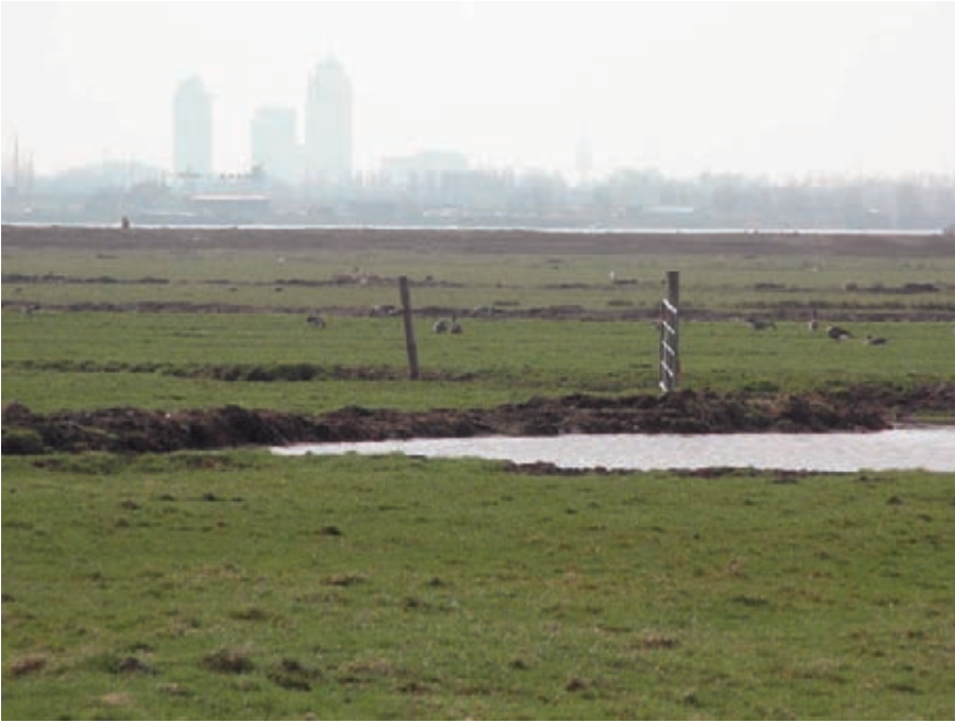
Imatge 1. Terrenys guanyats al mar en una plana de marea.