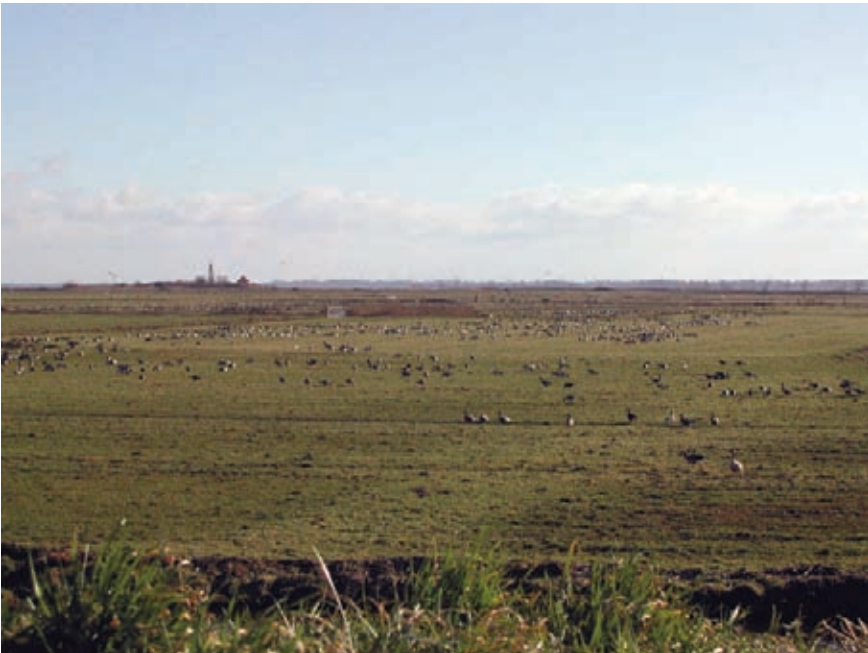
Imatge 2. Reserva natural per a aus.

pa occidental. En molts casos, els paisatges agrícoles altament productius que s'han desenvolupat en aquesta zona no són paisatges atractius per al lleure. En altres zones d'Europa, el que es produeix és un abandonament de les terres agrícoles. Encara que els primers anys després d'aquest abandonament s'observi un augment dels valors relacionats amb la biodiversitat, ben aviat el succeeixen dècades de creixement del bosc i la formació de paisatges no tan sols amb una biodiversitat menys interessant, sinó també menys interessants per si mateixos. Cal tenir en compte que els paisatges sense persones deixen de ser paisatges vius. Els paisatges vius poden existir a partir d'una relació desenvolupada conscientment i que se sol manifestar en l'ús multifuncional del paisatge. Alguns exemples d'aquesta relació són l'elaboració de productes regionals que es venen en botigues de granges ( farm shop ), la combinació de la producció agrícola amb l'oferiment de feina a persones amb necessitats especials, l'oferta de serveis d'allotjament i esmorzar a les granges, etc.