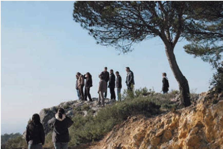
Imatge 3. Cal ensenyar els estudiants a descobrir el paisatge pel seu compte, de manera que, quan acabin la seva formació, hagin après del seu paisatge i hagin adquirit un compromís personal amb la valuosa diversitat dels paisatges europeus.