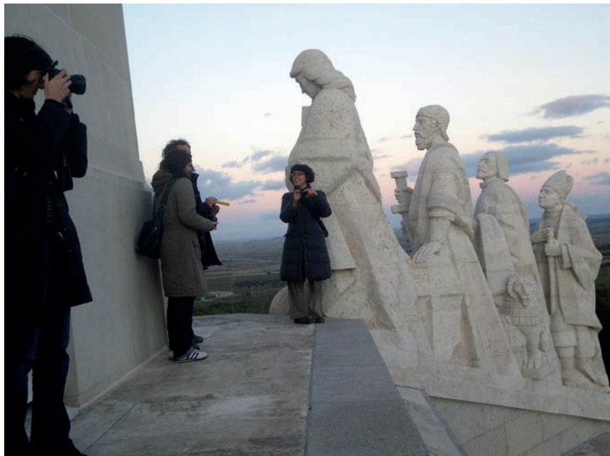
Imatge 8. El Cerro de Los Ángeles, amb apòstols, sants, conqueridors i indis sotmesos esculpits al peu de l'obelisc de la creu, s'erigeix com un mirador orbital des d'on s'albira tot el sud de Madrid.

sense interferències ni complicitats. Ocupar una oficina de gestió contínua, un espai d'oci perpetu a 300 quilòmetres per hora. Perdre-ho tot per guanyar uns instants. Paisatges en moviment on la velocitat es converteix en el principal relat territorial més enllà de qualsevol identificació.