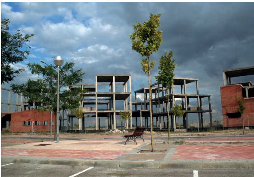
Imatge 10. Promoció d'habitatges abandonada.

lisme sota control social lliurat a l'acarnissament comercial corporatiu. La nostra modernitat bastarda va acollir aquesta imatge i el seu reflex. Un buit i la línia de fuga d'autorepresentació paral·lela amb la qual fuig. Som administradors d'un deute que serà pagat per generacions en haver lliurat el nostre patrimoni d'identitat al postor de la renúncia.