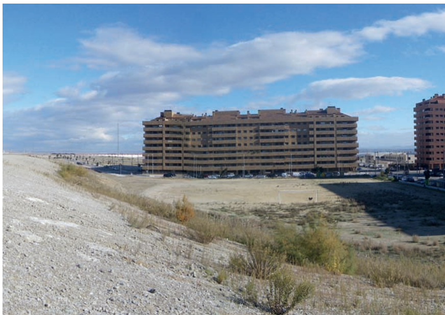
Imatge 5. Macroubanització de Seseña, envoltada d'un mar de terra erma.