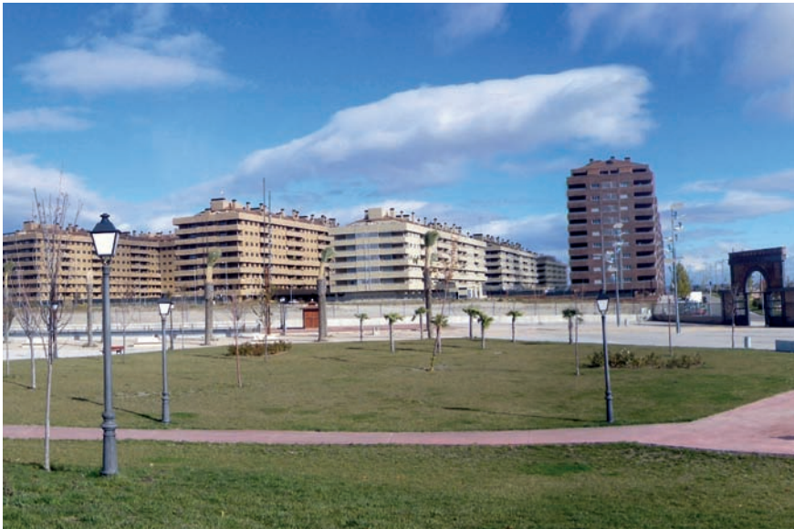
Imatge 6. El parc de María Audena, a Seseña, presenta tots els tòpics del parc urbà burgès: avinguda axial, prat de gespa, una glorieta, un estany navegable i fanals noucentistes.