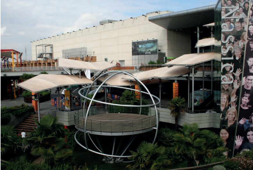
Imatge 2. El centre Nassica ofereix als clients tot tipus d'activitats de lleure: sales de cinema, màquines escurabutxaques, videojocs, pista de bitlles i, fins i tot, un simulador de nau espacial.

Acabem les nostres racions i sortim a prendre la fresca a la plaça Àgora. Baixem per una escalinata central il·luminada graó a graó; sembla com si voléssim sobre una nau d'abastament suspesa a l'espai. Un raig de llum surt projectat cap a l'infinit. És el làser de la discoteca que anuncia la festa. Un far en la foscor perifèrica. L'aparcament s'omple de cotxes tunejats. Fauna noctàmbula.