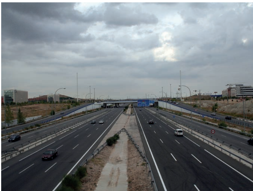
Imatge 7. L'autopista permet resseguir l'anell orbital de Madrid i apropar el conductor al subsuburbi de la ciutat.

Entrar a l'autopista és entrar en òrbita. Aquí la gravetat té lleis pròpies. L'M-50 és un bucle que gira. Madrid és el centre. Entrar i sortir. Sortir i girar. Arran de terra, l'horitzó no es perd de vista en aquest erm. Des dels cinc carrils de l'autopista el temps discorre veloçment. Només el paisatge roman, immutable, serè. La terra callada. No hi ha gaire afluència per aquestes vies. És l'òrbita tangencial de Madrid. Més enllà, el límit del no-res. Territori en guaret a l'espera dels macroprojectes, els traçats diversos, els plans urbans i les infraestructures logístiques i temàtiques.