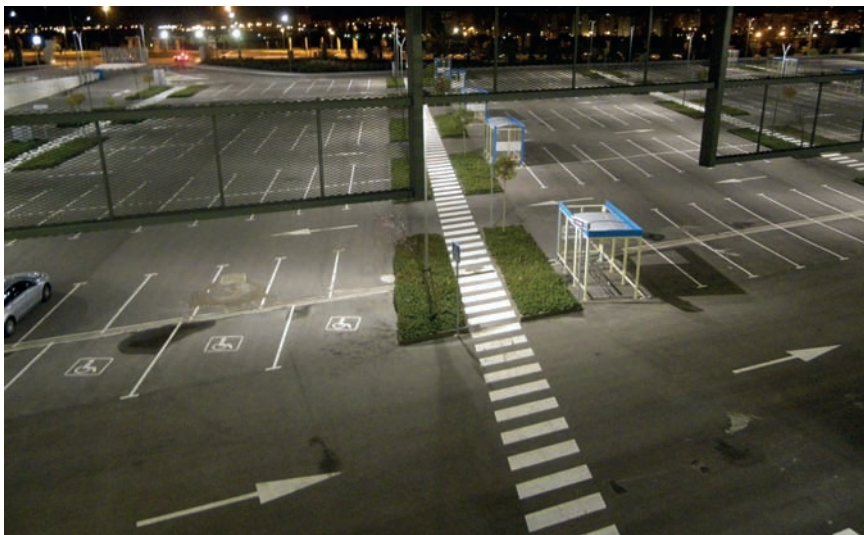
Imatge 3. Cada dissabte, els aparcaments dels centres comercials esdevenen punts de trobada de consumidors i grups de joves que se citen en aquests espais per recollir-hi els cotxes.

compres acabades d'adquirir. Grups de joves se sumen al tràfec i se citen aquí per recollir els cotxes. El ritual de cada dissabte.