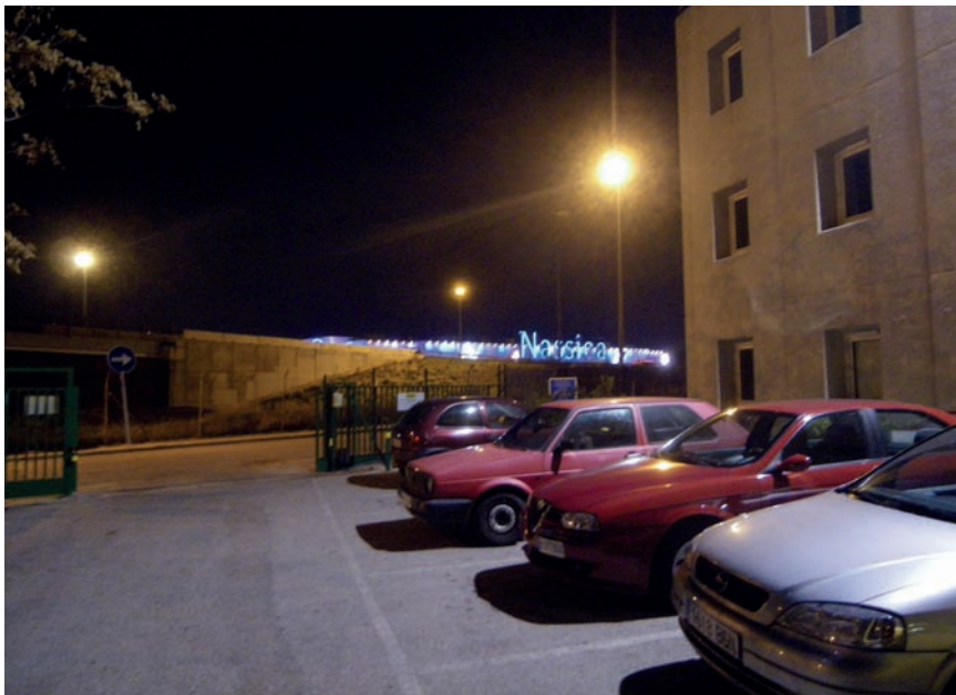
Imatge 1. Aparcament de l'Hotel Formule 1 Madrid Getafe, situat a prop del centre d'oci Nassica.

i contenidors de càrrega. La llum groga dels focus dona una atmosfera tètrica a tot el recinte. Seguim els senyals. Passem per davant de l'hotel sense trobar-hi l'accés. Tornem al punt de partida. Un cop més girem a mà dreta i veiem en la semipenombra una tanca. Reculem. “Teclegi el codi d'accés”, es llegeix al rètol que hi ha penjat. Al costat hi ha un interfon amb un botó retroil·luminat. Premo l'interruptor i una veu femenina ens convida a passar i acciona l'obertura automàtica de la tanca. Aparquem a l'interior del recinte. A la porta un altre rètol ens sol·licita el codi d'accés de sis dígits. No el tenim. Des del taulell la recepcionista ens obre. Després de demanar-nos la documentació ens assigna una habitació. La número 337, tercera planta, habitació per a no fumadors. Ens imprimeix un paper amb aquestes dades.