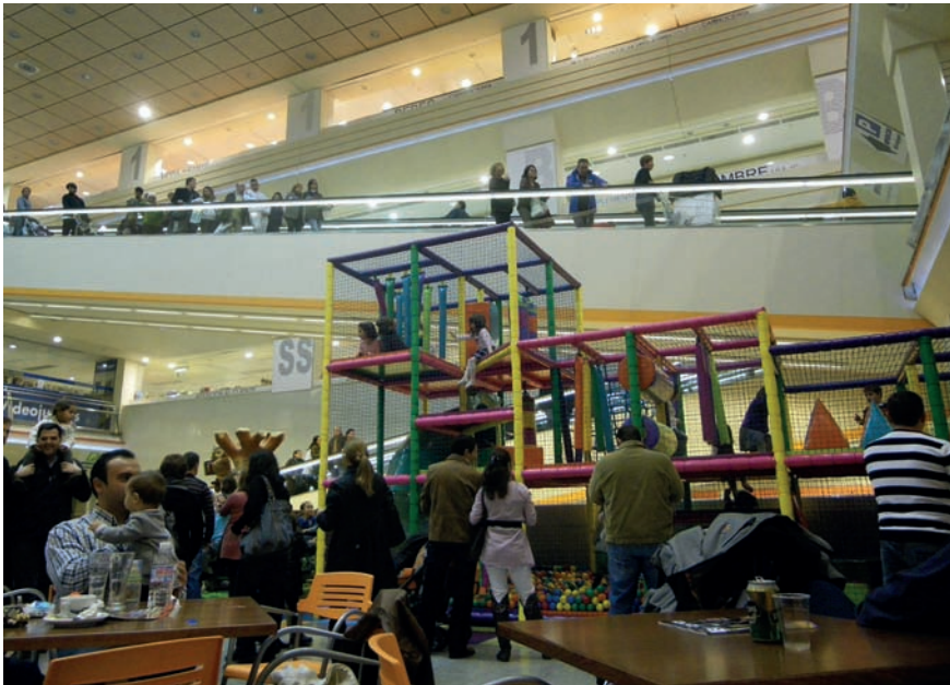
Imatge 4. Sector de taules a l'àrea de fast-foods del Punt de Trobada a prop d'un castell inflable. El soroll del lloc dificulta mantenir una conversa.

Sortim del complex. Fora, l'erm s'estén, buit. L'edifici, com un vaixell, concentra l'activitat en l'interior hermètic, sucumbint en un últim respir.