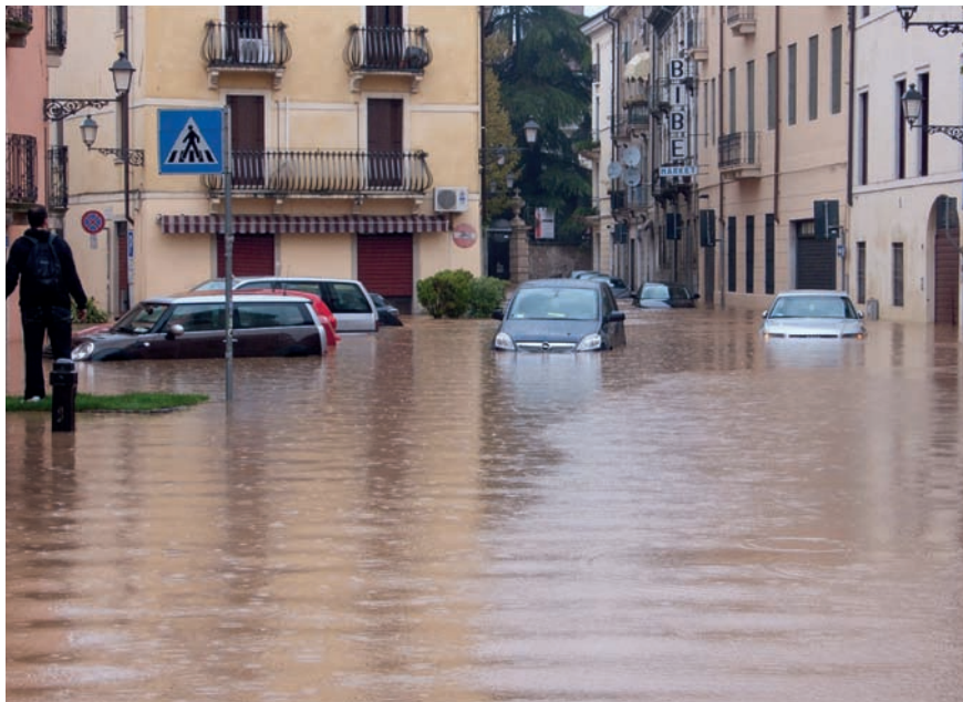
Imatge 4. El centre històric de Vicenza, la ciutat de Palladio, es va inundar el novembre del 2010.

En els països d'industrialització més antiga, que van viure l'expansió consegüent de la urbanització en les àrees rurals, el concepte de river corridors , que es pot traduir per corredors fluvials , evoca una ordenació territorial de transició entre els sistemes terrestres i aquàtics, una mena d'oasi lineal que molt sovint serpenteja per regions fortament antropitzades. El valor d'aquestes ecozones està estretament lligat a l'amplitud de les ribes i a la qualitat de l'àrea de divagació fluvial (Petts, 1990). Les fases d'augment de cabal, en un context de naturalitat elevada, s'han de considerar un aspecte dinàmic positiu que contribueix al manteniment d'un nivell satisfactori d'eficiència ecològica.