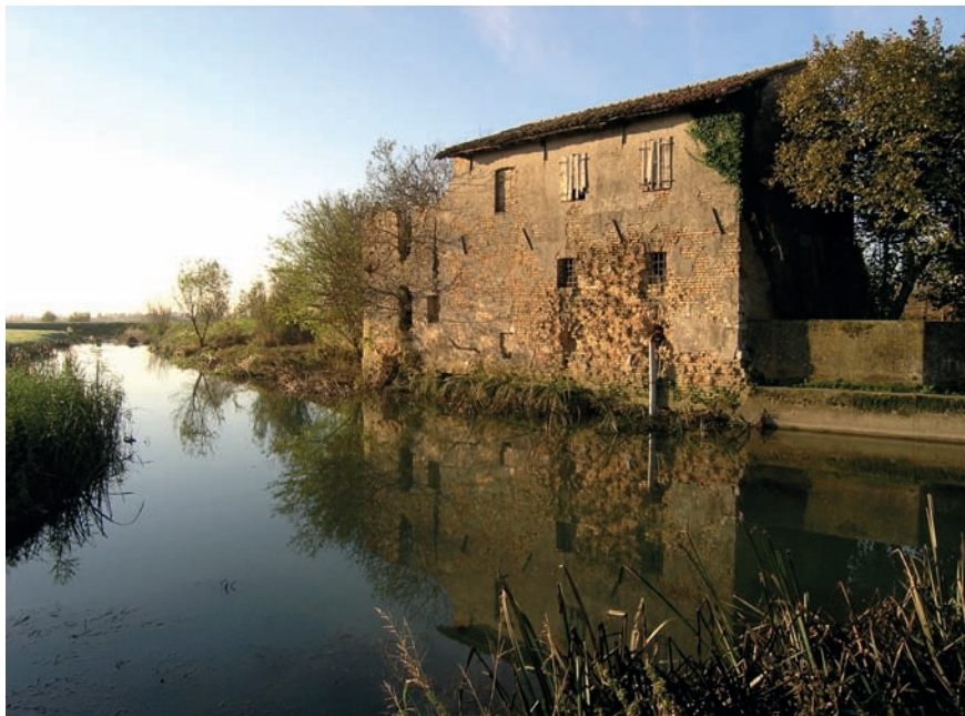
Imatge 3. Les noves estratègies de recuperació ambiental i paisatgística han de partir de la recuperació del patrimoni construït, com és el cas dels molins abandonats en els cursos d'aigua menors.

territorial satisfactori, sense negligir la funció fonamental de la qualitat estètica i ecològica del paisatge, de l'imaginari col·lectiu i de la memòria. No falten exemples lloables també a l'àrea vèneta de redefinició de la identitat hidràulica en sintonia amb la recuperació del sentit dels llocs i de l'arrelament, els dos paradigmes més innovadors per restaurar i recuperar una territorialitat més satisfactòria, a la mida de l'home. La recuperació de la memòria hidràulica també inclou aspectes menys destacats de la cultura de l'aigua, com ara les construccions senzilles que la història ha dispersat pels recs, els canals i els rius menors, però també les velles barques de fusta abandonades en terres inundables, entre el fang, i els molins en mal estat, els llogarets arran de riu, els ponts o els molls.