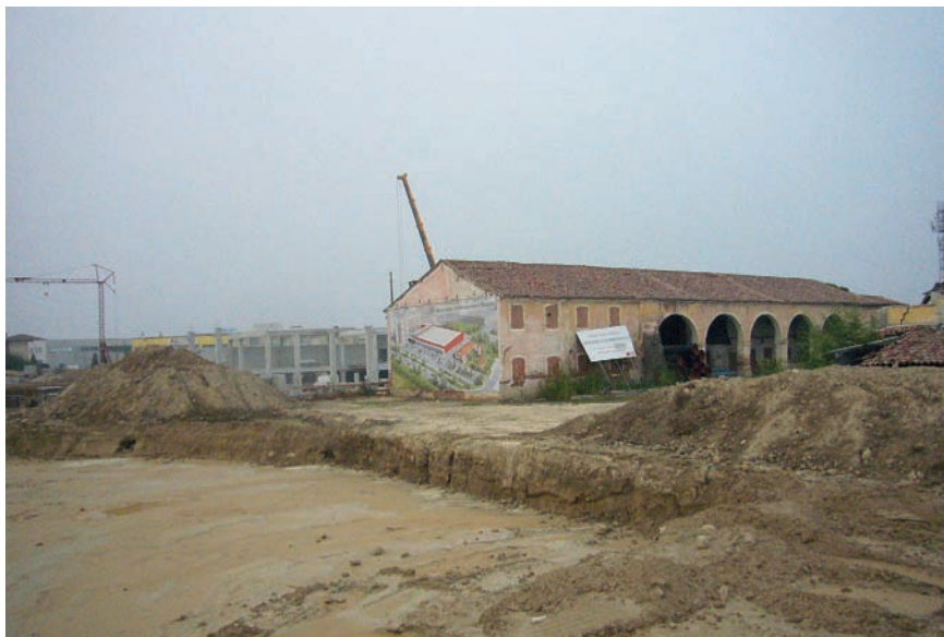
Imatge 1. L'especulació immobiliària ha transformat els paisatges tradicionals del Vèneto central.

migoneres; o les antigues séquies substituïdes per canonades de ciment, després d'arrencar o esmicolar la vegetació limítrofa, i cobertes de runa per ubicar-hi nous aparcaments, noves infraestructures viàries, nous establiments. Tot això constitueix el relat d'un viatge que sembla la crònica d'una catàstrofe no tan sols endèmica, sinó també inevitable.