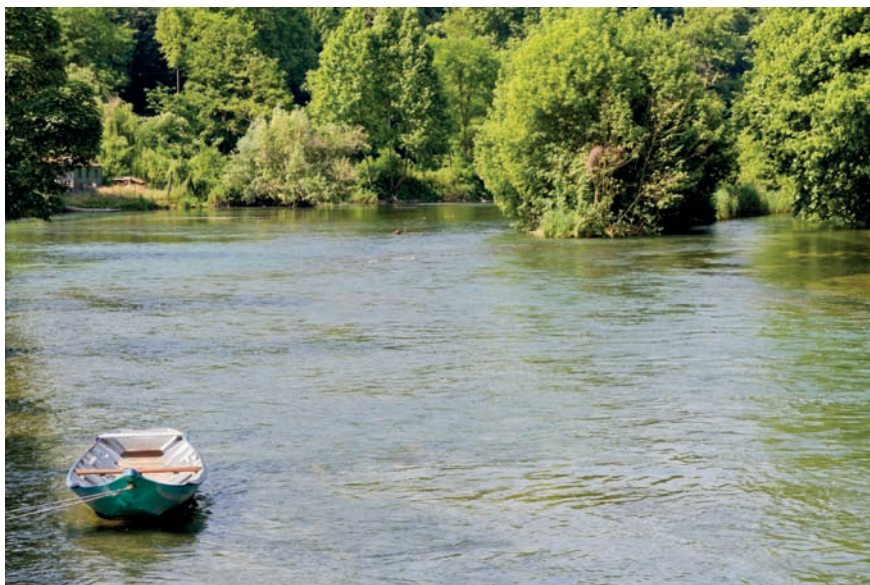
Imatge 5. En el Vèneto s'està produint una redescoberta de les oportunitats recreatives que ofereix el sistema hidrogràfic.

Com en la major part dels entorns metropolitans del món occidental, la densa trama hidrogràfica del Vèneto ha afavorit indubtablement la consolidació de noves mirades territorials, que, mogudes per l'interès per la protecció del paisatge i per la cura dels béns col·lectius, s'han vinculat a una redescoberta progressiva de les oportunitats recreatives que ofereix aquest dens sistema hidrogràfic. El declivi dels rius i els canals com a vies de tràfic comercial i com a llocs de pesca els ha relegat a la funció d'àrees abandonades, però, com és ben sabut, en l'evolució postindustrial de les societats opulentes es donen oportunitats de recuperació i requalificació funcional de les estructures obsoletes creades durant l'expansió industrial paleotècnica (Vallerani, 2003).