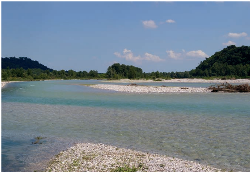
Imatge 2. El curs mitjà del riu Piave conserva encara els paisatges atractius que ja havien estat lloats per la tradició humanista del final de l'edat mitjana i que constitueixen una solució de continuïtat en la imparabile transformació de la zona.

L'antropització dels cursos d'aigua va facilitar també l'ocupació d'aquests territoris, en la major part dels casos ampliant l'espai urbanitzable i perfeccionant la xarxa de transports, tant terrestres com fluvials. De la gestió de l'aigua a la millora del terreny: al Vèneto del segle XVI, per exemple, s'aplicava el paradigma neoplatònic de l'harmonia natural assolida gràcies a la separació ordenada dels elements aigua i terra per mitjà de les canalitzacions de drenatge. I aquí val la pena recordar l'elogi que Palladio feia dels paratges fluvials per a la construcció de la vil·la rural. Deia que els cursos d'aigua regulats amb rescloses, canalitzats, vorejats de rengleres ombrívols d'arbres, a més de facilitar les relacions entre la ciutat i el camp, eren per si mateixos elements harmònics del paisatge, indrets d'esbarjo per alegrar l'ànim de qui passejava per les ribes, però també de qui hi navegava (Palladio, 1570).