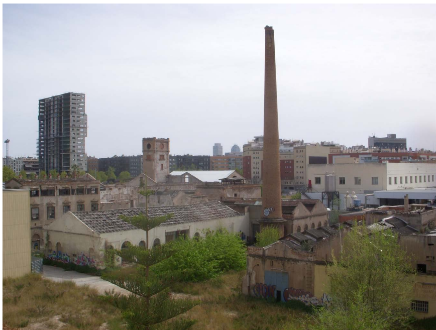
Imatge 2. Vista parcial de Can Ricart amb els elements arquitectònics de la torre del rellotge, la xemeneia i les naus industrials. Can Ricart és un exemple de patrimoni industrial pendent de transformació.

vitat industrial tradicional, sovint considerada banal, perquè es creu que aquesta indústria podria resultar estratègica. En una transformació urbana i econòmica postcrisi, integrar la indústria manufacturera en les polítiques urbanes pot ser crucial per renovar el teixit empresarial i reforçar els avantatges competitius de la ciutat. Fan falta fusters i serrallers i també el comerç local i tradicional en general, que són agents urbans glocals competitius, i que fugen de la banalització. En aquest sentit, calen intervencions polítiques per afavorir una ordenació que redueixi els impactes negatius en el sector productiu manufacturer.