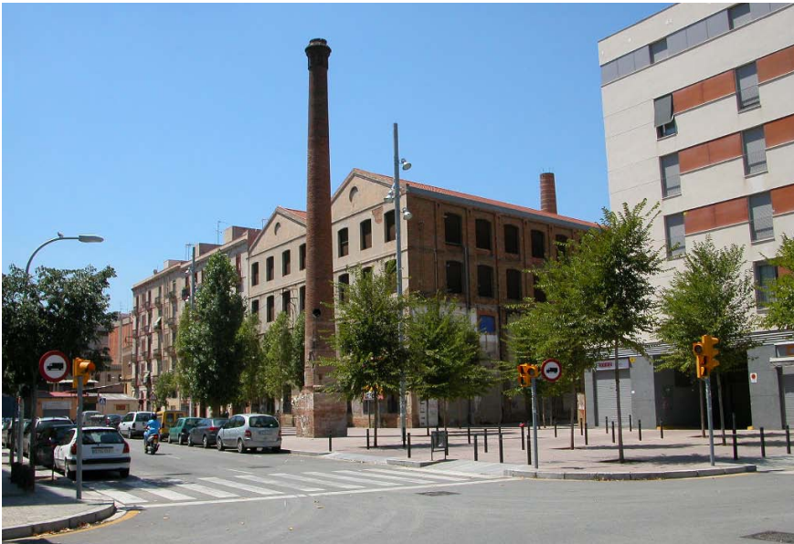
Imatge 1. Fàbrica de Can Saladrigas. Des de l'any 2009, inclou la Biblioteca Manuel Arranz, exemple de patrimoni industrial transformat.

dediquen recursos a la creació d'assentaments urbans relacionats amb les noves tecnologies (Castells, 2000; Méndez, 2013) i, d'altra banda, afavoreixen una nova governança urbana amb una participació creixent del sector privat i, en menor mesura, de les organitzacions civils en la concepció, la planificació i la implementació de les polítiques urbanes (Harvey, 1989; Casellas, 2016). L'objectiu d'aquestes polítiques urbanes és l'ampliació o la reconversió de la base econòmica existent (Musterd i Murie, 2010; Dot, 2015).