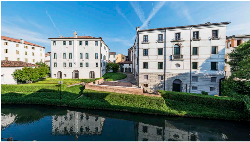
Imatge 2. Seu de la Fondazione Benetton Studi Ricerche, a Treviso.

dels béns culturals i del paisatge, amb el món universitari i el món de l'empresa. Aquesta naturalesa mixta ha afavorit el desenvolupament d'una capacitat de diàleg amb mons que tenen punts de referència tan allunyats que resulta impossible que trobin espais comuns de debat i mediació. Ens referim al món de l'empresa i al de la tutela pública dels béns culturals i al conflicte entre ells, tal com s'ha esmentat anteriorment. En aquest àmbit hi ha institucions que poden exercir un paper important a partir de la capacitat d'identificar espais d'intermediació i de comunicació que ambdós mons poden compartir i de crear una mena de cabines d'interpretació simultània necessàries perquè entrin en contacte veritables aparells lingüístics i semàntics. La llibertat d'acció i l'autonomia conquerida durant anys de treball constitueixen els elements fonamentals per a l'èxit d'una possible acció de mediació, que, consegüentment, depèn de la capacitat de crear els vincles adequats amb institucions anàlogues en funció de l'àmbit de treball i l'orientació cultural.