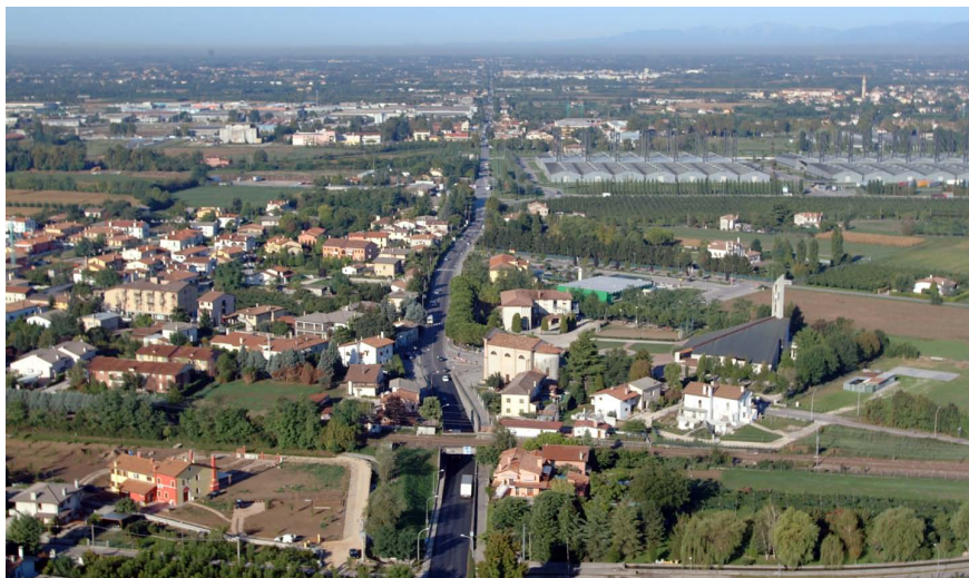
Imatge 1. El creixement en taca d'oli, o urban sprawl , va ser una constant a Europa durant la segona meitat del segle xx. A la imatge, urbanització al llarg de l'antiga via Postumia, a la localitat de Castrette, Treviso.

màntiques d'un país europeu a un altre a causa de les diferències en l'arrel cultural del terme paísatge ( landscape/Landschaft enfront de paesaggio/paysage ) (Venturi, 2002), el Conveni ha vetllat per definir els trets característics de qualsevol paísatge: les delimitacions espacials, la interacció entre factors naturals i antròpics, el factor perceptiu i el cronològic. El pas del temps és determinant a l'hora de desxifrar el dinamisme inherent als paisatges, els quals evolucionen de manera paral·lela al context cultural, que, al seu torn, comporta una percepció diferent per part de la població. Els processos de transformació se sedimenten i creen nous paisatges per l'acció de l'ésser humà, que ha crescut en intensitat des de l'època de l'inici de l'agricultura —tot just fa vuit mil anys— fins als nostres dies. Tornant al període analitzat al punt anterior, el del gran desenvolupament econòmic de la segona meitat del segle passat, s'hi poden afegir algunes consideracions. La intensitat dels processos que s'han produït ha perjudicat la resiliència dels sistemes naturals i antròpics, atès que tot s'ha esdevingut massa de pressa, sense que hi hagués la possibilitat d'instaurar els processos d'adaptació adequats (Ortalli, 2010) i alterant la identitat dels paisatges italians de manera insostenible. Un procés d'aquestes dimensions no