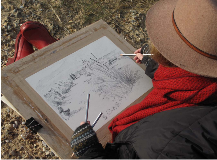
Imatge 3. El projecte Touching the Tide, organitzat per Suffolk Coast & Heaths Area of Outstanding Natural Beauty, promou la reflexió sobre el futur del paisatge litoral del comtat de Suffolk amb iniciatives diverses, com ara tallers artístics on es convida els participants a explorar a través de l'art el sentit contemporani del lloc.

famosos d'Anglaterra, el Dove. Aquest riu, que ja apareixia fa tres-cents cinquanta anys al llibre The Compleat Angler , d'Izaak Walton (1653), avui dia està afectat pel llim i la contaminació provocada per aquest tipus de ramaderia intensiva. El projecte busca trobar un equilibri entre l'agricultura com a amenaça i com a oportunitat per al territori.