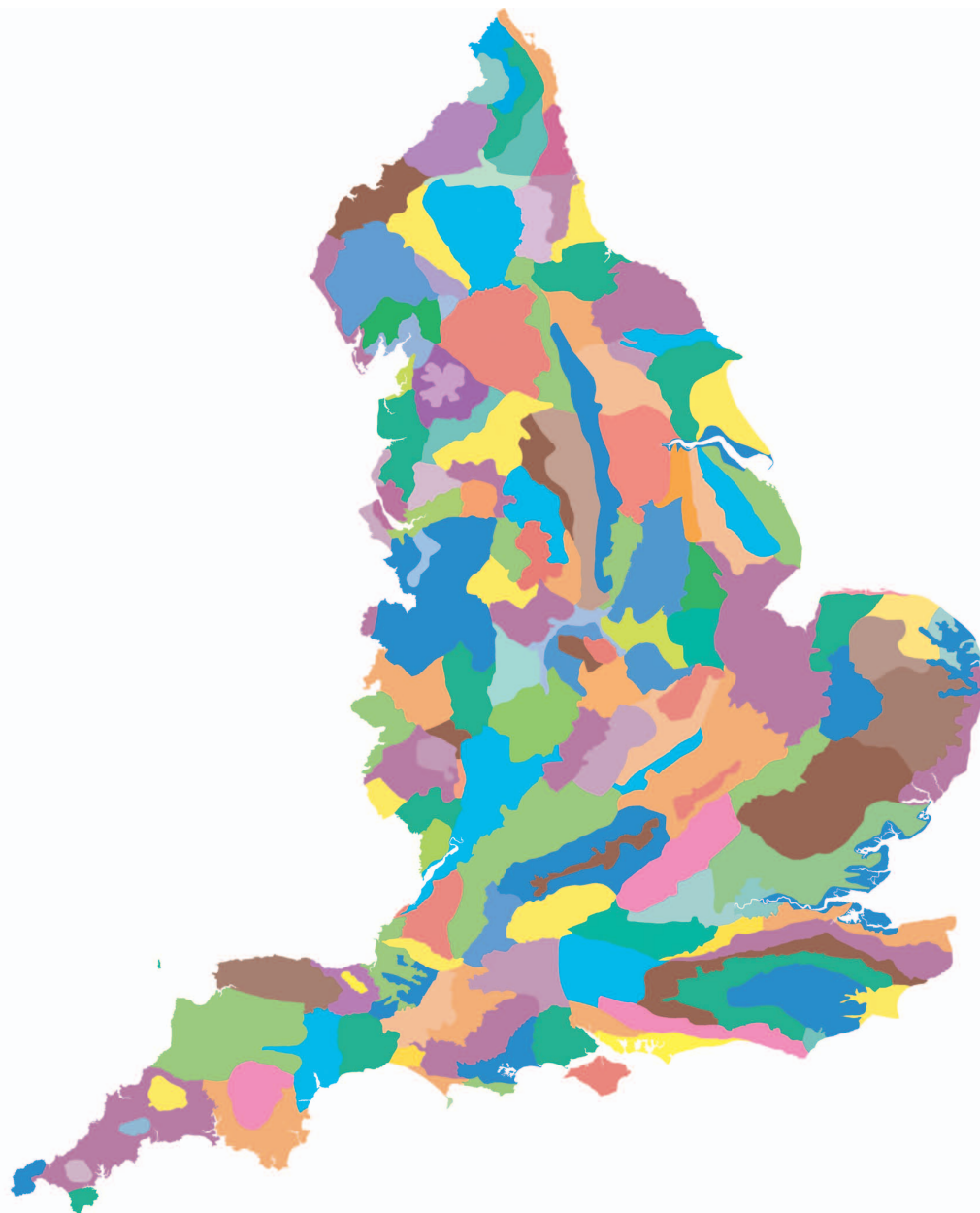
Mapa 1. Mapa de les 159 àrees amb caràcter paisatgístic singular d'Anglaterra.