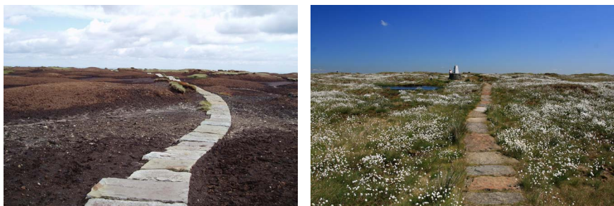
Imatge 2. Comparativa del paisatge de Black Hill a Peak District, al nord d'Anglaterra, el 2004 i el 2010, on s'aprecia el gran impacte de les tasques de restauració dutes a terme en el marc del projecte Moors for the Future.

Tres projectes impulsats per partenariats pel paisatge mostren clarament la diversitat d'iniciatives que s'acullen al fons. El primer projecte, Moors for the Future, es desenvolupa a la serralada dels Penins, al nord d'Anglaterra. El segon exemple és Turning the Tide, el qual es duu a terme en una zona plana, per sota el nivell del mar. I el tercer projecte, Landscape at a Crossroads, treballa amb el paisatge i l'agricultura.