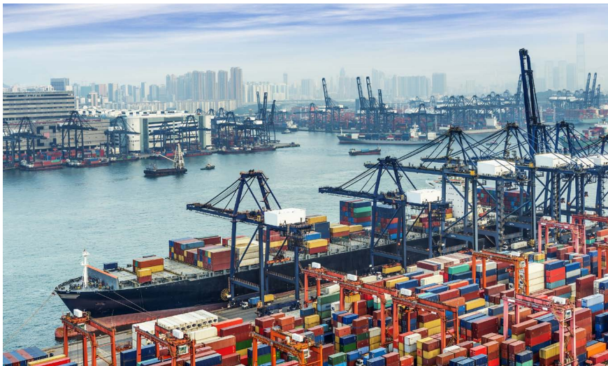
Imatge 1. La utilització generalitzada del contenidor metàl·lic per al transport marítim ha derivat en la transformació de les instal·lacions portuàries de tot el món i la pràctica separació física del port i les ciutats.

Res no ha estat el mateix d'ençà el 26 d'abril de 1956, data en què l' Ideal-X , un vell petrolier reconvertit en vaixell mercant, salpà de Newark (Nova York) cap a Houston amb 58 contenidors de la mida d'un remolc de tràiler a bord. Ningú no es podia imaginar que l'aparició del contenidor metàl·lic d'aquell format canviaria l'aspecte de tots els ports del món. Tanmateix, l'ocurrència que tingué Malcom McLean en ple boom econòmic americà va significar un punt d'inflexió per al comerç marítim, que determinà una reorganització total del sistema portuari i de la seva morfologia. La racionalització dels mètodes d'emballatge, transport i emmagatzematge de les mercaderies, fàcils de reproduir en sèrie amb una solució de despesa continguda, fou un gran èxit perquè representava la reducció dels temps de càrrega i descàrrega dels vaixells i la posterior mecanització de les operacions logístiques, que permetia estalviar temps i mà d'obra, i, a més, reduïa els danys a la càrrega. Així és com neix el port modern, intermodal, tot i