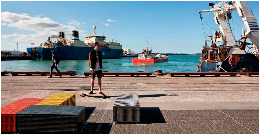
Imatge 3. El projecte del front marítim d'Auckland ha conservat la memòria i el patrimoni portuari sense convertir-lo en vestigi estàtic, sinó que l'ha integrat en un espai dinàmic i obert a nous usos per a la població local.

A Auckland, la North Wharf Promenade i el Silo Park són espais contemporanis, espais públics que no esborren la memòria productiva del port vell i que fan que tot allò preexistent no es converteixi en vestigis estàtics, sinó en nous elements d'un espai públic dinàmic, amb un llenguatge nou, totalment diferent del que s'empra en altres espais públics de la