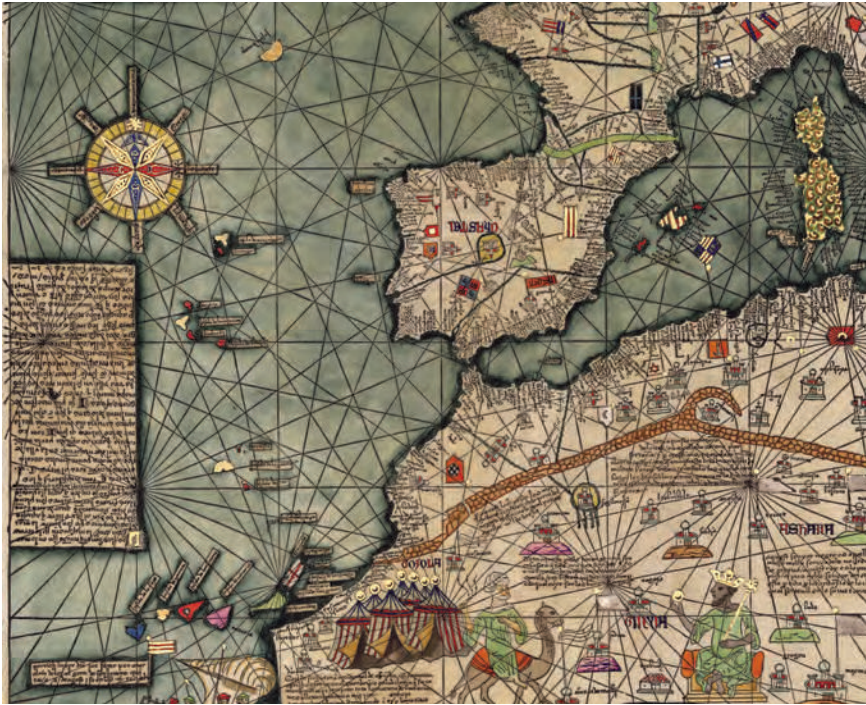
Figura 1. Fragment de l'Atlas català, elaborat el 1375 per Cresques Abraham amb l'ajuda del seu fill Jafudà, on es va voler fixar un testimoni de la condició cultural de l'època.

és vista des de la càrrega subjectiva que genera en la manera de dibuixar, fotografiar, descriure, una explosió de noves impressions en el receptor. La representació esdevé llavors, al meu entendre, nou paisatge.