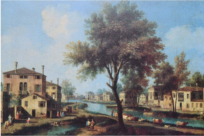
Imatge 2. La vida quotidiana al costat del riu es va convertir, durant el segle XVIII, en un tema iconogràfic de prestigi, sobretot a l'àrea llombarda i vèneta. A la imatge, quadre de la riba del riu Brenta, de Domenico Cimaroli (segle XVIII).

De tot això se'n dedueix que la construcció dels paisatges de l'aigua, sobretot a la zona de la Llombardia i el Vèneto, depèn de la relació estreta