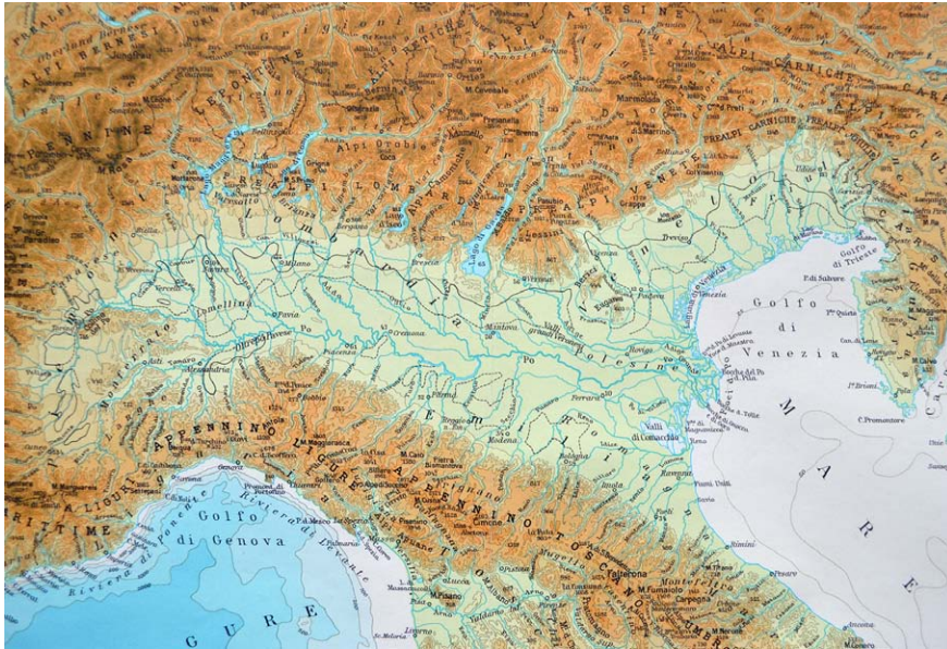
Figura 1. Mapa físic de la plana Padana amb la conca hidrogràfica del riu Po i l'extensió oriental de la plana venetofriülana.

oest-est, amb una superfície d'aproximadament 46.000 km 2 , una extensió que inclou les planes del Vèneto i del Friül, que no tenen rius que desembocuin al Po. L'altitud de la vall per on flueix el Po, excloent-ne els afluents, varia des d'uns 4 m per sota del nivell del mar, a la subregió de Polesine, fins a uns 2.000 m al naixement del riu, a la província piemontesa de Cuneo, a l'oest de Torí. Travessen la vall una sèrie d'afluents que baixen de les muntanyes dels Alps al nord i dels Apenins al sud. Els principals afluents del Po són: Tarano, Scrivia, Trebbia, Panaro i Secchia, al sud, i Dora Riparia, Dora Baltea, Sesia, Ticino, Adda, Oglio i Mincio, al nord (Bondesan i Castiglioni, 1989).