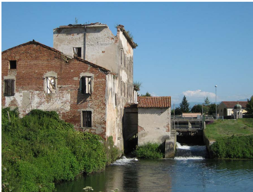
Imatge 3. Antic molí del segle XVII abandonat i en ruïna a la zona de Vicenza.

satges de l'aigua es limitava a unes ribes urbanes determinades amb patrimoni històric significatiu, amb ponts preciosos amb valor icònic, com el pont dels Alpinistes de Bassano del Grappa, el Ponte Vecchio de Florència o el pont cobert de Pavia. Els darrers anys, però, s'ha produït un canvi de mentalitat col·lectiva que ha permès començar a percebre la importància del patrimoni cultural menor. D'aquesta manera, s'ha vist que les vil·les i els palaus de la noblesa repartits al llarg dels marges, els nombrosos pobles riberencs tradicionals, els antics molins i els petits ports fluvials conformen un conjunt de trets culturals rellevants que permeten qualificar d'eix cultural alguns dels rius i canals de la plana Padana.