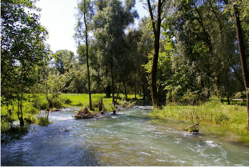
Imatge 4. A la plana Padana hi ha encara un important patrimoni natural vinculat al riu en bones condicions ecològiques. A la imatge, rierol prop del curs mitjà del riu Ticino.

culturals. Aquesta herència immaterial permet identificar amb una precisió raonable l'esperit profund de tota una regió, fins al punt que podria ser útil intentar fer coincidir la concreció de la geografia padana amb una idea específica de territorialitat hidràulica. D'aquesta manera, s'estableixen les línies metodològiques per definir un autèntic humanisme hidràulic , que es conjumini amb les valoracions tècniques i de descripció quantitativa més tradicionals, gràcies a l'ús de les iconografies culturals, literàries i pictòriques, i de les narracions orals, a fi d'estimular altres percepcions i d'alliberar un comportament sensorial més complet (Nogué, 2009).