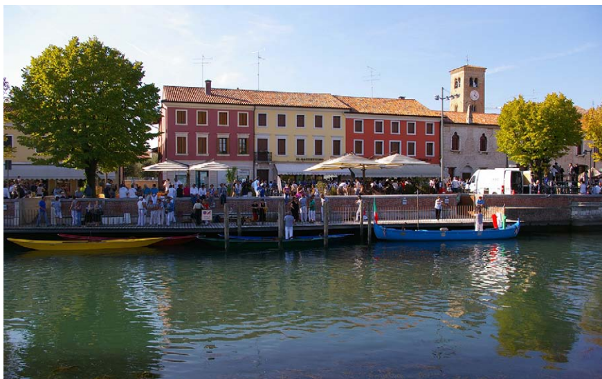
Imatge 5. Als darrers decennis s'està produint una recuperació de l'ús social del riu a la plana Padana.

Per tot plegat, afortunadament, les percepcions col·lectives actuals posen de manifest un interès renovat pels paisatges fluvials, tot i que les decisions de política territorial no sembla que donin la benvinguda als estímuls més innovadors i al paradigma més apropiat per a una gestió eficaç del territori. La idea dels paisatges fluvials com a patrimoni cultural és sens dubte un concepte comú que comparteix la majoria de la població, per la qual cosa hi ha iniciatives interessants i prometedores en l'àmbit local, amb la intenció d'obligar els polítics locals a complir els requisits de la Directiva marc de l'aigua. El problema és l'acció política, sobretot quan s'ha de pensar en les dimensions de la unitat de la conca, que va més enllà de les fronteres regionals (Bastiani, 2011).