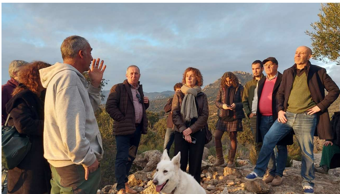
Figura 8. Assistents a la reunió de treball durant la visita sobre el terreny.

El celler realitza activitats ecoturístiques, amb visites a les vinyes i al celler però les visites a la finca són nombroses perquè els visitants busquen poder contemplar els monuments megalítics o els estanys temporanis. El problema és que els visitants no són conscients de l'impacte que poden tenir sobre un entorn tan delicat com el d'una zona humida en recuperació i, per tant, la sobre freqüentació suposa una amenaça per la biodiversitat. El propietari va expressar la dificultat de gestionar les persones que volen accedir amb cotxe per camins particulars o que deixen que els gossos es banyin en els estanys amb els problemes que això pot suposar.