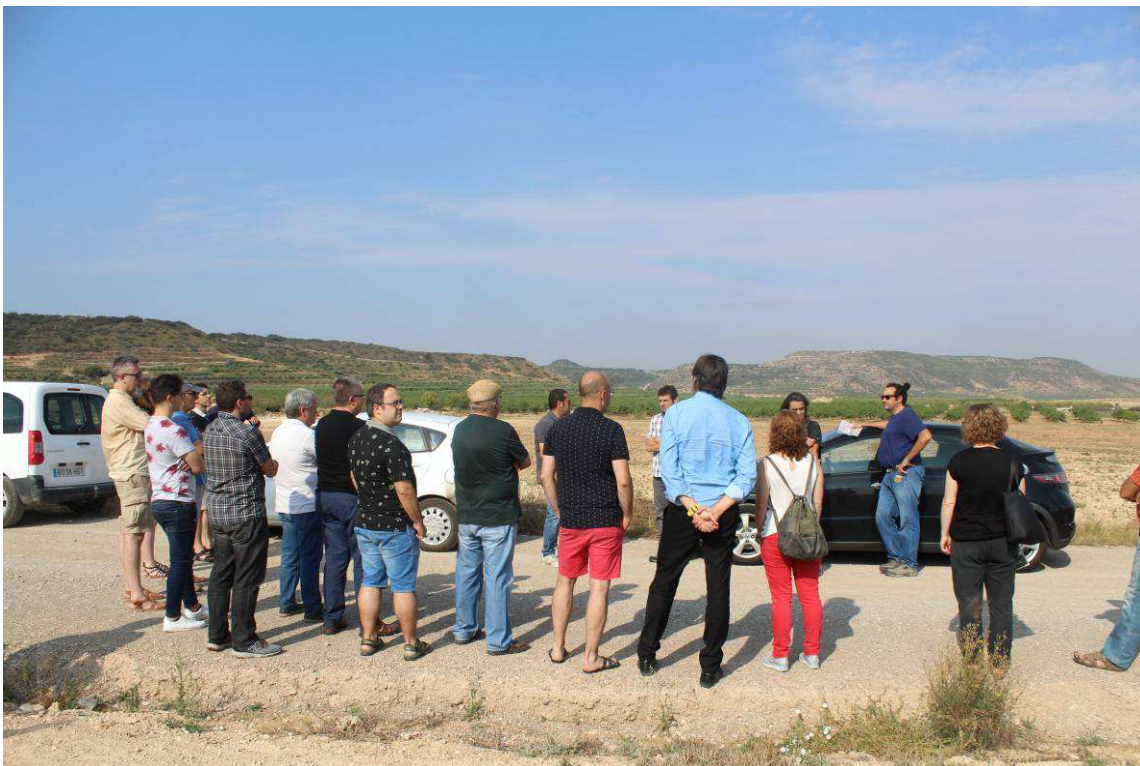
Fig 1. Visita sobre el terreny per apreciar les transformacions paisatgístiques vinculades a l'agricultura i, en especial, al canal Segarra-Garrigues.

La reunió va tenir lloc al Centre d'Interpretació de les Pintures Rupestres del Cogul (les Garrigues) el 12 de juliol de 2018 i va comptar amb la participació de 37 de persones (vegeu l'annex amb la llista de participants) en representació de diverses iniciatives de paisatge en l'àmbit local de Catalunya així com d'algunes entitats directament implicades en el desenvolupament local i l'agricultura.