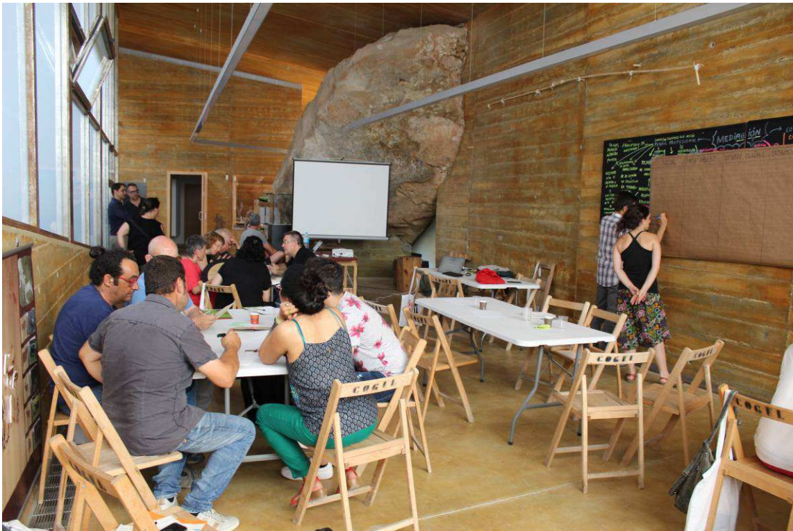
Fig 9. Treball en grup durant el taller.