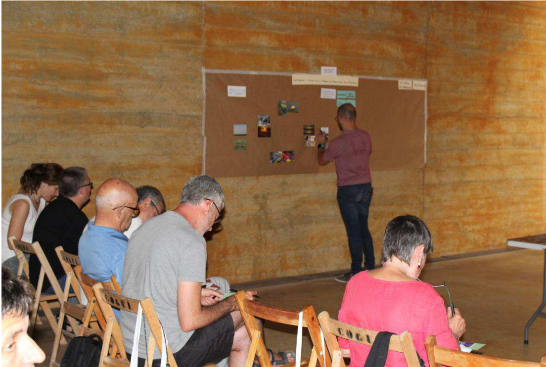
Fig 8. Participants durant la realització dels exercicis.

A més, de forma espontània, al final del debat van sorgir les següents qüestions, que van restar obertes per a debats futurs: