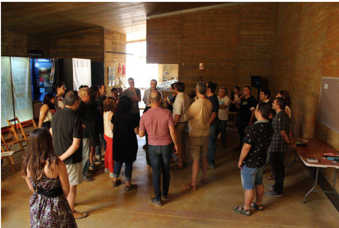
Fig 7. Els participants es van distribuir en l'espai segons la posició que consideraven que havien d'ocupar en la xarxa Territoris pel Paisatge

En la primera representació la xarxa tindria un node central (l'Observatori del Paisatge, tal com van suggerir alguns participants) amb el que tota la resta de nodes (membres) de la xarxa hi tindrien interaccions úniques (sense connectar amb la resta de membres). La segona representació mostra una estructura més evolucionada, i a la qual van fer referència alguns participants (inclosos els representants de l'Observatori del Paisatge) en el qual el nucli de la xarxa estaria més compartit, i els diferents membres hi participarien amb un grau divers d'intensitat segons el seu interès i implicació en iniciatives de planificació i gestió del paisatge.