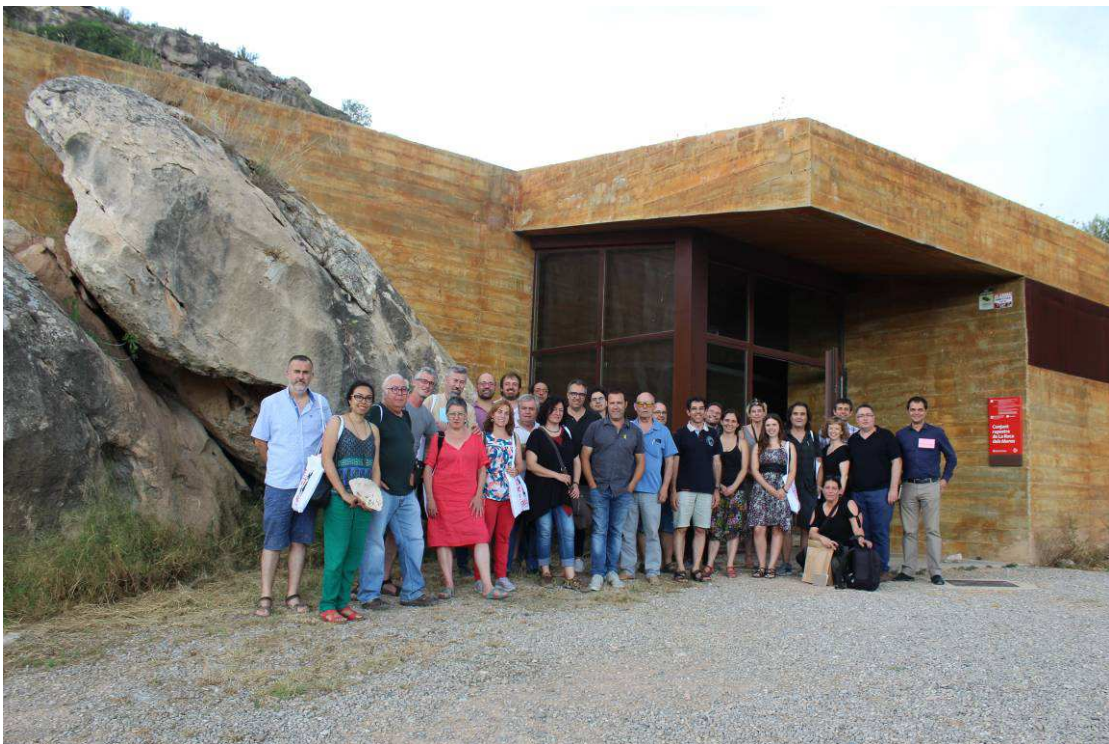
Fig 2. Alguns dels assistents a la III Reuni  de treball sobre experi ncies de planificaci  i gesti  del paisatge en l' mbit local de Catalunya.