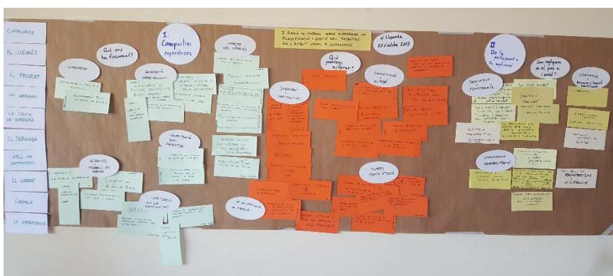
Fig 8. Panell final de posada en comú de les experiències