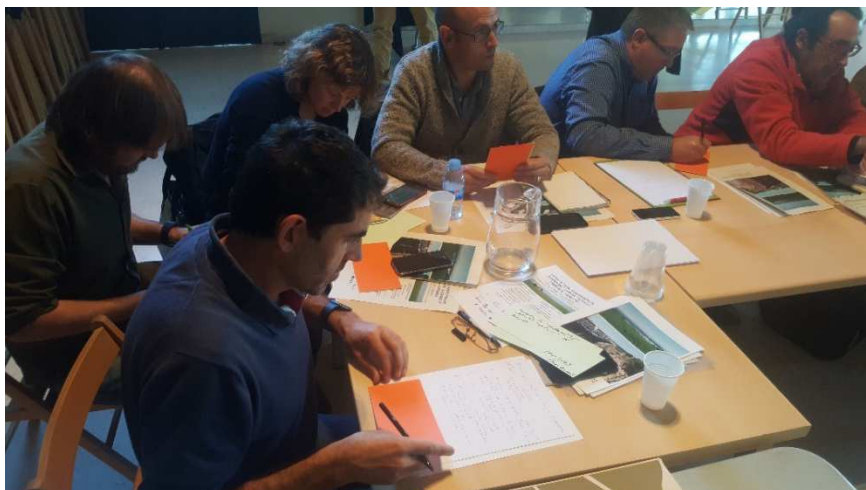
Fig 5. Assistents completant la pràctica de participació sobre quines experiències es podrien millorar.

En aquells casos en els quals la participació ha estat més "genuïna", s'ha detectat que cada vegada hi ha hagut més gent que ha volgut participar i donar la seva opinió.