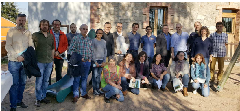
Fig 2. Assistents a la II reunió de treball