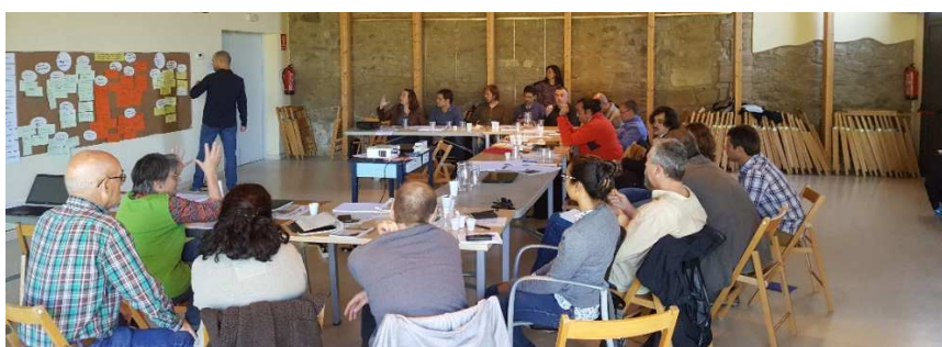
Fig 6 i 7. Posada en comú de les experiències en els processos participatius