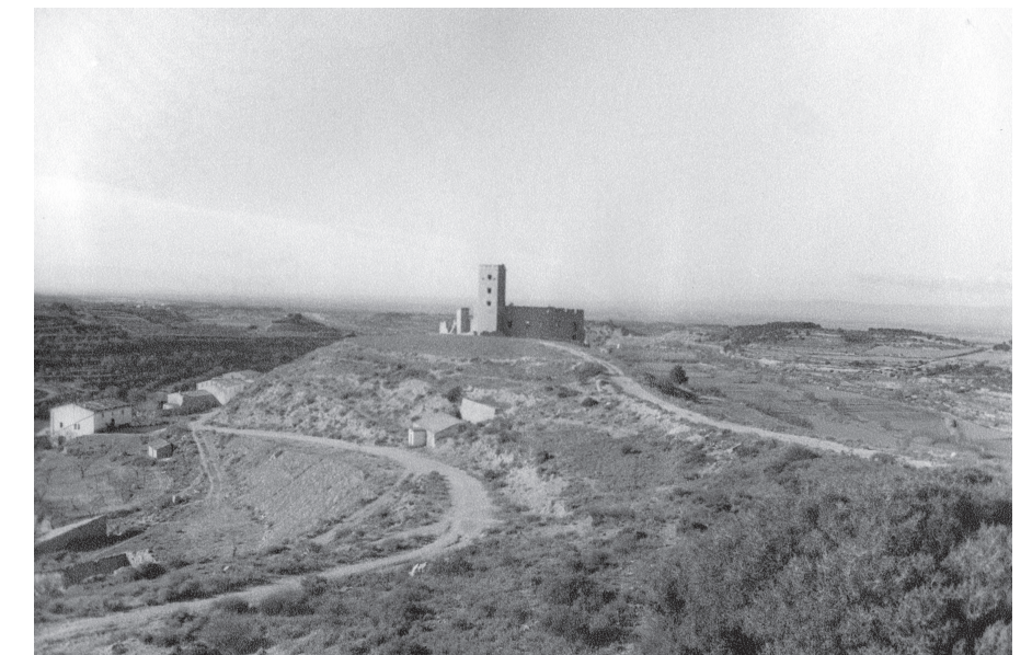
Figura 3.4: Vista exterior del castell de Ciutadilla (1980).

Durant els segles VI a III aC s'estableixen poblats amb una cultura ibèrica plenament desenvolupada. En algun punt intermediari entre aquesta unitat i la Plana d'Urgell degué haver-hi una certa diferència entre dos pobles ibèrics anomenats ilergets i lacetans, Tot i que possiblement els ilergets dominaren en algun moment tot aquest sector. Al llarg del curs del riu s'han trobat restes de cultura ibèrica a Rocafort de Vallbona, a la partida de Guardiola a Maldà, a Fogonussa, a Sant