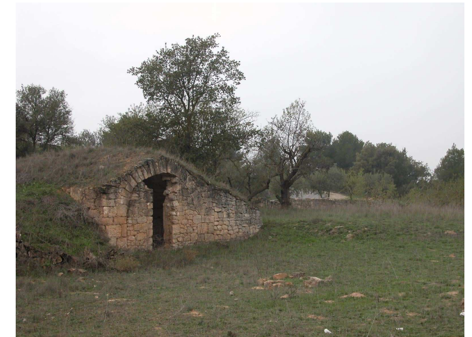
Figura 3.12: Cabana de mitja volta, prop de la carretera dels Omellons a Arbeca.

Les previsions de canvi climàtic disponibles fins a la data apunten que es produirà una disminució de les precipitacions, que afectarà els sistemes forestals existents a l'actualitat. Poden haver-hi desplaçaments altitudinals de la vegetació i canvis de composició florística a causa de la diferent capacitat de resposta hídrica i de regeneració després del foc.