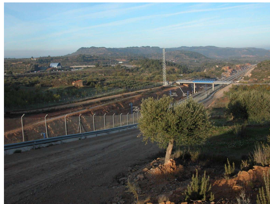
Figura 3.3: Via del TGV al seu pas pel terme de l'Albi. Panoràmica des del coster de les Forques amb el massís de Bessons al fons.

Les principals infraestructures de comunicació presents al territori travessen tangencialment la unitat. Paral·lelament al límit occidental es localitza en: l'AP-2, de Lleida a Barcelona; el ferrocarril de Lleida a Barcelona i la carretera N-240 de Lleida a Tarragona. A l'altre extrem de la unitat hi ha la carretera C-14, tram Tàrraga - Montblanc. La unitat és travessada per la línia del TGV, que ha suposat un impacte estètic i ecològic important en el paisatge (fig. 3.3).