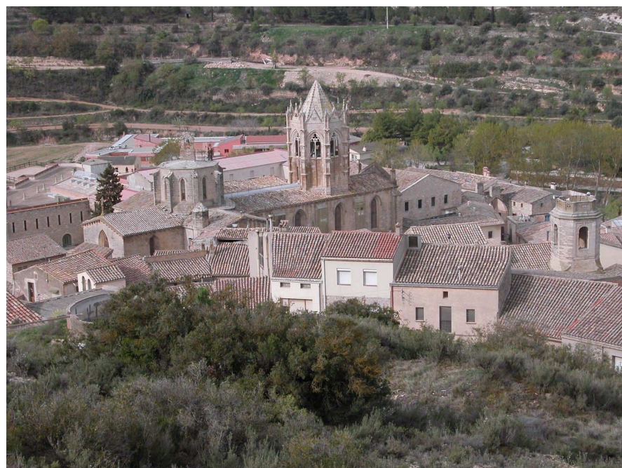
Figura 3.9. Monestir cistercenc de Vallbona de les Monges.

Les fortificacions presents a la unitat són el castell d'Albi, del segle XII; el castell de Vinaixa, que actualment tan sols conserva una torre semicircular sobre la roca; el castell de l'Espluga Calba, molt reformat, que es pot visitar; el castell de la Floresta, molt reformat al llarg del temps; el castell palau d'Arbeca, que va arribar a tenir cinc torres, però que actualment es troba en ruïnes; el castell de Maldà, del qual en resten parets mestres; el castell de Ciutadilla, una antiga fortalesa medieval que va ser transformada en palau renaixentista entre els segles XV i XVI; el castell de Guimerà, del qual tan sols resten ruïnes i una torre de guaita a la part alta de la població; el castell de Rocallaura,