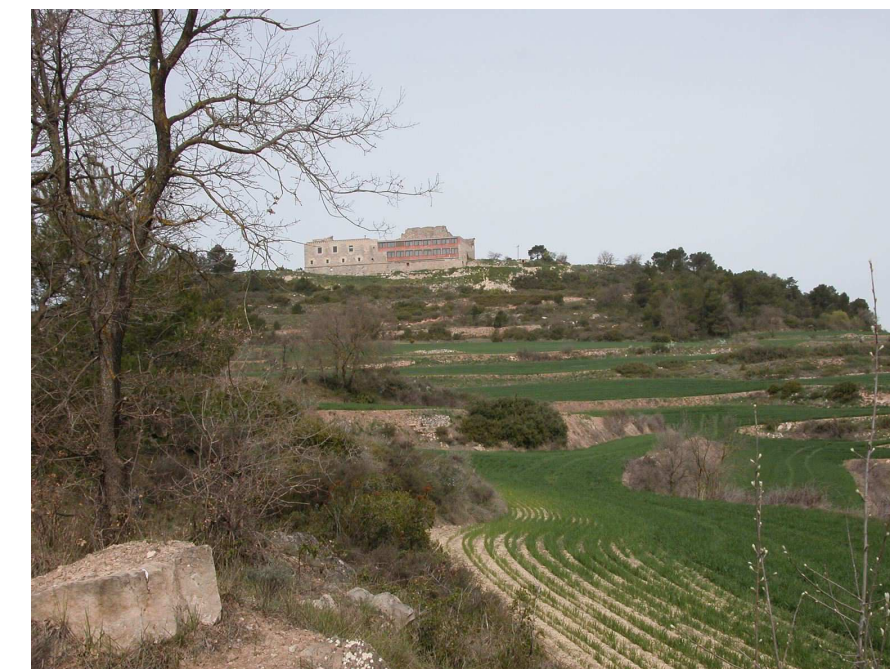
Figura 3.10. Santuari del Tallat, vist des del sud.

De fet, la serra del Tallat ha estat històricament lloc de pas de la Plana de l'Urgell al Camp de Tarragona, i encara té una forta identitat l'antic