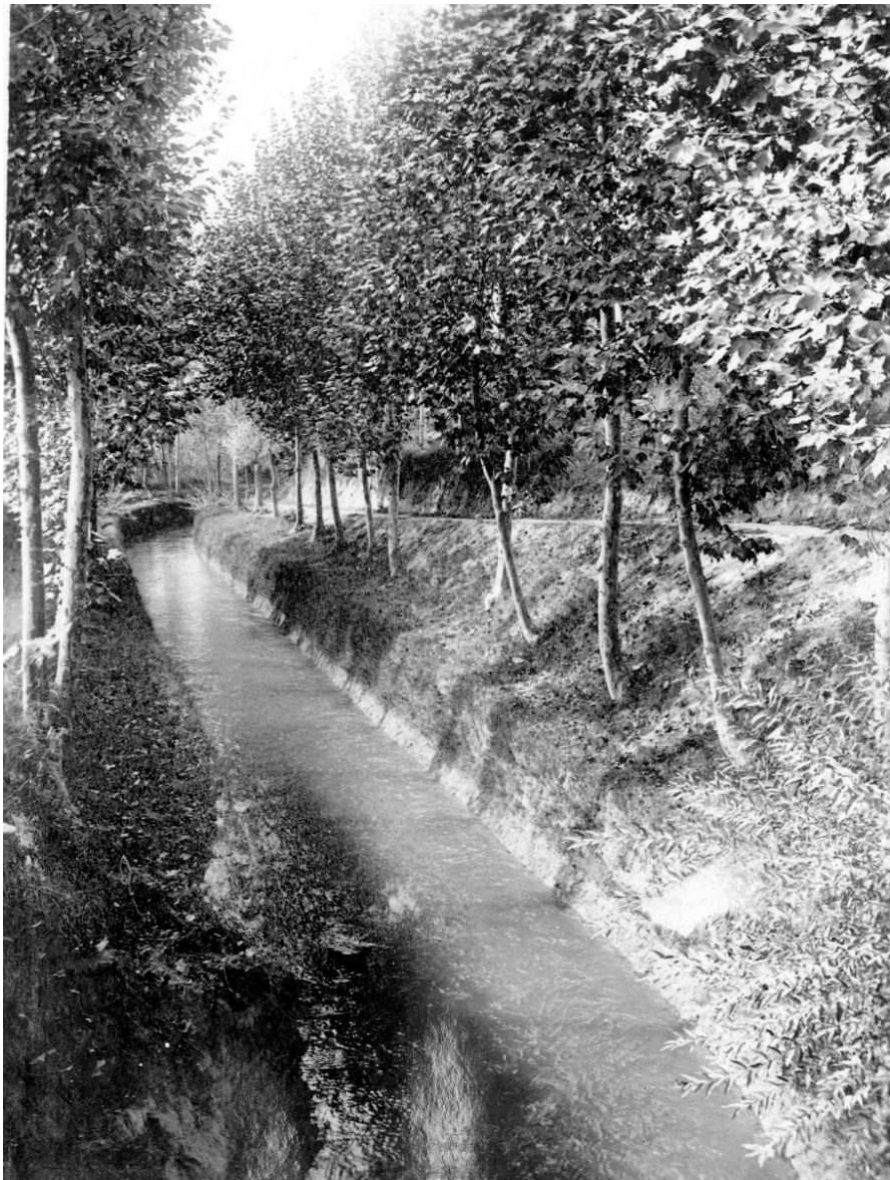
Figura 3.8. El canal d'Urgell que rega l'extrem nordoest de les Borges Blanques, en una imatge antiga on es pot copsar la conservació de la banquetta vora el canal.

algunes fotografies antigues d'aquesta unitat, com les de Ciutadilla (fig. 3.4) i les Borges Blanques (fig. 3.8) que es reproduïxen en aquest document