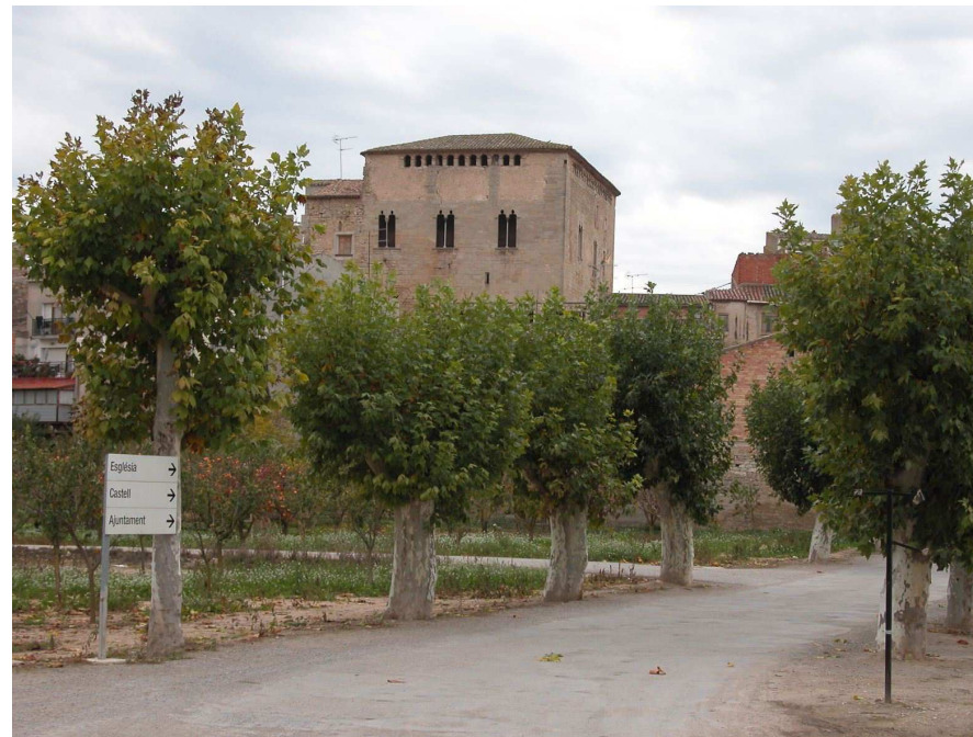
Figura 3.5: Imatge de l'interior del nucli de l'Espluga Calba

Un element del paisatge molt estès per tot aquest territori són les construccions de cabanes de volta, masos i murs de pedra seca, aixecats durant el segle XIX. Els murs foren imprescindibles per poder contenir l'erosió dels cultius abançats, terres guanyades al bosc i la bosquina en situació de fort pendent. D'aleshores ençà, els principals canvis que s'han produït en el territori responen al predomini d'un o altre cultiu (en diferents períodes: ametller, olivera i vinya), per bé que els darrers anys la implantació del reg de suport i l'aplanament de relleus suaus han comportat un seguit de noves transformacions amb fortes afectacions en el paisatge.