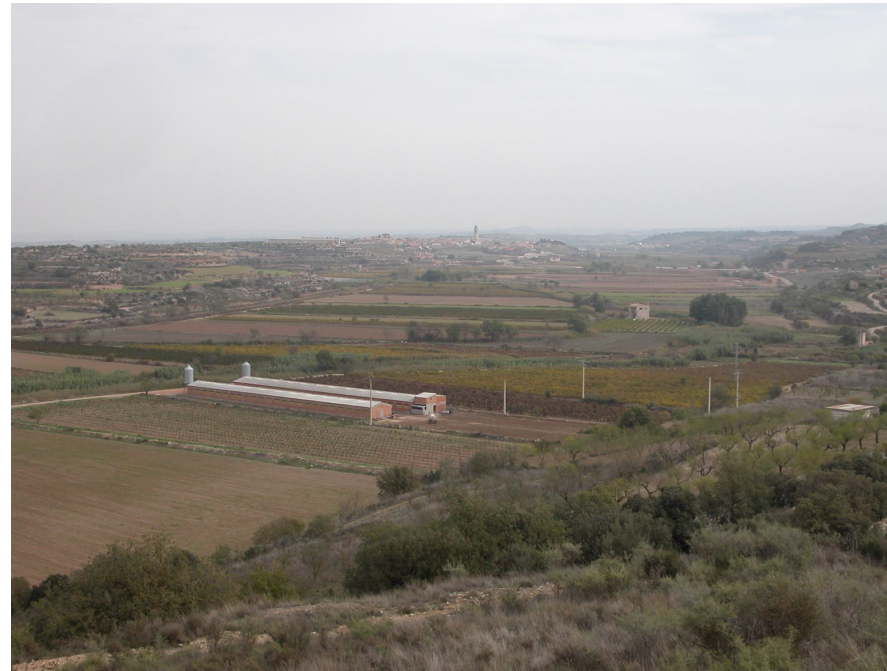
Figura 3.2.: Sant Martí de Maldà i la Vall del riu Corb, des de dalt del dipòsit de Belianes.

La vegetació és clarament mediterrània i pertany al domini potencial del carrascar continental ( Quercetum rotundifoliae ), per bé que en llocs enlairats, i a l'obaga, també es troba representada la roureda de roure de fulla petita ( Viola willkommii-Quercetum fagineae ), tot i que de forma fragmentària. Actualment les principals formacions vegetals que dominen el paisatge són les brolles termòfiles de romaní ( Rosmarino-Ericion ), ben caracteritzades per la presència de bruc d'hivern ( Erica multiflora ) i gatosa ( Ulex parviflorus ). En la major part del territori aquestes brolles presenten un estrat arbore de pi blanc ( Pinus halepensis ) força dens. D'altra banda, també hi trobem garrigues ( Quercetum cocciferae ). El carrascar és poc extens, restringit als llocs enlairats i no aptes per al cultiu. A les obagues és freqüent trobar-hi petits retalls d'alzinar litoral ( Viburno tini-Quercetum ilicis ), representat per l'alzina ( Quercus ilex subsp. ilex ), i sobretot per les seves espècies acompanyants: arboç ( Arbutus unedo ), marfull ( Viburnum tinus ), galzeran ( Ruscus aculeatus ), etc.