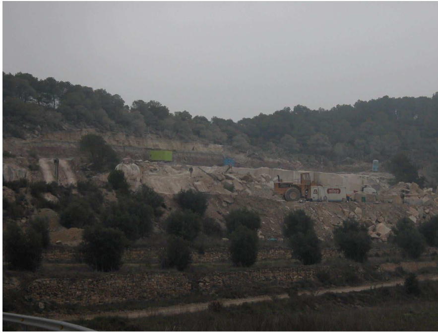
Figura 3.11: Pedrera al terme de Maldà, Prop de la carretera d'Espluga Calba a Maldà.

També es consideren altament fràgils visualment els trams directament exposats des de l'autopista AP-2, que són, a més, els paisatges que haurien de transmetre de forma preferent la riquesa paisatgística d'aquesta unitat.