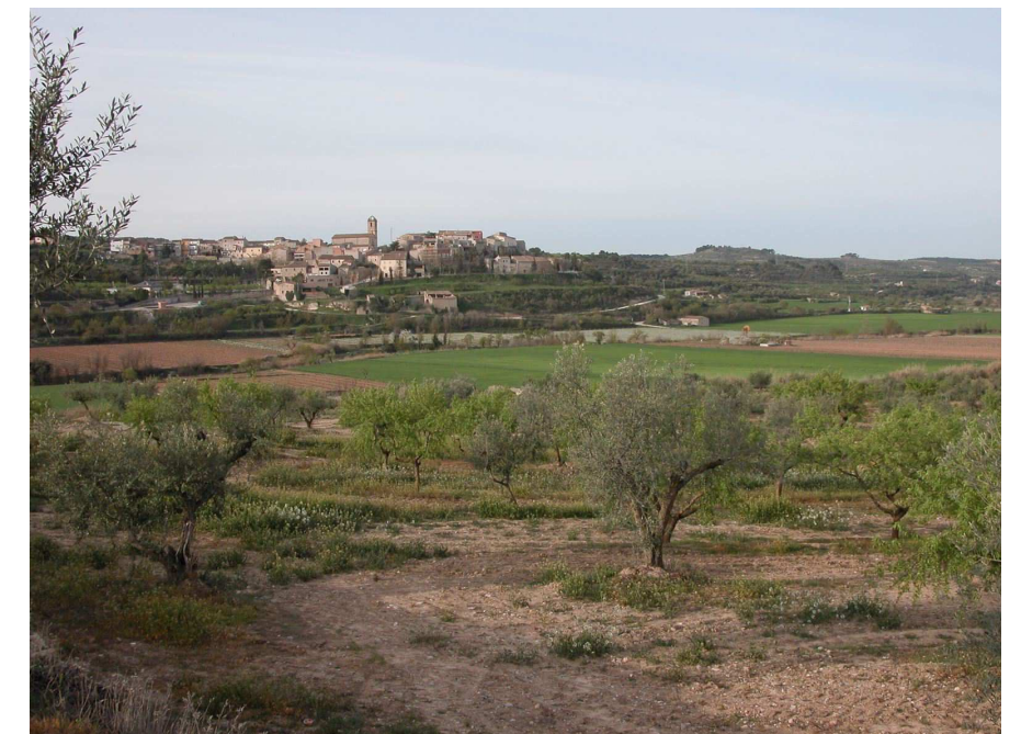
Figura 3.8: Nalec rodejat per un paisatge de fruiters de secà.

L'extrem meridional de la unitat és majoritàriament forestal, sobretot a les parts més elevades, i està caracteritzat – al solell – per les pinedes de pi blanc i els matolls, i – a l'obaga – per les pinedes de pinassa, claps de roure de fulla petita i alguna alzina als obacs i als altiplans. Aquesta organització del paisatge s'aconsegueix amb rotunditat al sector de Senan, al Camp de Tarragona, però mostra més heterogeneïtat per la presència d'altres elements al territori pertanyent a les Terres de Lleida.