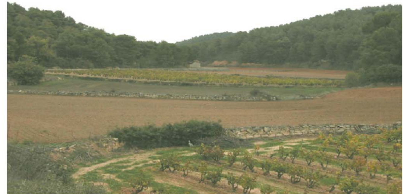
Figura 3.1: Paisatge a la vora dels Omells de na Gaia.