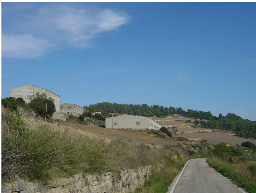
Figura 2.9. Tot i que la unitat manté encara en bona mesura un mosaic paisatgístic tradicional, en certs punts proliferen alguns equipaments agrícoles i algunes granges poc integrats en l'entorn. A dalt, alguns equipaments agrícoles a l'est d'Albió (municipi de Llorac).

certa periodicitat, agreujats per la vegetació herbàcia i arbustiva, a més de pels boscos de pi blanc, de caràcter piròfit. Com a elements positius s'ha d'esmentar el paper de tallafocs naturals dels camps -tot i que mentre hi ha el rostoll poden conduir també les flames- i la conseqüent fragmentació de les masses de bosc. També la facilitat d'accés a la major part del territori gràcies a les nombroses pistes forestals i pistes d'accés a les finques. Per altra banda, la facilitat per accedir a les muntanyes també pot afavorir un augment del nombre d'incendis d'origen antròpic.