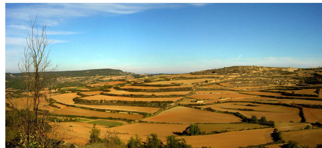
Figura 2.1. Al nord de Forès s'estén la zona agrícola de Los Solans, on els camps aprofiten el suau pendent que culmina en el nucli del municipi, dotant el paratge d'una innegable vàlua escènica.