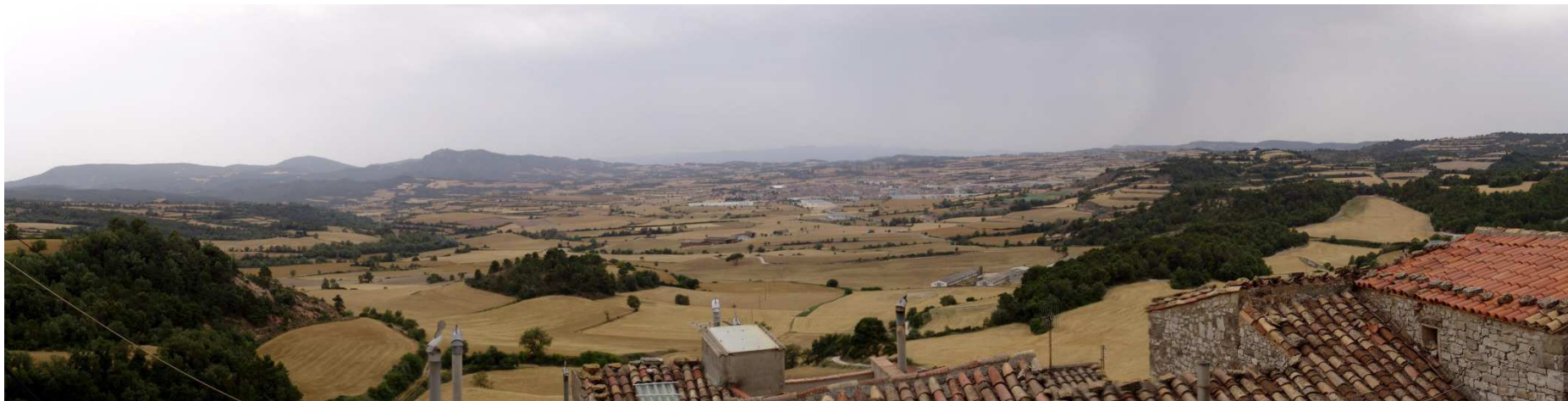
Figura 2.4. Santa Coloma de Queralt des de l'Aguiló. Al llarg de la Baixa Segarra hi ha una sèrie de planes on s'estenen importants zones agrícoles, essent la conca de Santa Coloma de Queralt la més important. A la meitat oest de la unitat la seva presència és més reduïda, condicionada per una orografia més irregular.

sobretot en els terrenys més baixos i més assolellats. Sol estar constituïda per brolles calcícoles de romaní ( Rosmarinus officinalis ).