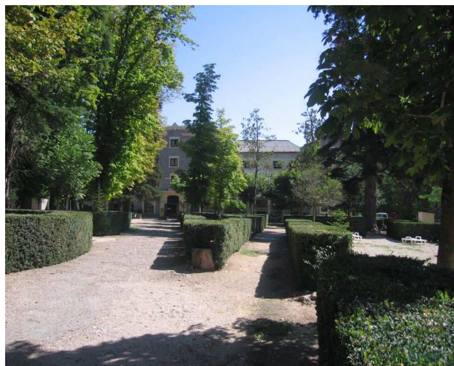
Figura 2.8. Balneari de Vallfogona.

L'activitat turística té un punt d'interès des de fa almenys un segle al Balneari de Vallfogona. Això fa que, després de l'agricultura, el turisme sigui l'activitat econòmica que més rendes genera, tant per la presència del balneari com d'un hotel especialitzat, a més d'un conjunt de segones residències i apartaments de lloguer. L'activitat es concentra en els mesos d'estiu però, cada cop més, es reben també força visitants per les vacances de Setmana Santa i els caps de setmana del bon temps. També cal esmentar el centre nudista de Fonoll (Passanant), tot i que actualment la seva situació encara no està regulada. Destaquen també diversos punts d'interès històric i artístic a Santa Coloma, tot i que no ha generat gaire dinamisme turístic, si s'exceptua algun restaurant i l'obertura d'un hotel. A la resta del territori, tot i que l'ambient rural, amb evidents atractius paisatgístics i patrimonials, podria permetre una major explotació del turisme, el desenvolupament és molt limitat, amb un càmping a Segura, una casa de colònies a les Piles i algunes cases rurals. L'hivern és dur i amb boires freqüents, fet que dificulta el turisme, però la resta de l'any ofereix sens dubte un condicionant climàtic prou bo com per a permetre una activitat força més desenvolupada.