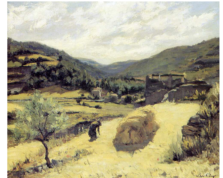
Figura 2.6. Pintura del paisatge de l'entorn de Vallfogona de Riucorb a principis de la dècada de 1930. Autor: Joan Vila-Puig (1933).

La vall del Corb disposa de diverses publicacions de tipus guia que són d'interès per les fotografies i els textos dirigits als visitants. Els valors remarcats són: el paisatge rural poc artificialitzat, que combina diversos tipus de conreu i boscos; els elements històrics (castells, esglésies); l'arquitectura medieval de pedra i, en algun cas, els elements de pedra seca; els pobles de «marca»; els elements medievals de la vila de Santa Coloma de Queralt (església, castell, Santa Maria de Bell-lloc, call jueu, portals); el balneari de Vallfogona; els molins antics i l'alimentació artesana.