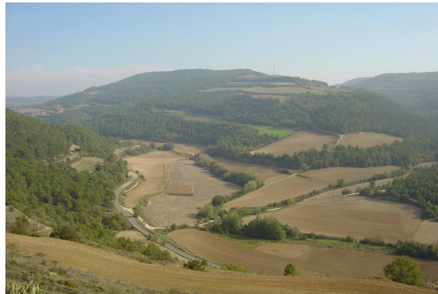
Figura 2.3. Paisatge agroforestal a l'est d'Albió. A l'extrem nord de la unitat, a la vall alta del riu Corb, la orografia és més irregular, propiciant una major presència de vegetació espontània.

L'estructura del relleu i el modelat posterior efectuat pels agents erosius (el riu Gaià i el riu Corb principalment), ha condicionat la configuració d'una divisòria d'aigües que segueix la ruptura de pendent, des de l'extrem oriental de la serra del Tallat passant per les elevacions de la Faneca i de les Forques (a ponent de Forès) fins a Rauric i el turó del Montfred, ja en el límit amb la comarca de la Segarra. Al nord d'aquesta línia divisòria s'inicia un territori d'altiplans lleugerament inclinats cap el sud-oest, on la xarxa hidrogràfica del riu Corb s'hi ha encaixat fins a obrir un conjunt de valls estretes a l'alçada de Vallfogona de Riucorb. Al sud, el treball erosiu del riu Gaià ha excavat una petita conca d'erosió al fons de la qual s'emplaça el poble de Santa Coloma de Queralt, el principal nucli de la Baixa Segarra. Encara hi ha una petita àrea, al nord del poble d'Aguiló, que és drenada per la riera de Clariana, tributària del riu Anoia.