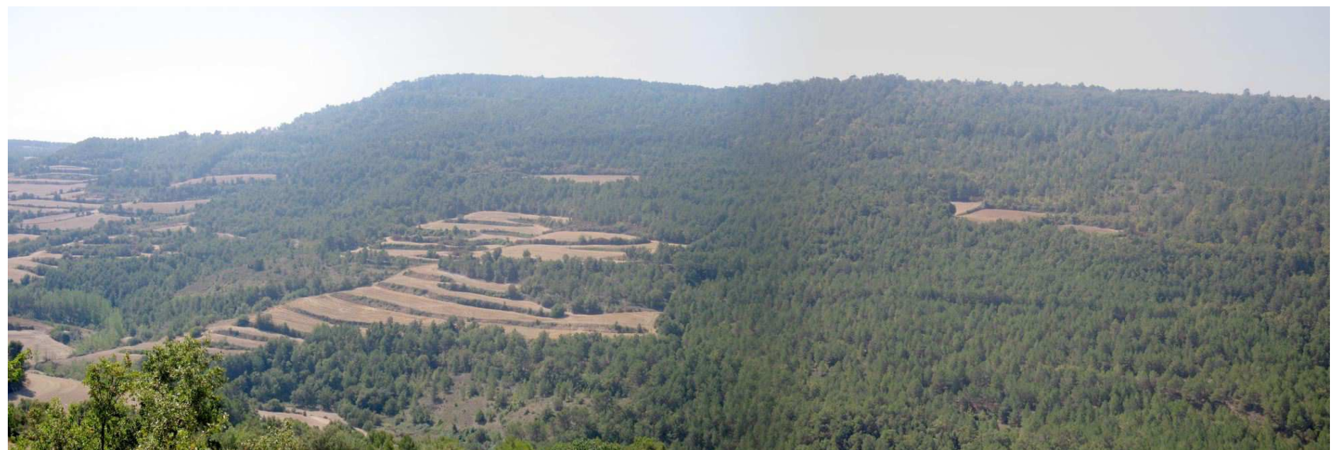
Figura 2.7. Tot i el domini dels conreus herbacis, al voltant del riu Corb la vegetació espontània s'estenen algunes importants masses forestals.

El cas de Santa Coloma és diferent, ja que constitueix una vila relativament gran en un entorn de nuclis de molt petita dimensió. Tot i que els afores de la vila, especialment al llarg de la C-241, estan força descuidats pel que fa a la imatge, l'interior té zones i punts de gran valor estètic, com ara els entorns de l'església, el barri jueu o els voltants de la plaça Major.