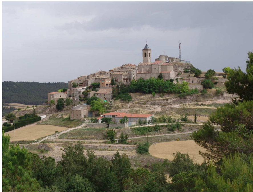
Figura 2.5. Vista general de l'Aguiló (municipi de Santa Coloma de Queralt). Bona part de la població s'ha establert tradicionalment en els punts més elevats del territori. Nuclis com l'Aguiló, Forès, Rauric, Llorac o Cirera són bons exemples del fenomen.

El poblament es concentra en nuclis compactes i de dimensions reduïdes. El seu emplaçament respon a lògiques diverses. Des de pobles que es localitzen en punts elevats com Forès, la Cirera, l'Aguiló o Passanant, seguint en bona mesura estratègies defensives d'èpoques pretèrites, fins a nuclis que se situen a les planes i que, actualment, a causa de la millor accessibilitat, són els que aglutinen la població de la unitat, especialment Santa Coloma de Queralt. Alguns pobles, com és el cas de Forès i l'Aguiló, emplaçats en punts prominents, són magnífiques talaies que ofereixen a l'observador extenses panoràmiques sobre el mosaic agroforestal.