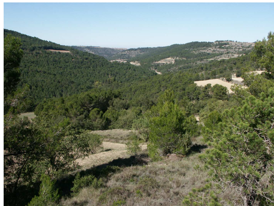
Figura 2.2. En les immediacions de Vallfogona de Riucorb la xarxa fluvial ha obert estretes i profundes valls. Boscos de pinassa i de pi blanc recobreixen densament les obagues.

El relleu està modelat en materials sedimentaris de l'Oligocè que, a la vora sud de la conca de Santa Coloma de Queralt, estan basculats cap el nord-oest, a causa de l'aixecament del bloc de Gaià. En aquest sector hi predominen conglomerats, gresos i margues de colors rogencs, que són substituïts per calcàries detrítiques, margues i gresos groguencs d'origen lacustre tant en el centre de la conca com en els altiplans del sector de Conesa. Predominen els materials poc resistents que han estat rebaixats per l'acció de les aigües corrents, deixant a la vista els materials carbonatats més compactes, que coronen turons com el de Forès i conformen els fronts d'algunes costes.