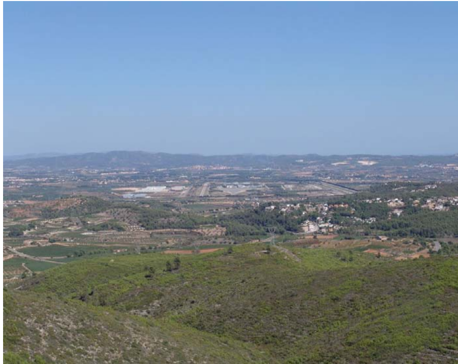
Figura 27.3. El paisatge de l'extrem meridional de la plana del Baix Penedès està caracteritzat per la presència d'usos del sòl diversos. S'observa, en primer terme, el circuit de proves per a automòbils de l'Albornar i algunes urbanitzacions. Al fons, el poble de l'Arboç i les taques blanques de dues pedreres.