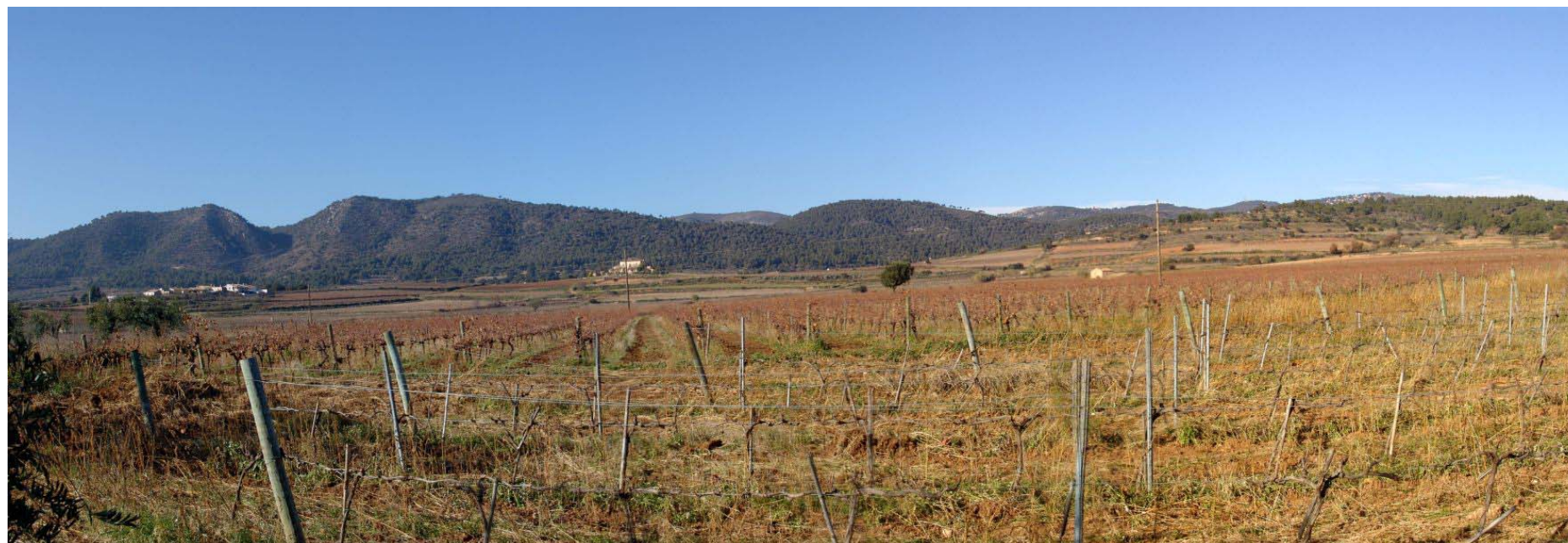
Figura 27.2. Tot i els importants canvis que han transformat la plana els darrers decennis, en alguns racons el paisatge conserva encara el caràcter agrícola tradicional. A la imatge, zona de cultiu de la vinya entre Torregassa i Sant Jaume dels Domenys, al sector de contacte entre la plana i el Montmell.

Els cultius tradicionals de la Plana del Baix Penedès havien estat els característics de la trilogia mediterrània (blat, vinya i olivera) almenys fins la meitat del segle XIX, quan es començà a imposar el monoconreu de la vinya. Els pobles, petits i compactes, quedaven engolits per aquest paisatge agrícola. Amb la crisi provocada per la fil·loxera la zona va viure unes dècades de regressió poblacional, així com també agrícola,