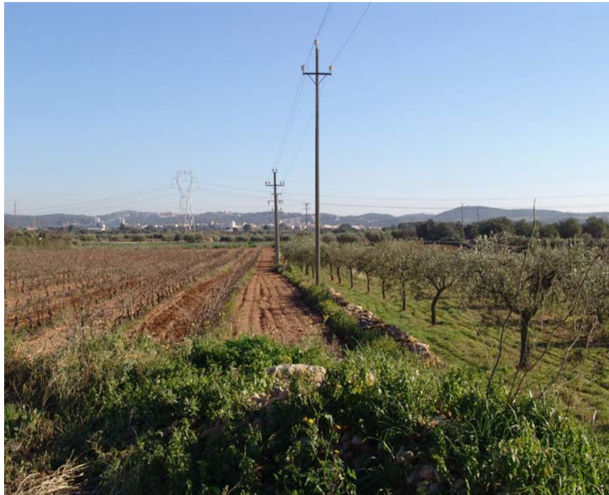
Figura 27.5. Tot i que sovint no hi parem esment, l'impacte, tant ambiental com paisatgístic de les línies elèctriques és important a molts punts de la plana.

L'eix de l'AP-7 i l'AP-2 afavoreix que els polígons industrials se situïn al mig de la Plana, fet que pot fer incrementar la població dels pobles i les urbanitzacions situades al voltant.