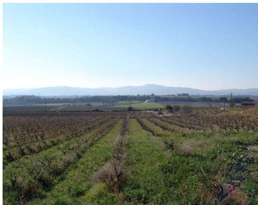
Figura 27.4. Lletger (a Sant Jaume dels Domenys) és un dels espais on l'agricultura gaudeix d'una major presència, configurant un mosaic paisatgístic que connecta amb el de l'Alt Penedès.

Per desplaçar-se amb cotxe es recomanen els trams de carretera que uneixen els pobles de la Bisbal del Penedès, Sant Jaume dels Domenys, Llorenç del Penedès, Banyeres del Penedès i l'Arboç. (T-240, TV-2122, i TP-2124).