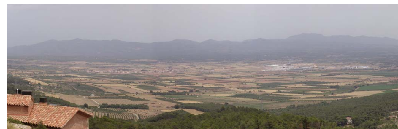
Figura 22.1. Panoràmica de la Plana de l'Alt Camp des de la serra de Miramar. Destaca enmig de la gran superfície de conreu el polígon industrial del Pla de Santa Maria.