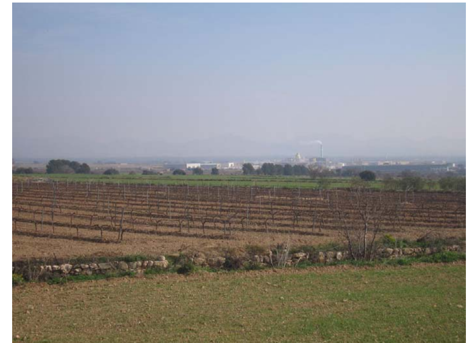
Figura 22.3. Paisatge agrícola dels voltants del Pla de Santa Maria distorsionat per la presència d'un polígon industrial.

de brolla. Al paratge de Sortanelles, al sud de Figuerola del Camp, hi resta un petit alzinar en la confluència de dos torrents que és una mostra del tipus de bosc que devia ocupar la plana abans de la seva transformació agrícola. Els boscos més extensos es troben en els vessants de la serra de Miramar: pinedes de pi blanc i alzinars. La vegetació de ribera ha estat molt malmesa per l'extensió dels conreus fins la mateixa riba dels torrents i només es troben fragments de salzedes i alguns arbres de ribera (pollancre i àlbers) en punts esparsos com en el torrent de Bogatell. A la zona humida del Camí de Valls hi ha canyissars, i al Clot de la Barquera, entre la Secuita i Vistabella, hi ha bogars i canyissars.