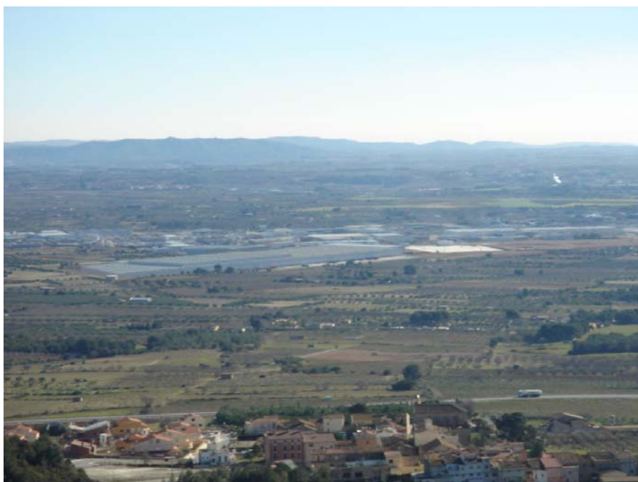
Figura 22.10. El gran polígon industrial de Valls té un impacte visual notable en les vistes de la Plana de l'Alt Camp des de punts elevats com des de sobre Fontscaldes.

Al sector central, si es mantenen les tendències del sector agrari actualment en crisi, és de preveure una ocupació progressiva del sòl amb polígons industrials, per ampliació dels actuals o per creació de nous, així com un creixement dels nuclis urbans captaran població procedent de l'àmbit de Reus-Tarragona.