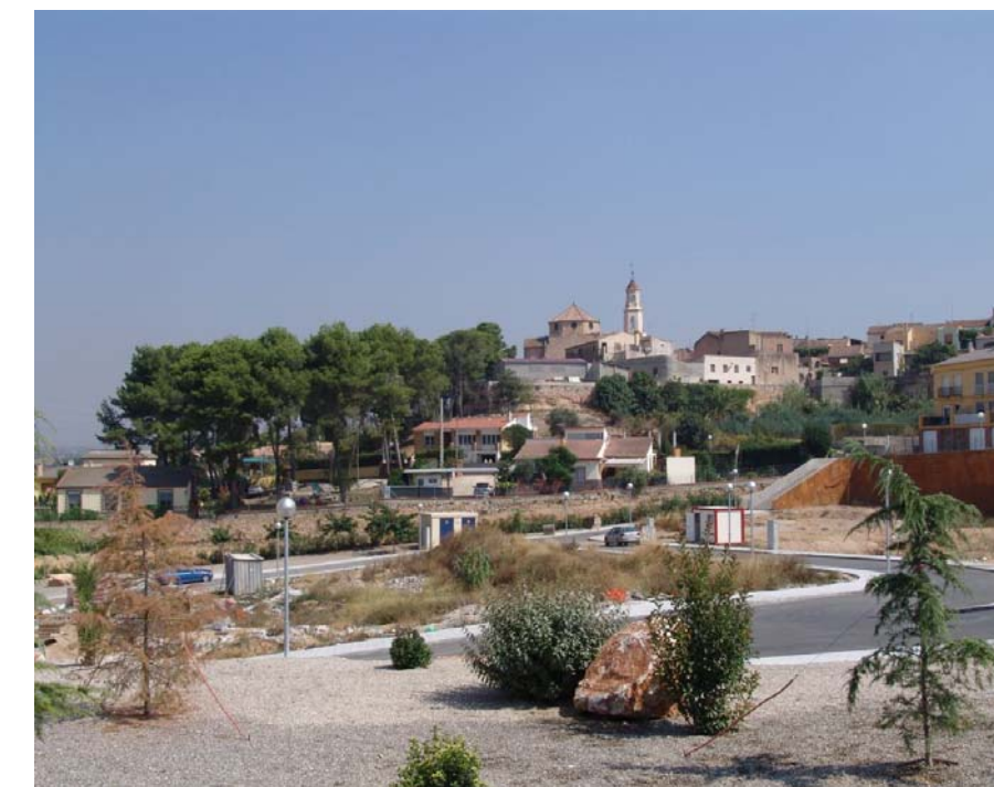
Figura 22.7. Nucli de Puigpelat.

Des del punt de vista dels valors religiosos i espirituals destaca que aquest lloc es troba dins de la zona d'influència de la ruta del Císter, sent zona de pas per la gent que va a Poblet des de Santes Creus i a la inversa.