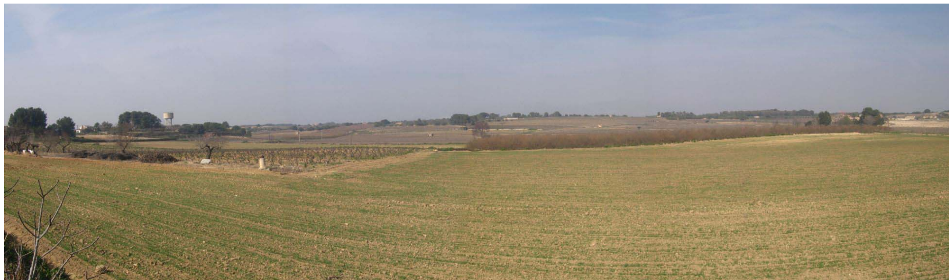
Figura 22.2. Entre Nulles i Bràfim el paisatge agrari està constituït per un mosaic de conreus entre els que destaquen els cereals d'hivern, la vinya, l'avellaner.

La vegetació espontània ha estat desplaçada pels conreus en la major part de la plana. Només en els petits tossals i suaus elevacions del sector nord-est hi ha pinedes de pi blanc en mosaic amb la vegetació