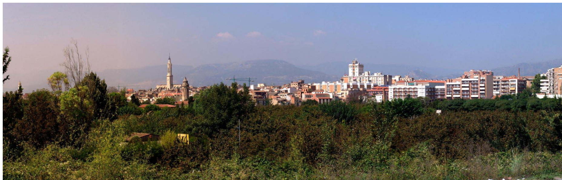
Figura 22.6. Vista general de Valls desde la perifèria de la ciutat.