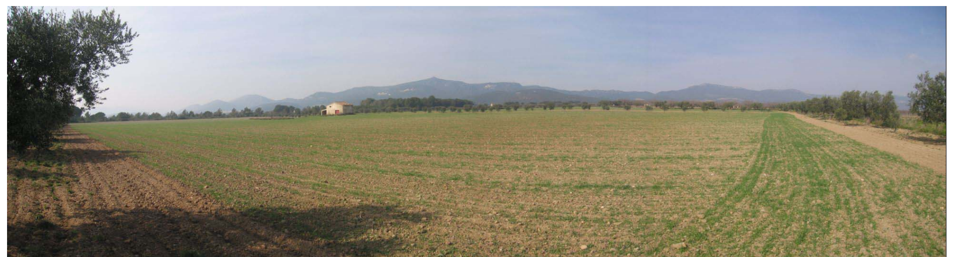
Figura 22.5. Al sector nord de la Plana de l'Alt Camp hi predomina el conreu dels cereals d'hivern. Les parcel·les sovint estan delimitades per files d'oliveres.

En l'actualitat escriptors com Joan Barril o fotògrafs com Toni Vila estan deixant registre escrit, fotogràfic i pictòric dels paisatges de la zona, testimonis d'un present que ens expliquen molt del passat i que ens fixen la imatge que hauria de perdurar en el futur.