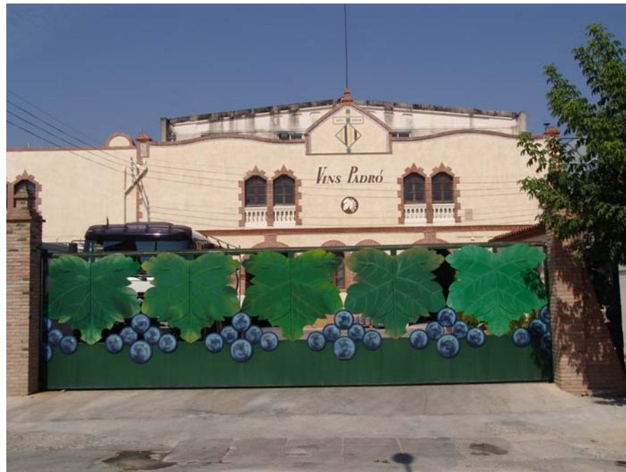
Figura 22.8. Façana d'un celler modernista a Bràfim.

Cogulla (789 m) i el Tossal Gros (867 m.): són miradors privilegiats per la seva alçada, i en el cas de la Cogulla, per la facilitat d'accés ja que s'hi pot arribar en cotxe en els períodes que no hi ha restriccions de trànsit. Panoràmica de 360° sobre la Plana de l'Alt Camp, les Muntanyes de Prades, la Conca de Barberà, Serres d'Ancosa, Montagut, Montmell, etc.