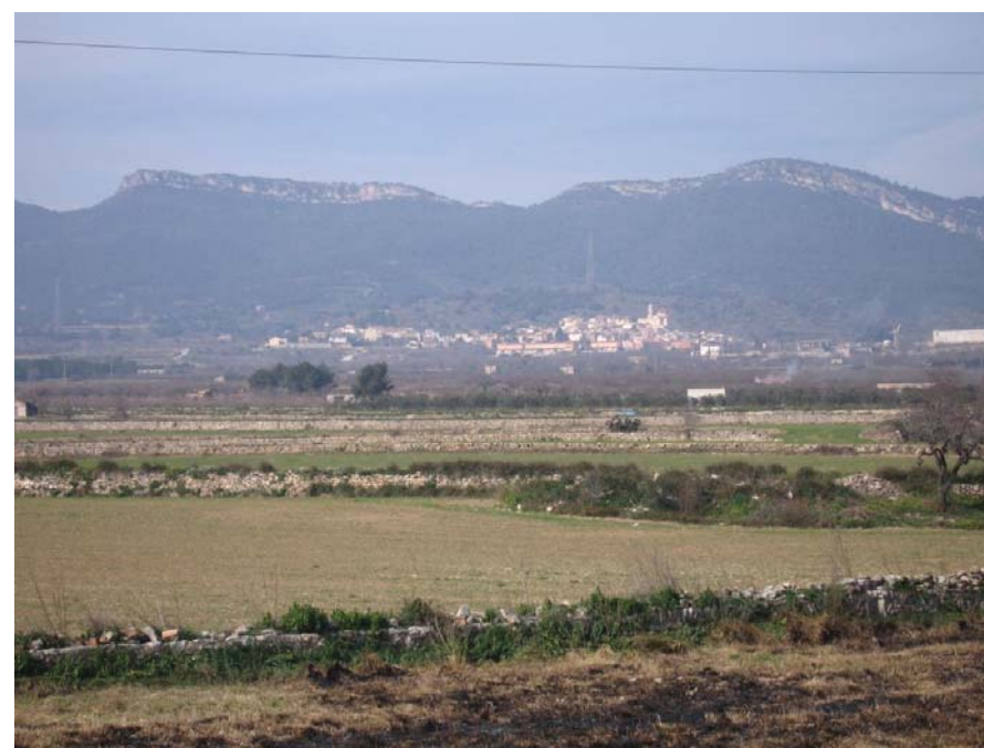
Figura 22.4. A Figuerola del Camp es cultiven avellaners als camps més propers al poble i cereals d'hivern als camps situats als sectors més baixos. S'observa com les parcel·les estan delimitades per murs baixos de pedra seca.

Les característiques físiques i climàtiques de la serra de Miramar no han afavorit la seva explotació agrària però sí les activitats vinculades a l'explotació ramadera i forestal. Tot i això, les zones més baixes del sector, i gràcies a les correccions dels pendents produïdes per la construcció de marges de pedra seca, molt abundants a la zona més occidental, va permetre la presència de cultius com l'olivera i l'avellaner. En aquest subsector del territori el paisatge ha anat evolucionant des del caracteritzat per masses boscoses empobrides i conreus ubicats als peus de la serra, propi del segle XIX i primer quart del segle XX, fins