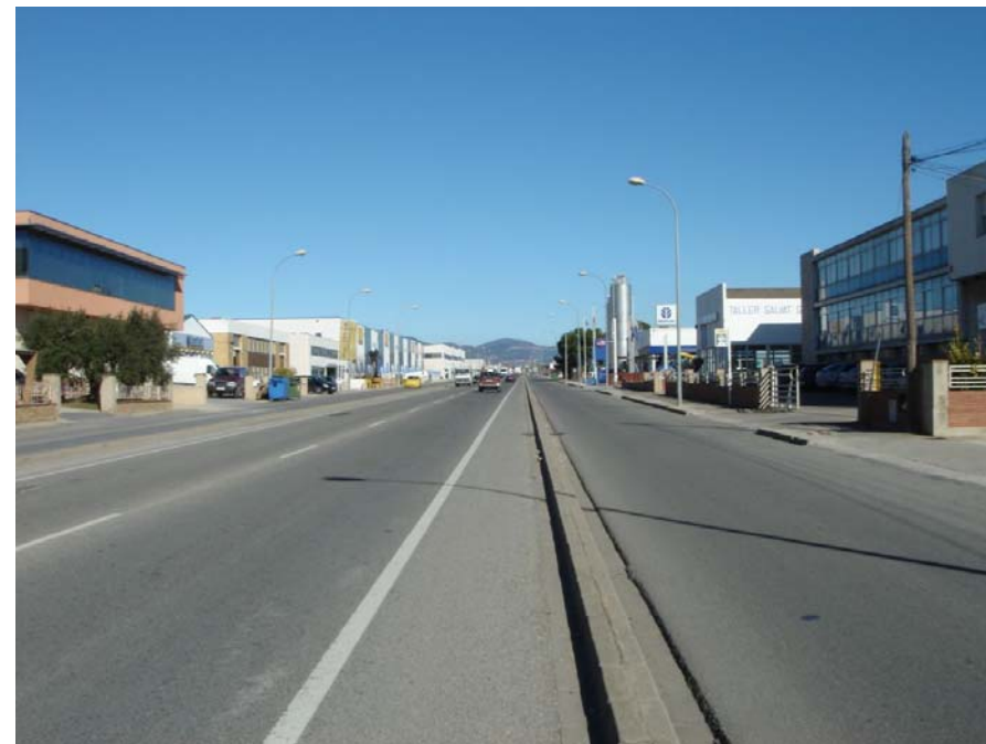
Figura 22.9. La carretera de Valls al Pla de Santa Maria travessa un gran polígon industrial en el que s'observa la disparitat de tipologies constructives, tipus de cobertes i criteris cromàtics pròpia de la majoria de polígons industrials.

- El fet de representar una àrea estratègica dins de la zona del Camp de Tarragona i la seva connexió amb els corredors que es dirigeixen