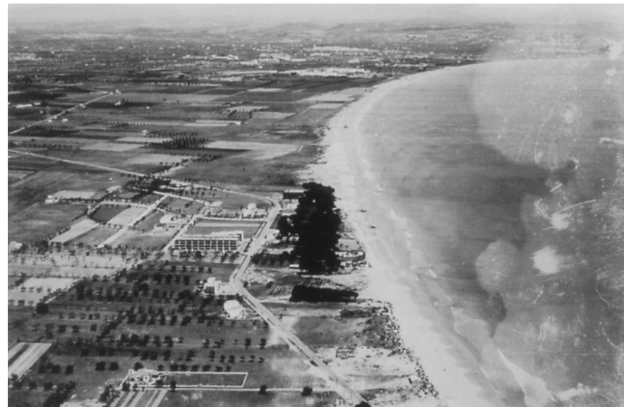
Figura 20.5. La platja de la Pineda a l'inici dels anys 60. S'observa una pineda plantada sobre unes dunes, arran de costa, un hotel i l'àrea agrícola articulada en torn a la Sèquia Major.

implantació de la indústria va impulsar el creixement residencial tant a Reus com a Tarragona, així com a altres pobles i viles (Vila-seca, Constantí, La Canonja), per l'arribada massiva de contingents procedents de l'èxode rural de les comarques veïnes.