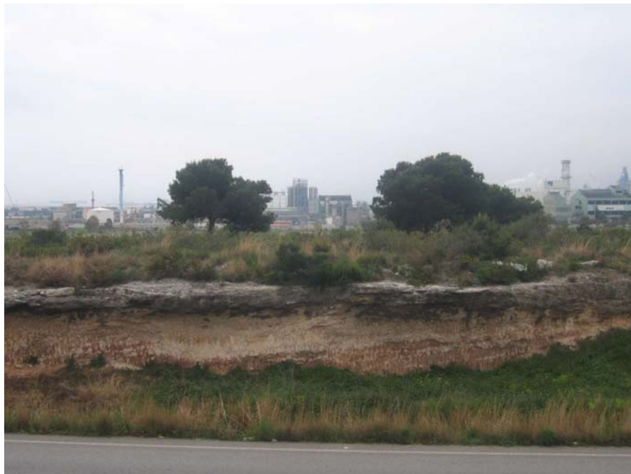
Figura 20.2. La vegetació espontània, molt degradada i malmesa, es refugia al cim dels petits turons que han restat al marge de l'expansió de la ciutat i dels polígons industrials.

A llevant del riu Francolí, s'aixeca un sector montuós on es localitza la ciutat de Tarragona. El nucli antic de la ciutat està emplaçat sobre un petit turó calcari que forma part d'un apèndix dels materials calcaris i margoargilosos mesozoics que a partir del Montmell segueixen una direcció nord-est cap a sud-oest. Continuen pel massís de Bonastre i s'enfonsen sota els sediments miocènics vora el Gaià, per aflorar de nou en els pujols dels Ermitans (90 m), del Llorito (120 m) i de l'ermita de la Salut (45 m) i una altra vegada al cap de Salou, lloc de contacte amb el mar.