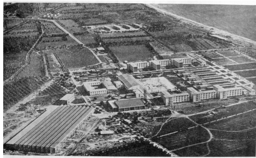
Figura 20.7. El paisatge de l'entorn de la Universitat Laboral, a finals dels anys 50. El centre, inaugurat el 1956, va formar ma d'obra especialitzada per a la indústria emergent.