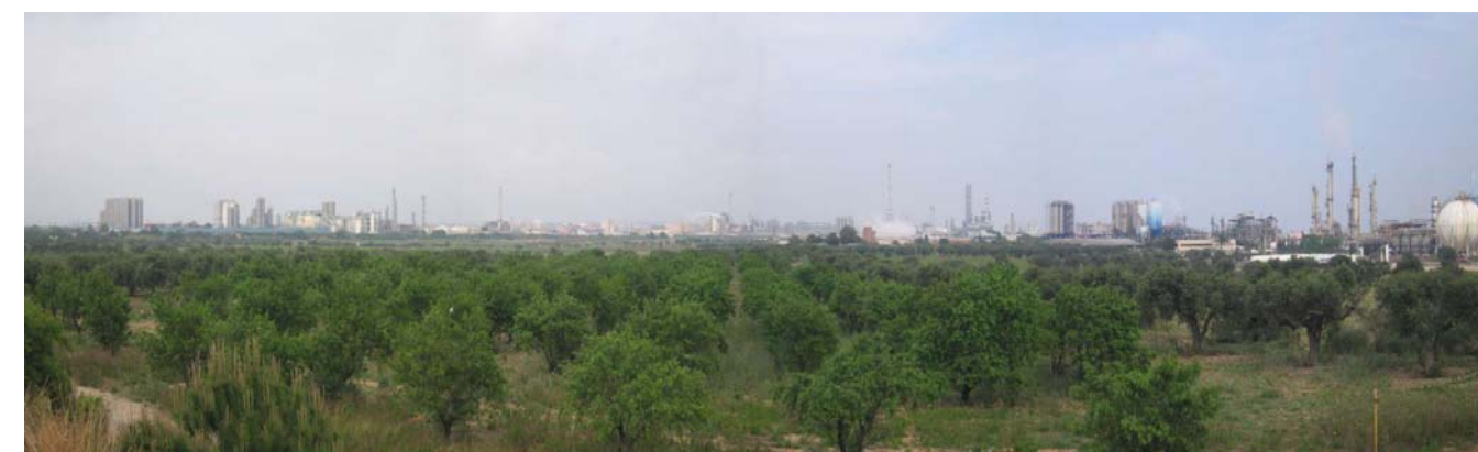
Figura 20.1. El paisatge agrícola original de la plana ha estat substituït per l'expansió de la indústria petroquímica.