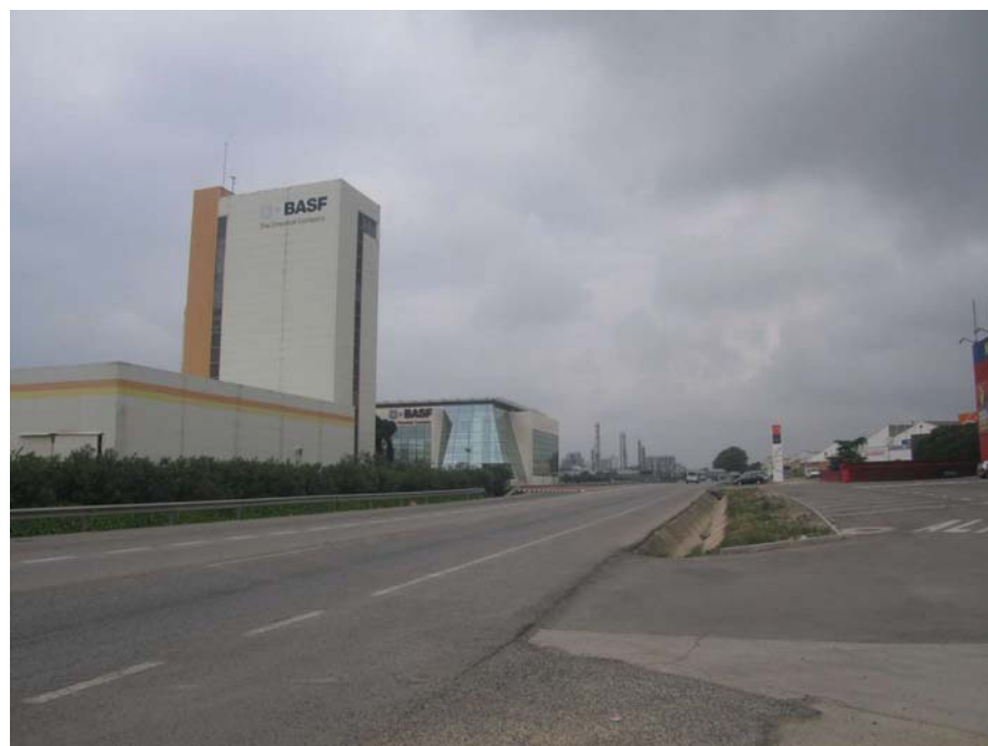
Figura 20.6. La indústria petroquímica és un element característic del paisatge de Reus-Tarragona.

En general, doncs, es pot contemplar una unitat de paisatge que aparentment presenta un aspecte desendreçat, però que internament conté fragments encara prou ben estructurats i que mereixen una atenció especial si no es vol que acabin sucumbint a l'ocupació urbana i infraestructural.