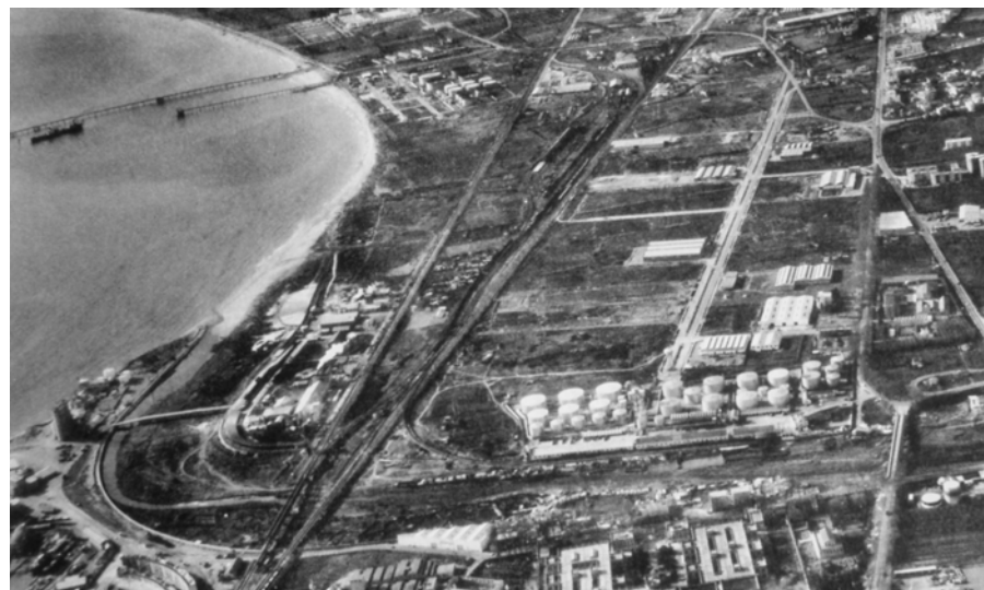
Figura 20.4. Imatge dels anys 60 del segle passat en que s'observa el desenvolupament de la indústria química i petroquímica al polígon industrial Francoí.

A partir de l'any 1950 es van iniciar un seguit d'actuacions expansives que van configurar la base dels paisatges actuals. El procés industrialitzador i la construcció de les noves infraestructures viàries van iniciar un procés de transformació paisatgística intens i continuat en el temps. Primer van ser les grans indústries químiques aparegudes seguint l'eix de la carretera N-340, entre la ciutat de Tarragona i Vila-seca. La gran indústria va portar associat un creixement urbanístic en forma de barris residencials adjacents (Bonavista, Torreforta, Camp Clar), i polígons industrials de suport a la indústria química, que ressegueixen els eixos viaris en direcció a Vila-seca i a Salou. La