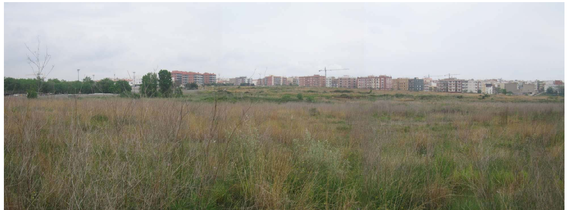
Figura 20.8. El creixement de l'espai urbanitzat a la perifèria de les ciutats deixa espais oberts intersticials com aquest erm entre Bonavista i la Canonja.

Un altre punt d'observació de la unitat és el Cap de Salou, que des del sud en dona una perspectiva de tota la costa de la unitat, així com del mediterrani, de la unitat veïna del Litoral del Camp, i de la costa Daurada en general.