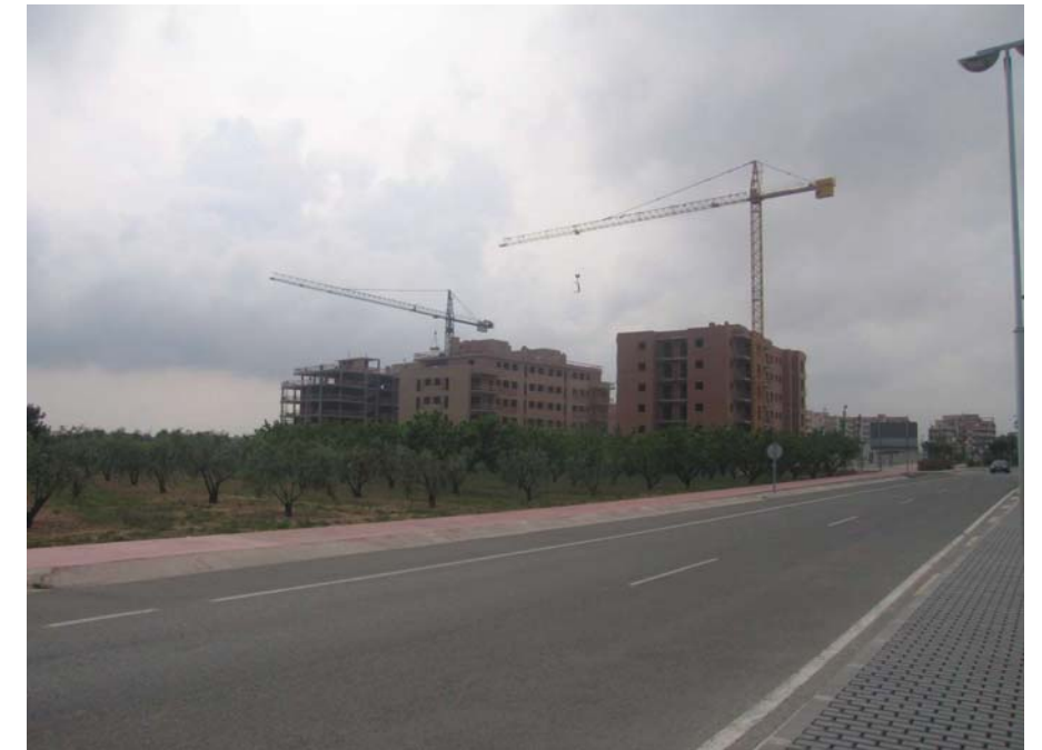
Figura 20.3. L'expansió de l'espai residencial i les vies de comunicació fa retrocedir el paisatge tradicional com s'observa a la imatge que correspon a les afores de Vila-seca.

A l'extrem més septentrional de la platja de la Pineda, en l'indret conegut com el prat d'Albinyana, hi resten petites dunes incipients on s'hi troben espècies que pertanyen als paisatges dunars com l'esperobolus