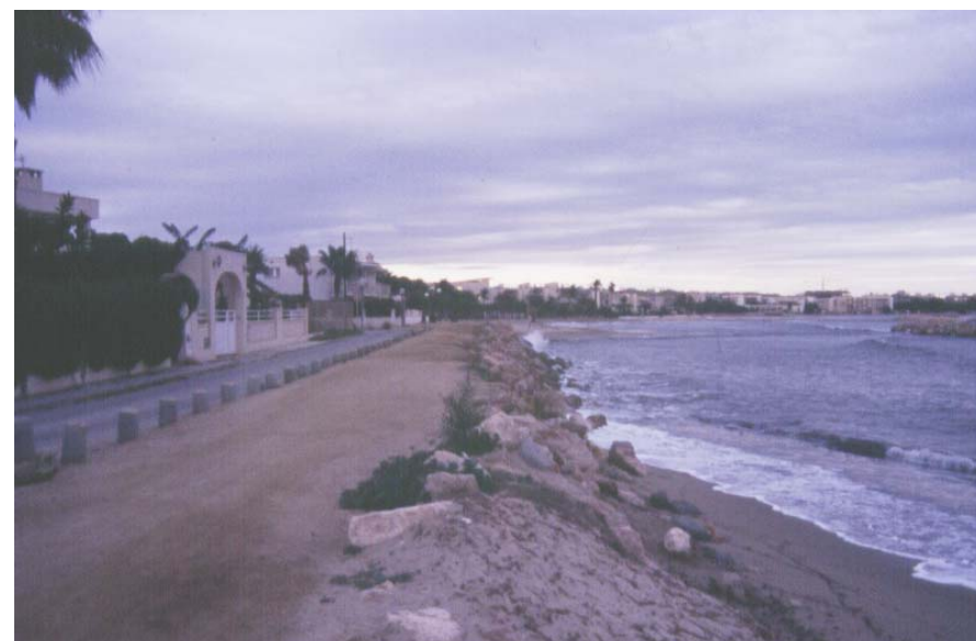
Figura 19.4. Les platges de ponent de Cambrils s'han vist molt afectades per l'erosió, provocada en part per la construcció del port, fet que ha comportat la construcció d'obres de defensa de la costa i la modificació del paisatge de la costa.

Per descobrir el paisatge del Litoral del Camp es recomana resseguir a peu el GR-92, que transcorre per la línia de costa al llarg de tota la unitat.