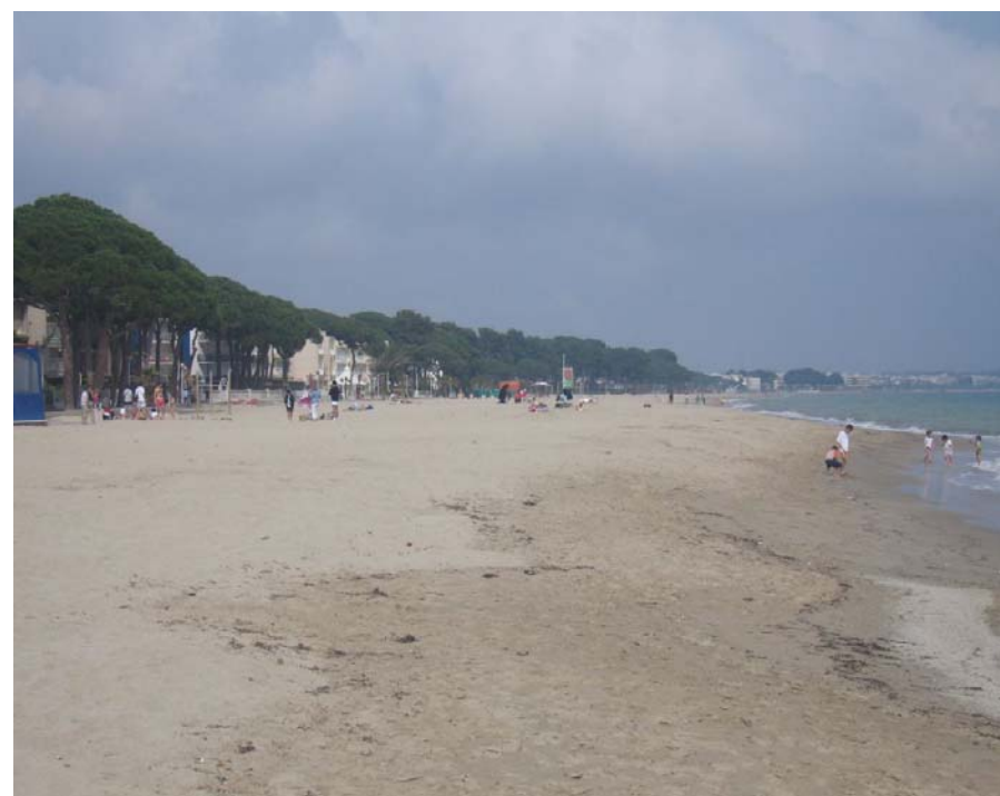
Figura 19.2. En alguns punts de la costa com a la platja de Vilafortuny encara són visibles fragments de les pinedes de pi pinyer que s'havien plantat en el passat sobre les sorres de les dunes.

El feble pendent que presenta el relleu va facilitar la formació de llacunes i zones inundables prop de la costa. Espais humits que han desaparegut per l'activitat agrària passada i per l'avenç de la urbanització en les darreres dècades, però que han quedat fixats en la toponímia com és el cas dels paratges de la Bassa i dels Estanyets, dins el municipi de Salou.