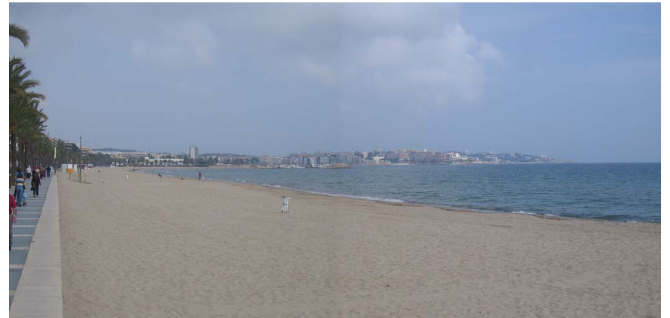
Figura 19.1. Les platges llargues i planes de Salou són un dels principals recursos turístics. A la imatge la platja de ponent de Salou. Al fons s'observa el cap de Salou i les siluetes dels edificis d'hotels i apartaments que ressegueixen la costa.