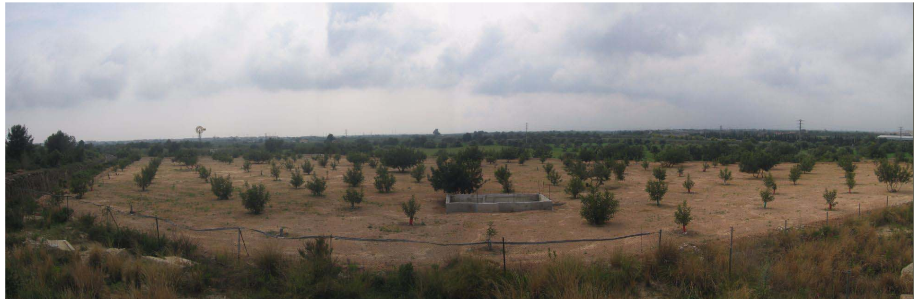
Figura 19.3. El paisatge del Litoral del Camp mostra un fort contrast entre una faixa costanera densament urbanitzada i un ampli sector interior on es manté el paisatge agrícola tradicional. A la imatge s'observa la plana conreada amb camps de garrofers i oliveres.

El paisatge del Litoral del Camp està subjecte a les dinàmiques pròpies dels litorals turístics, caracteritzada pel creixement de l'espai construït que ha acabat per ocupar tota la primera línia de costa. La construcció avança cap a l'interior a expenses de l'espai agrícola que retrocedeix gradualment.