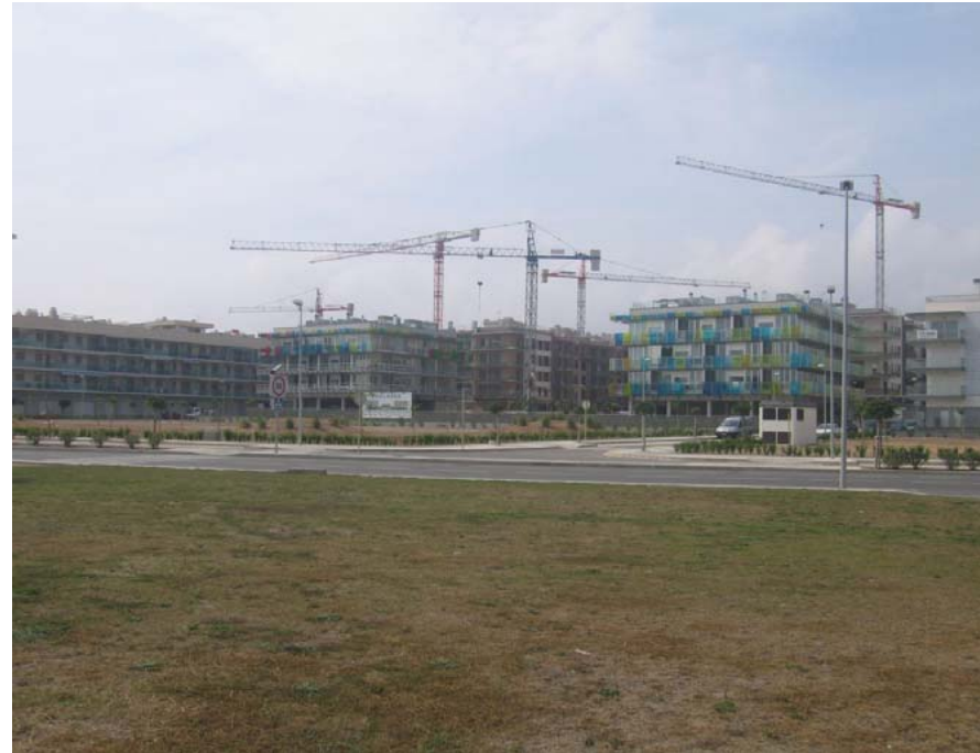
Figura 19.5. La urbanització de la faixa litoral prossegueix el seu avenç cap a l'interior des de la primera línia ja ocupada, com es pot observar en la imatge corresponent a un paratge de Vilafortuny.

una finalitat exclusivament residencial que no podrà oferir la qualitat de vida que la població requerirà.