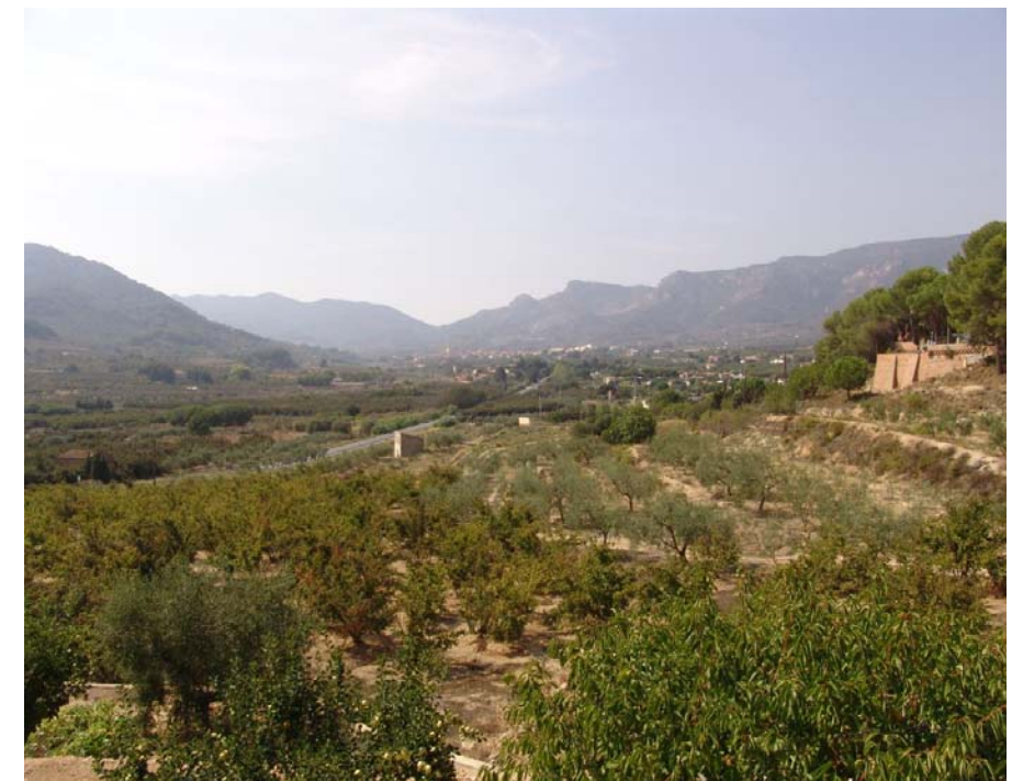
Figura 17.3. Vista general del municipi d'Alforja, amb el front de la Mussara al fons.