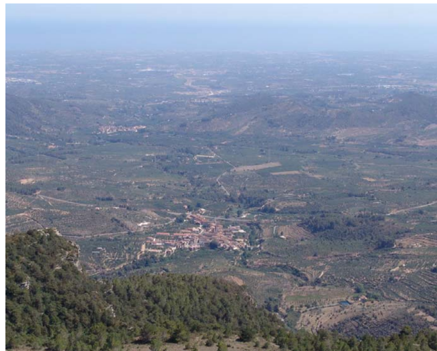
Figura 17.2. Vilaplana, en primer terme, i l'Aleixar, al fons, es localitzen al centre de la depressió, en un entorn agrícola en mosaic, amb brolles i petites clapes de pins.

de cingles que limita la depressió pel nord. Les masses més importants d'alzinars i carrascars es localitzen a les obagues del puig d'en Gulló i del puig d'en Cama i de la resta de relleus que s'estenen entre l'Aleixar i la Selva del Camp. A la meitat occidental el predomini de l'espai agrícola és molt gran i la vegetació ha reculat cap als relleus perifèrics, però en el sector de llevant hi predominen els mosaics agroforestals i les clapes de bosc s'intercalen amb els camps de conreu. Als sectors on el bosc ha estat més alterat, ja sigui a causa dels incendis forestals o de l'aprofitament abusiu, hi apareixen brolles silícioles on destaca la presència de l'estepa populifòlia ( Cistus populifolius ). A les ribes de les rieres d'Alforja i de Maspujols s'hi troben gatel·ledes i fragments de freixenedes. Cal destacar l'existència d'una alzina molt longeva en el mas de Borbó (terme de L'Aleixar), un arbre monumental d'11 m d'alçada i 6,45 m de volta de canó, considerat un dels més vells de Catalunya.