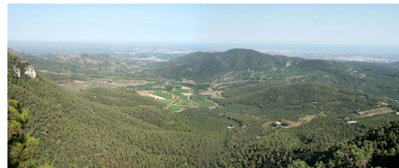
Figura 17.1. La depressió d'Alforja i Vilaplana s'interposa entre la serra de la Mussara i la plana del Baix Camp. L'erosió dels granits i les pissarres ha donat lloc a una conca on els usos agrícoles ocupen les superfícies més planeres dels fons de la depressió mentre els boscos recobreixen densament els vessants.