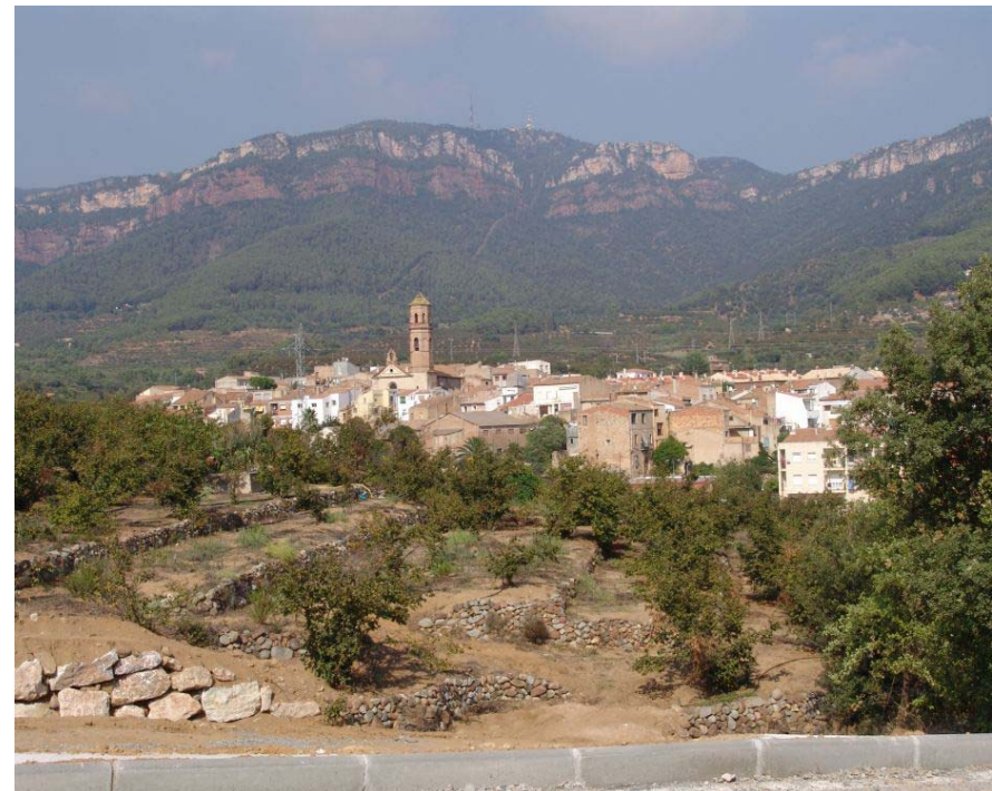
Figura 17.4. Nucli de Vilaplana.

Entre els valors religiosos i espirituals , cal esmentar Sant Blai, ermita objecte de festes votives especials, i que antigament acollien peregrins de les poblacions del voltant, i que ara es restringeix a la vila