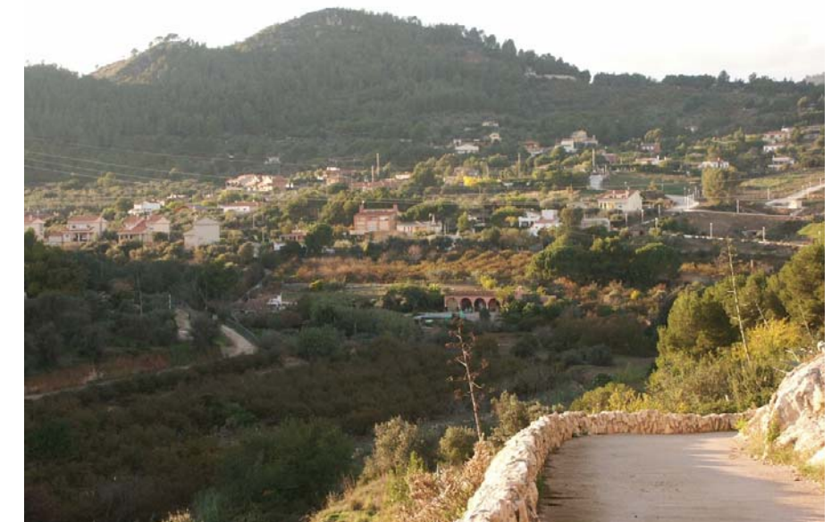
Figura 17.5. Tan els vessants encarats a la plana del Baix Camp, com als turons al nord del nucli de Castellvell del Camp es localitzen diverses urbanitzacions de segones residències, fenomen induït per la proximitat de la ciutat de Reus.

turistes que cerquen la tranquil·litat i l'aïllament enmig d'un entorn rural.