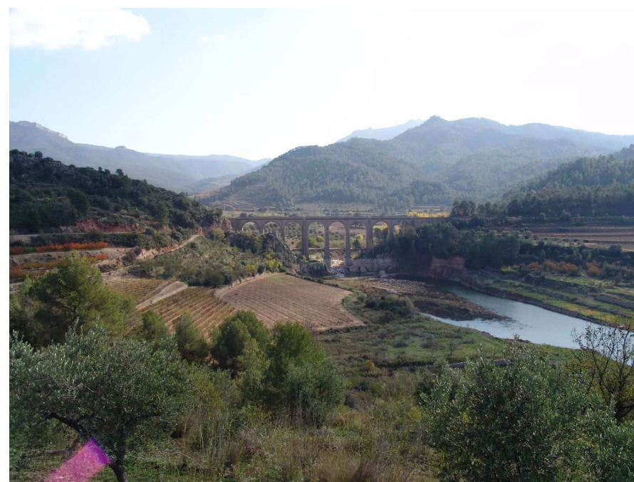
Figura 13.8. El viaducte del ferrocarril a Capçanes salva el torrent de Fontaubella ja a la cua del pantà dels Guiamets. Els conreus de vinya instal·lats en les terrasses fluvials i les feixes esglaonades a banda i banda del curs d'aigua.

En relació als incendis forestals, que han estat el principal agent transformador del paisatge de la serra de Llaberia, és previsible que segueixin reproduint-se a causa de les característiques pròpies del territori. Es calcula que aproximadament cada 15 anys se succeeix un gran incendi, com així ho demostren els dos darrers grans incendis (1981 i 1994).