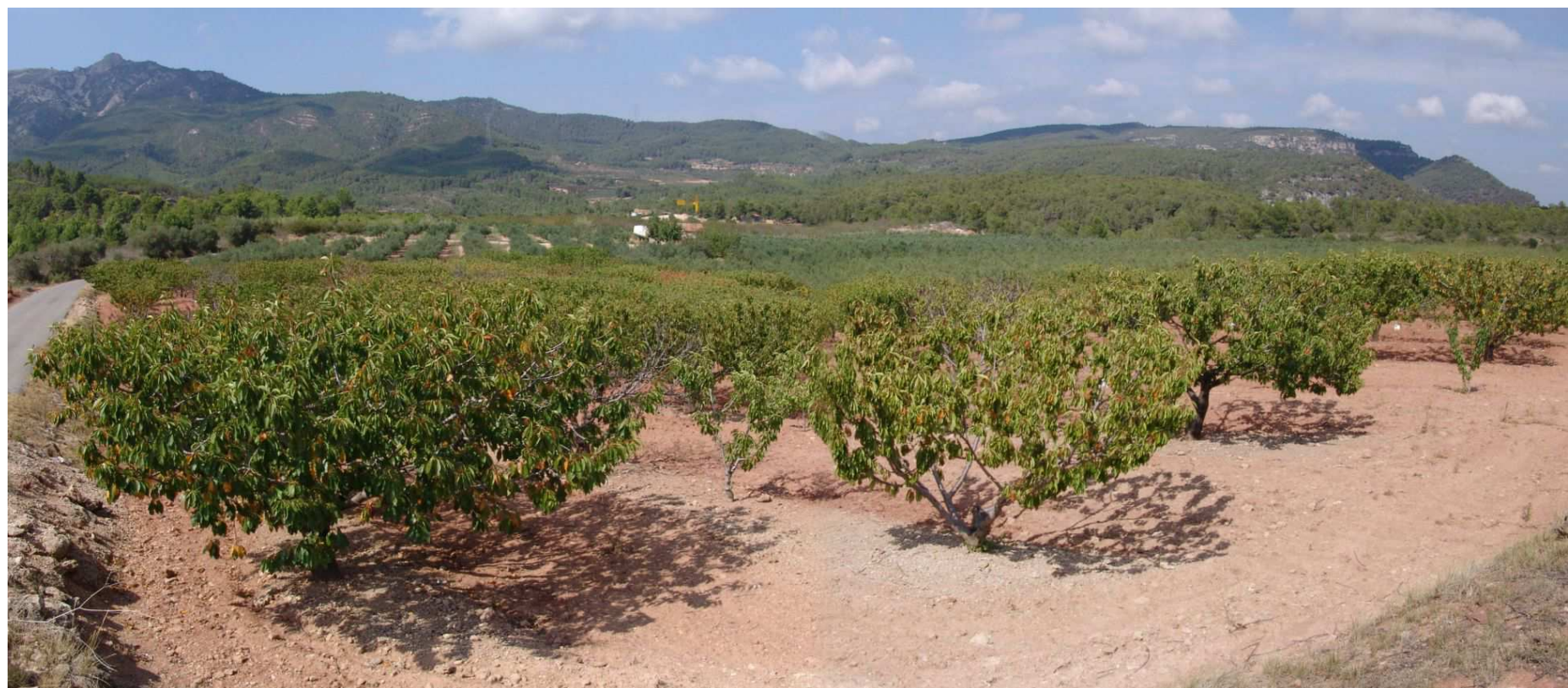
Figura 13.4. Camps de conreu on s'observen cirerers en primer terme i oliveres al fons instal·lats en un replà modelat sobre les argiles i els gresos vermells del triassic, en un sector entre Pratdip i Coldejou.

respectivament, que són de gestió pública i que també integren pinedes i alzinars. Al vessant nord de la serra de Güena hi ha un petit sector d'unes 70 ha d'extensió, propietat també de l'Ajuntament de Pratdip, que actualment està constituït per brolles calcícoles a causa dels incendis forestals repetits. Finalment, sota la propietat de l'Ajuntament de Mont-roig del Camp hi ha dos sectors veïns que sumen poc més de 100 ha de pinedes al sud de la serra de la Pedrera.