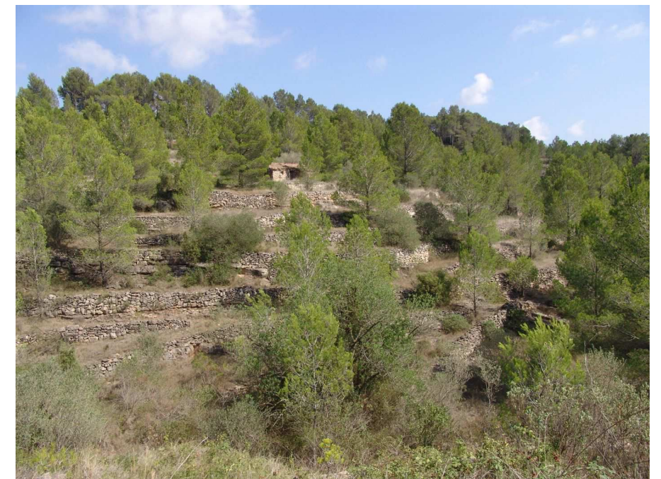
Figura 13.7. Les pinedes de pi blanc colonitzen les feixes abandonades i camuflen els murs de pedra seca i les barraques de pagès, elements característics del paisatge agrari tradicional.

Una ruta amb vehicle, també permet tenir una visió general de la unitat. Aquesta ruta pren el poble de Tivissa com a referència i passa per: la serra d'Almos, els Guiamets, Capçanes, Marçà, la Torre de Fontaubella, Colldejou, Pratedip, i tornaria a Tivissa. Donant un tom complet a la unitat. (TV-3031, camí de els Guiamets a Capçanes, TV-3002, TV-3001, T-322, camí de Pratedip a Colldejou, T-311, C-44)