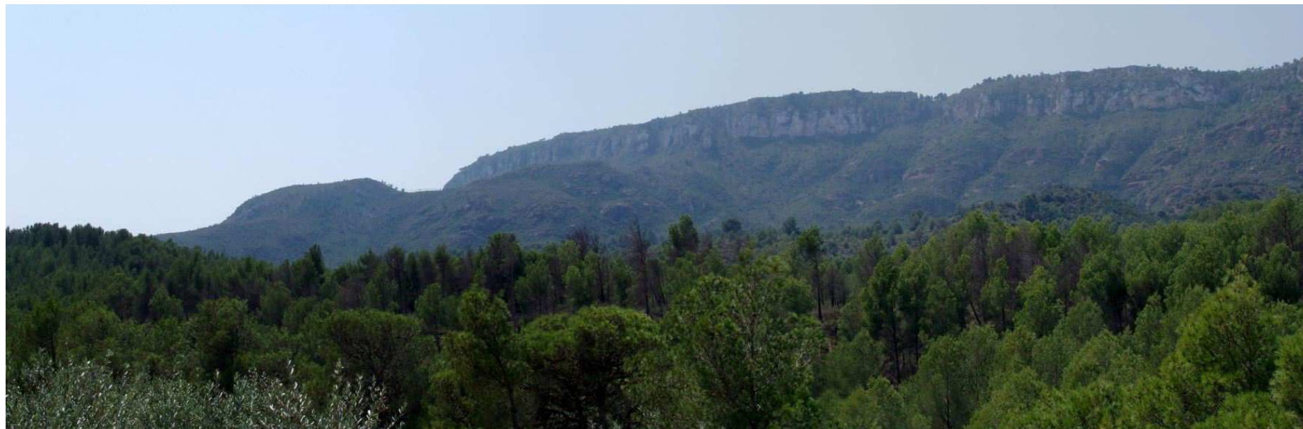
Figura 13.9. Vista panoràmica de la muntanya Blanca a Llaberia.