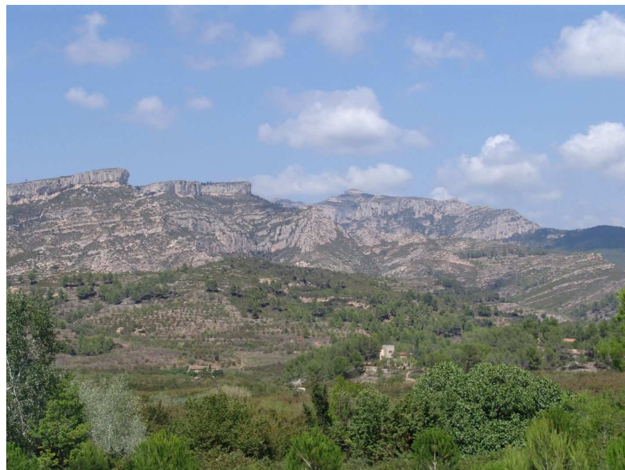
Figura 13.2. Els cingles de la Grallera i la Miranda de la serra de Llaberia modelats en les calcàries juràsiques, observats des del barranc de Santa Marina, són una bona mostra dels relleus alterosos que dominen el paisatge del sector.

El relleu és molt intricat. Un conjunt de serres i moles: turons coronats per plataformes tabulars, es succeeixen des del sud de Falset fins al mar. Un primer arc exterior de muntanyes s'inicia al sud de la serra de l'Argentera i separa les valls interiors de la plana del Baix Camp i del veí massís de Vandellòs. La serra de la Gallina Cega (506 m), la muntanya Blanca (489 m), el Puig de Cabrafiga (614 m), la serra de Güena amb el Puig del Marquès (502 m) i la serra de Santa Marina (588 m a la mola de la Viuda) constitueixen un primer conjunt exterior de serres calcàries, modelades en les dolomies del Muschelkalk inferior, que encerclen el principal conjunt de valls i replans de l'interior del massís muntanyenc. A les valls i replans interiors es localitza la principal àrea agrícola, que coincideix amb un nivell de materials tendres: argiles i gresos vermells del Muschelkalk mig. És sobre aquest nivell argilós que es localitza el poble de Pratdip i la principal via de comunicació interior que des del coll Roig travessa el llogarret de Santa Marina i els nuclis de Pratdip i Colldejou.