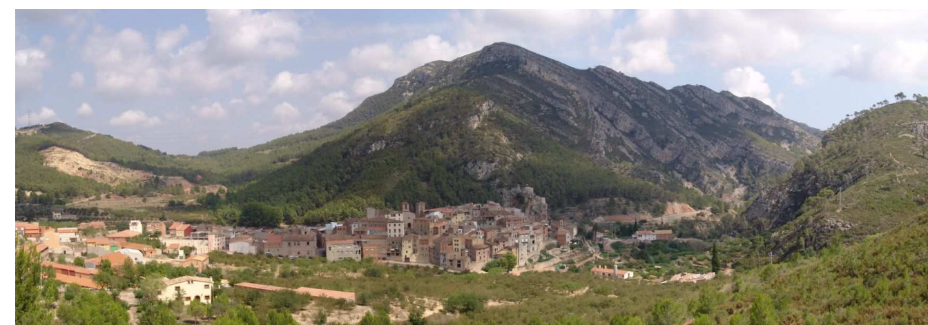
Figura 13.1. El poble de Pratedip en una clotada al peu del Cabrafiga el qual mostra les capes plegades de calcàries triàsiques. S'observen alguns camps d'avelaners i a l'esquerra la roca descarnada per una pedrera.