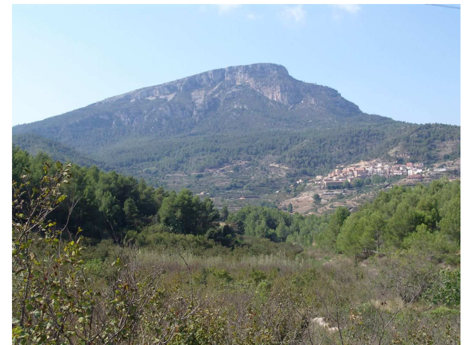
Figura 13.3. La imponent mola de Colldejou és una façana paisatgística visible des de molts punts del Priorat i el Baix Camp. Al peu, el poble de Colldejou i petits sectors de conreu sobre els materials tendres del Triàsic.

La vegetació mostra una clara asimetria entre els vessants meridionals i els septentrionals. A les moles i serres calcàries que s'estenen des del coll de Fatxes fins a Santa Marina i el Cabrafiga hi predomina la vegetació arbustiva: garrigues i brolles de romaní ( Rosmarinus officinalis ) i bruc d'hivern ( Erica multiflora ), afavorides per l'efecte dels incendis forestals. Al peu de les mola de Colldejou i dels contraforts septentrionals de Llaberia hi abunden pinedes de pi blanc ( Pinus halepensis ) bastant madures sobre brolles calcícoles de romaní. En els obacs i a la part alta dels vessants orientats al nord s'hi troba l'alzinar muntanyenc, junt amb la presència esporàdica de pi roig ( Pinus sylvestris ), roures de fulla petita ( Quercus faginea ) i altres caducifolis. Algunes teixedes prosperen en racons ben conservats. Els roures arriben a formar boscos mixtos al vessant obac del coll del Guix. Algunes pinedes de pinassa ( Pinus nigra ssp. salzmannii ) es troben al vessant nord de la mola de Llaberia. L'abundància de parets i cingles calcaris facilita l'existència de plantes rupícoles calcícoles. A les ribes del pantà de Guiamets i dels torrents de més entitat hi ha fragments de salzedes i alguna albereda.