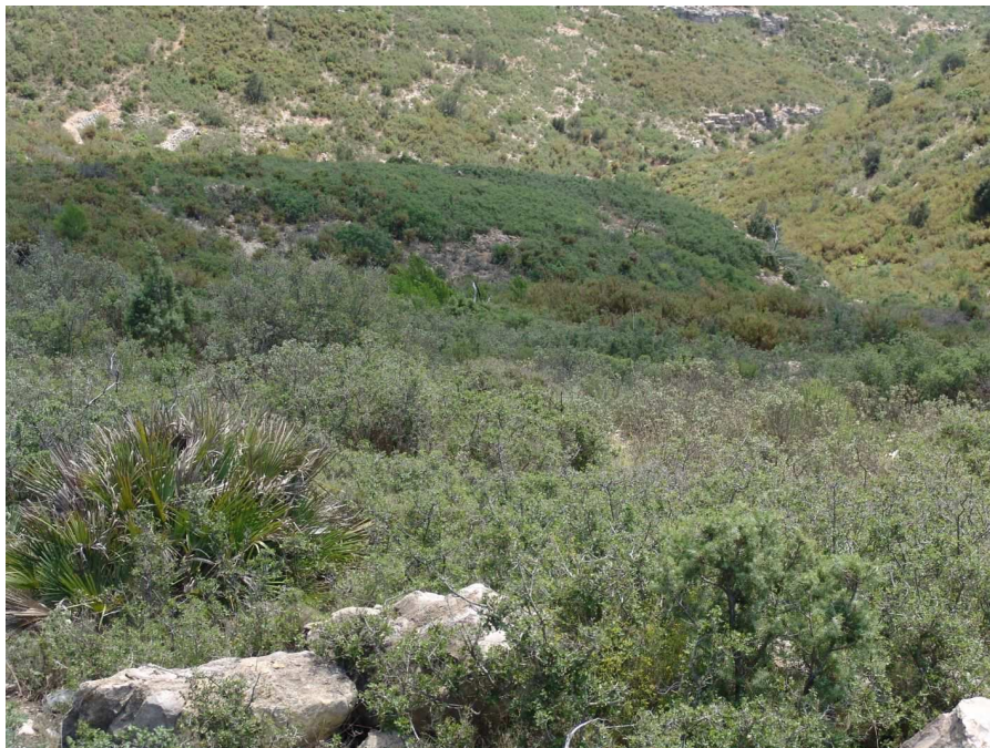
Figura 13.5. Les garrigues amb margalló colonitzen molts vessants solells sobre calcaris compactes i són un fidel reflex de les característiques climàtiques mediterrànies.