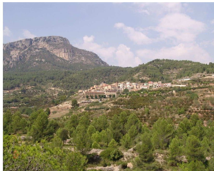
Figura 13.6. Vista general del poble de Colldejou.

Per últim destaca la ruta per la muntanya Blanca, de menys altitud i que sovint passa inadvertida al costat del Mont-redon o el Cavall Bernat. El camí es pren des de la carretera de Pratedip a Colldejou, i puja fins al marge de la petita cinglera de la muntanya Blanca, d'on es tenen unes vistes inoblidables sobre la costa, el mar i el Camp de Tarragona.