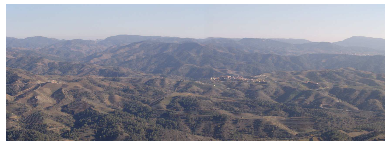
Figura 11.1. El paisatge del Priorat històric es caracteritza per un relleu trencat, laberíntic, on els vessants mostren l'empremta de les feixes esglaonades per al conreu de la vinya. Gratallops, emplaçat dalt d'una baixa carena, destaca enmig d'un entorn de colors bruns pel predomini absolut dels materials pissarrencs.