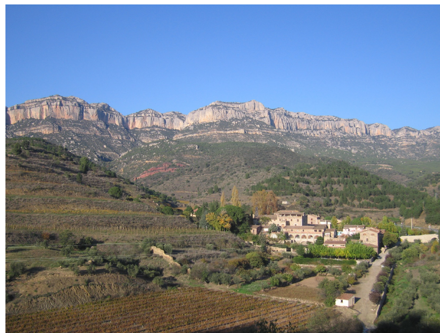
Figura 11.9. El nucli d'Escaladei és un dels sectors més emblemàtics del Priorat històric. Situat al peu de la cinglera Major de Montsant constitueix un conjunt amb un alt valor estètic, històric i cultural.

El GR-174 fa un recorregut per bona part del Priorat històric i passa per alguns dels seus pobles: prové de Cornudella i passa per Poboleda, Escaladei, la Vilella Alta, Torroja del Priorat, Gratallops, el Lloar i Bellmunt del Priorat, des d'on es dirigeix cap a Falset. Després retorna pel camí de Falset a Porrera i, un cop creuada Porrera, continua pel riu Cortiella,