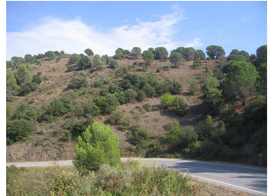
Figura 11.3. Tot i la importància de l'agricultura, en un municipi com Porrera (a on correspon la imatge superior) la vegetació espontània encara ocupa la major part del territori, sovint amb forma de brolles i petite bosquines.

Excepte els nuclis de Gratallops i Bellmunt de Priorat, emplaçats dalt d'una carena, la resta de poblacions del Priorat històric es localitzen a la riba d'algun dels cursos d'aigua principals. La Vilella Alta i la Vilella Baixa se situen a la riba del riu d'Escaladei; Poboleda i Torroja de Priorat a la vora del Siurana, mentre que el riu Cortiella rega les hortes de Porrera.