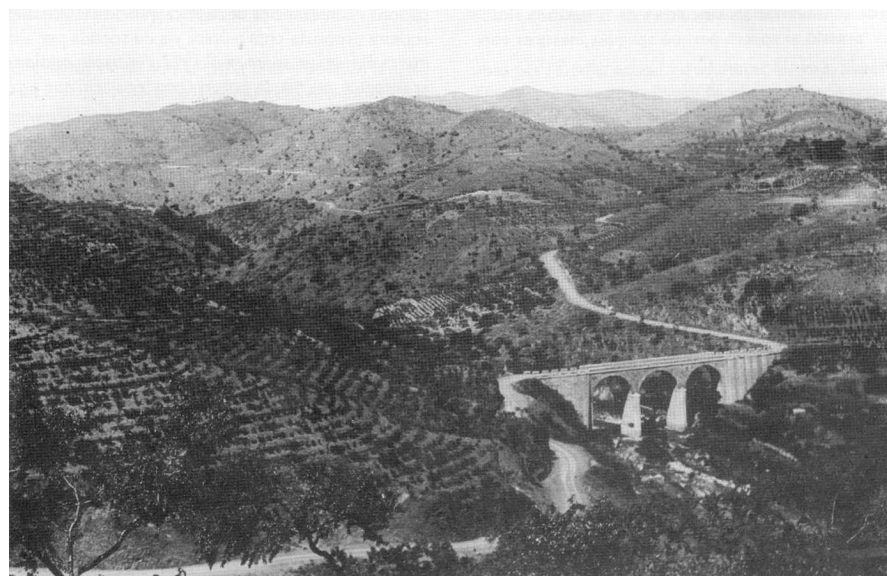
Figura 11.4. A principis del segle XX una bona part del Priorat històric estava destinat al conreu de vinya; la presència de masses arbrades era testimonial degut a la intensa explotació a la que se sotmetien els boscos i bosquines, tal i com es pot apreciar en aquesta imatge d'un sector proper al nucli de Torroja del Priorat.

En canvi, no s'han donat modificacions significatives pel que fa a l'estructura urbana i l'estètica de les poblacions.