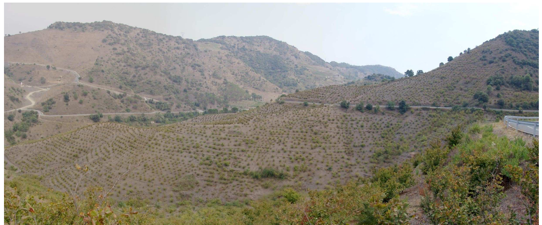
Figura 11.7. Conreus d'avellaners al Baix Priorat.

«Aquest petit fet geogràfic es descobreix per les seves conseqüències: des de la carretera, la Vilella Baixa sembla la Nova-York del Priorat. Les cases del centre, sobretot les que volten l'església, tenen una colla de pisos, algunes fins a set, si no he comptat malament. La cosa -escatimem adjectius- és