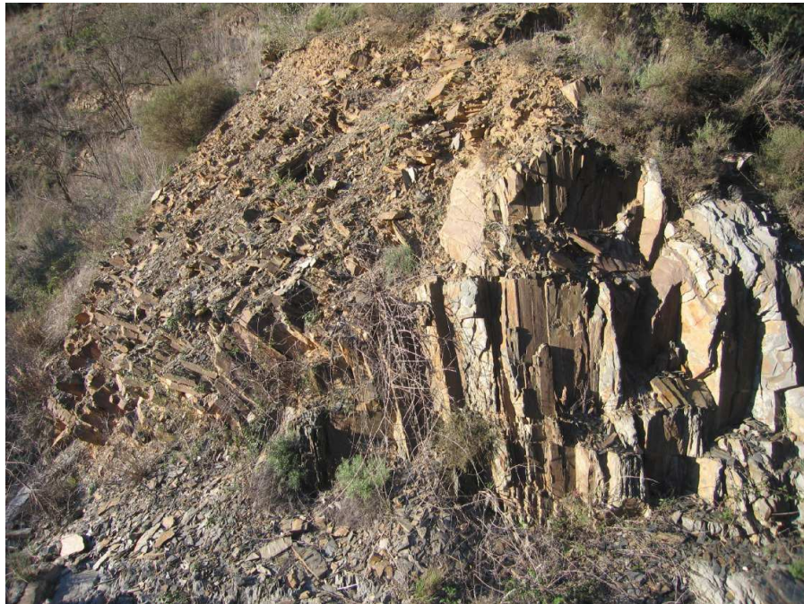
Figura 11.2. Detall d'un aflorament de pissarres, el material característic dels relleus del Priorat històric.

El Priorat històric ocupa la part central de la comarca del Priorat. Malgrat presentar una posició deprimida respecte els relleus alterosos de les serres de Montsant, de la Figuera i de la Mussara que l'encerclen per tots costats excepte pel cantó meridional, el terreny no és en absolut planer. És un territori de relleu trencat, laberíntic, modelat en un potent banc de materials geològics molt homogenis, d'edat paleozoica, constituït bàsicament per pissarres i gresos. Uns materials que sota l'acció dels agents erosius donen lloc a formes de relleu de perfil convex. A més, una complexa xarxa de rius i torrents de cabal humil s'ha encaixat fortament en el rocam i ha individualitzat tot un conjunt de serres i turons de modesta altitud, amb les carenes i els cims suaument arrodonits, però costeruts, tot donant lloc a un territori d'aspecte bonyegut.