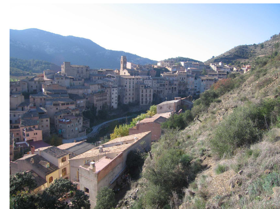
Figura 11.5. Les façanes d'alguns nuclis de població del Priorat històric es conserven inalterades malgrat el pas del temps i tenen un alt valor patrimonial i arquitectònic com la del nucli antic de la Vilella Baixa.

Els conreus són presents per tota la unitat, encara que en determinades àrees de relleu més favorable arriben a dominar el paisatge. Tal és el triangle entre Gratallops, el Lloar i Bellmunt, o les zones properes a Torroja i a Porrera. La vinya i l'ametller s'estenen per tota aquesta àrea. Contràriament, l'avellaner queda força restringit a la meitat oriental, mentre que l'oliver pren rellevància a ponent. Tots aquests conreus aprofiten fondals i vessants de pendent suau o moderat. Sovint no hi ha cap modificació del pendent original. Quan aquest és molt gran es troba abanecat de forma parcial mitjançant marges discontinus de pedra, estratègicament col·locats per evitar l'erosió.