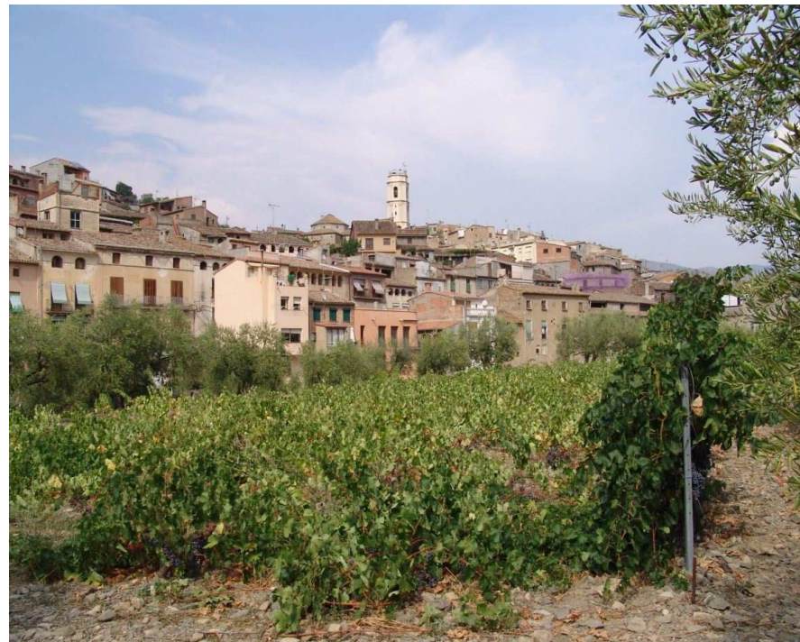
Figura 11.8. La façana de Porrera és un bon exemple de la tipologia constructiva tradicional dels pobles del Priorat.

També cal esmentar la proliferació de cellers, alguns de grans dimensions, en el medi rural. Si bé la majoria estan integrats en l'entorn, no en tots els casos s'ha respectat l'estructura, els materials i colors tradicionals de les construccions.