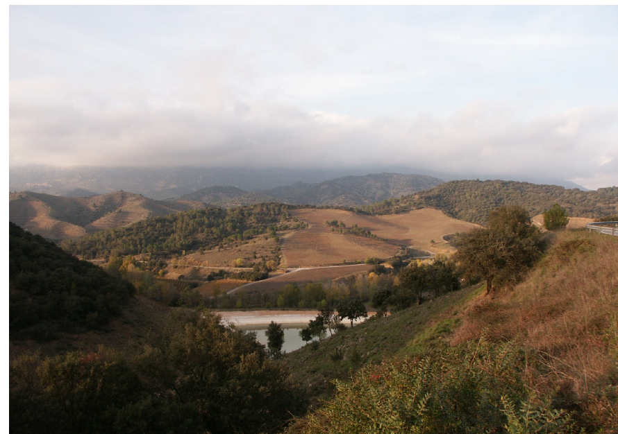
Figura 11.10. Un element de la dinàmica recent del paisatge del Priorat històric és l'expansió del conreu de la vinya per mitjà de l'aterrossament dels vessants, tal i com s'observa en la imatge corresponent a un sector proper al nucli de Porrera.

És de preveure que en un futur proper el paisatge del Priorat històric es mantindrà sotmès als mateixos agents i processos que condicionen la seva dinàmica actual, amb un predomini del mosaic paisatgístic constituït per conreus i àrees forestals i amb una tendència a augmentar l'àrea de vinya. Per altra banda, els espais forestals tendiran a guanyar densitat i cobertura mentre no siguin afectats pels incendis forestals.