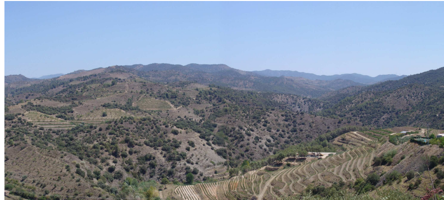
Figura 11.6. El paisatge del Priorat històric es caracteritza per la presència de serres i turons de formes arrodonides, recoberts per un mosaic de claps discontinus de bosc i amb alguns vessants afeixats per al conreu de la vinya, tal i com es pot apreciar en la imatge corresponent a un sector situat entre Porrera i Gratallops.

El Priorat històric integra diversos nuclis urbans, tots ells de petites dimensions i amb unes característiques arquitectòniques força comunes, que els fan molt atractius, ja que caracteritzen fortament el paisatge de la unitat: Poboleda, Escaladei, la Vilella Alta, la Vilella Baixa, Gratallops, Torroja del Priorat, Porrera, i Bellmunt del Priorat.