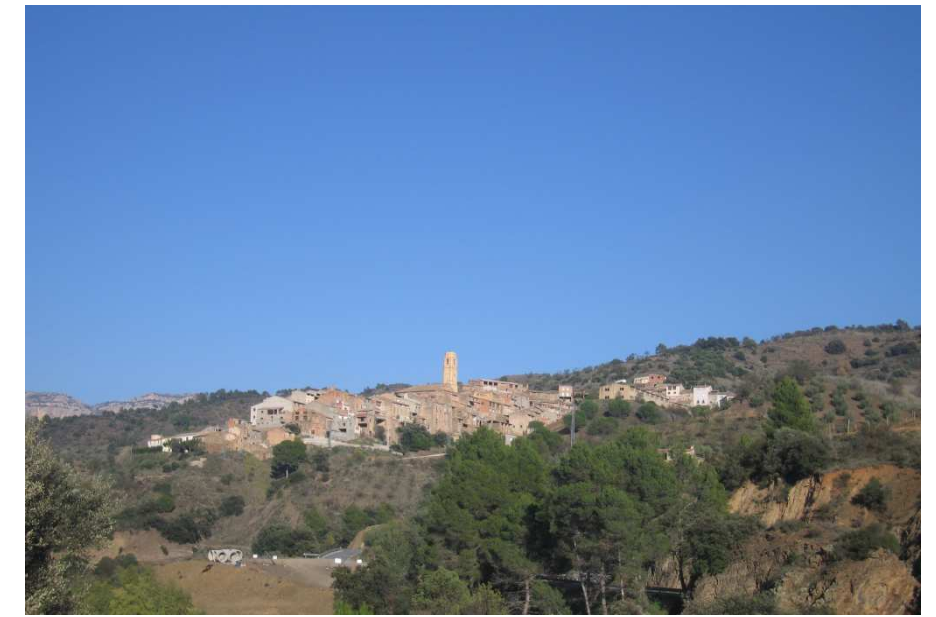
Figura 11.11. Imatge del nucli de la Vilella Alta.

Un element de transformació registrat en els darrers anys ha estat precisament la creació de finques de gran extensió a partir de les zones més fàcilment agrupables i allunyades dels nuclis de població, mentre que moltes de les explotacions més properes als pobles s'han abandonat. Es preveu que aquesta tendència pugui continuar en els propers anys si no existeix una estratègia que integri variables econòmiques i territorials que considerin la particularitat i especificitat d'aquest àmbit territorial.