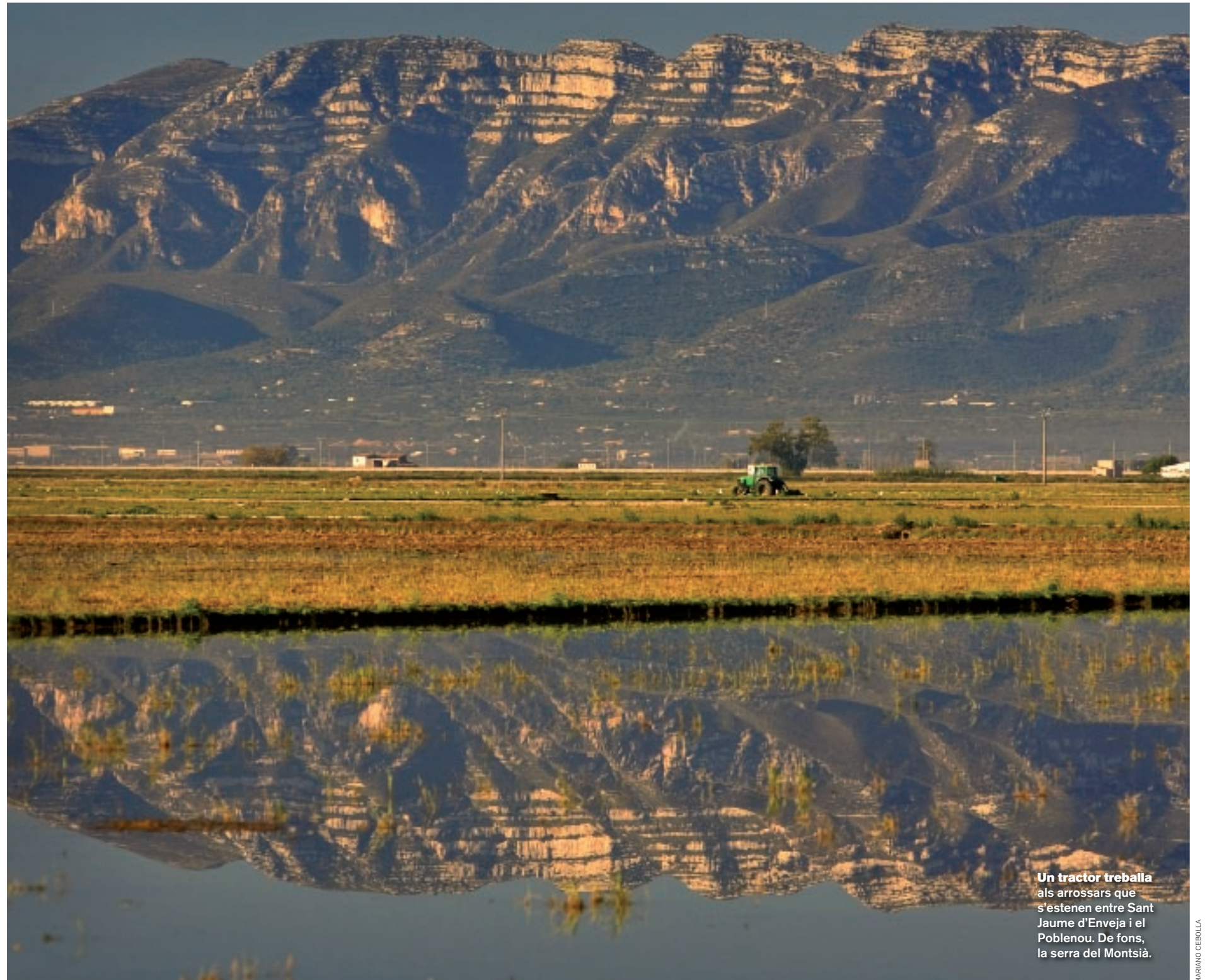
Un tractor treballa als arrossars que s'estenen entre Sant Jaume d'Enveja i el Poblenu. De fons, la serra del Montsià.