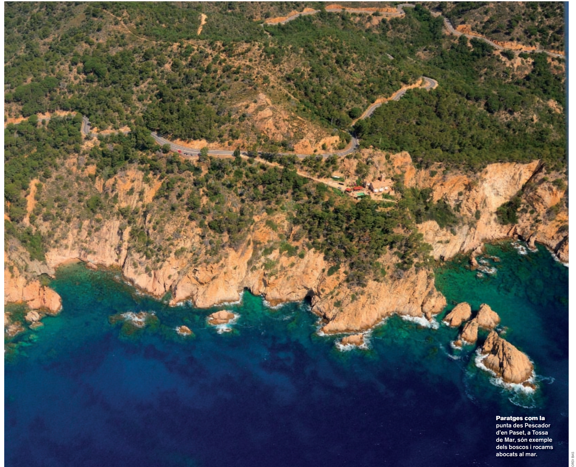
Paratges com la punta des Pescador d'en Paset, a Tossa de Mar, són exemple dels boscos i rocams abocats al mar.