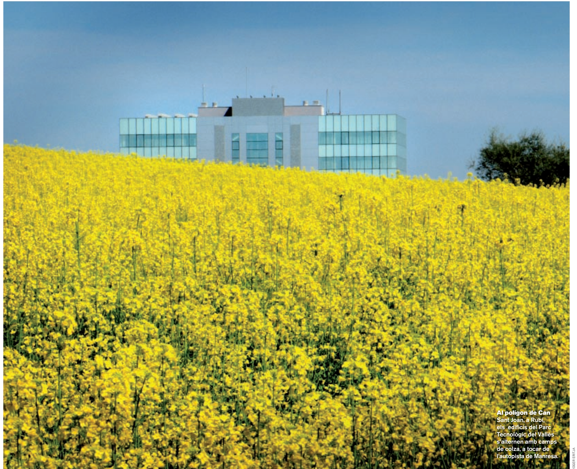
Al polígon de Can Sant Joan, a Rubí, els edificis del Parc Tecnològic del Vallès s'alternen amb camps de colza, a tocar de l'autopista de Manresa.