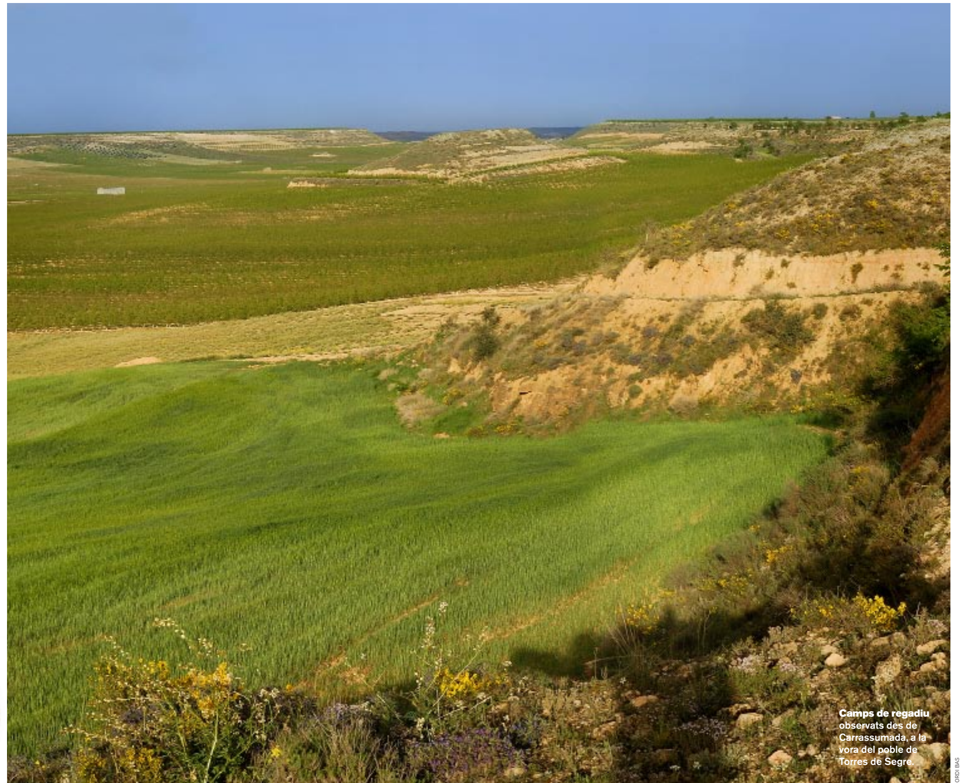
Camps de regadiu observats des de Carrassumada, a la vora del poble de Torres de Segre.