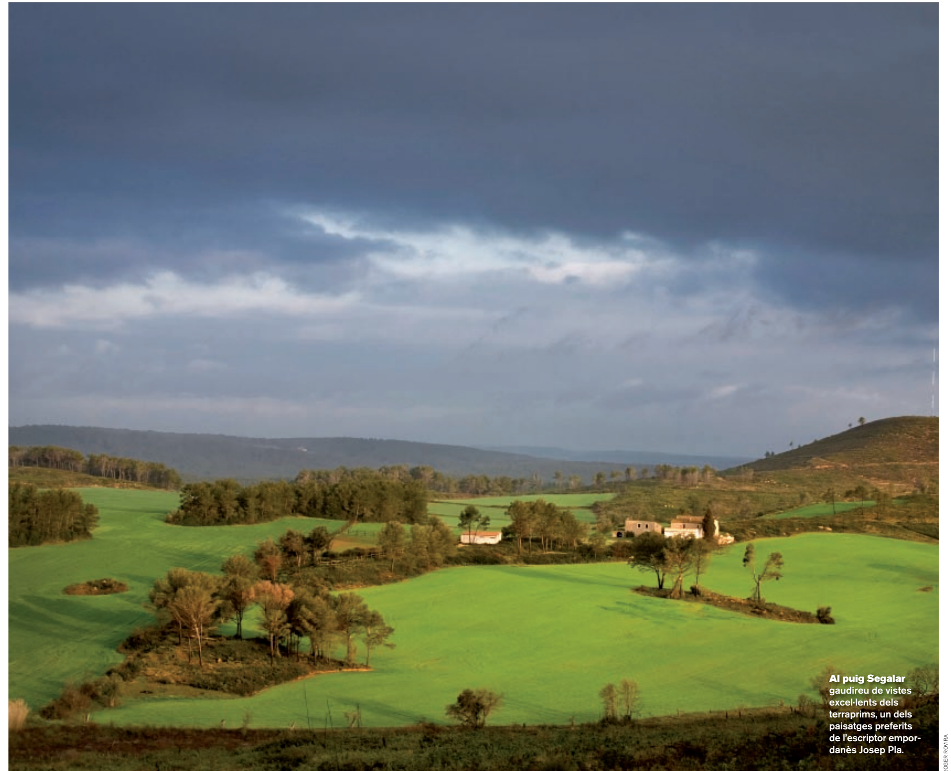
Al puig Segalar gaudireu de vistes excel·lents dels terraprimms, un dels paisatges preferits de l'escriptor empordanès Josep Pla.