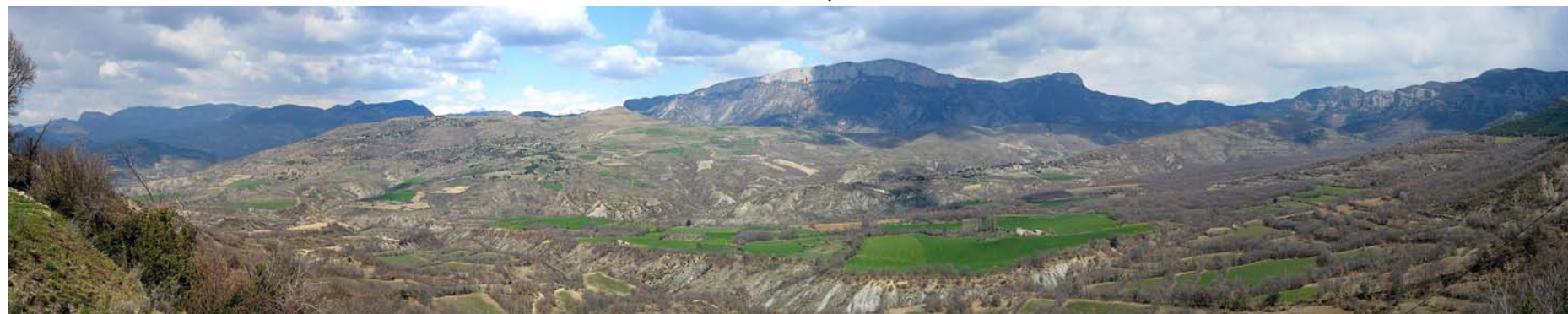
Figura 20.6: Vista panoràmica del sector nord de la Terreta, des del poble de Sapeira

La primera impressió que es té del paisatge de la Terreta és la d'una zona aparentment despoblada i amb molt poca vegetació, un fet que li dona tot el seu caràcter. L'aridesa del territori respecte a altres unitats del Pirineu o, fins i tot, del Prepirineu és un fet cabdal. Aquest paisatge eixut, poblat de brolles i bosquines, és el resultat de segles d'explotació del medi i, en especial, dels darrers pobladors del segle XIX i primera meitat del XX, que varen utilitzar fins al darrer recurs vegetal per poder subsistir.