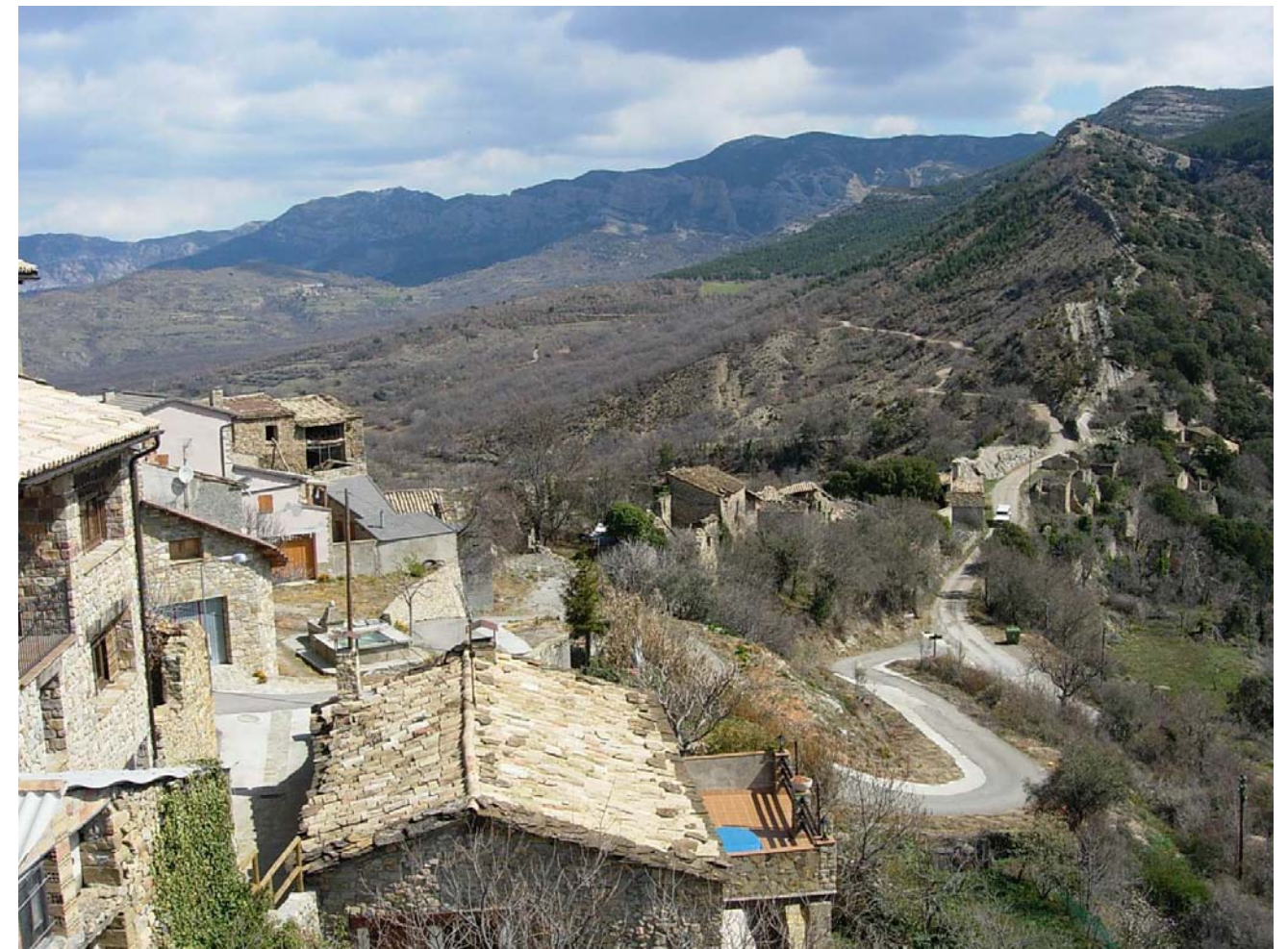
Figura 20.3: La posició altiva de Sapeira, al caire d'un serrat, permet divisar bona part de la unitat i gaudir de la seva riquesa paisatgística