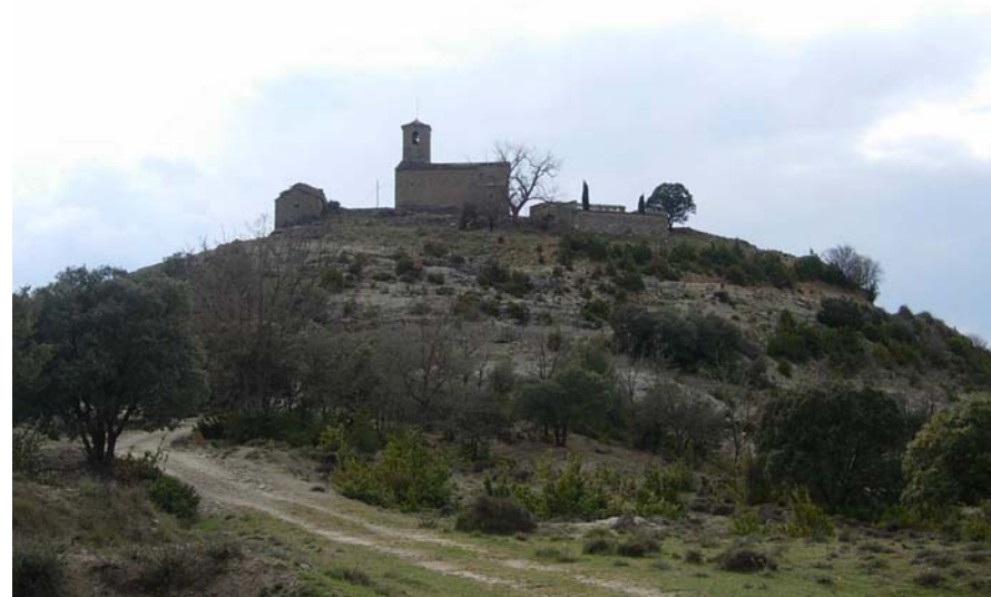
Figura 20.12: El nucli disseminat de Castissent és un altre clar exemple dels processos demogràfics d'envelliment i de despoblació que afecten especialment la Terreta meridional

realmente existen de estos y otros edificios, comprueban evidentemente que en este punto hubo una población que ha desaparecido desde tiempos remotos [...]» (Pascual Madoz, 1845)