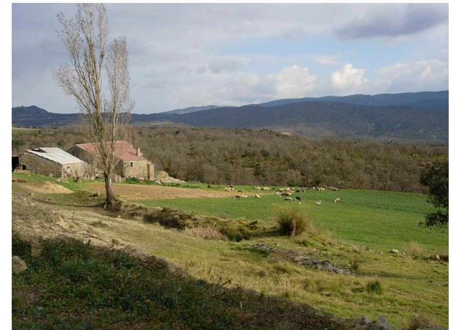
Figura 20.13: El paisatge de la Terreta transmet el caràcter eminentment rural de la unitat, on s'hi desenvolupen una agricultura i una ramaderia adaptades al medi i amb una bona integració en el paisatge, donant lloc a un territori de pas però ben conservat gràcies a un sector primari viu

L'agricultura ha estat l'altra activitat que s'ha desenvolupat conjuntament amb la ramaderia. Les característiques climàtiques de la zona han