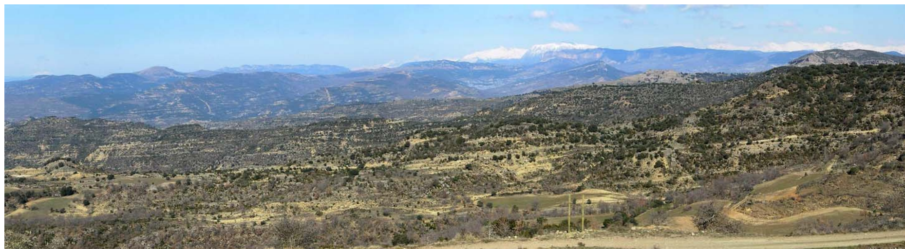
Figura 20.7: Panoràmica del sector sud de la Terreta des de la posició dominant de què gaudeix el poble de Claramunt, on el Prepirineu sec i mediterrani es mostra a la màxima expressió i amb l'horitzó tancat pels cims més alts del Pirineu axial