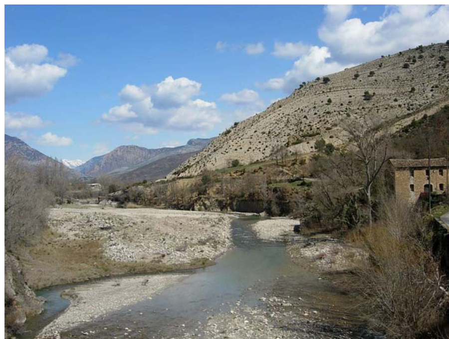
Figura 20.15: Els replers rocosos tallats perpendicularment pel curs divagant de la Noguera Ribagorçana formen un dels paisatges més singulars del sector de la Terreta, compartit entre Catalunya i Aragó

Castellet i els barrancs perpendiculars a la Noguera Ribagorçana, acolorits per les diverses fàcies de materials marins i continentals erosionats per l'acció humana, realcen el cromatisme amb les llums de la tarda. Són de notable valor estètic també les extenses màquies i brolles que abans eren el territori del foc i dels ramats, així com els masos abandonats i els pobles en recuperació entre feixes amb murs de pedra seca.