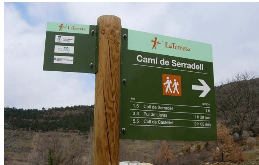
Figura 20.25: La protecció dels valuosos espais naturals de la Terreta i l'establiment d'itineraris per fer a peu o en bicicleta és una de les accions que afavoreix l'arribada de visitants delerosos de conèixer aquests paratges oblidats però de notables valors paisatgístics de tot tipus