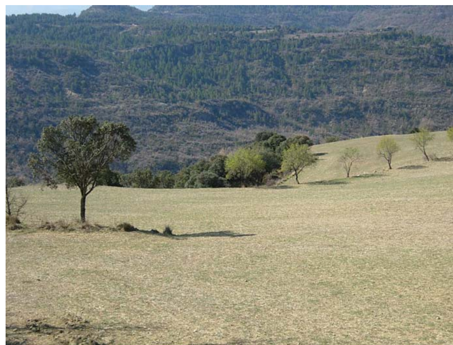
Figura 20.16: La Terreta sorprèn pels contrastos entre els colors i textures dels camps i les seves àrees forestals, d'una varietat sorprenent

Al sud de Claramunt, la Terreta guanya en vivesa i alternança de colors, on una combinació molt interessant de floració primaveral d'ametllers i plantes aromàtiques, contrasta amb els colors de tardor que aporten els caducifolis que revifen entre els camps i les pastures abandonades. A l'extrem nord, en canvi, la roca nua es combina amb els secans de cereal i impregnen l'atmosfera d'una intensa olor a rostoll, just després de la sega, o a herba dallada allà on arriba el regadiu. Els patrons del paisatge es concentren precisament en aquest sector septentrional sota la presència immutable dels conglomerats rogencs de les roques de Castellet.