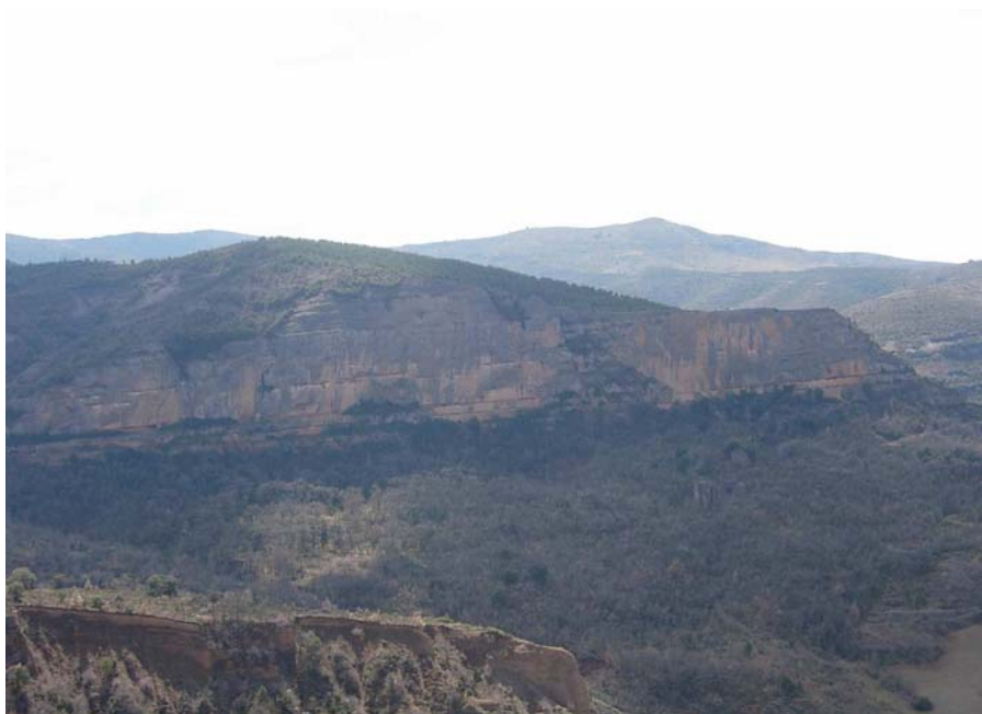
Figura 20.8: Tot i l'aïllament, aquestes cingleres, balmes i esplugues han permès l'assentament de població des de temps pretèrits

Però la història de la Terreta es remunta molt més lluny en el temps, ja que a les proximitats de la unitat es poden trobar vestigis de poblament d'època prehistòrica; hi ha algunes restes de monuments megalítics a Areny de Noguera i vestigis de poblament d'algunes coves al terme municipal de Tremp (cova gran del Sanat de Miralles, foradet del Portús de Miralles) i a Viu de Llevata (cova de Casa del Mestre). De l'edat del bronze i del ferro també hi ha vestigis del poblament en algunes coves, com la balma de les Ovelles, on hi ha unes pintures rupestres incloses en l'arc mediterrani reconegut per l'UNESCO com a patrimoni mundial, també la cova gran del Sant de Miralles i la de l'Esplugu, ambdues a Tremp; o restes d'assentaments al tossal de la font del Moro de Mas de Gras, al Pont de Suert, entre d'altres. Altres vestigis d'interès són d'origen romà, trobats a Sopeira i als Masos de Tamúrcia. Destaquen algunes ruïnes d'època medieval en castells com els de Betesa, Aulet, Miralles, Arbull i Enrens, entre d'altres ja menors.