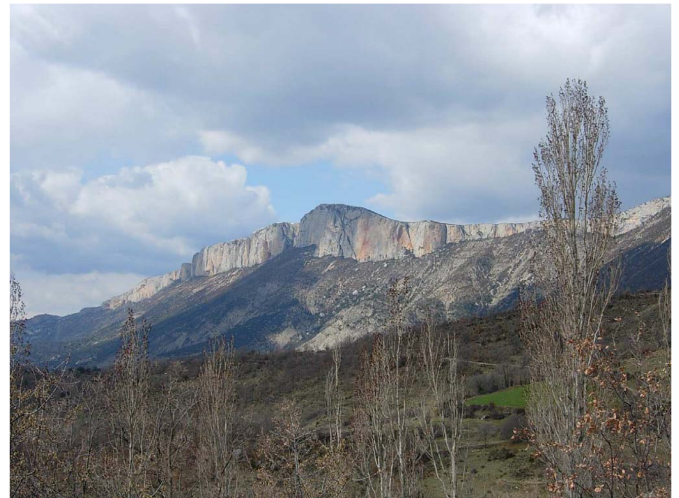
Figura 20.5: Les cingleres calcàries de la serra de Sant Gervàs són un bon referent visual a la Terreta i un gran refugi d'aus rapinyaires