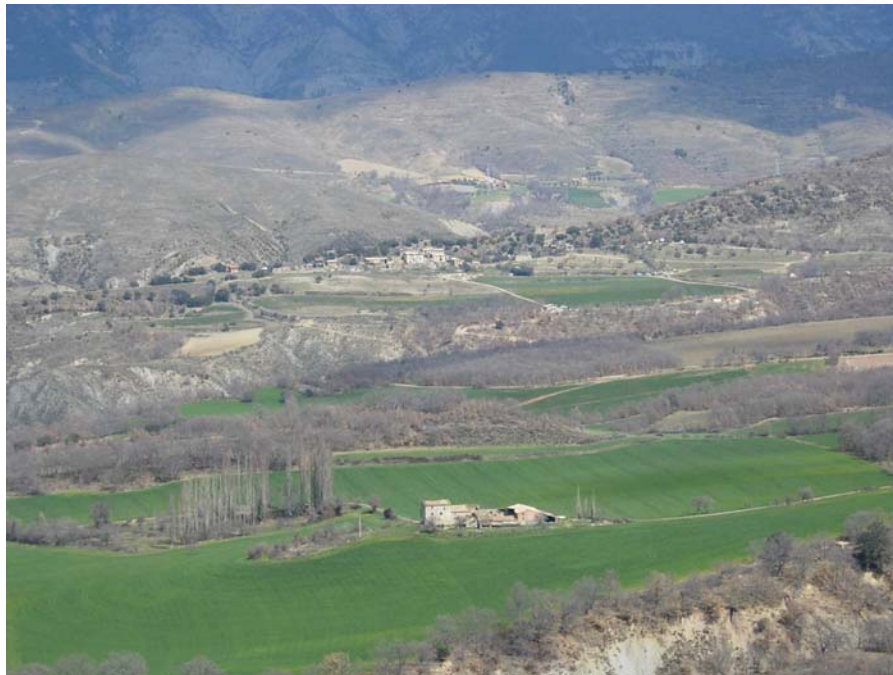
Figura 20.11: Els masos i el conreu de cereals de secà formen encara un conjunt ben viu a l'interior de la Terreta, especialment entre els pobles de Sapeira i Aulàs

Segons el mateix autor, la millor zona d'horta s'estén entre Sopeira i el Pont de Montanyana, a la mateixa plana d'Areny, i és a Sopeira on el cultiu de cereals hi abunda més.