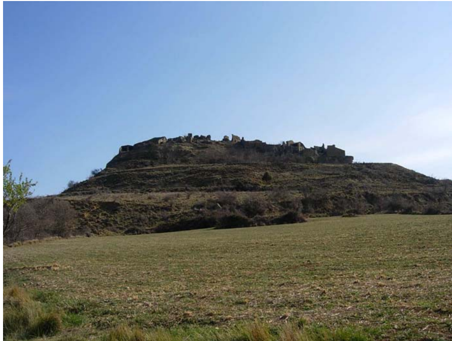
Figura 20.24: L'èxode de població que ha provocat la mala situació dels preus dels productes agraris i l'abandonament d'aquesta activitat està provocant la despoblació de nuclis com aquest de Claramunt, que només és un reflex de l'estat de molts altres pobles que es troben en una situació d'aïllament respecte a les principals vies de comunicació