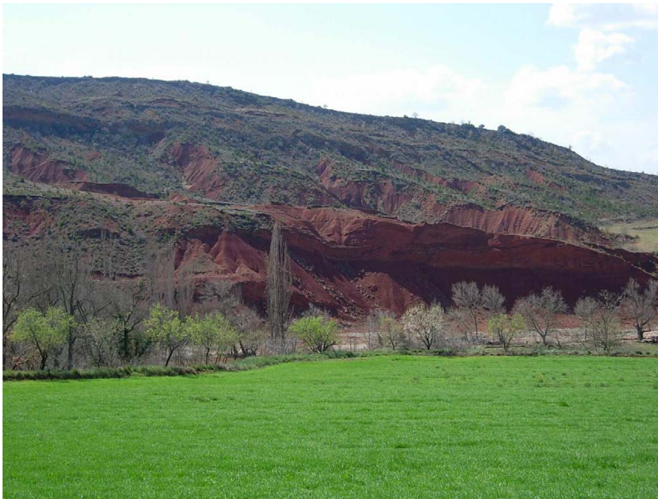
Figura 20.2: La Terreta és una terra de contrastos que arriben a la seu clímax a les ribes del barranc d'Esplugafreda, a prop d'Orrit