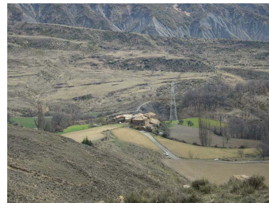
Figura 20.21: Les torres i línies elèctriques d'alta tensió, juntament amb el risc d'erosió i d'incendis forestals, són uns dels factors de més incidència a la unitat i que es combinen en indrets concrets com aquest de la fotografia, al voltant del poblet de Torogó

Prop del 80% del territori presenta un paisatge de brolles, bosquines i boscos poc desenvolupats que han anat substituint totes les terres de pastura que utilitzava la transhumància. Aquesta dinàmica d'aforestació espontània, o més o menys dirigida, continua en el present i dona lloc a uns paisatges que poc afavoreixen la gestió dels incendis forestals, que es poden donar amb més freqüència de cara al futur. La poca vegetació no eximeix del risc d'incendis sinó ben al contrari, ja que els matollars i les bosquines submediterrànies, conjuntament amb els boscos de repoblació de pins, són altament piròfits i el continu d'aquestes formacions podria donar lloc a grans incendis, tot i que el risc es considera de moderat a alt.