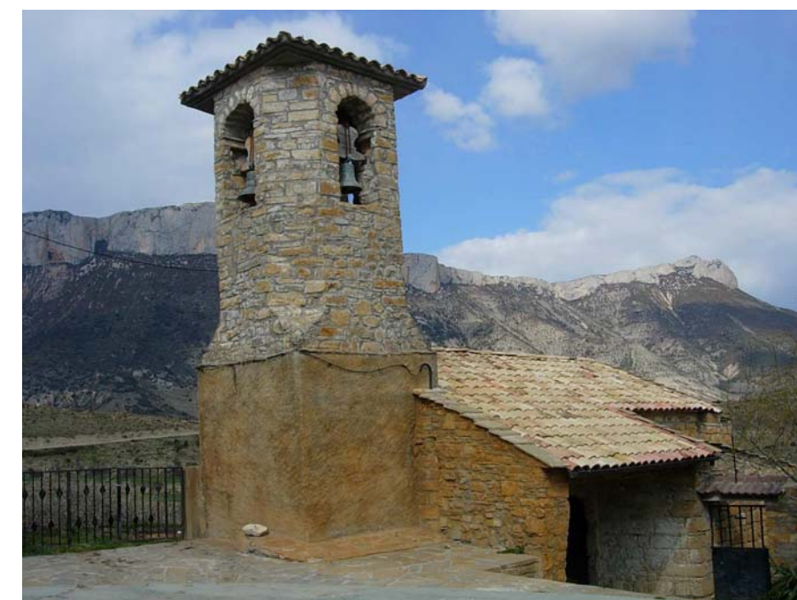
Figura 20.17: El petit campanar de torre de Sant Josep de la Torre de Tamúrcia és una de les petites joies de la Terreta que es veuen exaltades per les altives cingleres de Sant Gervàs