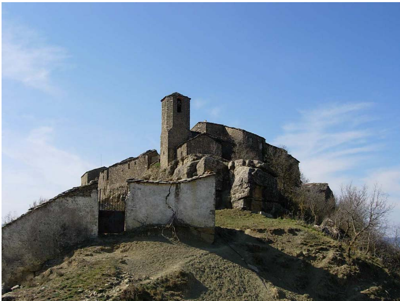
Figura 20.4: El vistós nucli aturonat de Claramunt és un clar exemple dels processos demogràfics recessius que afecten la zona