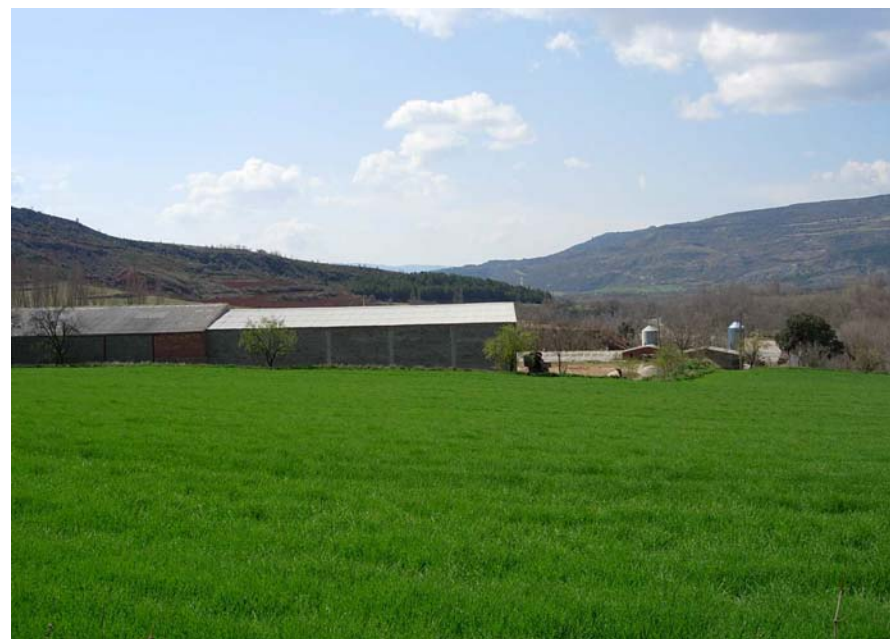
Figura 20.20: L'adequació de les explotacions agràries als nous temps fa aparèixer nous coberts, granges i sitges de notable impacte paisatgístic

A la Terreta continua tenint molta importància l'agricultura, on s'hi conrea cereals (ordi, blat, melca), farratge, gira-sol, lleguminoses, ametllers, oliveres i vinya; i en ramaderia la cria sobretot bestiar porcí, oví i boví, esdevenint les principals activitats que ajuden a fixar la població i mantenir el paisatge actual de la unitat. Tot i això, cal fer referència als impactes com a conseqüència dels canvis en les explotacions agrícoles i ramaderes, ja que moltes granges de porcí i boví properes als nuclis de població i als masos no s'integren visualment amb les tipologies constructives tradicionals. També té lloc una pèrdua de la diversitat agrícola, sobretot a prop del fons de vall, amb una progressiva desaparició del mosaic agrícola tradicional en favor dels matollars i bosquines que s'apropen cada cop més als pobles.