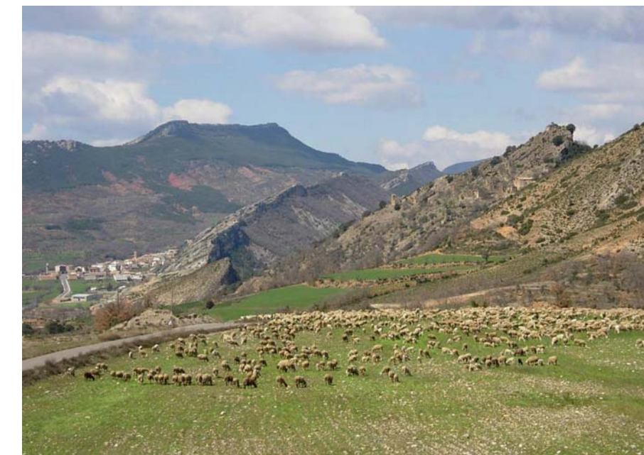
Figura 20.10: El caràcter ramader de la Terreta encara és viu i es testimonia amb ramats d'ovelles que pasturen enmig de veritables paisatges de la transhumància

D'aquests fragments, es pot deduir que el tipus de conreus que es practicaven a la zona eren llenyosos de secà, com l'olivera, la vinya i els ametllers. L'agricultura ha estat sempre deslligada de la ramaderia, ja que aquesta ha tingut sempre un paper secundari en l'economia de l'àrea. Malgrat això, també s'hi han cultivat prats i cereals per a alimentar l'escàs bestiar, compostat en la seva majoria per ovelles, algun cap de boví i ases, utilitzats bàsicament als treballs del camp. D'altra banda, la Terreta ha estat una important zona de pas de ramat transhumant, motiu pel qual des d'antany s'han dut a terme importants fires ramaderes a pobles com Sopeira, Areny i Tolva, ja a l'Aragó.