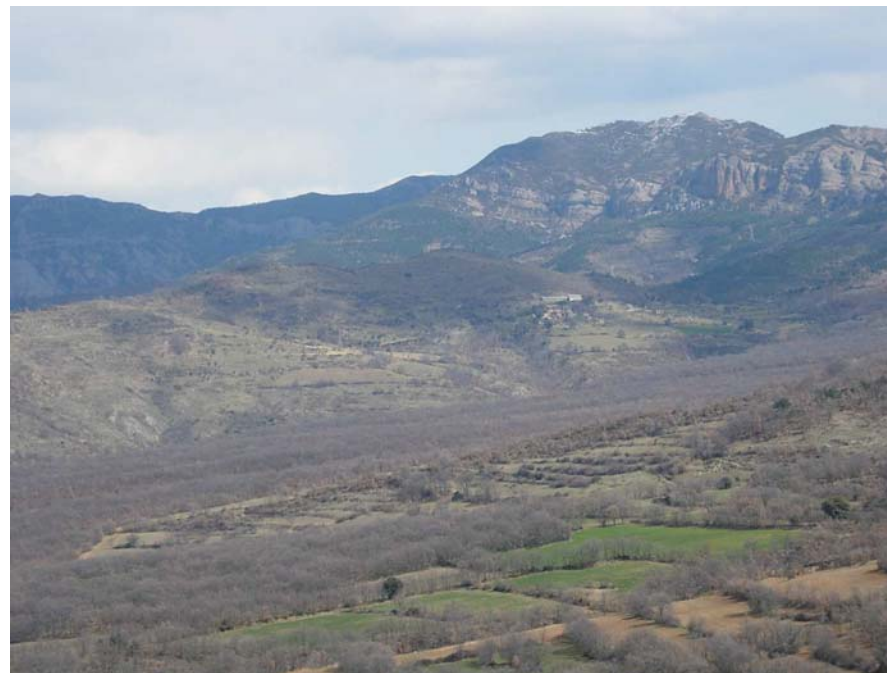
Figura 20.9: La sorprenent roureda d'Aulàs ha mantingut el seu caràcter relictual al marge de les transformacions dels terrenys del seu voltant

centenaris en fan referència, com les que es troben a Cornudella de Badiera i Sas, en plena Terreta aragonesa, però també les rouredes d'Aulàs, lo Roure Sol de Claramunt o el serrat de la Roureda, així com l'Alzina Sola de Montserbós. Aquesta desforestació no fou sobtada, tot i que hi hagué un moment històric associat a la transhumància i a la fabricació de carbó vegetal, a partir del segle XVIII, quan el procés semblà irreversible, fins a tal punt que els processos d'erosió endegats a partir d'aquell moment no han pogut ésser aturats amb les reforestacions contemporànies.