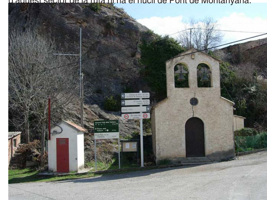
Figura 20.19: La petita capella del Pont d'Orrit és el punt de sortida de la ruta de la vall dels Voltors, que permet conèixer una bona part de la meitat nord de la Terreta, amb un recorregut enmig de paisatges espectaculars

A l'ombra del Montsec: El sector nord de la ruta travessa el coll de Montllobar, anant des de Fígols de Tremp a Pont de Montanyana per la C-1311. La carretera discorre per diverses carenes, al centre de les quals hi ha el coll de Montllobar, divisòria d'aigües entre les dues Nogueres, la Pallaresa i la Ribagorçana. Aquí hi ha un ramal que condueix al castell de Montllobar, d'època medieval i associat a la casa dels Eroles. Seguint la ruta, situada a 986m d'alçada, prop del tossal Gros i dominant la C-1311 que li fa pràcticament tota la volta, hi ha l'ermita de la Mare de Déu de Montserbós, altrament dita santuari de les Capelles. L'itinerari creua diversos masos, molts d'ells avui abandonats degut a la regressió de la pagesia, però testimonis de l'important activitat agrícola i ramadera que tenia aquesta unitat. Al final d'aquest sector de la ruta hi ha el nucli de Pont de Montanyana.