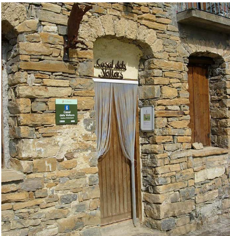
Figura 20.18: El casal dels Voltors de la Torre de Tamúrcia comença a ser un referent simbòlic de la Terreta, que comença a ser coneguda com a «vall dels Voltors»

Els valors simbòlics del paisatge s'expressen, entre d'altres, en les llegendes populars, que a la Terreta versen sobretot de temàtiques relacionades amb el rocam i les coves, trobant exemples com el del Graller del Castellet , ubicada al poble de Sapeira, o el graller d'Espluga Freda , localitzada a la mateixa vila. La proximitat d'ambdós llocs és l'explicació per la qual les històries són tan semblants.