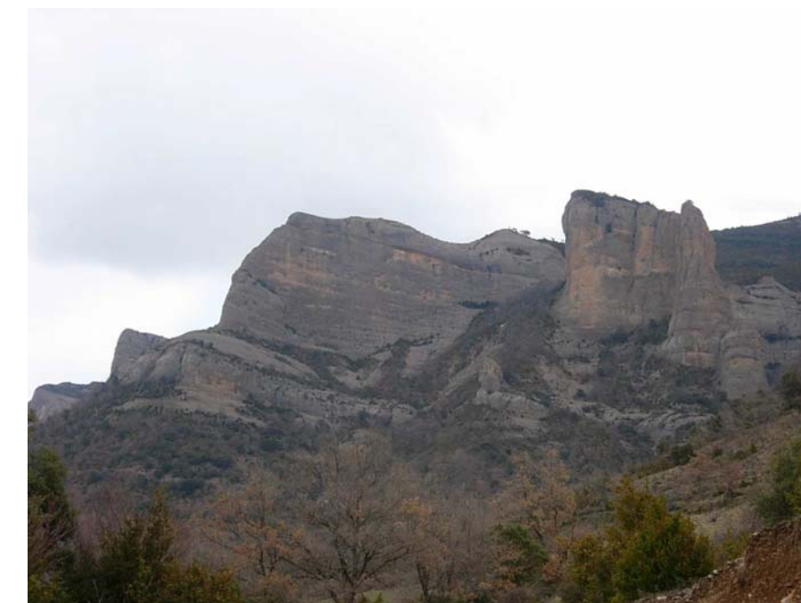
Figura 20.14: Els espadats i canals de les roques de Castelllet són un hàbitat ideal per als rapinyaires que, amb el seu reconeixement com a àrea de protecció, són un veritable reclam i un factor insigne dels valors naturals de la Terreta

fageda meridional. Al nord hi ha una estreta franja del PEIN de la Serra de Sant Gervàs i, al seu extrem sud-occidental, una petita zona de la serra del Montsec. Precisament aquests paisatges es miren de preservar per poder conservar l'extensa colònia de rapinyaires, una de les més importants de Catalunya, on hi ha espècies protegides com el voltor, el trencalòs i l'àguila daurada. Destaquen especialment els voltors, que han dinamitzat el turisme de la zona a través d'itineraris, centres d'interpretació i canyets.