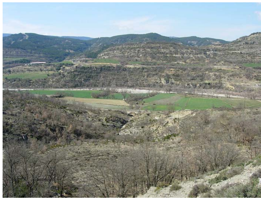
Figura 20.22: Espais com aquest a prop del Pont de Montanyana poden seguir naturalitzant-se degut a l'abandonament de les activitats agràries i poden guanyar pes amb la construcció de vies ràpides de pas entre la plana de Lleida i la Val d'Aran, convertint encara més la Terreta en un territori de pas

Finalment, cal parlar de la disminució del risc d'inundacions del tram fluvial de la Noguera Ribagorçana al creuar la Terreta des de la construcció del pantà d'Escales. Tanmateix la llera del riu encara presenta un aspecte força semblant als grans rius pirinencs abans de les regulacions, és a dir, amb un llit d'inundació molt ampli i molt pedregós característic de les crescudes anuals. Aquest fet es pot explicar per l'absència de poblacions importants arran de riu, exceptuant el Pont de Montanyana, que justifiquin obres d'endegament, i la manca d'àmplies parcel·les agràries a tocar de l'aigua.