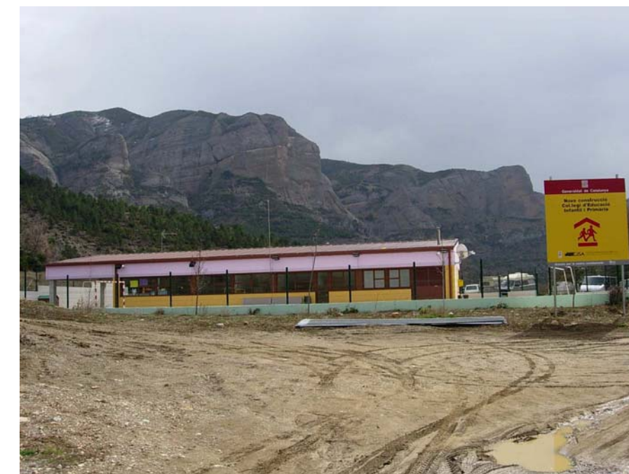
Figura 20.23: A pobles com Espluga de Serra, l'arribada de nous pobladors, joves i amb fills, ha permès la construcció d'un nou col·legi i una renovació de la població que pot comportar una alenada d'aire fresc donant sortida a noves activitats econòmiques a la zona o a mantenir les actuals

Per acabar, no cal oblidar el recent impuls del turisme rural, amb la ruta dels voltors i els itineraris d'observació i descoberta d'aquests rapinyaires i amb les activitats esportives al congost de Mont-rebei, que tot i trobar-se fora de la unitat, esdevé un pol de desenvolupament de tota la zona.