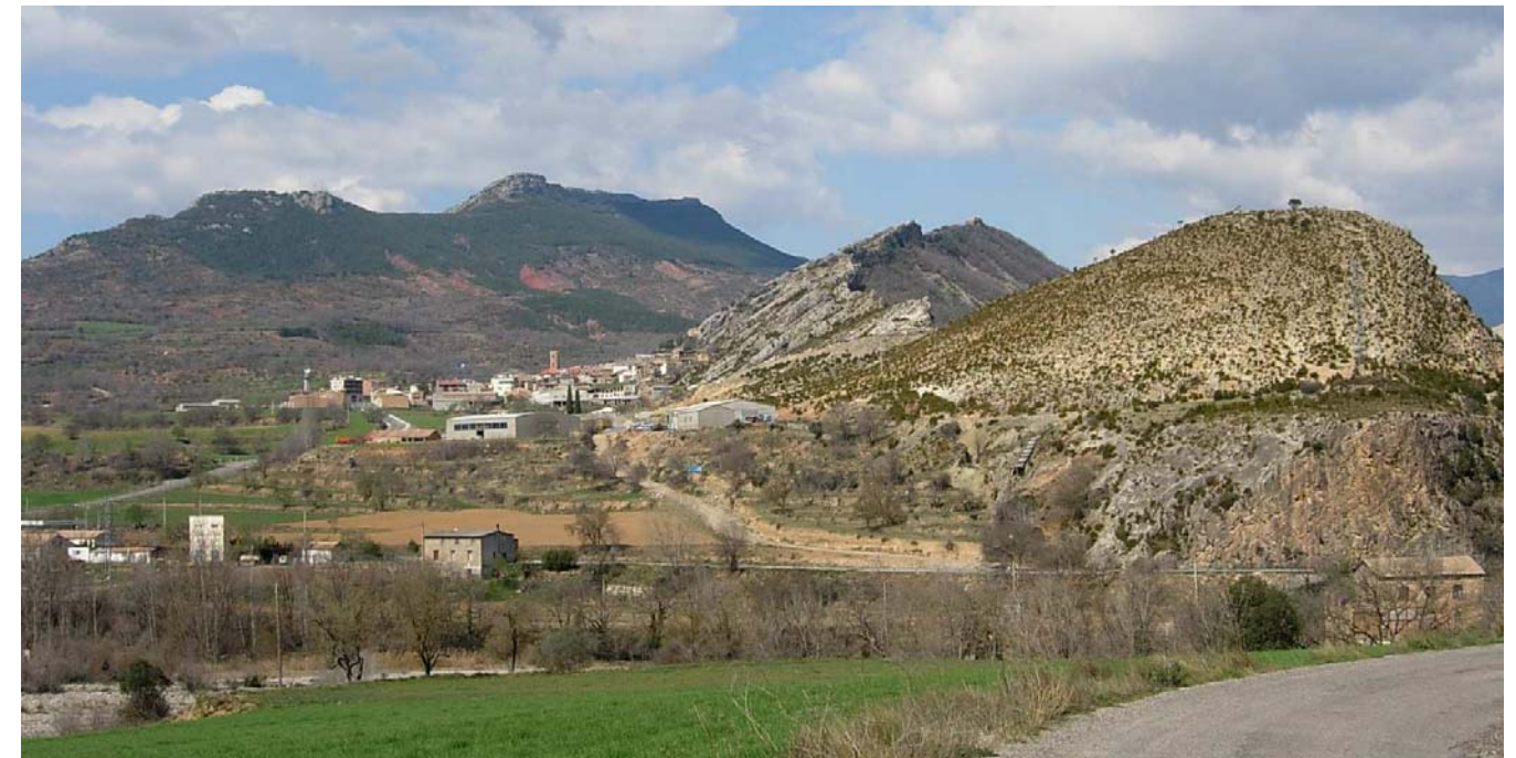
Figura 20.1: La Terreta a l'indret del Pont d'Orrit i d'Areny de Noguera, on la litologia i el mosaic agroforestal juguen a crear bells paisatges