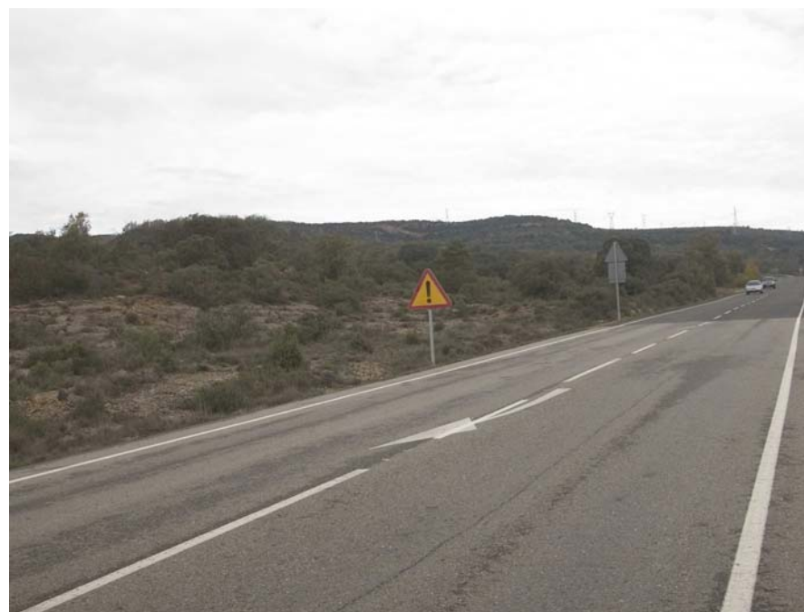
Figura 17.6. La carretera L-512 d'Artesa de Segre a Folquer és una de les dues principals infraestructures viàries de la unitat

Les principals carreteres són la L-512, d'Artesa de Segre a Folquer, que voreja l'extrem occidental de la unitat, la carretera C-1412b de Ponts a Isona, que entronca amb l'anterior a Folquer, i la L-511 d'Isona a Coll de Nargó passant per Bóixols, des d'on surten brancals d'accés als nuclis de La Rua i Gavarrà. No obstant això, hi ha una xarxa densa de pistes forestals asfaltades i de terra que connecten les masies disperses.