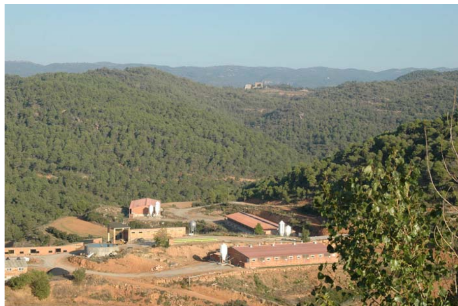
Figura 17.9: Granges del mas de l'Hereu a les proximitats del poble de Bellfort. Al fons, l'església de Santa Maria de Palau de Rialb

El pantà de Rialb, l'últim de nova creació a Catalunya, ha modificat profundament el paisatge de la part lleidatana de la unitat, prop de Tiurana, amb pobles sencers anegats per les aigües de l'embassament. En aquesta part també, es preveuen noves infraestructures al nord del riu Segre, com ara la presa del canal Segarra–Garrigues. Sovintegen les línies elèctriques d'alta tensió, com les del corredor de la Noguera Pallaresa.