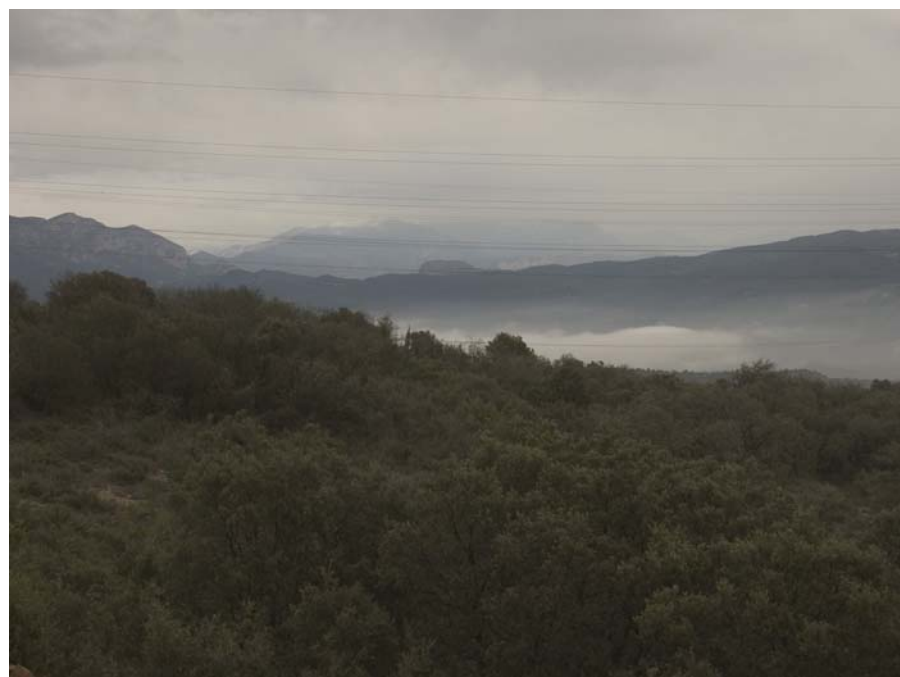
Figura 17.4: Panoràmica des de la carretera L-512 al nord de Folquer, de la boira de la vall del riu Rialb

El riu Rialb és l'element vertebrador d'aquest paisatge. Aquest afluent del Segre neix a sota mateix, al sud, del nucli de Bóixols. Es forma per la unió de dos altres rius: el de Collell, que baixa dels vessants de la serra de Carreu, i el de Pujals, que baixa del tossal de Cabrit, vessant oriental de la serra de Boumort. Es tracta d'un curs fluvial amb un règim hídric mínimament alterat, i que en aquest tram inicial discorre durant dos quilòmetres molt encaixat entre roques, formant un congost estret amb un gran desnivell, l'anomenat forat de Bóixols.