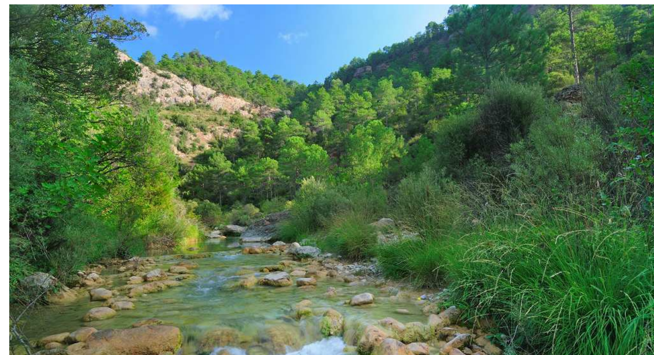
Figura 17.1: El riu Rialb és l'element vertebrador d'aquest paisatge.