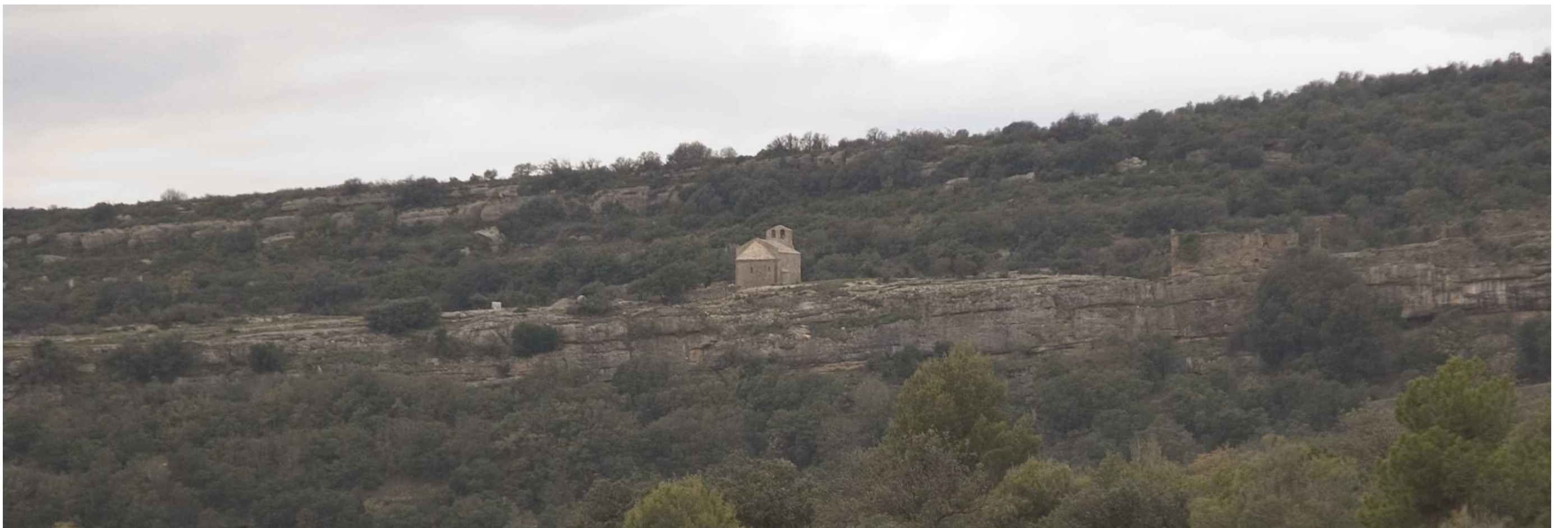
Figura 17.3: Serra Ample i Sant Romà de Comiols. Vista des de la carretera L-512 al nord de Folquer