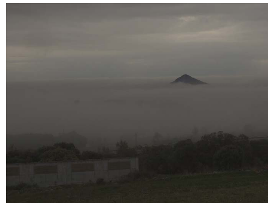
Figura 17.8: Percepció de la boira estacionària a la plana i turó de Montmagastre

A la vall de Rialb, hi destaca la presència d'una denominació d'origen i de qualitat agroalimentària com és la Denominació d'Origen Protegida de la mantega i el formatge de l'Alt Urgell i la Cerdanya com a potencial atractiu comercial.