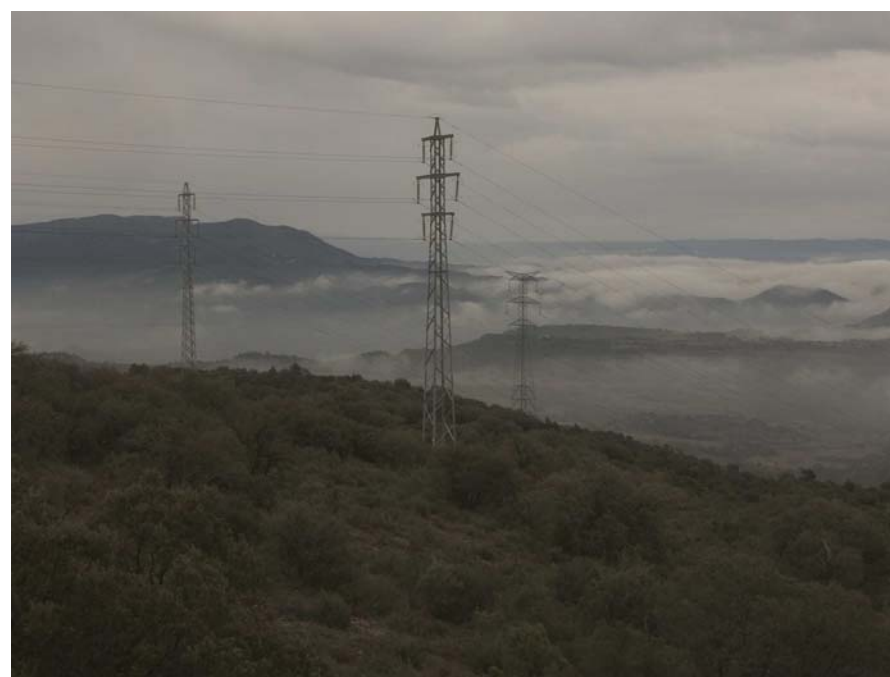
Figura 17.10: Panoràmica des de la carretera L-512 al nord de Folquer, amb les torres elèctriques en primer pla