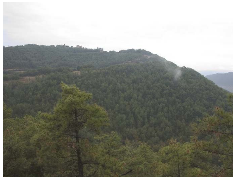
Figura 17.5. Pinedes de pinassa, amb l'ermita de la Mare de Déu de Solers

El clima és mediterrani continental però, a mesura que es guanya en alçada, augmenten les precipitacions i disminueix la temperatura mitjana, per la qual cosa canvia la vegetació: es passa del domini del carrascar, a la part basal, a les rouredes, a la part montana. El principal domini potencial de vegetació és el de la roureda de roure de fulla petita ( Quercetum fagineae ), que es troba en les zones més o menys planes i no gaire seques. Tanmateix, aquestes rouredes són actualment escasses, ja que la vegetació dominant en el paisatge són les pinedes de pinassa ( Pinus nigra subsp. salzmannii ), les quals es poden barrejar a les zones més elevades amb pi roig ( Pinus sylvestris ). El domini potencial del carrascar amb boix ( Buxo sempervirentis-Quercetum rotundifoliae ) es correspon amb les zones més assolellades i pendents; sovint els carrascars es presenten més o menys aclarits, però també hi tenen una certa importància les brolles de romaní ( Rosmarino-Ericion ) i, més localment, els savinars de Juniperus phoenicea . Al fons del congost del Rialb, molt localitzats, hi ha petits retalls de la comunitat termòfila d'alzinar amb marfull ( Viburno tini-Quercetum ilicis )