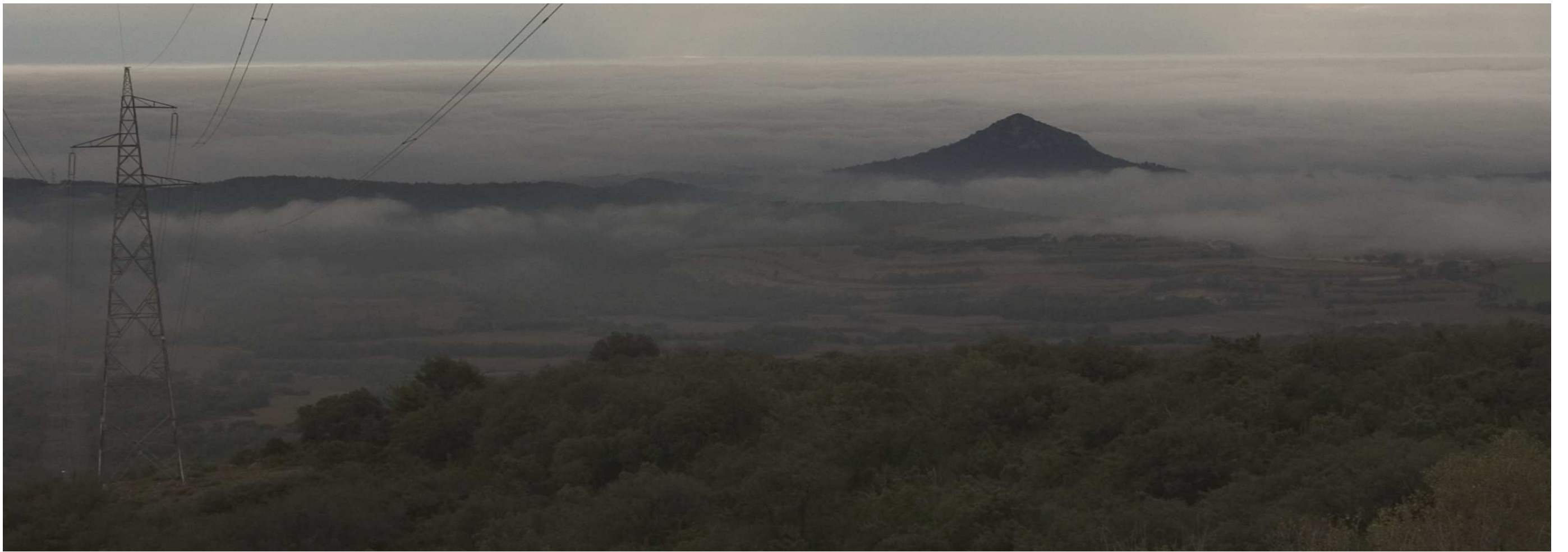
Figura 17.2: Panoràmica des de la carretera L-512 al nord de Folquer, amb Montmagastre al fons