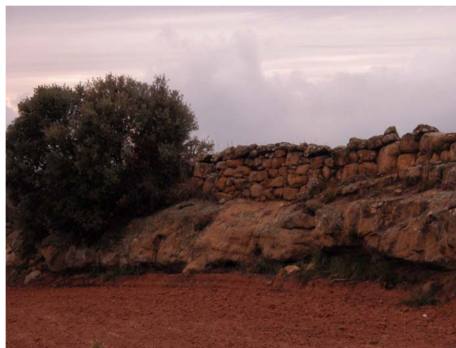
Figura 17.7: Aprofitament dels paleocanals per construir murs de pedra seca

Els valors productius i socials en el paisatge d'aquesta unitat van molt estretament lligats. El dinamisme econòmic és baix; això ha permès conservar la naturalitat del paisatge, però alhora ha fet que les dinàmiques poblacionals tendeixin cap al despoblament. Molts dels petits nuclis i masos escampats pel territori estan actualment despoblats. És el cas de la Rua, nucli documentat des del segle XII i situat sobre un espectacular espadat actualment deshabitat, però amb àmplies vistes sobre la vall del riu Rialb, un castell totalment enrunat i una ermita romànica, la de Sant Antoni. O el nucli de Siall, un poble amb 3 habitants on, baixant pel carrer principal, encara es poden veure cases i eres en força bon estat, fins i tot l'antic forn de pa està intacte.