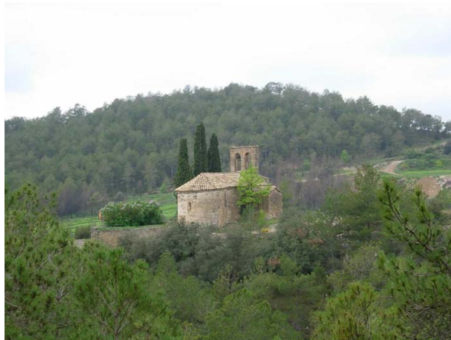
Figura 16.14: L'església de Sant Serni de la Salsa té un gran valor artístic, social i simbòlic i ofereix un conjunt de gran bellesa que, per altra banda, s'ha vist alterat per la instal·lació d'algunes granges de grans dimensions a les seves proximitats

esportives com l'ala delta i el parapent troben en aquests paisatges emplaçaments idonis per a la seva pràctica, així com el trial i el motocròs.