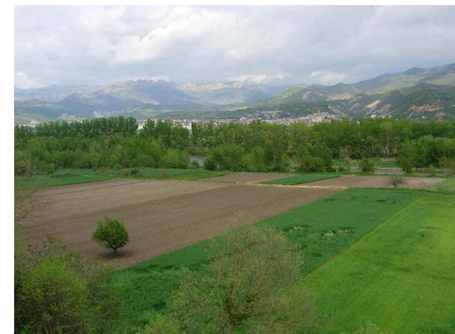
Figura 16.10: Les obres per domesticar l'aigua del Segre han tingut, des de fa molts anys, la finalitat d'obtenir més rendiment de les terres de conreu, com aquests camps a la vora del riu entre Tragó i Oliana

La irrupció de noves activitats, a partir del segle XX, també ha comportat canvis en el paisatge. Polígons industrials, com el de la fàbrica de Taurus fundada l'any 1962 a Oliana, piscifactories, eixos de comunicació i obres hidroelèctriques, principalment el pantà d'Oliana, inaugurat l'any 1959 i el de Rialb el 1999, han provocat una evolució del paisatge, amb nous elements en el territori de gran transcendència visual, però també econòmica i funcional. El dic de la presa del pantà d'Oliana i la cua del pantà de Rialb, amb la futura contrapresa són un clar exemple d'aquests nous paisatges.