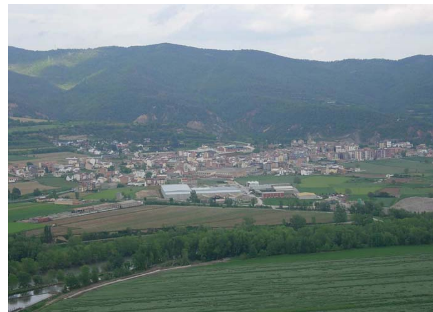
Figura 16.18: Oliana és el nucli més gran, el que més ha crescut i el que concentra més activitat econòmica de la unitat, amb barris de nova creació i un polígon industrial que ha anat guanyant terreny a la fèrtil plana al·luvial que l'envolta

A Peramola, el segon nucli pel que fa a entitat de població, hi ha hagut un creixement residencial d'alguns barris de cases unifamiliars, més aviat disperses, i de tipologia constructiva heterogènia. Tot i això, el perfil del nucli antic es manté sense que s'hagi vist alterat de manera