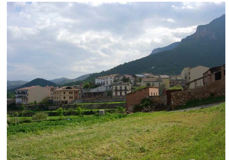
Figura 16.19: Peramola ha vist com darrerament han crescut barris nous al seu voltant que, ara per ara, no acaben d'integrar-se amb l'entorn i el nucli antic, però segueix mantenint el seu caràcter rural vora els plans agrícoles de Tragó i Palau, sota el Roc de Cogul

greu, mantenint la compacitat urbana i l'estructura laberíntica del traçat dels carrers del casc antic. Un dels elements arquitectònics més emblemàtics del poble, la torre dels Moros, situada al sud del nucli, no es troba en massa bon estat de conservació.