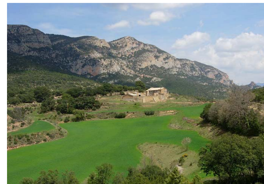
Figura 16.8: L'entorn de Cortiuda forma un interessant enclavament entre la serra d'Aubenc, Sant Honorat i la Roca del Corb, l'espai de característiques més prepirinenques de la unitat

Aquesta unitat comprèn tota la plana d'Oliana, que s'estén de nord a sud al llarg de la ribera del Segre, entre la serra d'Aubenc i la del Pubill. Es troba al sud del grau d'Oliana, on la vall del Segre s'obre després de la presa del pantà d'Oliana.