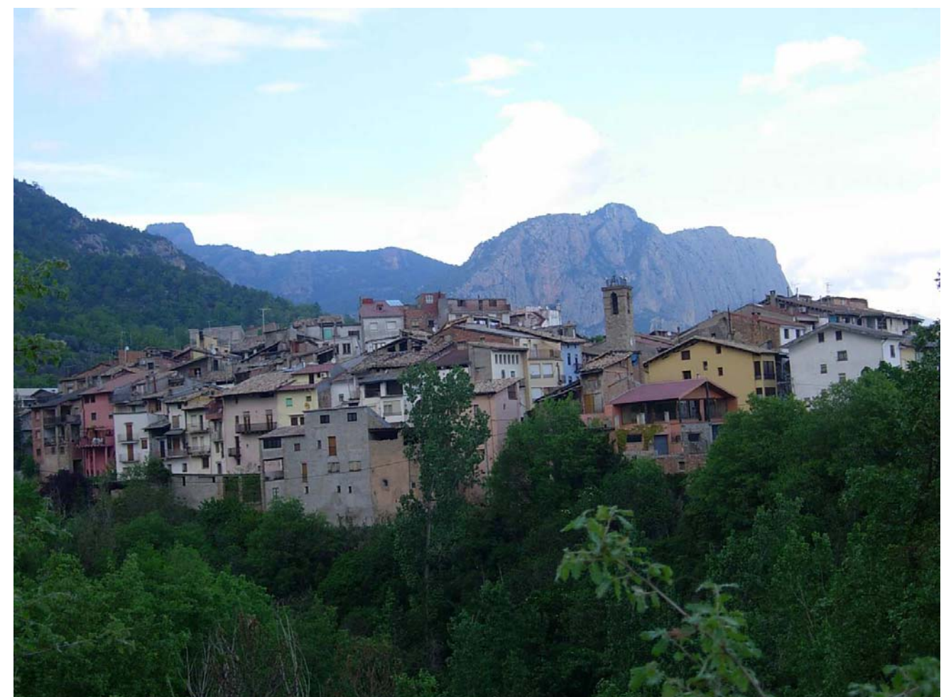
Figura 16.5: El poble de Peramola manté el seu aspecte compacte i alterós sobre el barranc homònim i sota els Rocs de Cogul i Rumbau