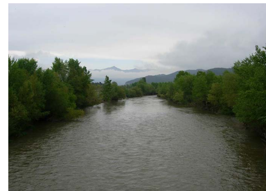
Figura 16.13: El conjunt format pel Segre, les seves riberes i les muntanyes prepirinenques és d'un notable interès estètic. A la fotografia, el Segre a l'antic pont entre Bassella i Aguilar

La unitat ha estat històricament una important zona de pas seguint el congost del Segre, per això hi ha un nombre elevat de torres i castells, molts dels quals es mantenen en estat ruïnós, però que confereixen