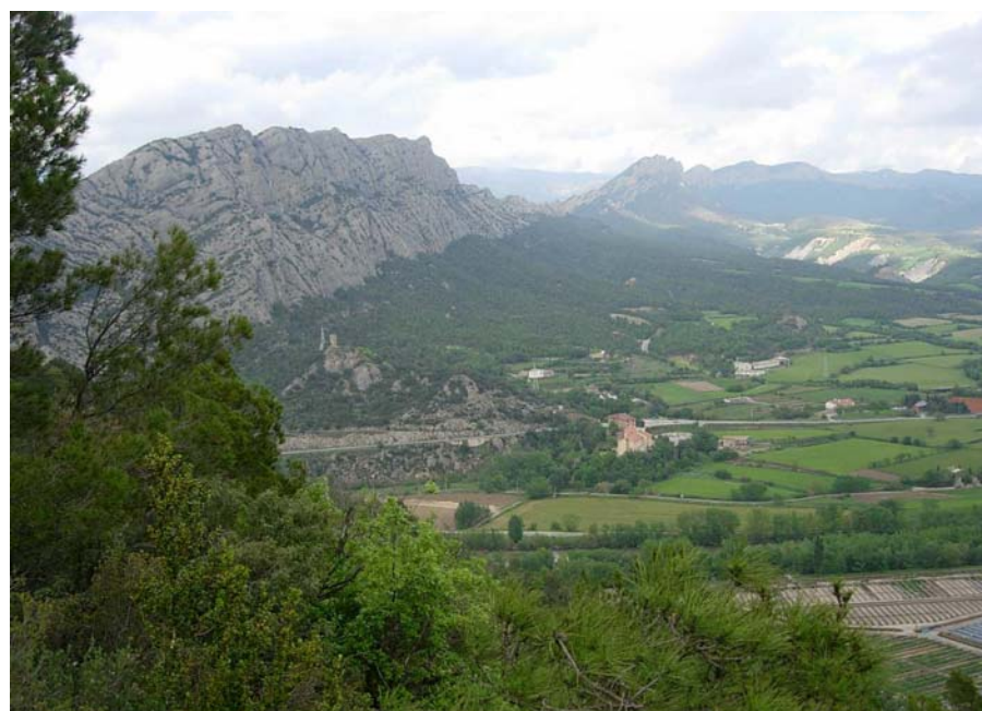
Figura 16.6: Les cingleres de la serra de les Canals són visibles des de gairebé tots els racons de la unitat i són la porta dels Prepirineus i del congost del Segre

La supraestructura del paisatge es basa en el plec anticlinal d'Oliana, de gran rellevància al ser un dels pocs plecs de rerepaís. Aquesta estructura, producte dels esforços del mantell del Montsec, aquí expressat en la muntanya del Coscollet, damunt dels materials de reblliment de la Depressió Central, constitueix una veritable unitat fisiogràfica. Des de l'extrem nord-est de la Vall d'Aran (a la comarca del Solsonès) fins a la serra de Sant Marc, l'anticlinal esventrat per l'acció erosiva del riu Segre i dels seus afluents menors, constitueix un bressol de terres dúctils envoltat de crestalls.