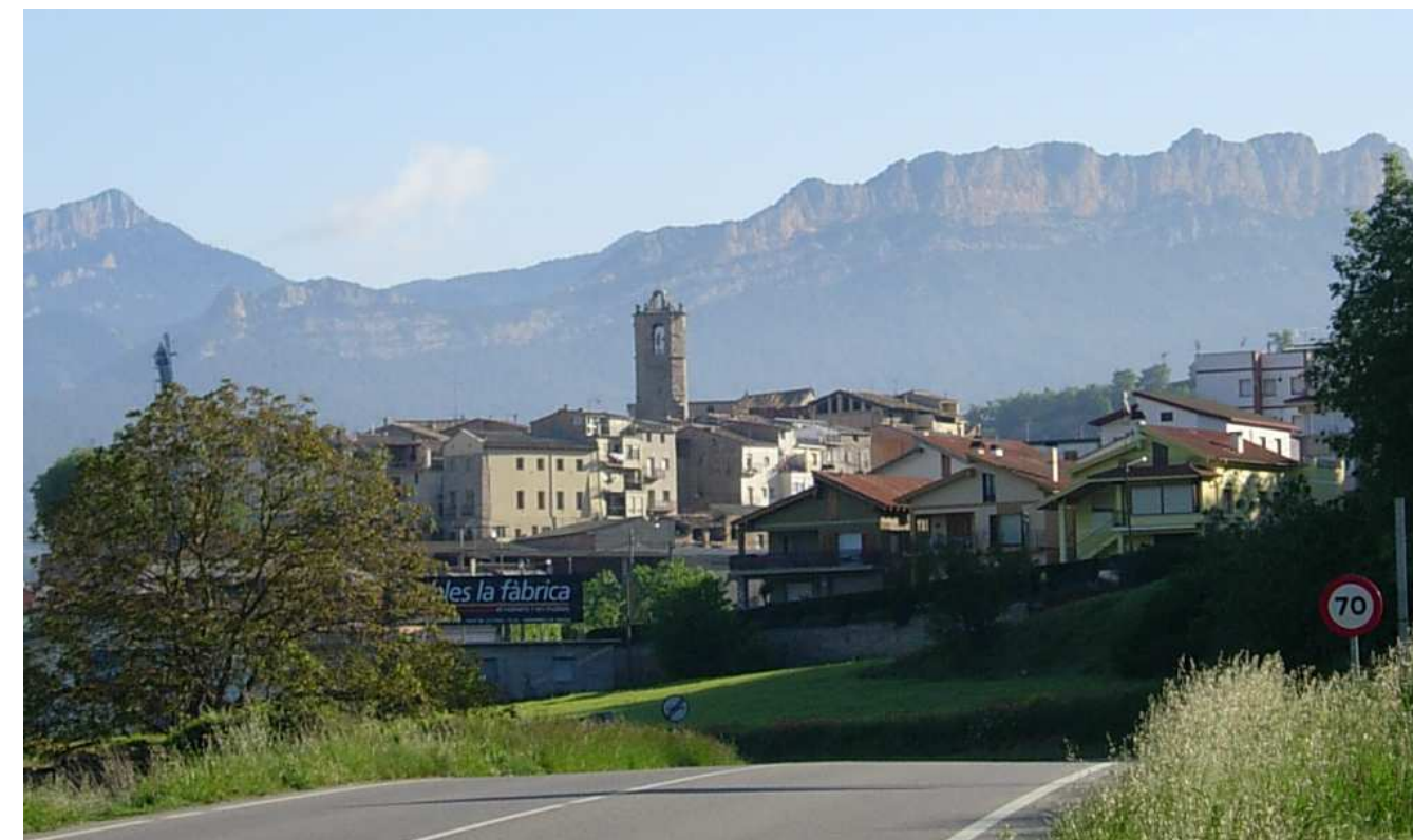
Figura 16.1: Perfil del nucli d'Oliana, el més gran de la unitat, retallat amb les serres prepirinenques de les Canals i de Turp