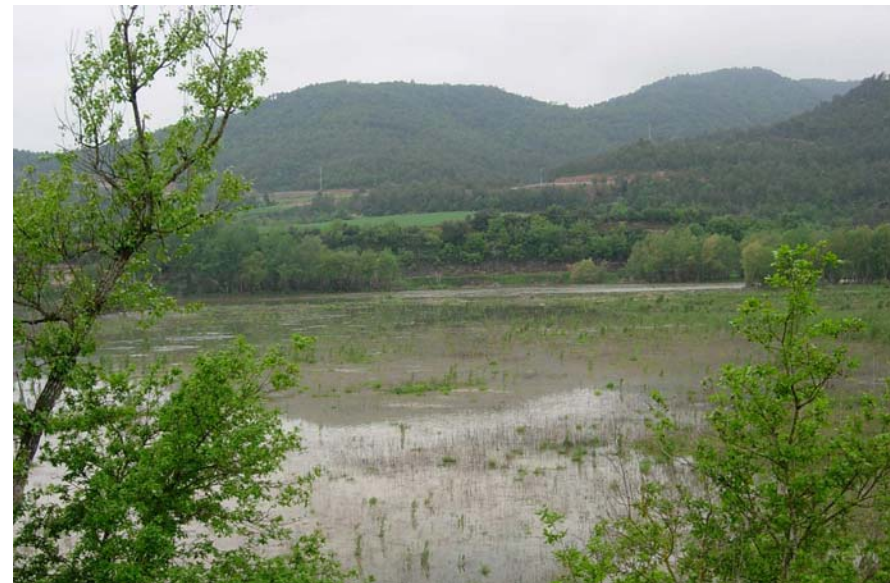
Figura 16.23: L'extrema variació del nivell de les aigües a la cua del pantà de Rialb dona lloc a paisatges poc atractius. El projecte de contrapresa és vital per tal de regular aquesta situació