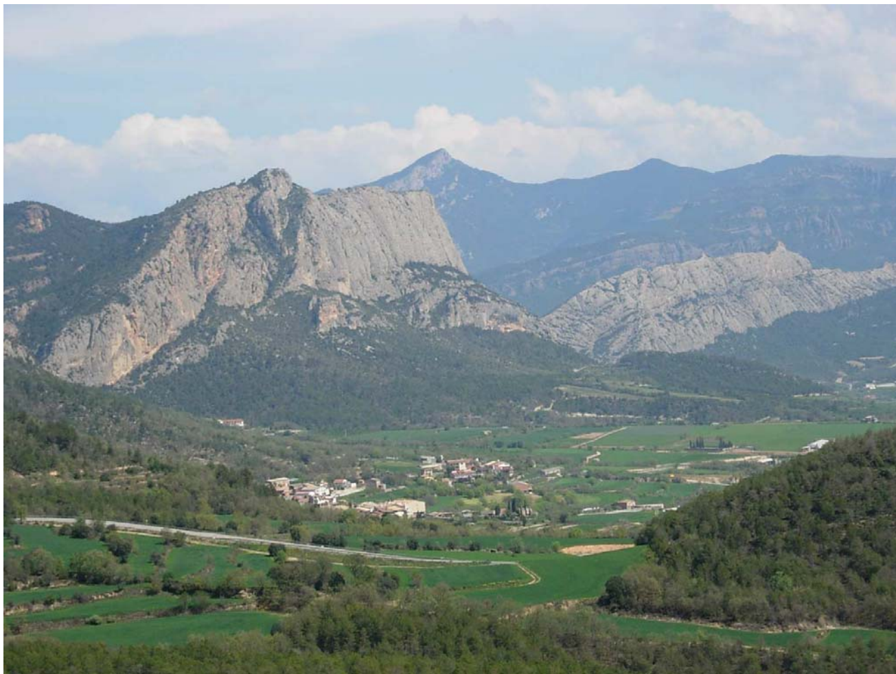
Figura 16.2: Aquesta és la imponent visió dels paratges de la Rodalia d'Oliana, preludi dels replers pirinencs que s'amaguen Segre amunt