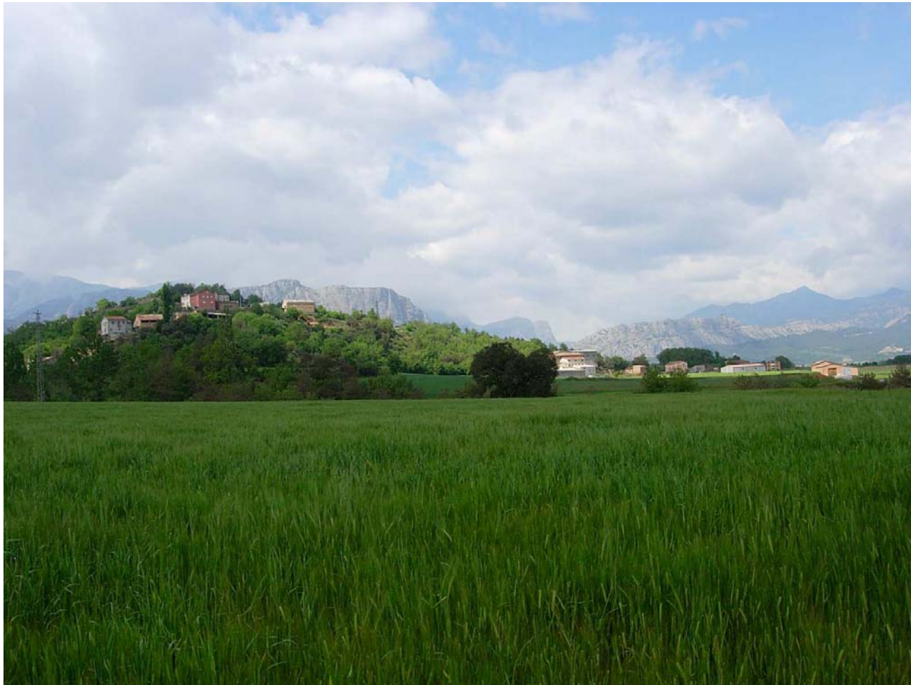
Figura 16.4: El poble de Nuncarga s'enfila disseminat als petits turons entre les àmplies planes agrícoles de Cabana i Palau, vora el Segre