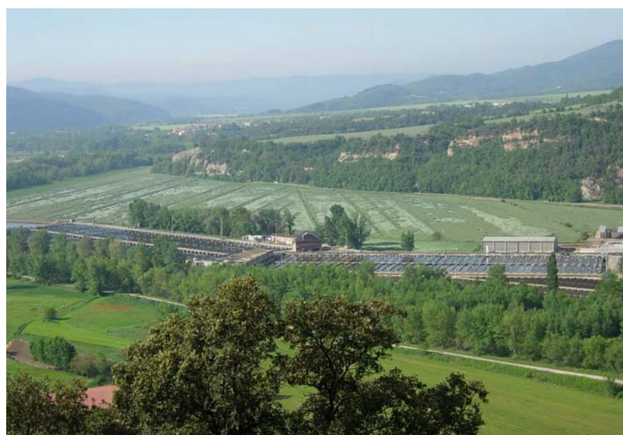
Figura 16.11: La cria intensiva d'animals és una activitat molt arrelada avui a Oliana, tant pel que fa a les espècies ramaderes més comunes com també a peixos com per exemple la gran piscifactoria de l'empresa Truchas del Segre, al municipi de Peramola

El paisatge característic de la unitat és un mosaic agroforestal. A diferència d'altres unitats plenament pirinenques, la Rodalia d'Oliana destaca per la important superfície d'usos agrícoles: 24,7% de conreus de secà i 2,7% de regadiu. Però també es detecta una certa naturalització del paisatge en els antics conreus abandonats, per això la majoria del 26,5% de bosques i prats existents se situa en antigues feixes. Un terç de la superfície està ocupada per pinedes de pinassa que, sumades al 5,6% de boscos de caducifolis i el 3,6% d'escleròfiles, componen un paisatge forestal fora de les zones més planes i del fons de vall.