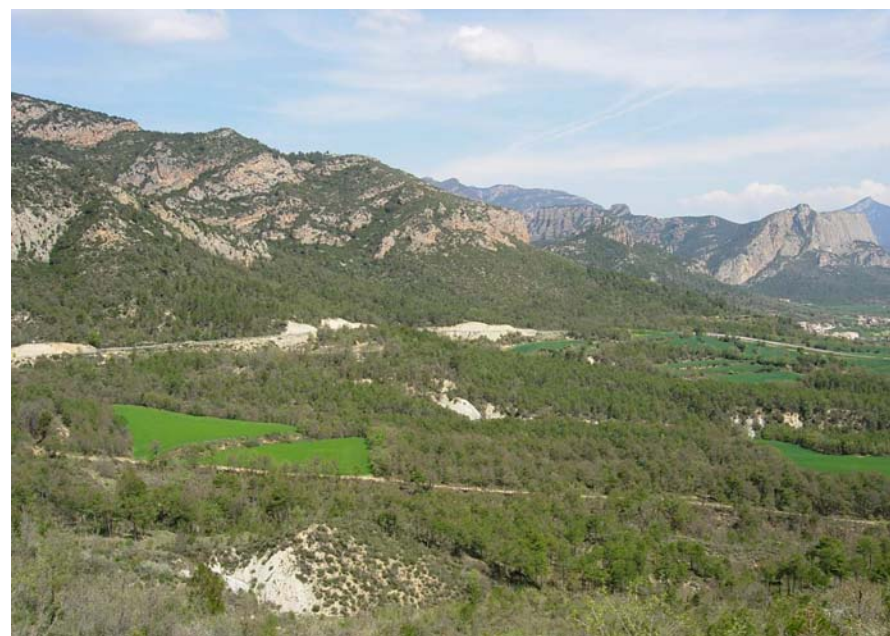
Figura 16.7: Fora de les zones més planes, marcadament agrícoles, el mosaic de boscos, prats i roquissars és omnipresent, com als estreps orientals de la muntanya de Sant Marc

L'àmbit de transició entre el Prepirineu i les terres baixes de la Depressió Central fan que aquesta unitat es caracteritzi per unes variables climàtiques pròpies del clima mediterrani d'influència continental. Les temperatures mitjanes anuals, que volten els 12-13°C, experimenten escasses variacions internes i només en un reduït indret de la Serra d'Aubenc, proper a Cortiuda, a l'extrem nord-oest de la unitat, disminueix aquesta mitjana, amb valors d'entre 10 i 11°C. Les precipitacions mitjanes anuals disminueixen a mesura que hom s'allunya de la muntanya; d'aquesta manera, al terç nord de la unitat, que és la zona més muntanyosa, és on es registren les majors acumulacions de precipitació, entre 700 i 750 mm anuals; les quantitats més reduïdes tenen lloc al terç meridional de la unitat, a la vall del Segre, aigües avall de l'aiguabarreig amb la Ribera Salada, amb valors que oscil·len entre els 600 i els 650 mm anuals.