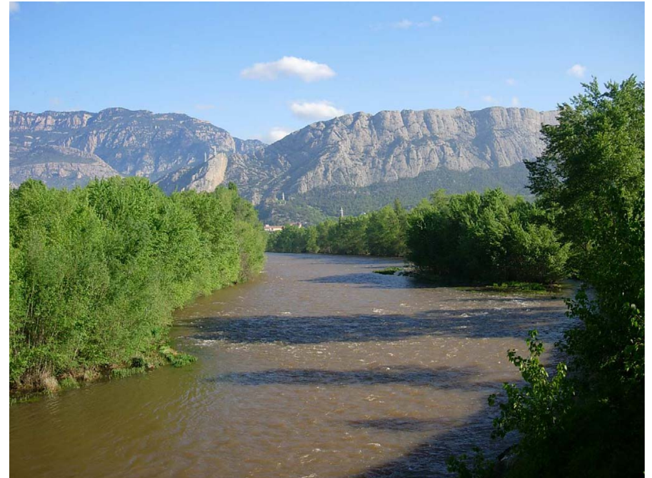
Figura 16.3: El Segre, al pont de Tragó, gaudeix d'una notable vegetació de ribera que contrasta amb les cingleres de les Canals, al nord