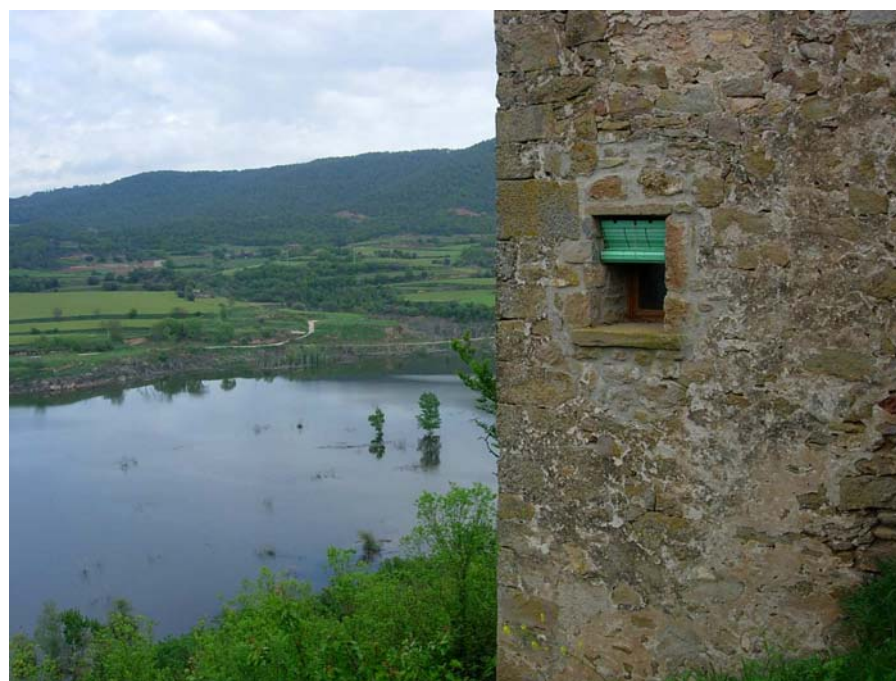
Figura 16.15: La cua de l'embassament de Rialb ja ha inundat les millors terres de conreu i alguns pobles de la riba del Segre. Pobles com la Clua, tot i salvar-se de les aigües, han vist com el seu entorn canviava radicalment

Finalment, els valors simbòlics de la Rodalia d'Oliana tenen molt a veure amb els de la unitat veïna del Congost del Segre. El simbolisme