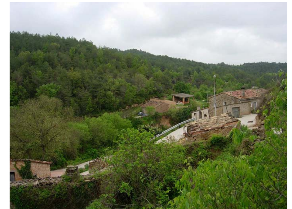
Figura 16.24: Els nuclis de la Ribera Salada, com Altès, es troben envoltats d'un bonic mosaic agroforestal que, tot i mostrar un cert abandonament, es presenta com un atractiu a difondre, en indrets on encara perduren petites clapes de conreus llenyosos tradicionals i hortícoles de gran interès