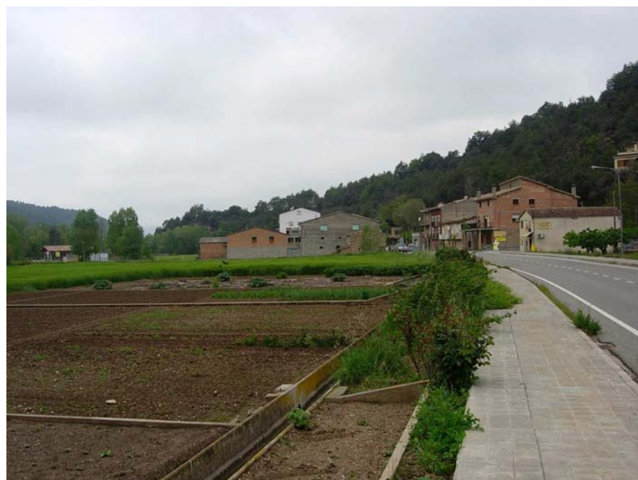
Figura 16.20: El poble d'Ogern intenta atraure els viatgers que utilitzen la C-26 per anar cap al Pirineu i a Andorra i es van obrint petits comerços i allotjaments turístics sempre intentant no traspasar la carretera i mantenir els horts que s'estenen a la vora de la Ribera Salada

carretera perimetral que uneix Oliana amb Ponts (poble ja fora de l'àmbit de l'Alt Pirineu i Aran).