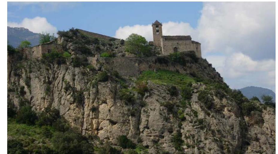
Figura 16.16: La pujada a la Mare de Déu de Castell-Ilebre permet observar un bon tram de la vall del Segre

GR-1, el sender transversal: Aquest itinerari de gran recorregut travessa el Prepirineu català, passant per les unitats de la Rodalia d'Oliana, Vall de Rialb, Conca de Tremp i Montsec i travessant alguns dels congostos més espectaculars i feréstecs d'aquesta zona, com Mont-rebei o