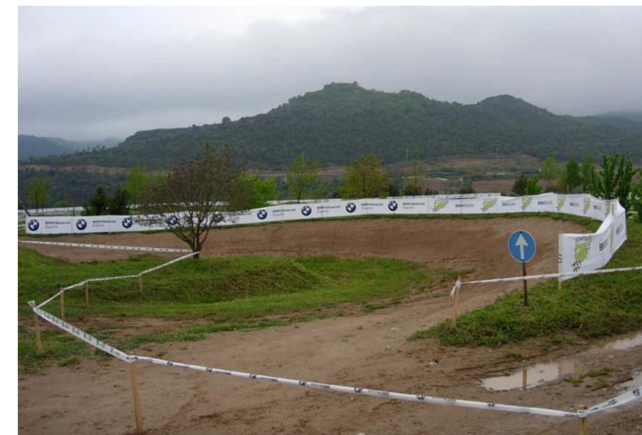
Figura 16.21: Instal·lacions del circuit de motocròs de Bassella

Quant als serveis, la millora de la carretera C-14 pot afavorir l'increment de trànsit en l'eix Lleida-Andorra, arran també de l'arribada del tren d'alta velocitat, i generar oportunitats de negoci a peu de carretera. Això pot comportar un increment de polígons logístics i de serveis lineals a les entrades de les poblacions, amb els conseqüents canvis en el paisatge dels nuclis urbans.