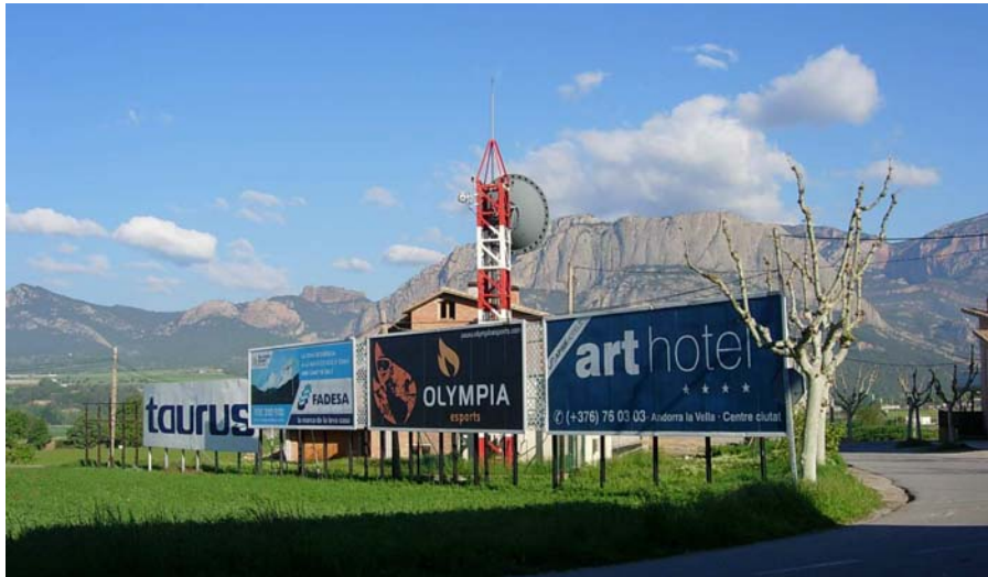
Figura 16.22: La conversió cada cop més accentuada de la unitat en un lloc de pas per aquells que es dirigeixen majoritàriament a la Seu d'Urgell i Andorra queda reflectida en els grans rètols d'entrada a Oliana, en els quals es fa molta més publicitat turística d'indrets del Pirineu interior que no pas de la pròpia vila i la seva rodalia

reequilibri, sense traspasar l'actual carretera C-26 en direcció a la Ribera Salada.