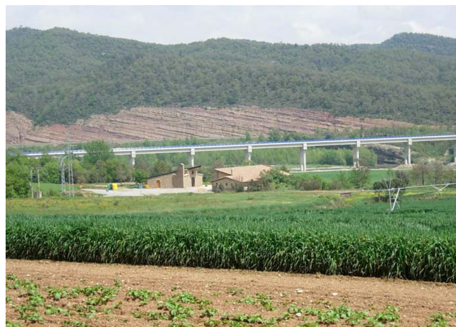
Figura 16.12: Les àrees més planes de la Rodalia d'Oliana es caracteritzen per la implantació de l'agricultura de regadiu destinada a la ramaderia intensiva, que ha de compartir espai amb les noves infraestructures de comunicació que s'hi estan construint, mentre que les terres més muntanyoses queden abandonades i el continu forestal cada cop pren més extensió

C-14, i les rodalies de Peramola, eminentment agrícola. A Oliana aquesta diversificació econòmica s'ha traduït en el territori amb la creació d'indústries com la fàbrica d'electrodomèstics Taurus, l'empresa més gran de l'Alt Urgell, i altres empreses del polígon industrial. També té una arrelada presència a la ribera del Segre la piscifactoria de l'empresa Truchas del Segre, així com tot un seguit d'equipaments de serveis que es van instal·lant a redós de la vila. Altres equipaments turístics com el Motocròs Parc, situat a prop de Bassella, l'àrea de bany d'Ogern i les activitats extractives al llit de la Ribera Salada també juguen un paper protagonista en aquests paisatges.