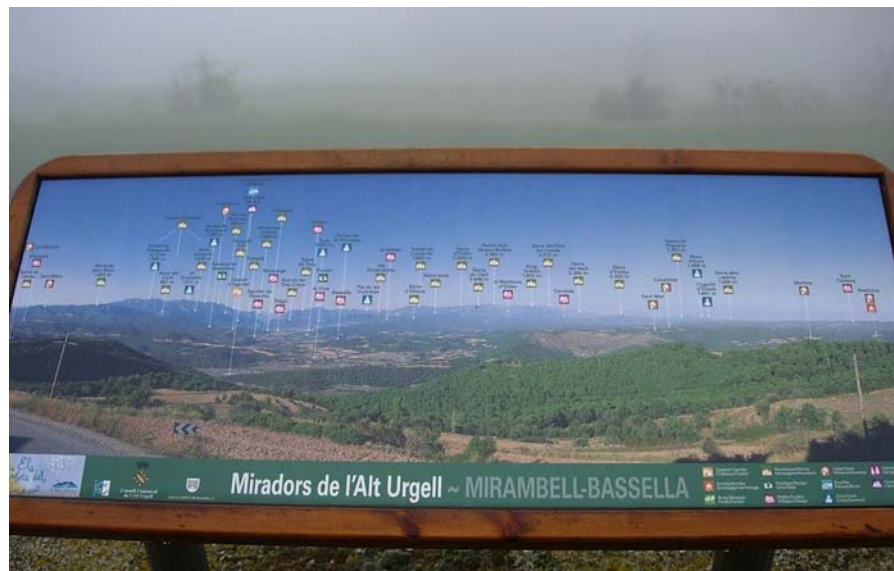
Figura 16.17: La taula d'orientació situada al poble de Mirambell permet gaudir, des de la seva privilegiada situació, d'una de les millors panoràmiques de la Rodalia d'Oliana i reconèixer molts dels seus punts més emblemàtics, tant de la plana com del murallam muntanyenc que la tanca pel seu extrem nord

riu Segre, seguint la carretera local que surt des d'Oliana cap a Les Anoves i poc després d'enfilars les primeres pendents, hi ha un ramal a mà esquerra que porta a Sant Andreu del Castell (nº 76), l'església i les ruïnes del castell que marquen l'antic emplaçament de la vila d'Oliana. La construcció s'erigeix sobre un promontori rocós que domina tota l'horta d'Oliana regada pel riu Segre.