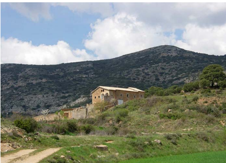
Figura 16.9: Les masies són elements definitoris del paisatge de la unitat i avui només les més allunyades, com aquesta de Cortiuda, mantenen vestigis dels conreus d'oliveres i de fruita seca, de molta més tradició en aquestes terres en temps passats

Les disputes entre el llinatge del castell de Cardona i la catedral de la Seu foren una constant que s'aturà el 1552 amb la propietat dels darrers, que s'allargaria fins a les darreries de l'antic règim. Aquest bescanvi de mans de les propietats de bona part del territori de la unitat tenia un reflex en el paisatge ja que, en bona mesura, les disputes sempre queden reflectides en actes de roturació de terres, abandonaments forçats d'hisendes o incendis provocats per causes polítiques, entre d'altres expressions que determinen fortament les condicions de moltes de les terres ermes i aspres actuals. D'altra banda, el cultiu de la vinya i l'olivera, dels quals encara ara se'n té testimoni viu en el paisatge, tenen l'origen en aquest dilatat període.