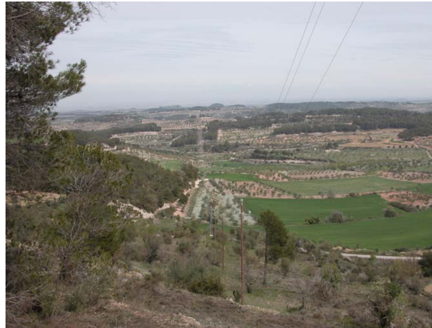
Figura 9.11. Paisatge agroforestal des del tossal de Solans, vora d'Omells de na Gaia, un excel·lent mirador (03.04.2006).

A continuació es pot establir una seqüència gradual, en consecutius plans de visió - de serres, monts i serrats -, que conformen un teló amb múltiples capes. Per últim, resten potencialment com a horitzons permanents de referència visual la serra del Montsec. Un fet ben característic és que no és possible establir contacte visual amb la població veïna de Vinaixa.