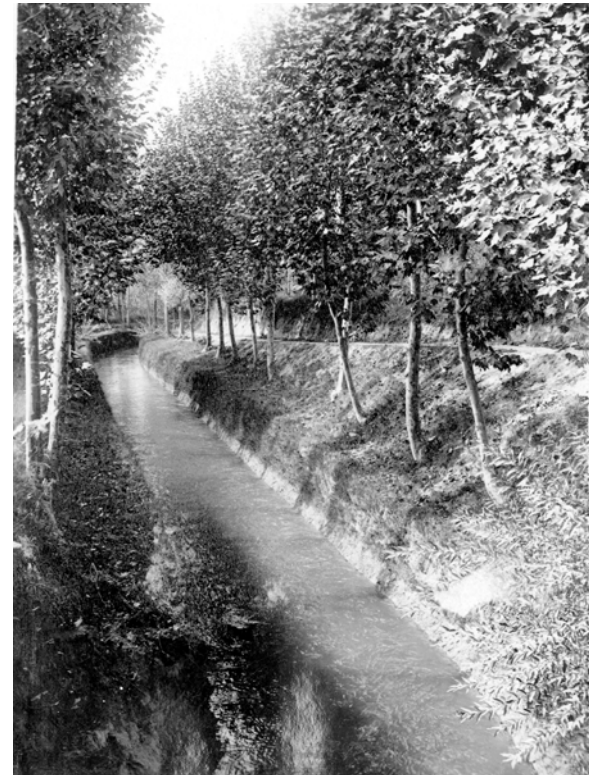
Figura 9.8. El canal d'Urgell que rega l'extrem nordoest de les Borges Blanques, en una imatge antiga on es pot copsar la conservació de la banqueta vora el canal.

Al fons documental de l'Institut d'Estudis Ilerdencs es conserven algunes fotografies antigues d'aquesta unitat, com les de Ciutadilla (fig. 9.4) i les Borges Blanques (fig. 9.8) que es reproduïxen en aquest document.