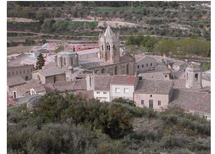
Figura 9.9. Monestir cistercenc de Vallbona de les Monges (03.04.2006).

XV i XVI; el castell de Guimerà , del qual tan sols resten ruïnes i una torre de guaita a la part alta de la població; el castell de Rocallaura , del qual resta un petit portal que mira a la serra del Tallat i, en darrer terme el castell de Vallclara del qual en queda una portada.