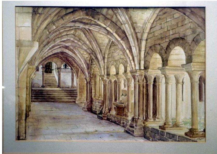
Figura 9.7. Claustre del monestir de Vallbona de les Monges. Obra de C. Altadill (1991) per el fons pictòric de la Diputació de Lleida.

L'expressió pictòrica del territori es fa palesa, principalment, en la imatge del santuari de Vallbona de les Monges, recollida pels mestres pintors en múltiples perspectives mitjançant olis, aquarel·les i altres tècniques. Es pot veure, en aquest sentit, un exemple del pintor Carles Altadill referit al claustre del monestir de Vallbona de les Monges.