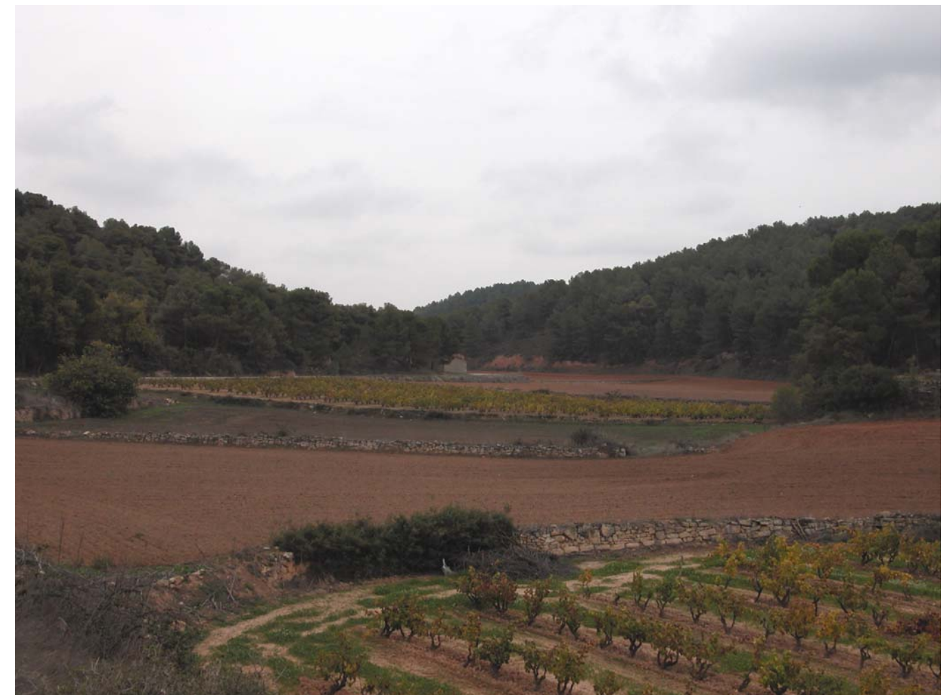
Fig 9.1. Paisatge a la vora dels Omells de na Gaia. Imatge presa el mes de novembre de 2005.