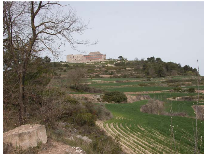
Figura 9.10. Santuari del Tallat, vista des del sud (03.04.2006).

També són un valor simbòlic els antics camins ramaders i dels traginers, com el camí de les Egües, que travessava d'est a oest tota la serra del Tallat, des de Forés fins a Senan, pel capdamunt del serrat. De fet, la serra del Tallat ha estat històricament lloc de pas de la Plana de l'Urgell al Camp de Tarragona, i encara té una forta identitat l'antic camí ral que passava pel santuari del Tallat en direcció a Solivella, així com l'antic hostal del Tallat, situat a la cruïlla de camins a dalt de tot de la carena.