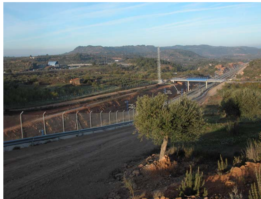
Figura 9.3. Via del TGV al seu pas pel terme de l'Albi. Panoràmica des del coster de les Forques (18.11.2005) amb el massís dels Bessons al fons.

Hi ha tres infraestructures de tractament de residus i també s'hi creuen quatre línies d'alta tensió i un oleoducte procedent del complex petroquímic de Tarragona.