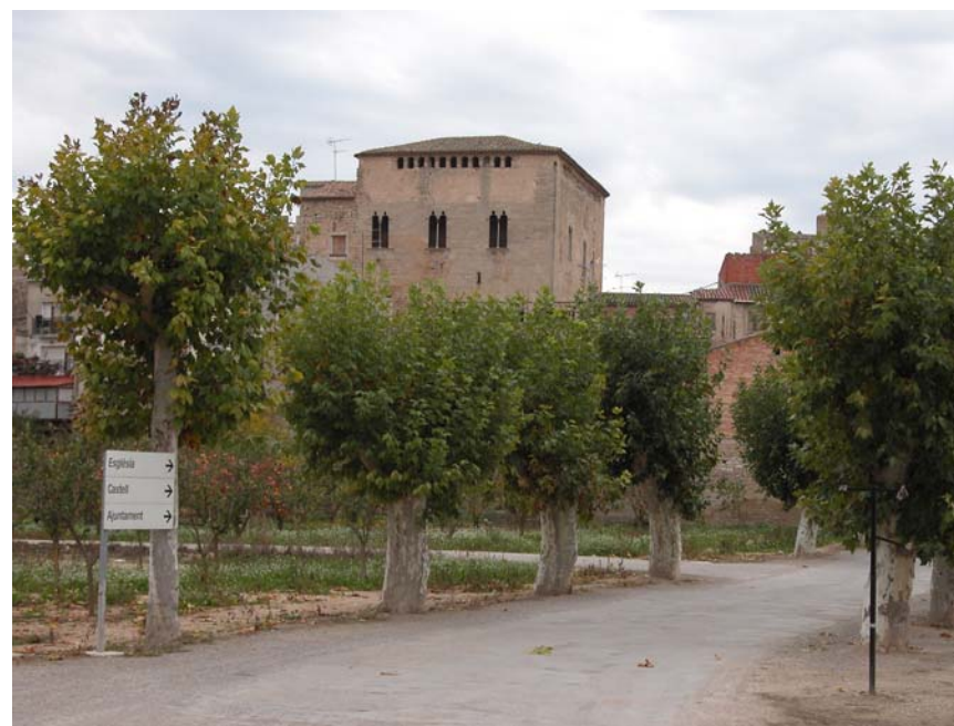
Figura 9.5. Imatge de l'interior del nucli de l'Espluga Calba (04.11.2005).