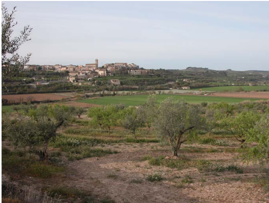
Figura 9.6. Nalec rodejat per un paisatge de fruterars de secà (03.04.2006).

sector de Senan, al Camp de Tarragona, però mostra més heterogeneïtat per la presència d'altres elements al territori pertanyent a les Terres de Lleida.