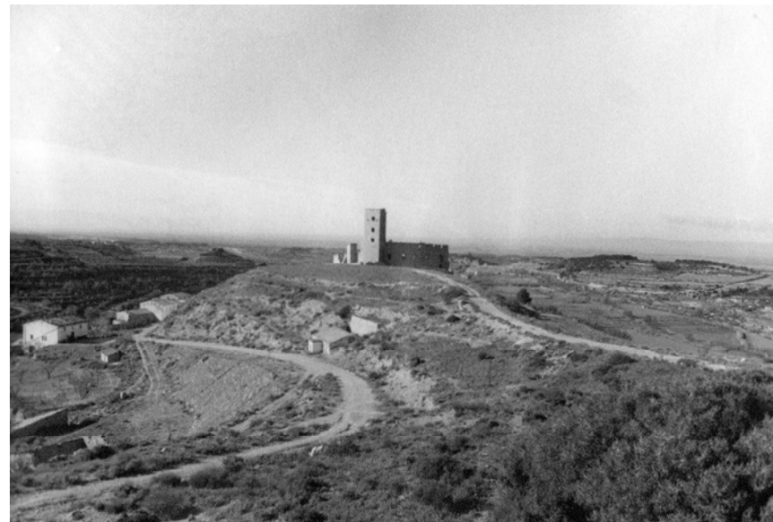
Figura 9.4. Vista exterior del castell de Ciutadilla (1980).

Un element del paisatge molt estès per tot aquest territori són les construccions de cabanes de volta, masos i murs de pedra seca, aixecats durant el segle XIX. Els murs foren imprescindibles per poder contenir l'erosió dels cultius abançalats, terres guanyades al bosc i la bosquina en situació de fort pendent. D'aleshores ençà, els principals canvis que s'han produït en el territori responen al predomini d'un o altre cultiu (en diferents períodes: ametller, olivera i vinya), per bé que els darrers anys la implantació del reg de suport i l'aplanament de relleus seus han comportat un seguit de noves transformacions amb fortes afectacions en el paisatge.