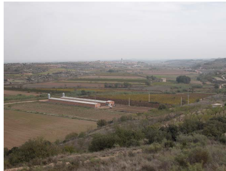
Figura 9.2. Sant Martí de Maldà i la vall del riu Corb, des de dalt dels dipòsit de Belianes (28.10.2005).

Vegetació i usos del sòl: La vegetació és clarament mediterrània i pertany al domini potencial del carrasquer continental ( Quercetum rotundifoliae ), per bé que en llocs enlairats, i a l'obaga, també es troba representada la roureda de roure de fulla petita ( Viola willkommii-Quercetum fagineae ), tot i que de forma fragmentària. Actualment les principals formacions vegetals que dominen el paisatge són les brolles termòfiles de romaní ( Rosmarino-Ericion ), ben caracteritzades per la presència de bruc d'hivern ( Erica multiflora ) i gatosa ( Ulex parviflorus ). En la major part del territori aquestes brolles presenten un estrat arbore de pi blanc ( Pinus halepensis ) força dens. D'altra banda, també hi trobem garrigues ( Quercetum cocciferae ). El carrasquer és poc extens, restringit als llocs enlairats i no aptes per al cultiu. A les obagues és freqüent trobar-hi petits retalls d'alzinar litoral ( Viburno tini-Quercetum ilicis ), representat per l'alzina ( Quercus ilex subsp. ilex ), i sobretot per les seves espècies acompanyants: arboç ( Arbutus unedo ), marfull ( Viburnum tinus ), galzeran ( Ruscus aculeatus ), etc.