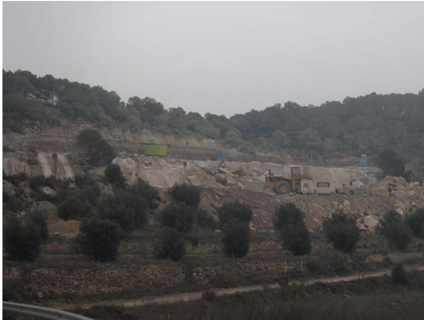
Figura 9.12. Pedrera al terme de Maldà, Prop de la carretera d'Espluga Calba a Maldà (04.11.2005).