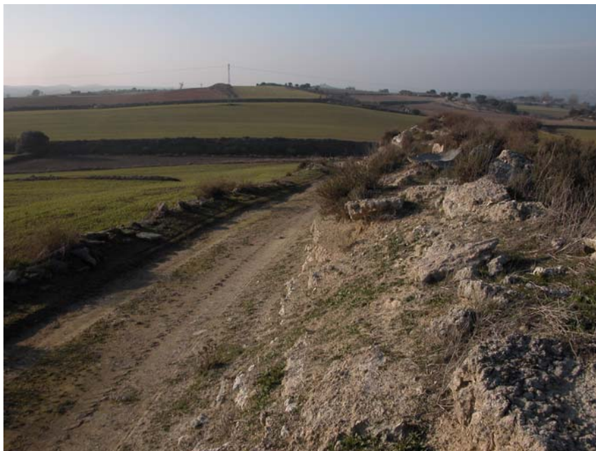
Figura 20.1. Camí i afloraments de guixos al nord de Bellmunt (16.12.2005).

Els materials geològics representats corresponen a paquets de roques evaporítiques, principalment guixos d'edat terciària, que afloren extensament per diapirisme (fig. 20.1), així com per gresos, argiles i limolites carbonatades. Tots aquests materials es troben disposats en estructura anticlinal.