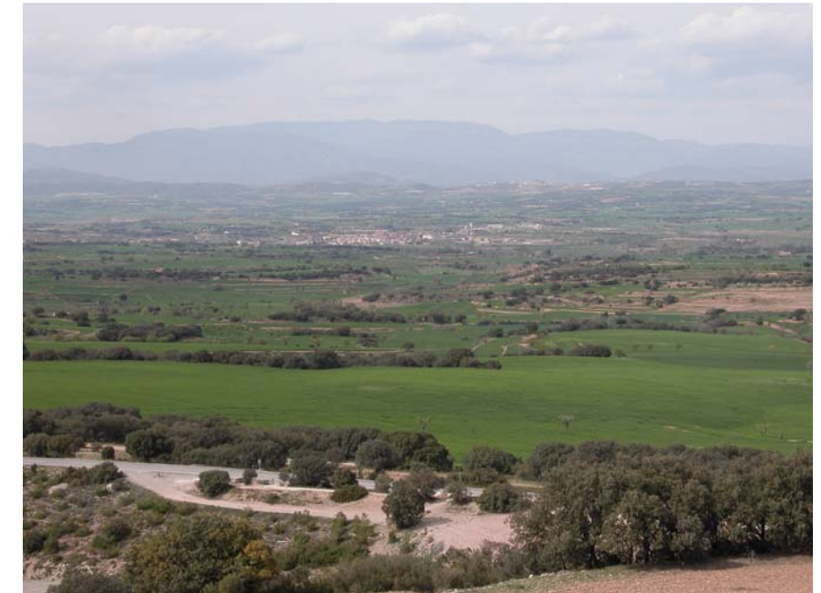
Figura 20.4. Conreus i carrascars a la serra d'Almenara en el vessant nord (03.04.2006)

Un elevat percentatge de territori posseeix hàbitats d'interès comunitari no prioritari, com ara els carrascars, així com també hàbitats d'interès comunitari prioritari (fig. 20.4).