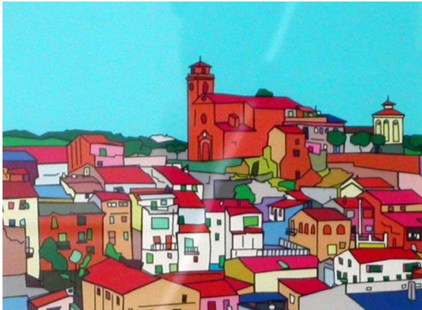
Figura 20.3. La Sentiu de Sió. Obra de signatura il·legible (2001) que forma part del fons pictòric de la Diputació de Lleida.