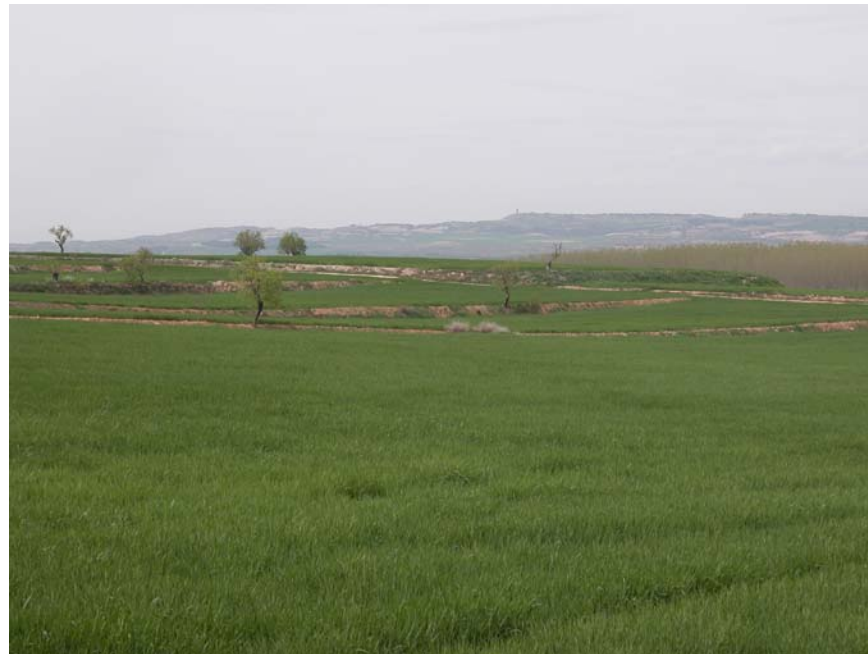
Figura 20.7. Vista de la silueta de serra d'Almenara, i el Pilar homònim, des de Santa Maria de Montmagastrell. La fragilitat de l'espai és alta (03.04.2006).

- Constitueixen zones amb alta fragilitat visual la carena de la serra d'Almenara a la zona sud-oest de la unitat, perquè té un alt grau d'exposició. Aquests cims persisteixen en la imatge global del paisatge (fig. 20.7).