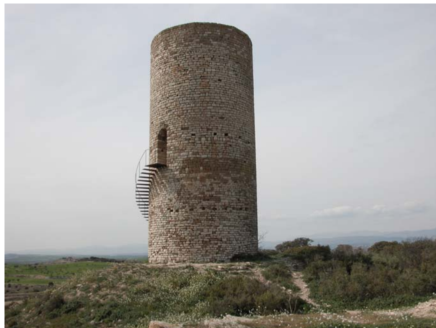
Figura 20.5. El Pilar d'Almenara, torre rodona del segle XI. Punt de referència del territori i excel·lent mirador per observar el paisatge d'aquesta i altres unitats de paisatge (03.04.2006).

Les manifestacions religioses transcorregudes al llarg de la història o que tenen lloc avui en dia, es limiten a alguna processó, per exemple la Processó de Corpus Christi a Montgai.