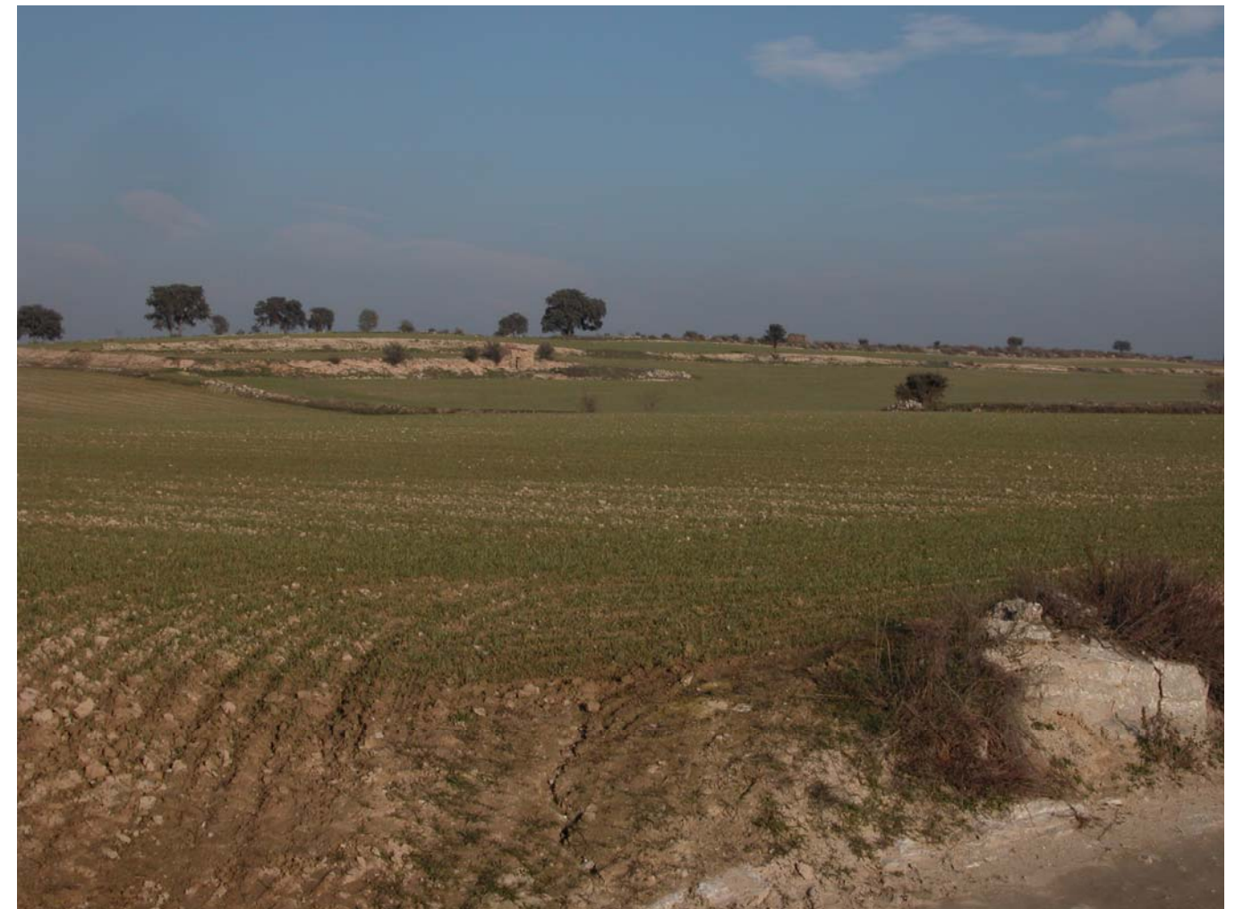
Conreus de secà i carrasques als marges, entre Montgai i Bellmunt. Imatge presa el mes de desembre de 2005.