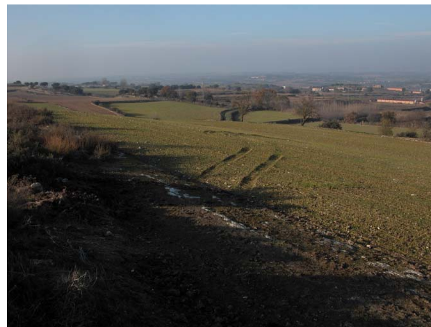
Figura 20.2. Conreus de secà entre Bellmunt d'Urgell i Montgai. La dominància visual correspon als cultius herbacis extensius de secà (16.12.2005).

No hi ha a tota la unitat nuclis urbans remarcables, només alguns assentaments a la zona més perimetral, a les cotes més baixes, com la Sentiu de Sió, al límit nord-oest amb el Baix Sió ; Bellmunt d'Urgell, al límit sud amb la Plana d'Urgell ; i Montfalcó d'Ossó, a l'extrem més oriental.