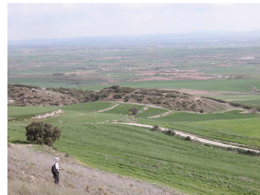
Figura 20.6. Vista dels conreus al peu de la serra d'Almenara, des del coster meridional. Al fons es pot veure la unitat Plana d'Urgell (03.04.2006).

Els principals miradors de la unitat es troben a Bellmunt d'Urgell (panoràmiques a la unitat Plana d'Urgell , i a la faixa més meridional de la unitat); Pilar d'Almenara (panoràmiques a les unitats Baix Sió , Alt Sió , Plana d'Urgell , Vall del Llobregós en la meitat occidental i els Aspres de la Noguera ; també s'hi percep el paisatge de la pròpia unitat en el terç de llevant) (fig. 20.6).