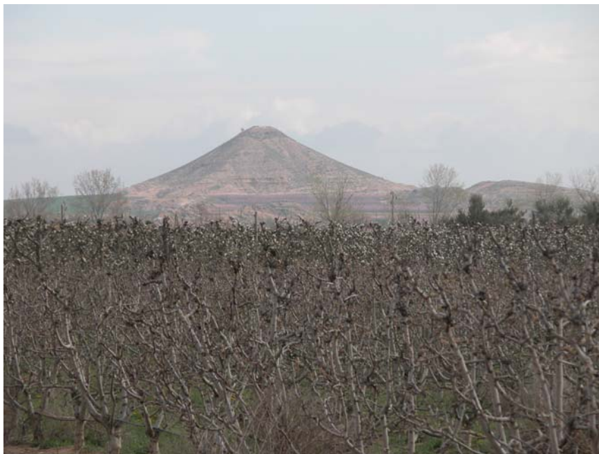
Figura 13.1. Fruïters i turó de Montfred al fons, al terme de Seròs (20.03.2006).

El territori presenta relleus ondulats que augmenten d'alçada a mesura que ens allunyem del riu Segre. Els turons sovintegen a tot el territori; destaquen la serra de Montllober (250 m), serra Llarga (170 m), Serrabrisa (231 m), tossal de Folies (178 m) i tossal de Montfred, de gairebé 200 m d'altitud (fig. 13.1).