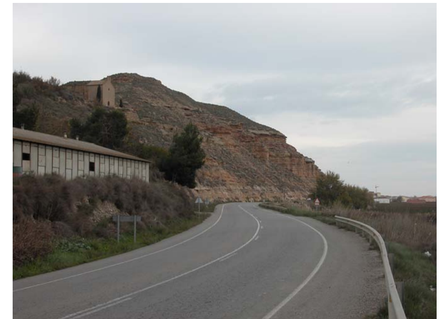
Figura 13.2. Carretera d'Aitona a Seròs, a l'alçada de la vall de Gran. Vista de la serra Llarga i de la capella de Sant Joan de Carratalà (25.11.2005).

Infraestructures: La unitat Baix Segrià està limitada al nord per l'autovia A-2. Al nord de Soses, hi passa l'autopista AP-2, que enllaça Lleida amb Saragossa. Al sud, la carretera C-45 ressegueix quasi perimetralment la unitat (figura 13.2). Des de l'autovia A-2 es divisa una planta de gestió de residus industrials de recuperació de VHU (vehicles fora d'ús). Aquesta infraestructura es troba en la zona de transició entre aquesta unitat i Regadius del Canal d'Aragó i Catalunya . Hi ha una línia d'alta tensió al sud de la unitat, a sobre de Seròs.