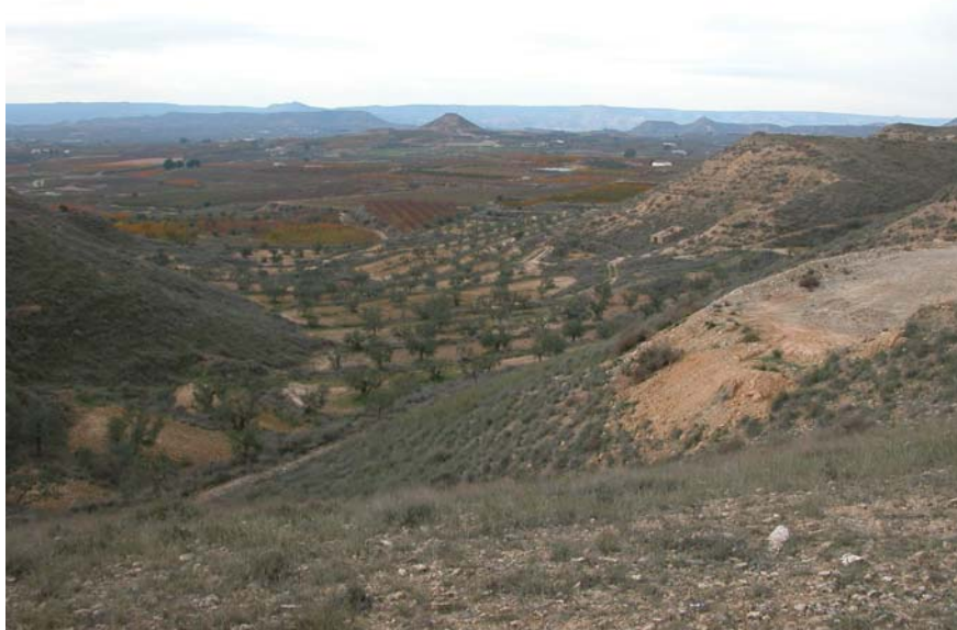
Figura 13.7. Conreus de secà i de regadiu. Panoràmica des de Serrabrisa (25.11.2005).