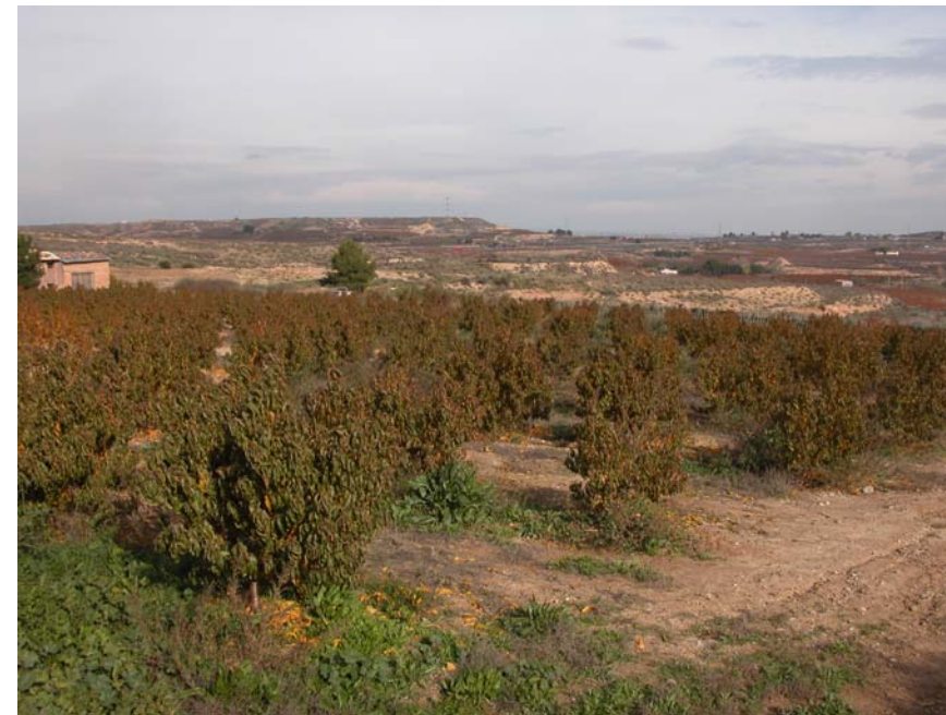
Figura 13.6. Conreus de regadiu, no lluny de Serrabrisa (25.11.2005).

Tot i que no s'anota un patró agrícola global i nítid, els relleus prèviament comentats forcen els camps agrícoles a ajustar-se a la seva estructura (fig. 13.6).