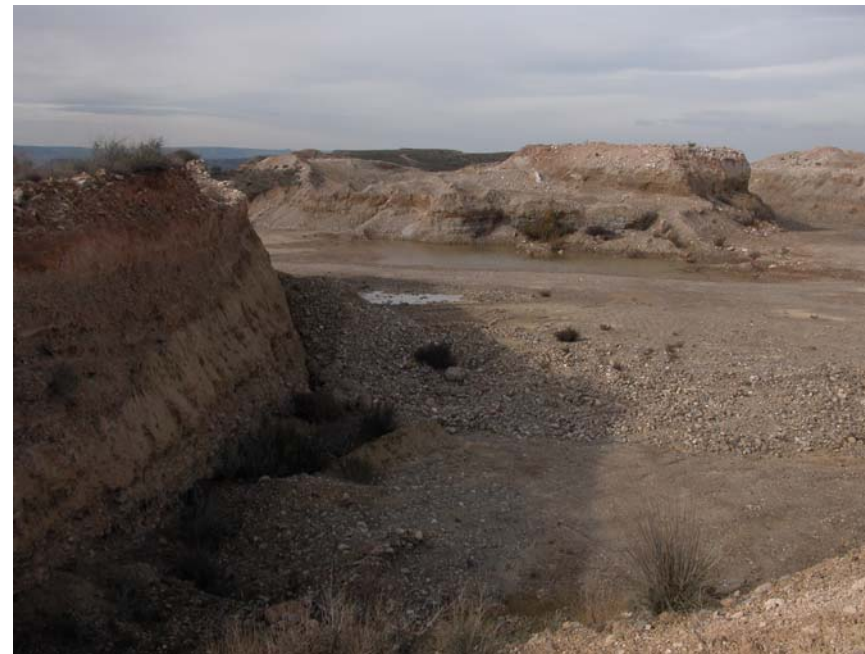
Figura 13.8. Activitat extractiva abandonada a dalt de Serrabrisa (25.11.2005).

Als espais oberts, es pot preveure que aquesta unitat seguirà les pautes d'altres unitats dominades pel regadiu, amb tessel·les de vegetació natural corresponents a etapes serials i degradades per l'impacte de les activitats humanes (taula 13.5). L'abandonament dels escassos cultius de secà fan molt probable la seva desaparició a curt termini. També és possible la desaparició definitiva dels arrossars i la seva substitució per farratges (alfals) primer, i anys després per presseguers i pomeres.