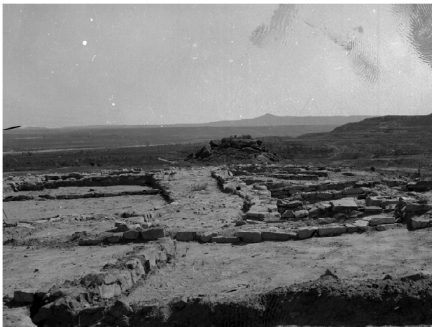
Figura 13.3 Restes del poblat ibèric de Gebut a Soses, l'any 1942. Observeu el tossal de Montmeneu al fons.

Certament, aquestes terres ja eren poblades durant l'edat del bronze. D'aquesta època són els poblats de Carratalà, vall del Grau, Cantacorbs, Montfriu, Montfred (Aitona); tossal de Folies, les Roques, tossal Fernando (Seròs); i els Budells i tossal Benito (Massalcoreig).