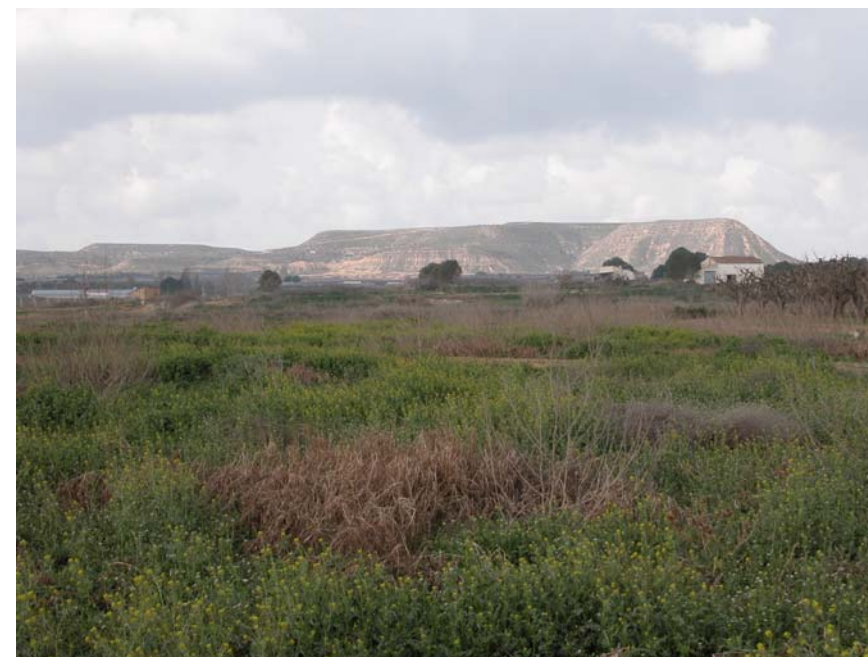
Figura 13.4. Conreus abandonats i el tossal de Montllober al fons (20.03.2006).

Inclou l'EIN de Montllober , un espai natural representatiu de les terres estèpiques de la vall de l'Ebre, on des del punt de vista de la flora, hi ha un bon nombre d'endemismes ibèrics i iberomagrebins que s'integren a les brolles, espartars i llistonars.