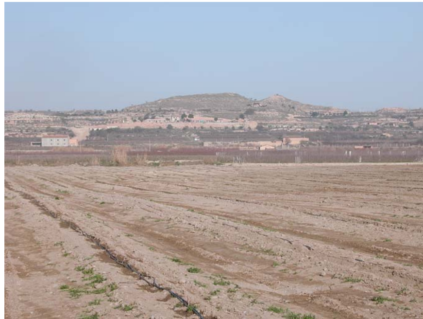
Figura 13.5. Roques de Sant Formatge, al sud-oest de Seròs. Imatge realitzada des de la unitat Paisatge fluvial del Segre (21.02.2006).

- Elements topogràfics rellevants: Aquesta unitat es caracteritza per una estructura topogràfica força diferent de la de les altres unitats de l'àrea d'estudi. En efecte, la unitat ofereix una imatge visualment complexa, en què es combinen uns tossals d'una mida petita —per exemple, els tossalets, el tossal de Folies, el tossal de Benito i el tossal de Punxent— amb uns serrats longitudinals alineats en direcció nord-oest o bé sud-est: serra dels Gebuts (límit del Segre), les serres de Vilanova al nord-oest, el tossal de Montllober, les Roques de Sant Formatge (fig. 13.5), la serra de Matacany. Els tossals es presenten com a interrupcions del paisatge agrícola, coberts, majoritàriament, de brolles de romaní i llistonars.