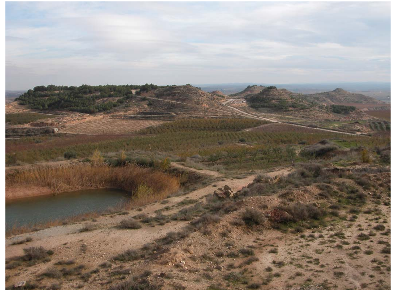
Pinedes, conreus, basses agrícoles i erms, no lluny de Serrabrisa. Imatge presa el mes de novembre de 2005.