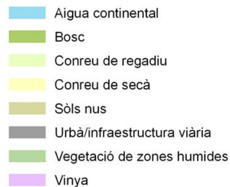
Mapa d'usos del sòl de 2002, DMAiH (reclassificat)