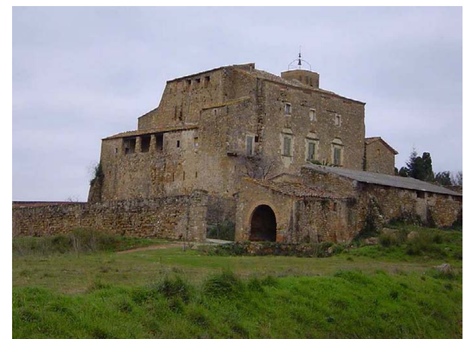
Figura 11.19: Castell de Vilarig.

Deixant de banda les formes de l'arquitectura medieval, l'altre gran valor històric constructiu del paisatge de la Garrotxa d'Empordà el representen les construccions de pedra seca, preferentment a la Garriga,