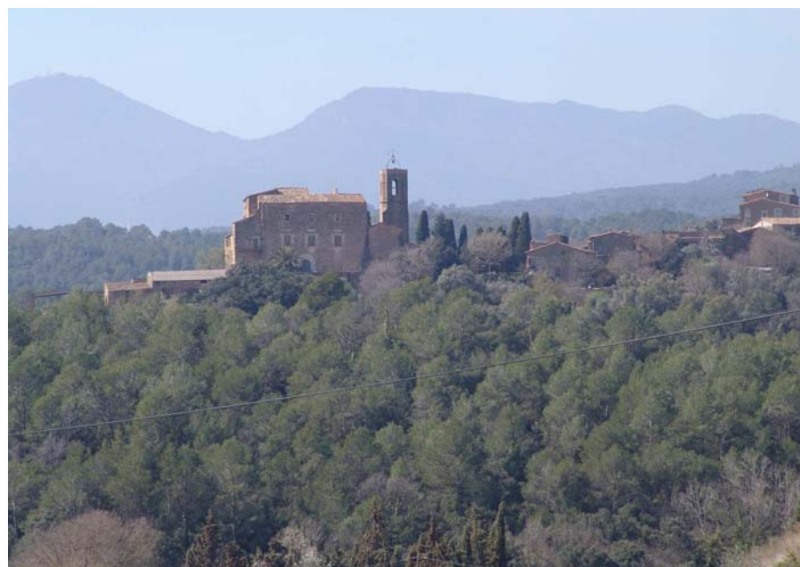
Figura 11.8: Nucli de Vilarig.

Com en d'altres àmbits geogràfics, l'estructura del poblament que avui es coneix es va iniciar al llarg de l'Edat Mitjana, ja fos per la consagració de nous temples parroquials que impulsaren la conformació de petits nuclis urbans al seu voltant, per la presència d'alguna fortificació senyorial, per l'agrupació d'un conjunt de masos o per l'existència d'una via de comunicació que els travessava. La fesomia d'aquests nuclis urbans ha sobreviscut, sovint sense grans alteracions, com a tret definitori del paisatge urbà actual. Cal tenir present que a la majoria de