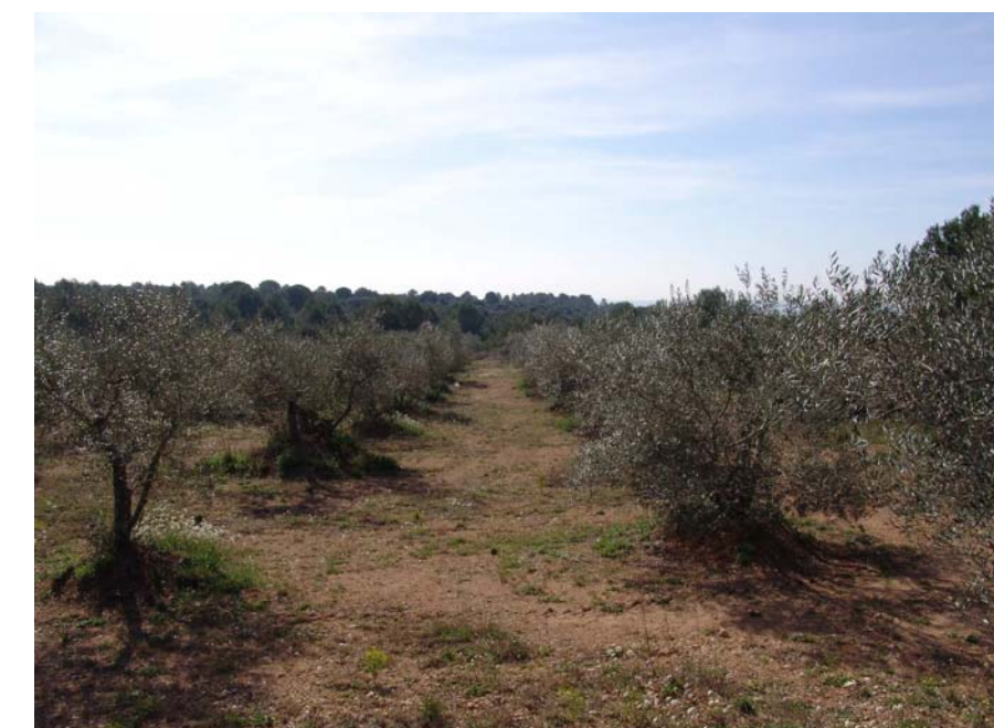
Figura 11.14: Oliverar a les immediacions de Llers.

La majoria dels nuclis històrics mantenen la seva personalitat, la seva trama de carrers i els seus valors patrimonials lligats a l'arquitectura. En el cas de Llers, la voladura d'un polvorí, en finalitzar la guerra civil, ha redundat en l'existència de dues singularitats des del punt de vista del paisatge urbà de la Garrotxa d'Empordà i, probablement, dins el conjunt de les comarques gironines. D'una banda, disposar d'un nucli urbà encara parcialment destruït per efecte d'aquell conflicte i, de l'altra,