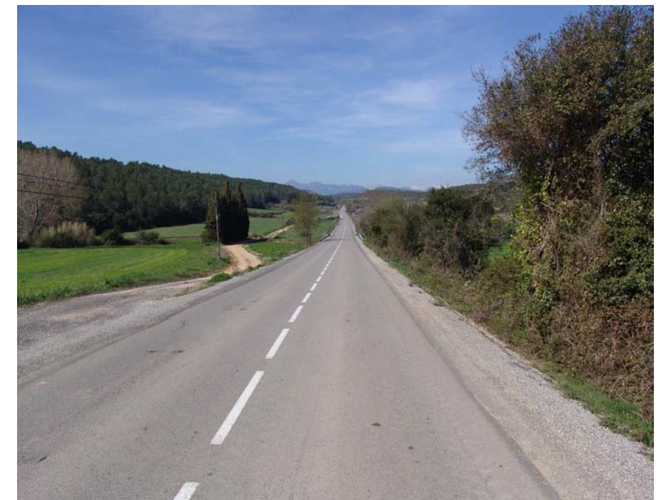
Figura 11.24: Carretera GI-510, entre Llers i Terrades.

Si s'accedeix des del sud, la millor opció és a través dels diversos trencants que surten de la carretera N-260 (A-26), coneguda com a eix