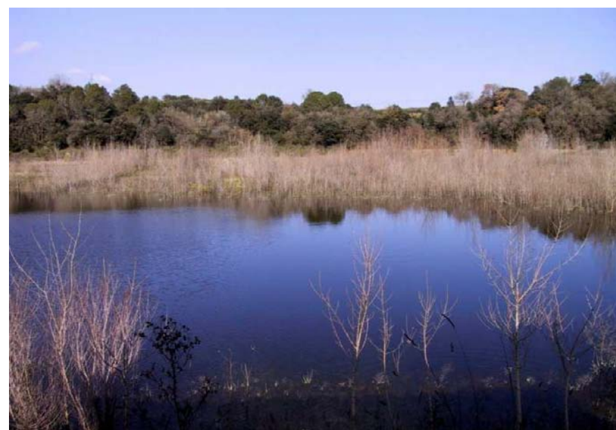
Figura 11.21: Estanyols del mas Margall.

Als terrenys més planers i als immediats als nuclis urbans l'activitat agrícola marca en bona mesura la fesomia del paisatge. Aquest fet permet una alternança d'espais agroforestals sobretot a les parts centrals i meridionals de la Garrotxa d'Empordà. Les produccions més comunes són els cereals de secà, com l'ordi, el blat i la civada. S'afegeixen els conreus farratgers, amb produccions com l'userda o herbes granades, a part d'alguns terrenys per a pastures. Les oleaginoses com el gira-sol i la colza, introduïdes recentment, ocupen un espai més testimonial. El conreu visualment més característic i de més llarga tradició, encara que no el més difós, és el de les oliveres, present en major o menor mesura a pràcticament tots els municipis de la Garrotxa d'Empordà. A sectors com Llers o Terrades els camps de cirerers són un bon complement als altres conreus. La vinya té una