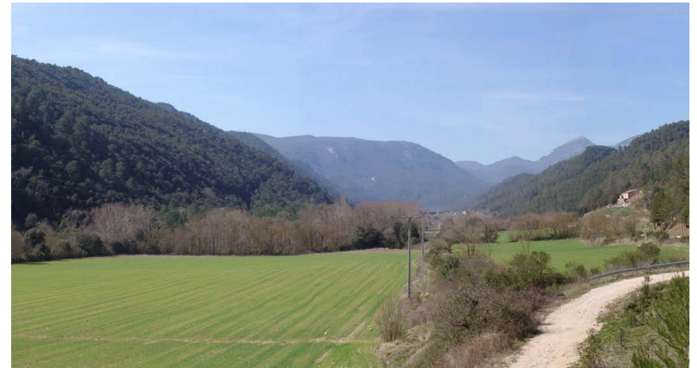
Figura 11.1: Estreta vall de la Muga a prop d'Albanyà.