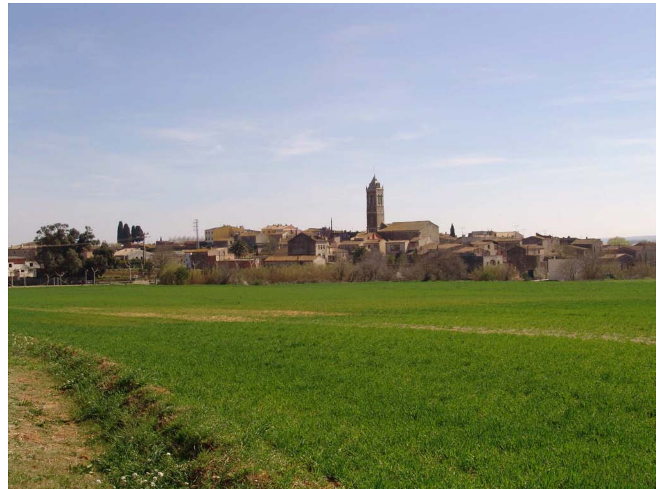
Figura 11.3: El poble de Vilanant, envoltat d'una extensa plana agrícola.