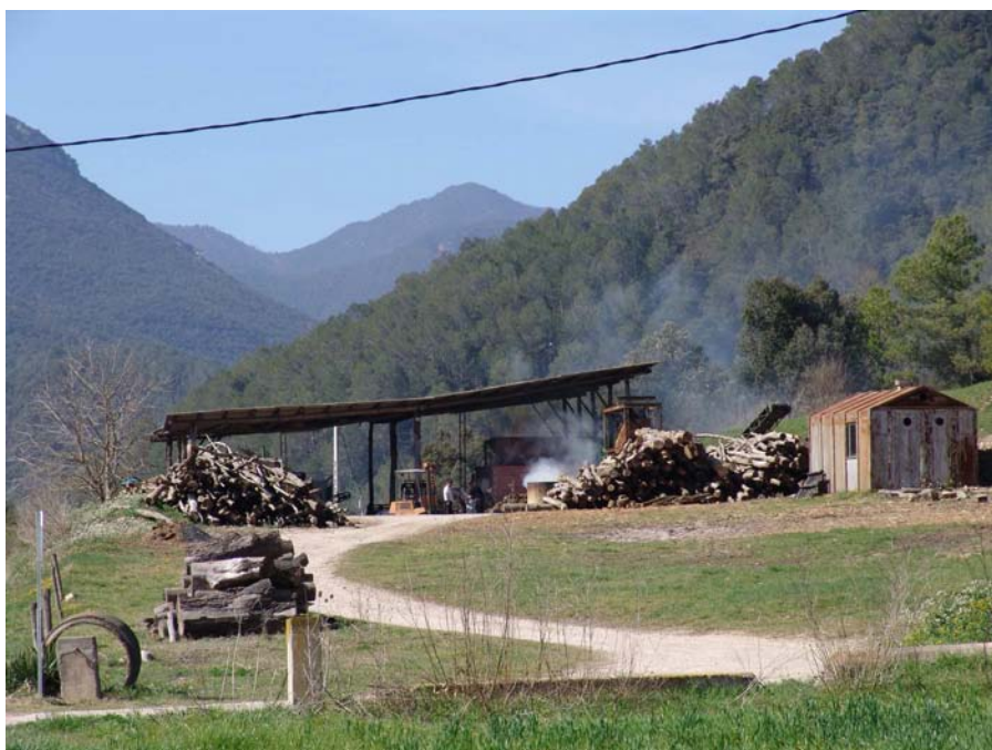
Figura 11.20: Serrador prop d'Albanyà.

però també a d'altres llocs com Biure. Amb pedra seca es construïren feixes, tancats, agulles per conduir aigües, camins d'accés i barraques. Les barraques foren la construcció més característica i la seva varietat és elevada; mentre algunes destaquen, d'altres estan encastades i amagades en una paret de feixa i no es veuen; mentre algunes semblen veritables fortalises, d'altres aparenten fragilitat. Solen distingir-se entre les d'arquitectura troncocònica i les d'arquitectura semiesfèrica. En l'àmbit de la Garriga es comptabilitzen més de 300 barraques, mentre que al terme de Biure n'hi ha identificades 49. També a alguns sectors de major pendent és possible distingir esglaonaments considerables de terrasses com el del solell de puig d'Arques a Biure.