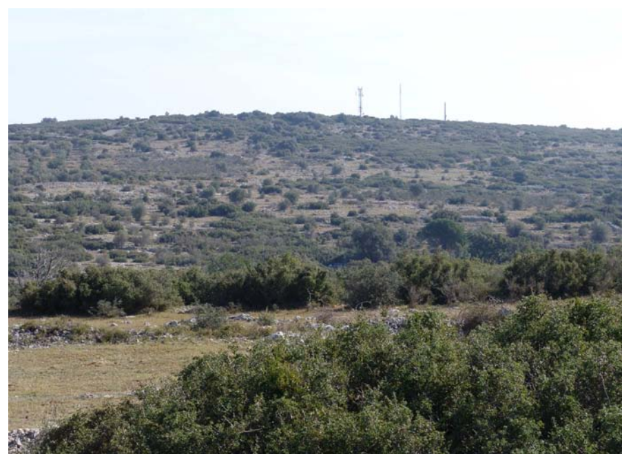
Figura 11.13: La vegetació espontània recolonitza els camps abandonats a les serres calcàries que s'estenen entre Avinyonet de Puigventós i Llers.

La posició progressivament elevada de la Garrotxa d'Empordà respecte el pas dels principals cursos fluvials i la inexistència de grans regadius sistematitzats, fa que els conreus que prevalguin siguin els