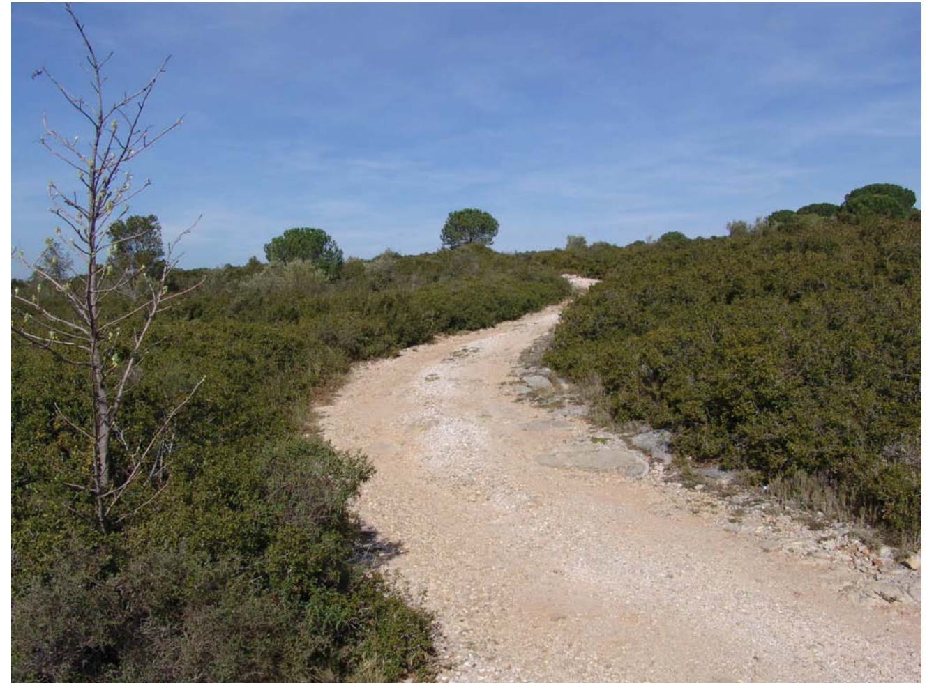
Figura 11.5: La Garriga, espai singular que s'estén entre Avinyonet de Puigventós i Llers.