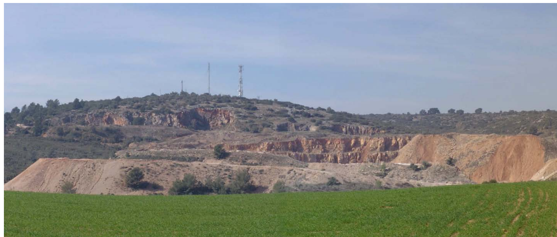
Figura 11.29: Pedrera a la carretera de Llers a Figueres.