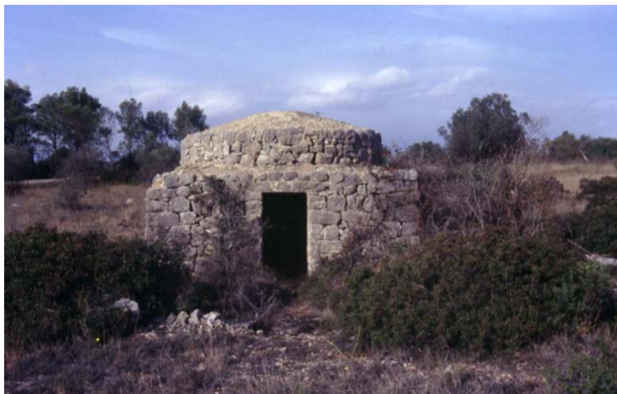
Figura 11.11: Barraca de pagès a la garriga de Llers.

L'evolució del sòl agrícola a partir de la segona meitat del segle XX va estar marcat per un fet clau: l'onada de fred que es va viure el febrer de 1956, molt intensa i persistent, fet que suposà una forta afectació a les oliveres. Això marcà un abans i un després en el paisatge de la garriga, ja que la majoria d'oliveres es congelaren. D'aleshores ençà, la garriga pròpiament dita perdé la pràctica totalitat dels seus conreus. Moltes parcel·les restaren ermes i s'inicià la recolonització de la vegetació espontània. Una idea de la reculada viscuda pels conreus d'olivera la proporcionen les dades relatives al terme de Vilanant: de 300 ha plantades el 1935 es va passar a 56 ha en el 1999. En qualsevol cas, l'arrencada de l'olivera s'ha d'emmarcar també en un context més global de crisi de l'agricultura tradicional, en la qual l'onada de fred de