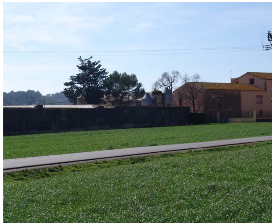
Figura 11.31: Granja adossada al nucli de Cistella.