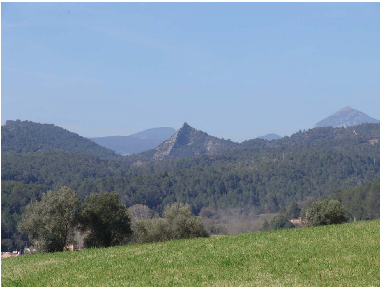
Figura 11.2: Turons de Sant Baldiri i de la Penya, al sud de Sant Llorenç de la Muga en el sector més muntanyós de la Garrotxa d'Empordà.