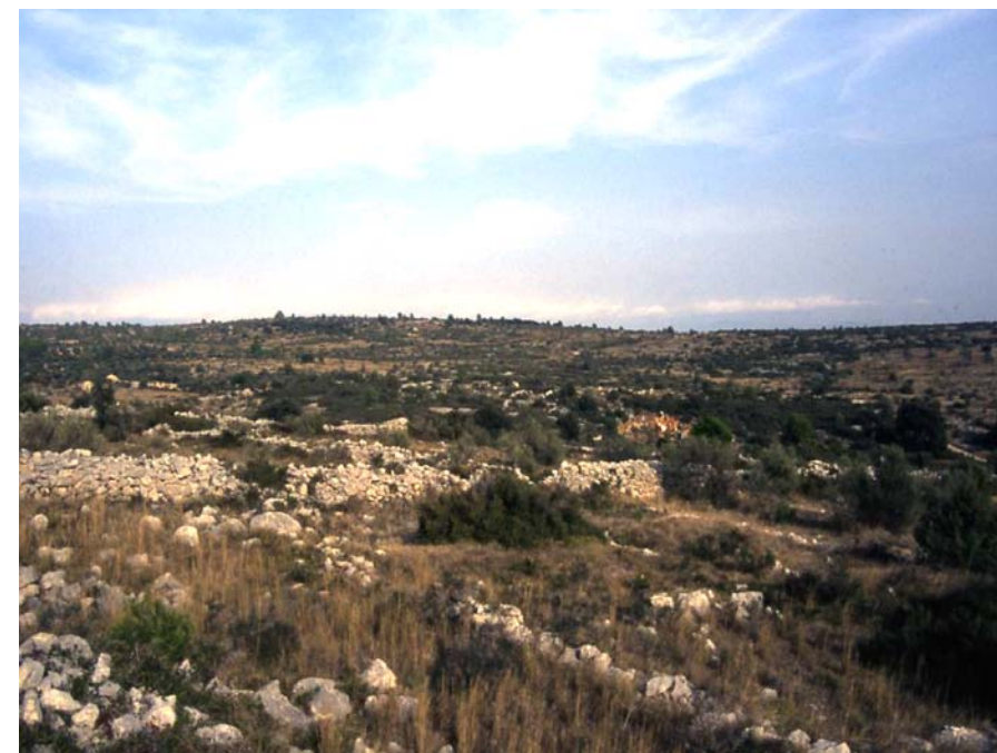
Figura 11.28: Conreus abandonats al sector de la Garriga.

L'execució de diverses infraestructures viàries i energètiques, tot i localitzar-se en un espai perifèric respecte la Garrotxa d'Empordà, incrementarà l'efecte barrera i de separació entre aquest àmbit i la plana de l'Alt Empordà, alhora que pot afectar la connectivitat ecològica entre el Manol i la Muga. Actualment s'està executant el tram Vilafant – Pont de Molins del TAV, amb la corresponent estació. Al costat del TAV