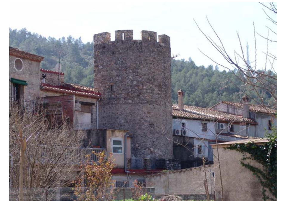
Figura 11.10: Fortificació al poble de Sant Llorenç de la Muga.

Complementàriament, sobretot a la banda més occidental, les zones