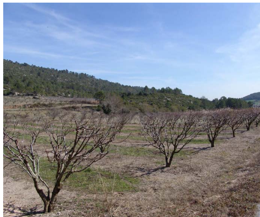
Figura 11.18: Camps de cirerers a prop de Terrades.

estètica, com la de Sant Llorenç de la Muga amb les seves fortificacions i el campanar de l'església, tot plegat emmarcat en un meandre a la riba esquerra de la Muga. És especialment apropiada la seva contemplació des de la torre de vigilància que guarda el pas del riu. Per altra banda, les poblacions com ara Lladó, Vilanant o Avinyonet de Puigventós segueixen el patró típic dels petits pobles agrícoles de la Plana d'Empordà. Es tracta de nuclis compactes, on la majoria de les cases tenen el pati tancat per murs d'obra arrebossats amb morter, i on només sobresurt el campanar.