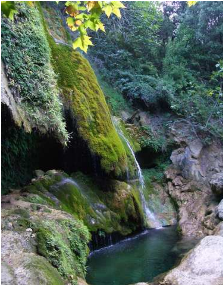
Figura 11.16: Salt d'aigua de la Caula.

La Caula, amb la seva cascada, les seves coves i l'efecte de les seves aigües serà font d'inspiració de nombrosos escriptors, com Joaquim Moner, i també de pintors, com el dadaïsta d'origen francès, Marcel Duchamp. També Dalí visità la Caula i elaborà un dibuix on apareix el paratge. Justament, el 2005, la commemoració dels 40 anys del pas de Duchamp per la Caula serví de pretext per iniciar uns certàmens de poesia i performance , que se celebren a les Escaules i Boadella a finals d'estiu i que apleguen artistes, poetes, crítics i historiadors de l'art. Aquests certàmens anuals porten per nom La Muga Caula, una suma de dos topònims als quals se'ls dona, volgutament, la traducció de «Frontera Calenta».