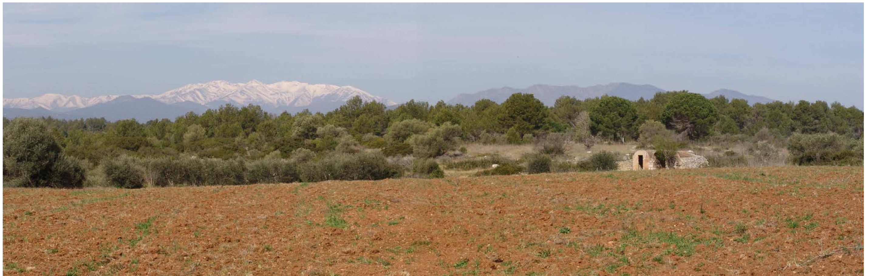
Figura 11.15: El Canigó s'aixeca en l'horitzó del paisatge observat des dels replans de Llers.

A nivell pictòric, faran del paisatge un objectiu privilegiat de les seves composicions autors com Faustí Gironella, Lluís Vayreda i Trullol, Marià Llanerera o Agustí Auquer i Sabater. Respecte Llanerera, serà el mateix