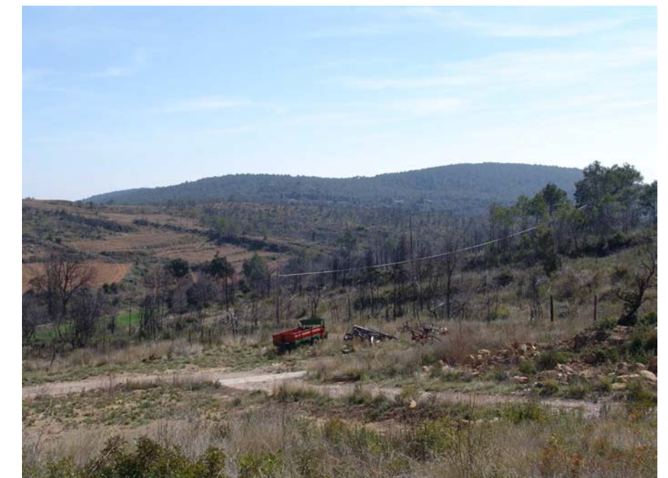
Figura 11.26: Efecte dels incendis forestals al nord de Cistella.

La intensificació de la ramaderia és distingible visualment per l'obertura de granges i la instal·lació de coberts, sitges i altres annexos complementaris, sovint al costat de masos seculars. L'escassa qualitat dels materials emprats (generalment totxana) i la mida, de vegades excessiva, de les noves instal·lacions, està tenint un impacte important