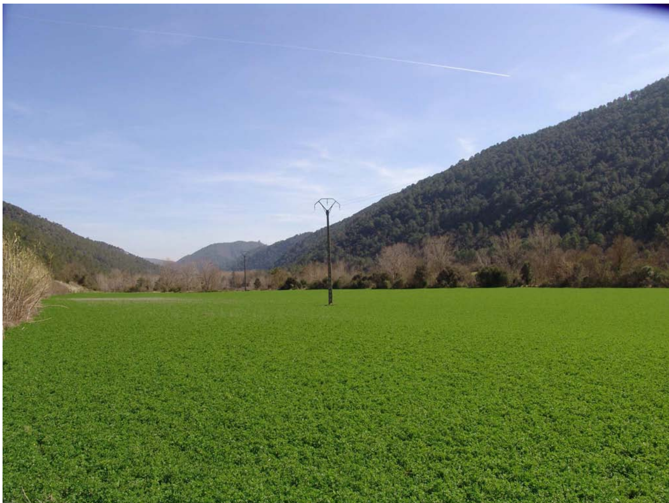
Figura 11.4: Fons de vall oberta per la Muga entre Albanyà i Sant Llorenç de la Muga.