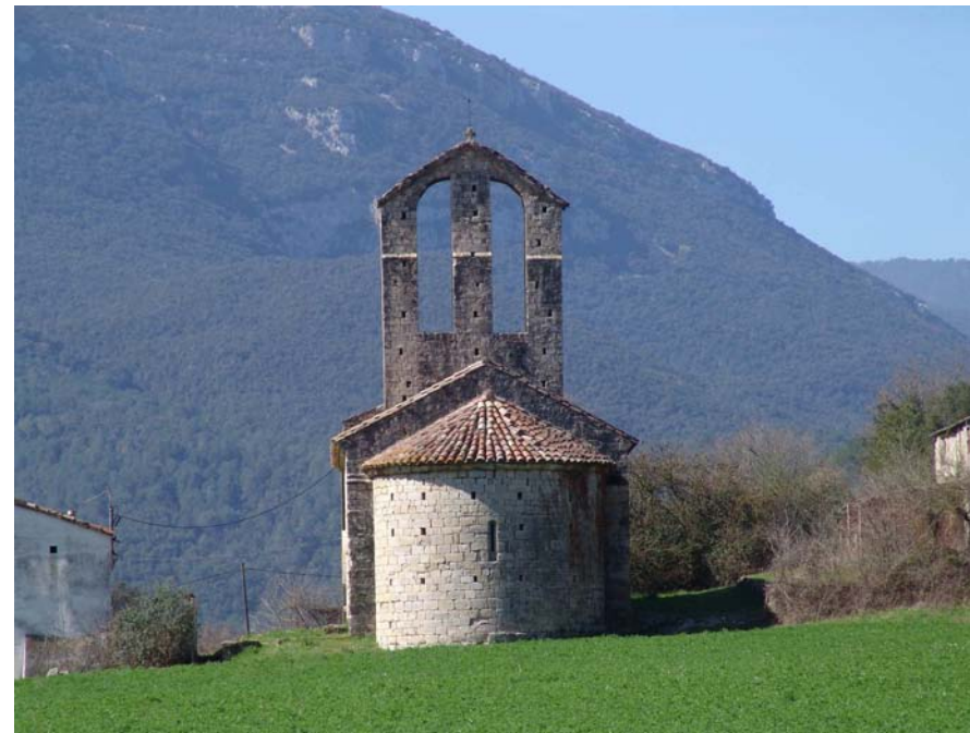
Figura 11.9: Església de Santa Maria de Palau.

pobles no han crescut gaire i, per tant, no han modificat de forma substancial la trama urbana. El caràcter muntanyós del territori ha afavorit que moltes parròquies sovint no disposin d'un nucli compacte definit sinó de masos disseminats.