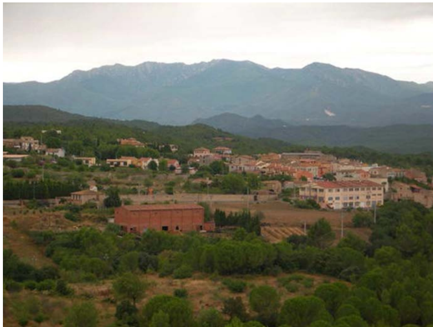
Figura 11.23: El poble de Llers (font: J.Cascales).

A part de recuperar-se els ambients propis de la zona humida, la intervenció ha inclòs actuacions per a l'ordenació de l'ús públic com el condicionament d'un aparcament a l'accés de la zona, unes taules i bancs, plafons didàctics i un parell d'observatoris per a les aus.