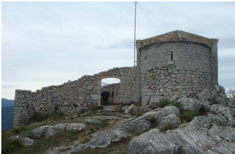
Figura 11.25: Ermita de Santa Magdalena.

pirinenc (4). En aquest cas, les vies de penetració són la d'Avinyonet de Puigventós (GIP-5101) (42), la de Lladó (GIP-5239) i, en darrer terme, la de Cabanelles i Sant Martí Sasserra (GIP-5237), amb opció d'ascendir, per pista asfaltada, fins al santuari de la Mare de Déu del Mont (43) i punt culminant de la muntanya del mateix nom.