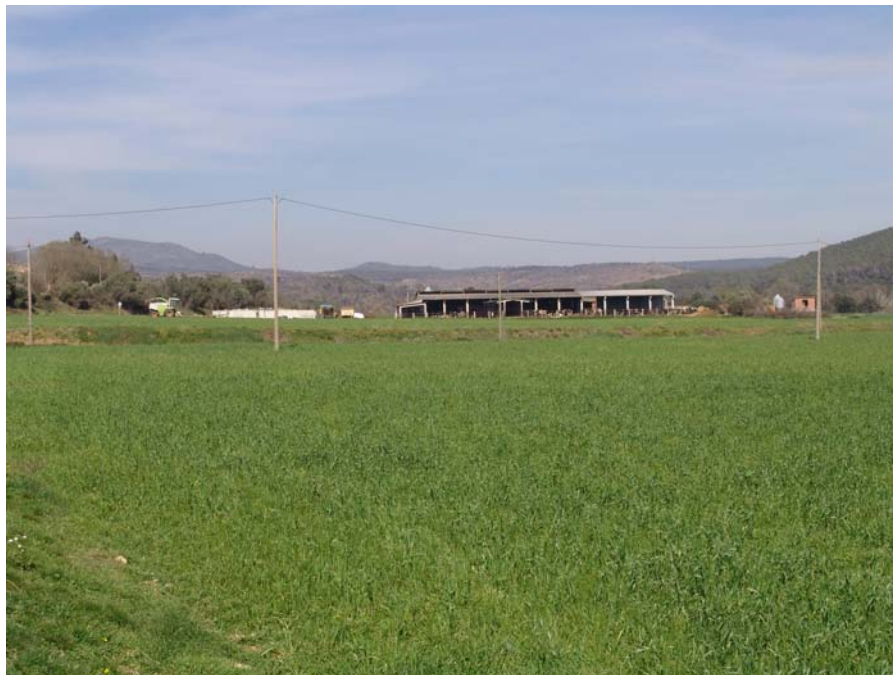
Figura 11.27: Les granges constitueixen un element cada cop més freqüent en el paisatge rural.

en la desestructuració del paisatge rural. Malgrat tot, l'impacte més incisiu es produeix al subsòl. Així, les aigües subterrànies de diversos municipis de la Garrotxa d'Empordà s'inclouen dins zones vulnerables per contaminació per nitrats.