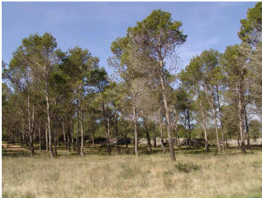
Figura 11.30: Pineda al costat d'un camp abandonat a Llers.