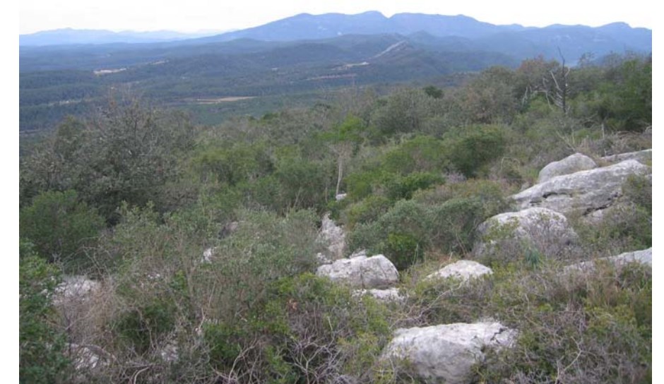
Figura 11.7: Els materials calcàries predominen en algunes serres com Santa Magdalena.

Els vessants de la muntanya del Mont es troben inclosos dins de l'Espai d'Interès Natural (EIN) de l'Alta garrotxa, mentre que la garriga d'Empordà ha estat inclosa dins de la xarxa Natura 2000, vista la seva catalogació com a Lloc d'Importància Comunitària (LIC) i Zona d'Especial Conservació per a les Aus (ZEPA).