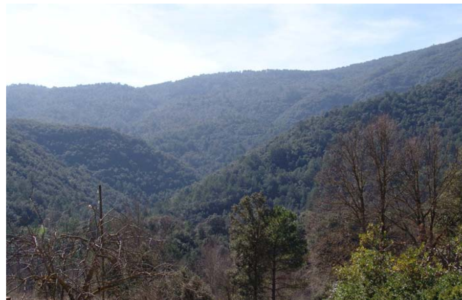
Figura 11.6: Boscos d'alzines i pinedes recobreixen densament els relleus més occidentals de la Garrotxa d'Empordà.

Els vessants del Mont i els seus contraforts propicien una xarxa hidrogràfica formada per torrents i rieres de curt recorregut però de