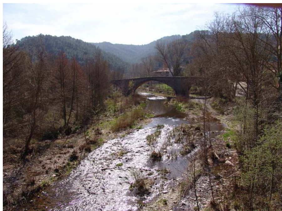
Figura 11.17: La Muga al seu pas per Sant Llorenç de la Muga.

Algunes composicions urbanes tampoc escapen a aquesta dimensió