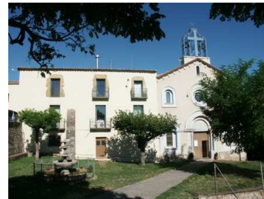
Figura 11.22: Santuari de la Mare de Déu de la Salut, a Terrades.

presència més acusada al sector nord-est, limítrof amb els Aspres, a municipis com Biure o Pont de Molins.