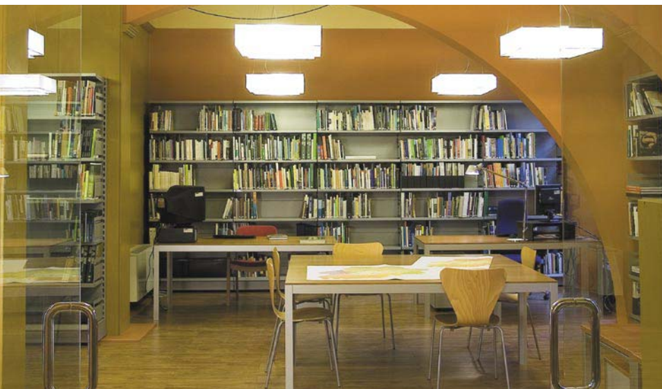
>> Centre de documentació de l'Observatori del Paisatge de Catalunya, amb seu a Olot.

bit europeu, la principal referència és el Conveni Europeu del paisatge, aprovat a Florència l'any 2000, que marca el camí que han de seguir els estats i les regions per fomentar la conservació i millora de l'extraordinària varietat i riquesa de paisatges europeus, sobretot els més degradats. Aquest acord reconeix que un entorn atractiu, afable i harmoniós genera una agradable sensació de benestar, que augmenta notablement la qualitat de vida dels ciutadans.