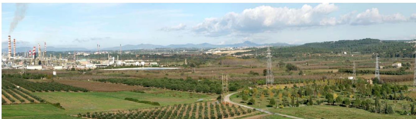
Figura 8.1. La perifèria de les grans aglomeracions urbanes del Camp de Tarragona aglutina dinàmiques paisatgístiques contraposades, producte de la sobreposició d'usos i cobertes del sòl. A dalt, polígon industrial de la Pobla de Mafumet, envoltat de camps.

Els paisatges actuals del Camp de Tarragona són el resultat de la interacció entre múltiples dinàmiques que actuen a diferents escales. Fenòmens com el creixement urbanístic i industrial, l'evolució del sector turístic i la disminució del pes del sector agrícola tenen una plasmació directa en el territori, si bé la intensitat ha estat diferent en funció de l'àmbit. Una anàlisi genèrica de tot l'àmbit del Camp de Tarragona ens ajuda a comprendre que, mentre alguns espais es mantenen en conjunt estàtics, en d'altres el dinamisme és més acusat. En la majoria d'aquests casos, l'acció antròpica és el principal agent que explica el modelat final del paisatge. Una visió acurada del mapa de dinàmica i estabilitat (capítol 2. Metodologia, mapa 2.3), ens permetrà fer-nos una idea general de quins són aquells espais més propensos al canvi al Camp de Tarragona. Aquest mapa és el resultat de creuar els usos del sòl de Catalunya de l'any 1992 amb els usos del sòl del 2002, cartografiant si manté el mateix ús o si hi ha hagut algun tipus de canvi. Per tal de tenir una millor idea general del fenomen, els usos s'han simplificat en quatre grans tipus (vegetació espontània, espai agrícola, espai construït i altres). A nivell general s'observa que aquells usos més consolidats són la vegetació espontània i, sobretot, l'espai construït, mentre que els espais més dinàmics són els espais de transició entre aquests i l'espai agrícola.