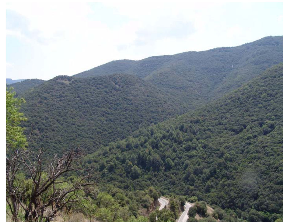
Figura 8.2. L'augment de la biomassa forestal ha provocat un augment del risc d'incendi forestal.

El paisatge forestal, que domina en les zones muntanyoses del Camp de Tarragona, està sotmès a dinàmiques pròpies del paisatge de muntanya baixa i mitja mediterrània. La pèrdua de competitivitat econòmica ha provocat un abandó dels aprofitaments forestals tradicionals. Cal tenir en compte que els aprofitaments tradicionals suposaven un control de la biomassa existent en els boscos. L'augment de la biomassa (tones de material combustible/hectàrea) i la major freqüentació dels boscos és un dels principals aspectes que fan augmentar el risc d'incendi forestal. Cal recordar els grans incendis com els que el 1986 afectaren l'extrem oriental de les muntanyes de Prades, el Montmell i la serra de l'Argentera o els que el 1994 afectaren els contraforts septentrionals del Montsant.