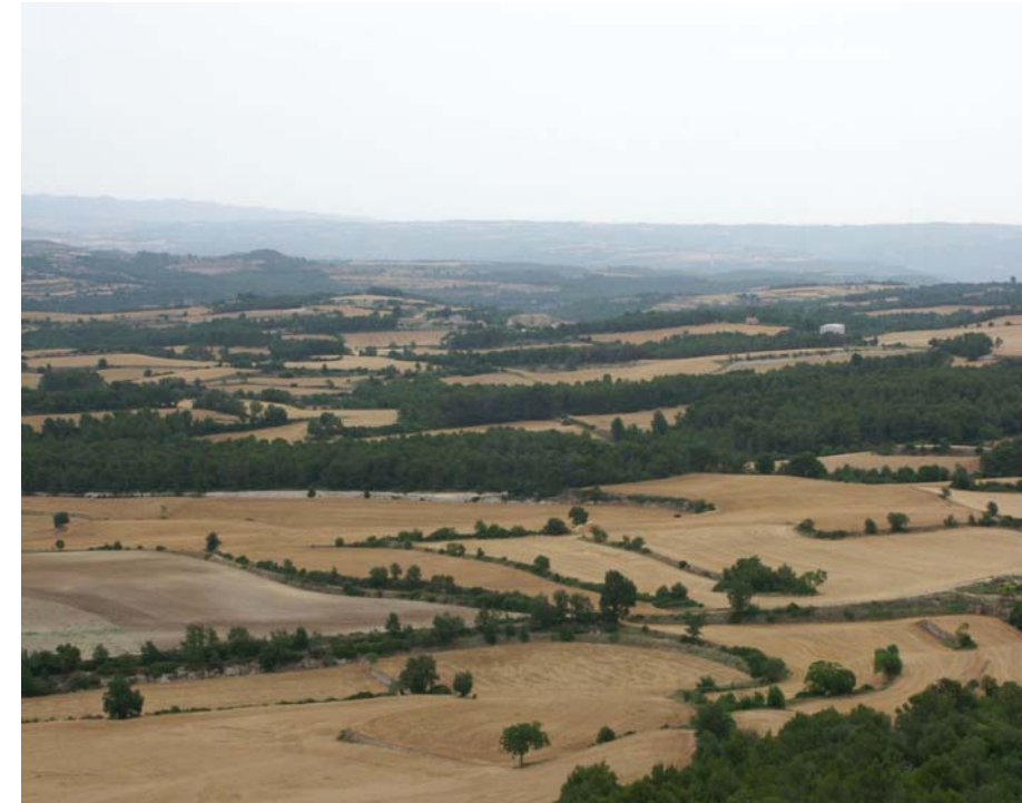
Figura 8.4. Els conreus de cereals s'estenen per bona part de la Baixa Segarra.

Tot i això, el sector agrícola continua tenint un pes específic molt important al Camp de Tarragona: els camps de cereals continuen essent encara un dels principals agents del paisatge a la Baixa Segarra (on ocupa el 64% de la superfície de la unitat), mentre que la vinya s'estén per vastes superfícies als Camps de Santes Creus, Priorat històric i Conca de Barberà. Tot i la caiguda de la producció, l'avellana continua ocupant milers d'hectàrees a la plana del Camp, etc. En