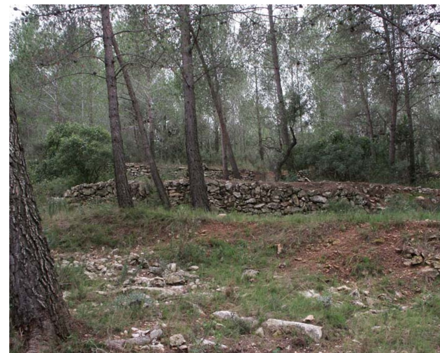
Figura 8.3. Els murs de pedra seca resten com a prova d'antics conreus.

Paral·lelament a aquests processos de canvi en la morfologia i estructura del paisatge forestal, els últims decennis han suposat també canvis en la percepció de la ciutadania respecte aquests espais. Actualment, més del 30% de la superfície del Camp de Tarragona gaudeix