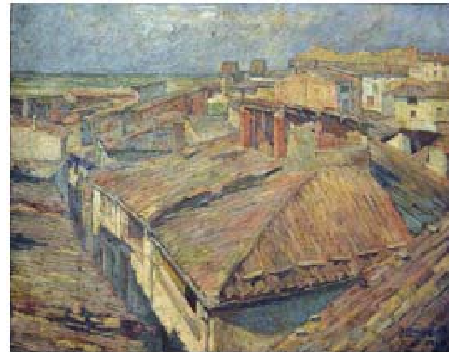
Fig. 6.2. Teulats de Tàrrega, obra de Jaume Minguell Miret (1949), que forma part del fons pictòric de la Diputació de Lleida.

En aquest sentit, els artistes locals han focalitzat part dels motius de les seves obres a un determinat àmbit geogràfic. Els pintors targarins Lluís Trepal i Padró (1925-) i Jaume Minguell Miret (figura 6.2), han dedicat part de la seva obra a representar edificis, paisatges i les feines del camp de les terres de l'Urgell i la Segarra.