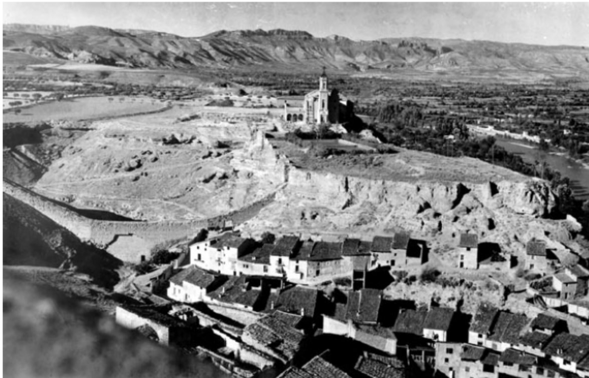
Fig.6.7. Turó del Sant Crist a Balaguer.

Adolf Mas Ginestà (1861-1936) fou un dels principals fotògrafs de l'època del Modernisme. La seva fotografia es centrà sobretot en el camp de l'art, l'arquitectura, l'arqueologia i el paisatge. Hi ha un nombrós conjunt d'instantànies de les Terres de Lleida ( figura 6.7 ). Per bé que l'IEI té en el seu fons imatges de Mas, els negatius es conserven a l'Institut Amatller-Arxiu Mas de Barcelona.