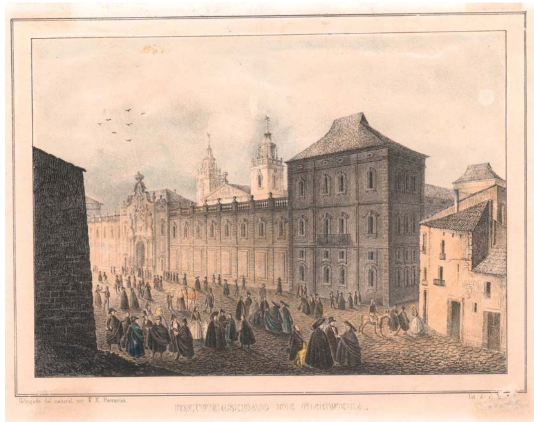
Fig. 6.3. Universitat de Cervera. Francesc Xavier Parcerisa Boada.

Francesc Xavier Parcerisa Boada (1803-1875), fou a més de dibuixant, gravador i pintor, un dels principals difusors de la litografia. És un dels paisatgistes romàntics més distingits. Va representar en una litografia la façana de la Universitat de Cervera l'any 1839 (figura 6.3).