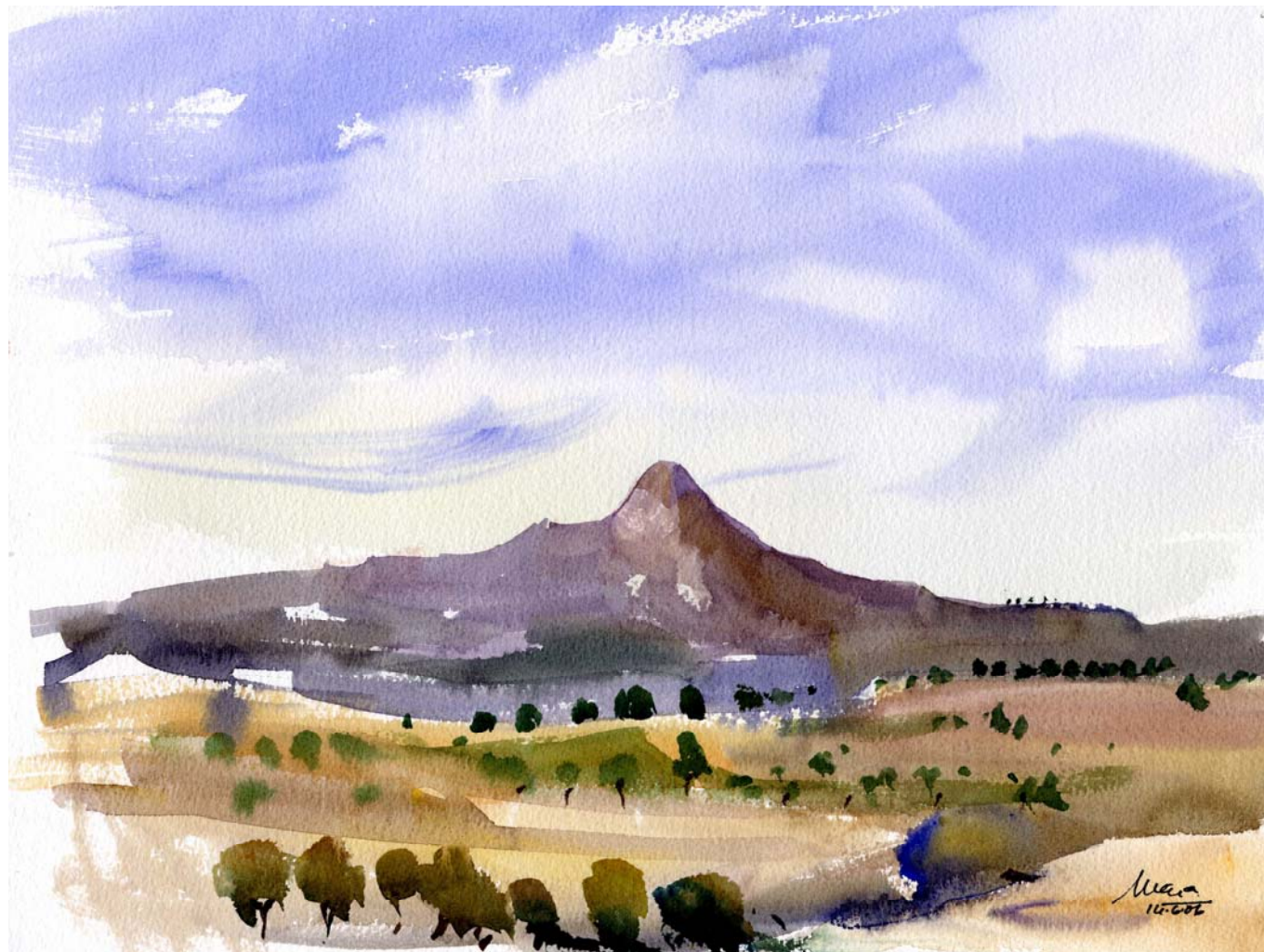
Fig. 6.5 Joaquín Ureña, 2006. Obra Montmeneu. Vista de Montmeneu (Unitat Costers de l'Ebre) des de la unitat Garrigues Altes.