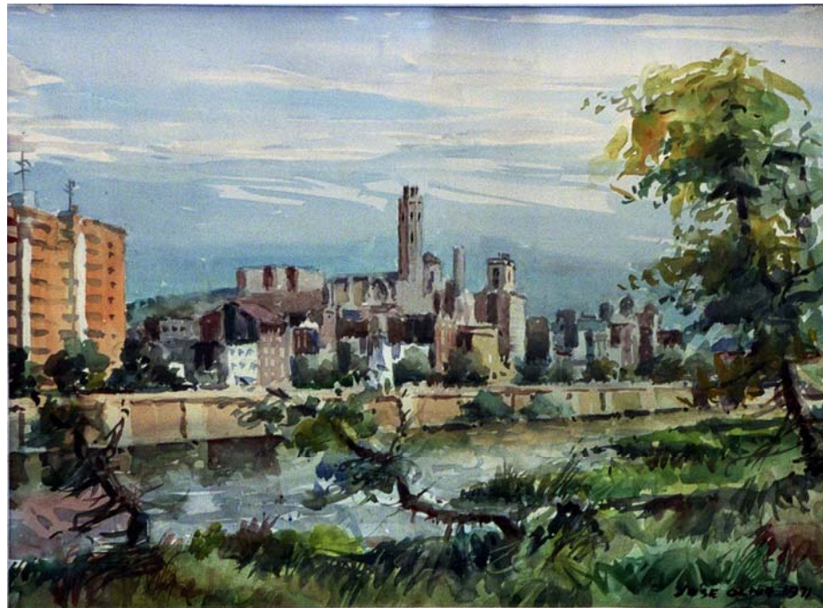
Fig. 6.1. Paisatge lleidatà. Josep Olivé Gómez.

En relació a les expressions pictòriques, Lleida, i concretament la Seu Vella (figura 6.1), és el principal objecte d'atenció dels pintors locals i foranis que s'han interessat per aquestes terres. També hi ha pintures d'artistes locals que representen altres indrets.