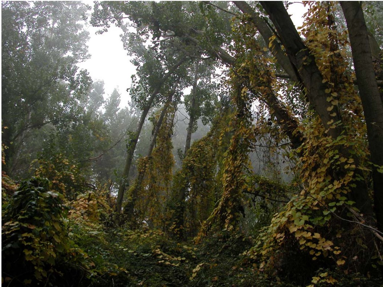
Fig. 5.11. Bosc de ribera al sud de Torres de Segre.

A part dels boscos de ribera característics, que ofereixen una gran varietat cromàtica estacional en aquests paisatges (figura 5.11), cal destacar les àrees d'aiguabarreig entre el Segre i els seus afluents. Són zones humides de gran bellesa i de gran transcendència com a àrees de reproducció i de pas per la fauna migratòria. Les principals àrees d'aquest tipus les troben a les confluències del riu Segre amb els rius Noguera Ribagorçana, Cinca (figura 5.12) i Noguera Pallaresa.