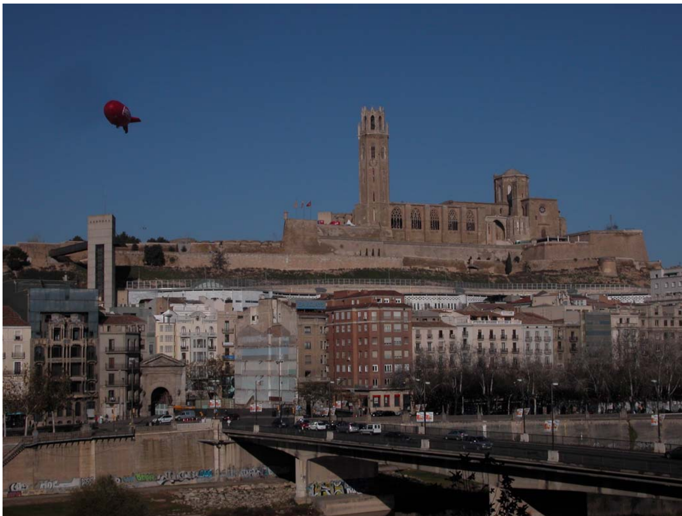
Fig. 5.2. Perfil del turó de la Seu Vella de Lleida. Panoràmica presa des del sud-oest

Els nuclis de població, situats preferentment en llocs dominants, són remarcables per llur aspecte compacte i molts mantenen la petjada medieval. Només alguns nuclis situats en indrets estratègics o en importants vies de comunicació esdevenen llocs de confluència, trobada i intercanvi i són poblacions més dinàmiques en relació al creixement urbà, que absorbeixen part de la població que cerca municipis amb millors serveis.