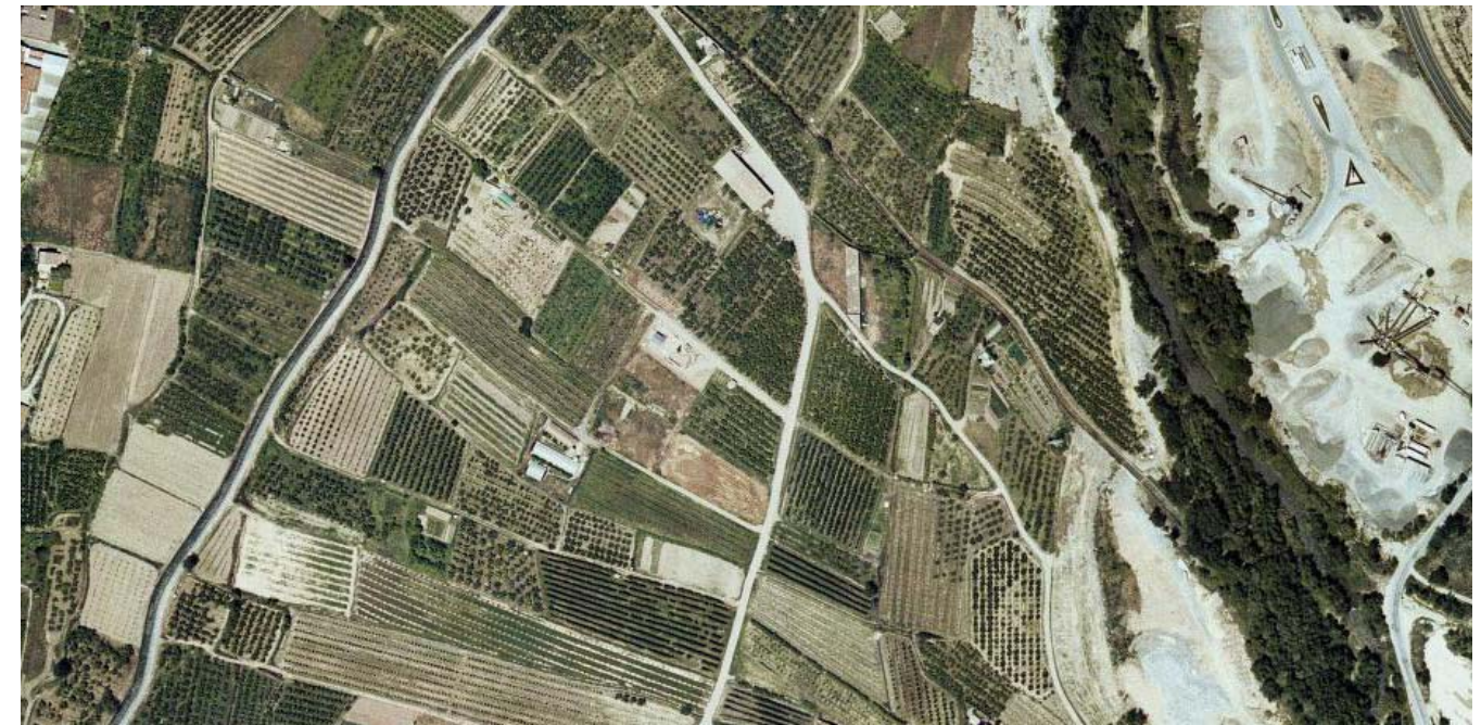
Fig.5.6 Distribució dels cultius regats pel canal de Pinyana al terme d'Alguaire.