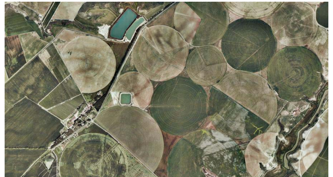
Fig. 5.7 Distribució dels cultius regats pel canal d'Aragó i Catalunya al terme d'Alguaire.