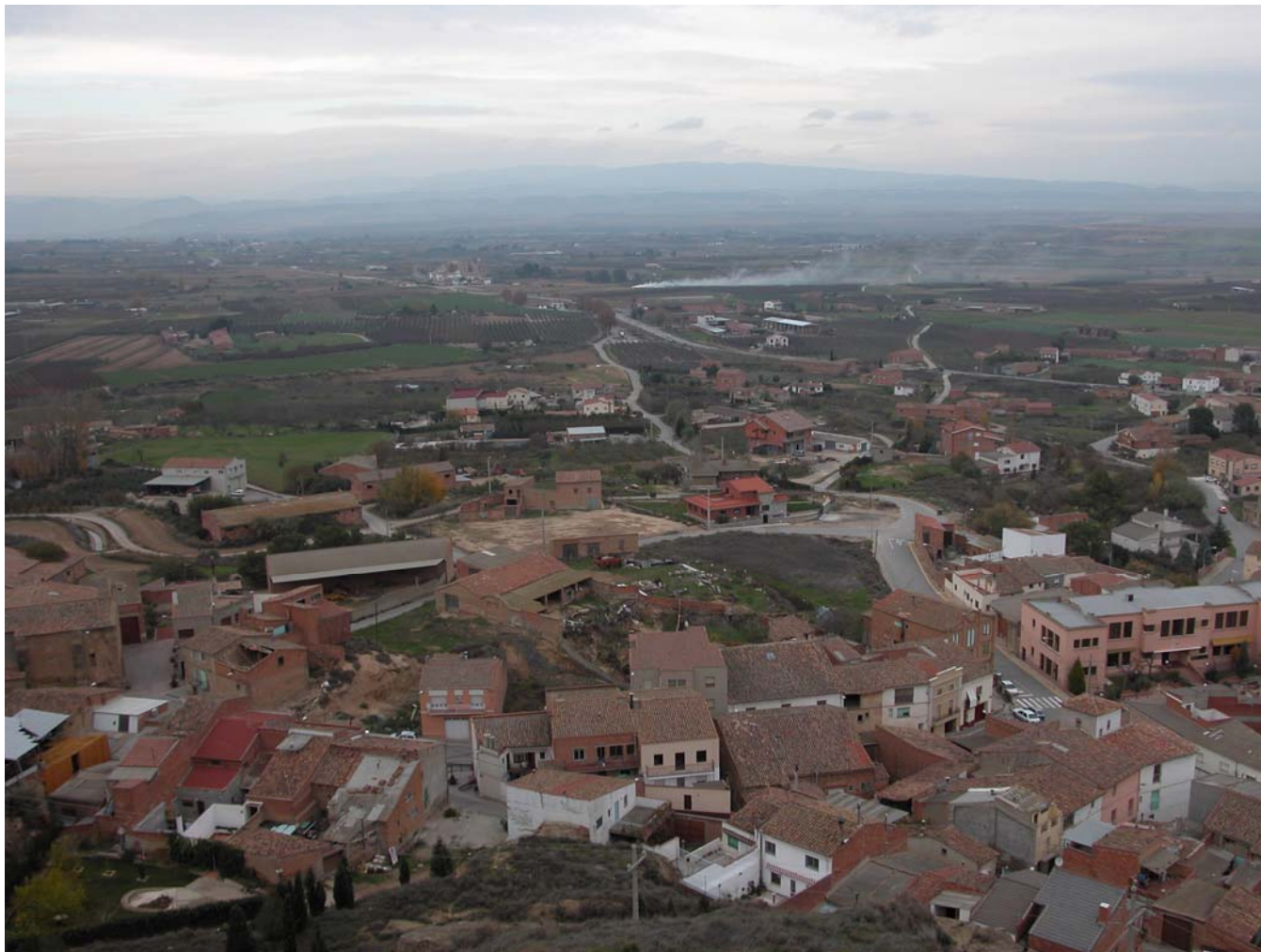
Fig. 5.3. Nucli urbà d'Alguaire.