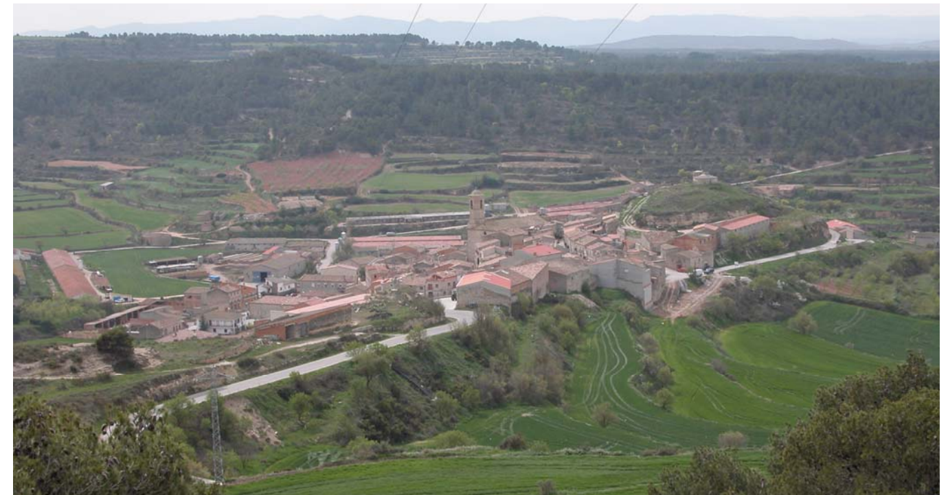
Fig. 5.1. Vista d'Omells de na Gaia des del tossal de Solans.

La crisi de població d'aquestes àrees de secà tan sols s'ha estabilitzat gràcies a la implantació de granges, afavorides també per l'existència de cooperatives ramaderes més o menys potents, a fi de complementar els ingressos de l'agricultura tradicional de secà. En tot cas, l'aparició de granges a les rodalies d'alguns pobles ha creat un cert impacte paisatgístic, donada la situació d'aquestes edificacions en un espai híbrid, exposat visualment entre els límits estrictament urbans i l'entorn agrícola.