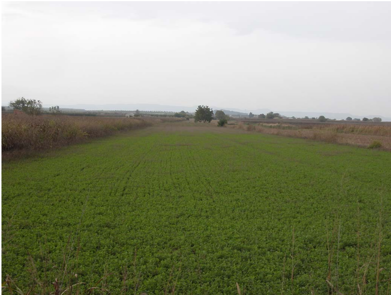
Fig. 5.5. Conreu d'alfals propi de les àrees de regadiu de les Terres de Lleida.

Algerri-Balaguer, canal Segarra-Garrigues, etc.) comporten la concentració parcel·lària precedent, passant d'una estructura de mosaic amb parcel·les de mida mitjana a parcel·les més grans, camins rectes i infraestructures de rec per aspersió, pivots i goteig. La tipologia de conreus és la mateixa que la dels altres regadius, però amb patrons més homogenis i regulars.