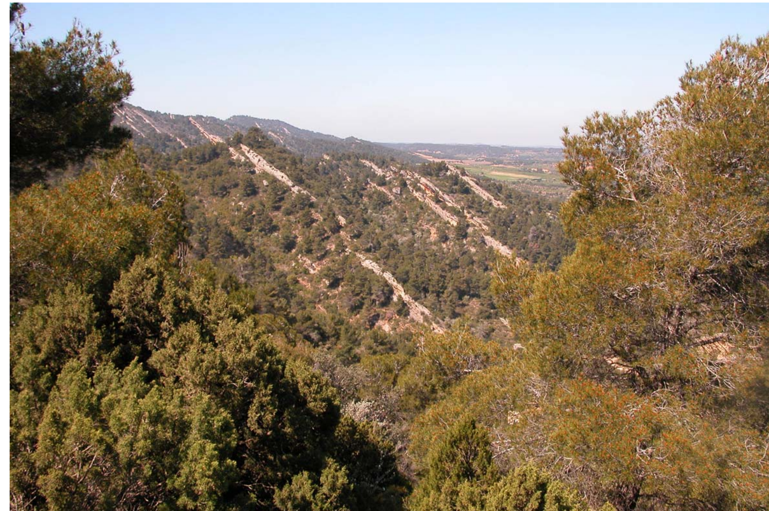
Fig. 5.10. Relleus de la serra la Llena.

Tot i que els paisatges forestals i de muntanya són més característics del nord de les Terres de Lleida, al sud també hi ha alguns relleus que s'han de tenir en compte. Aquests, es situen al sud de les comarques de l'Urgell i de les Garrigues. Els relleus que presenten generalment formen part del paisatge agrícola de secà, amb cultius d'oliveres, però també hi ha la presència d'extenses pinedes de pi blanc, bosquines de garric i brolles de romaní que conformen un paisatge diferent a l'agrícola. Les principals serres d'aquesta zona són, d'est a oest: la serra del Tallat, la serra de Vilobí, la serra de la Llena (figura 5.10), i el Montmaneu.