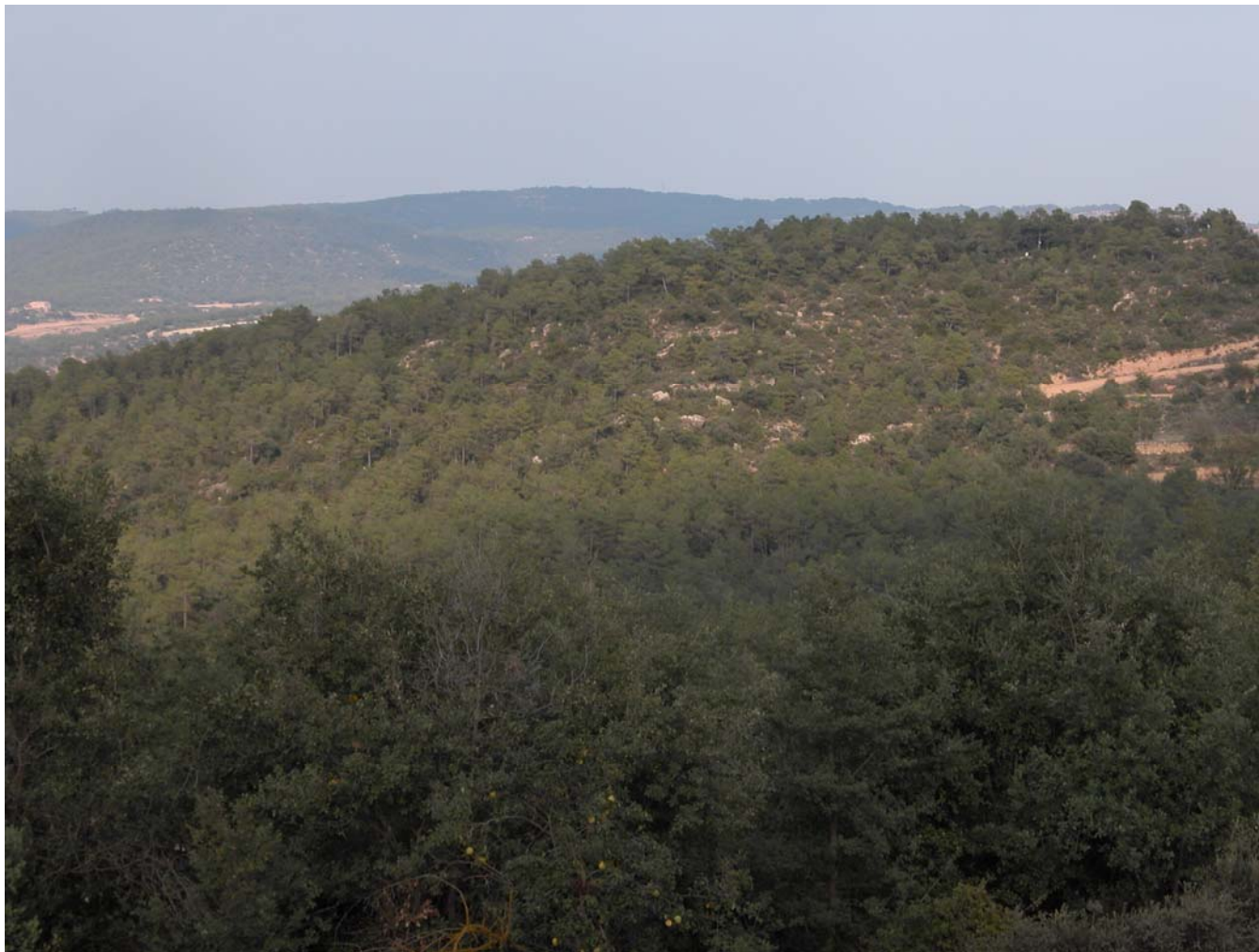
Fig. 5.9. Paisatge forestal de muntanya del serrat de les Valls, al nord de la població de Biosca.

Tot i que els paisatges forestals i de muntanya són més característics del nord de les Terres de Lleida, al sud també hi ha alguns relleus que s'han de tenir en compte. Aquests, es situen al sud de les comarques de l'Urgell i de les Garrigues. Els relleus que presenten generalment formen part del paisatge agrícola de secà, amb cultius d'oliveres, però també hi ha la presència d'extenses pinedes de pi blanc, bosquines de garric i brolles de romaní que conformen un paisatge diferent a l'agrícola. Les principals serres d'aquesta zona són, d'est a oest: la serra del Tallat, la serra de Vilobí, la serra de la Llena (figura 5.10), i el Montmaneu.