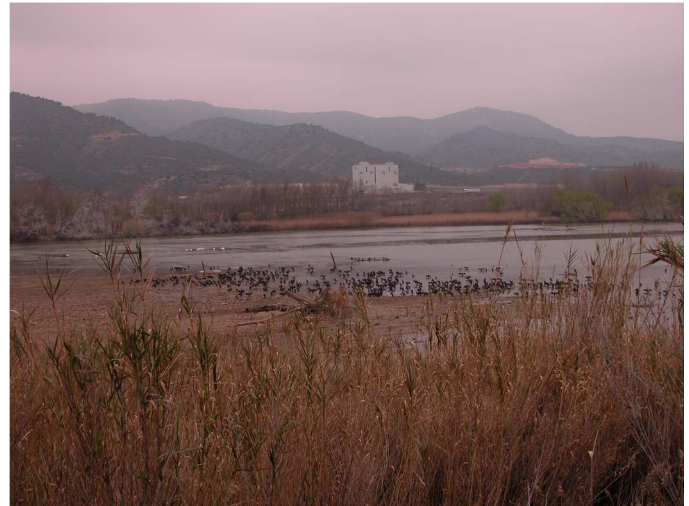
Fig. 5.12. Aiguabarreig Segre-Cinca, a la Granja d'Escarp