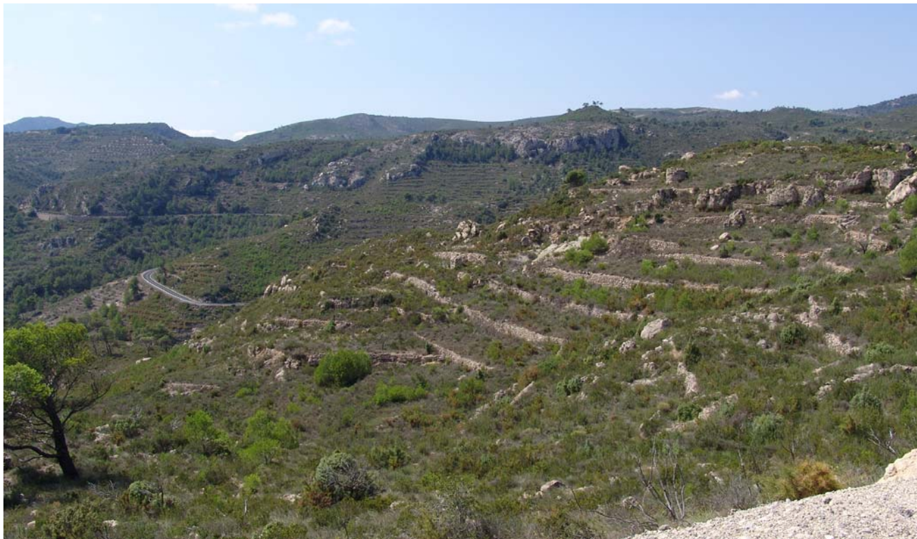
Figura 5.5. Feixes recobertes per pins i per brolles mediterrànies, garrigues i fragments de la màquia de llentiscle i margalló a la serra de Llaberia.

Gairebé a totes les serres calcàries del Camp de Tarragona es pot observar el paisatge que s'acaba de descriure. A la serra de la Figuera (veure figura 5.4), les feixes estan totalment recobertes per pinedes joves de pi blanc, acompanyades de plantes de les garrigues i les brolles. Al Montmell l'erosió del sòl, en combinació amb l'efecte dels incendis forestals, ha modelat un paisatge on entre les taques verdes de les garrigues destaca el color gris de la roca calcària nua que aflora en superfície. No obstant això, on aquest tipus de paisatge ocupa grans extensions és a les serres meridionals: la major part dels vessants de la serra de Llaberia, de la serra de Santa Marina i del massís de Vandellòs estan esglaonats per feixes separades per murs de pedra seca (veure figura 5.5) .