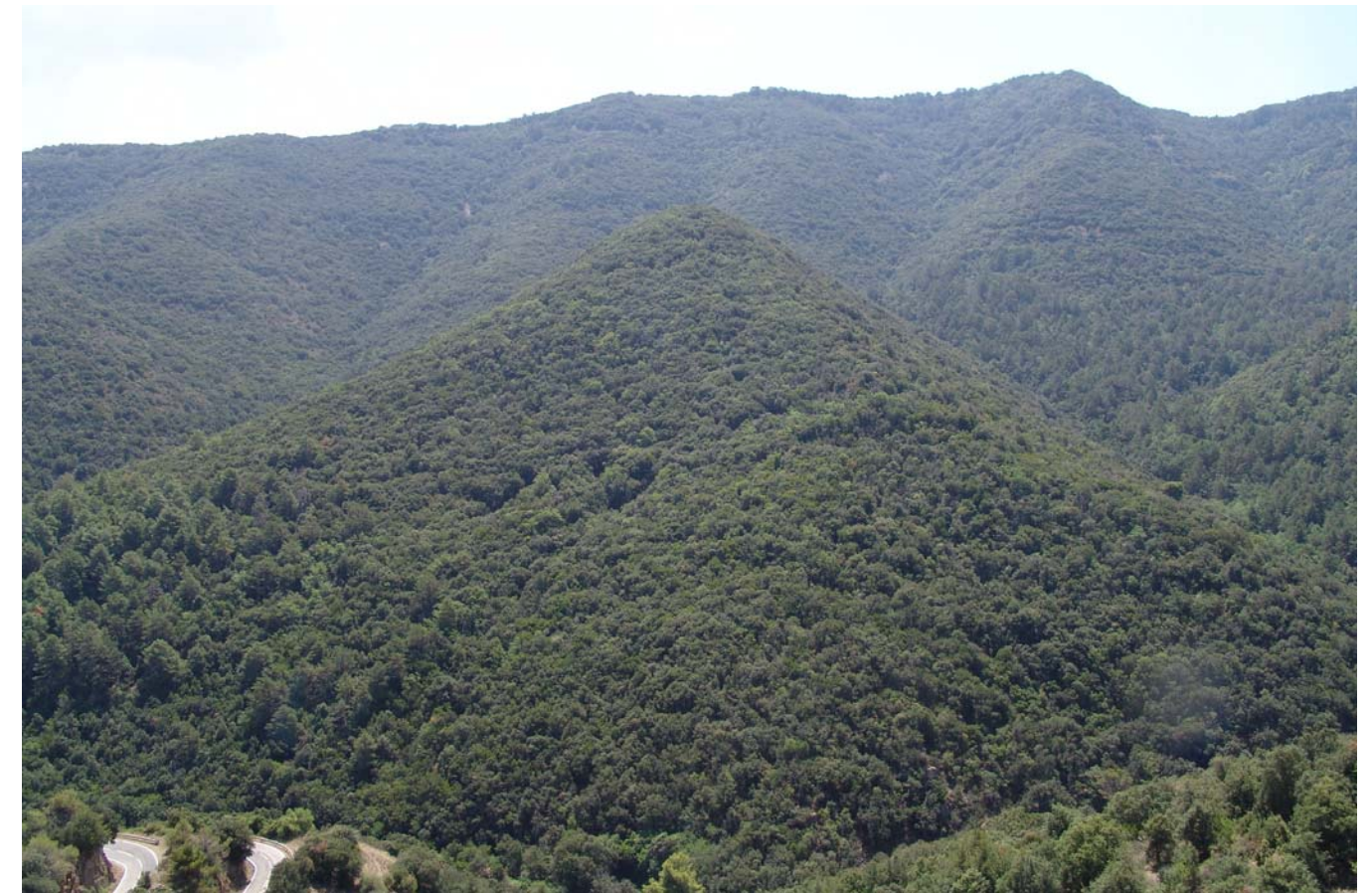
Figura 5.3. Boscos escleròfiles del paisatge forestal de les muntanyes de Prades.

El paisatge forestal és el predominant als sectors de muntanya del Camp de Tarragona. En uns llocs aquest paisatge s'ha mantingut en el temps de forma permanent, ja que les condicions