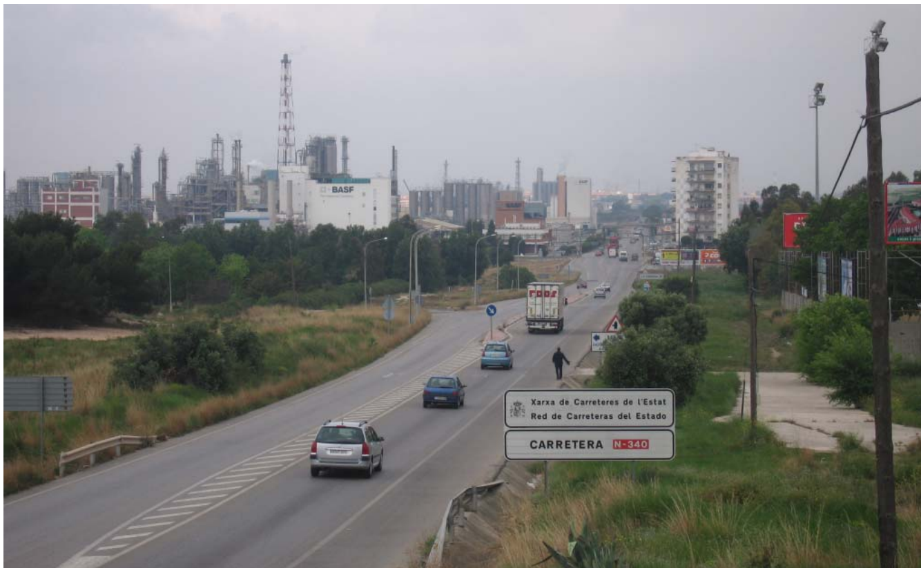
Figura 5.13. Els paisatges híbrids són propis de les perifèries urbanes. A la imatge, captada entre el nucli de Tarragona i Vila-seca, s'observa la gran dispersió d'usos, amb fàbriques, sectors residencials i parcel·les on hi perdura la vegetació espontània. El conjunt comunica una sensació de desordre i una manca d'identitat evident.

Paisatges híbrids que al Camp de Tarragona apareixen a la perifèria de les grans ciutats. Tarragona, Reus, Valls, el Vendrell i Montblanc tenen aquest tipus de paisatge en sectors més o menys extensos de les seves perifèries. Són paisatges on les infraestructures viàries, els