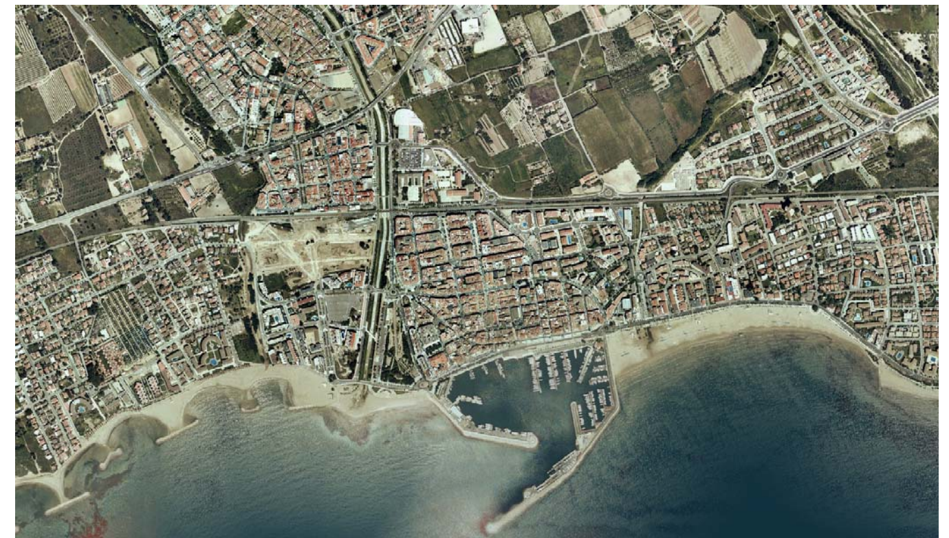
Figura 5.16. La transformació del litoral ha estat molt intensa en alguns trams. A Cambrils la construcció del port va provocar l'erosió de les platges de ponent que van haver de ser protegides amb una tira d'espigons paral·lels a la costa.

Al sud del promontori citat s'inicia un altre llarg tram de platja ampla que es reparteixen els municipis de Roda de Barà, Creixell i Torredembarra, i que finalitza al cap Gros. El paisatge litoral adquireix en aquest tram una riquesa única en el marc del Camp de Tarragona. L'abundància en sorres i un perfil molt suau de la plataforma marina han facilitat la creació d'un cordó de dunes litorals que ressegueix com una sanefa tot el tram de costa. A redós de l'acumulació de sorres eòliques s'hi han desenvolupat un parell de llacunes litorals i el paisatge de maresmes que sovint hi va associat.