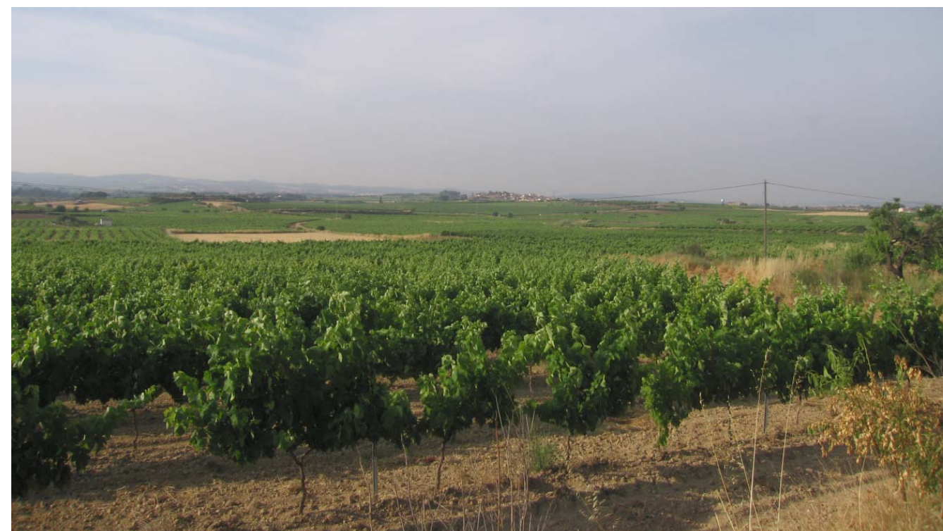
Figura 5.12. Monocultiu de la vinya a la plana del Baix Penedès, prop de Sant Jaume dels Domenys.

ma també unes atencions diligents i il·lustrades que no poden ser realitzades més que sota el zel dels propietaris.»). Gaston Roupnel. «Histoire de la campagne française» . 1978, p. 196.