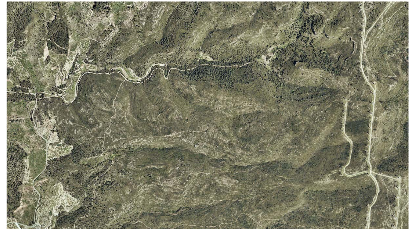
Figura 5.6. La fotografia aèria del vessant occidental de la serra de l'Argentera és un bon exemple de la situació actual del paisatge de la muntanya del Camp de Tarragona. La massa forestal, afectada per un incendi, no és el suficientment densa com per amagar les feixes, que encara són visibles i indiquen l'extensió dels conreus en el passat. També és visible l'antiga xarxa de camins que connectava els sectors de conreu. Destaca també el contrast entre la vegetació esclarissada dels solells i el recobriment vegetal més dens a les obagues, en relació amb les diferències introduïdes pels topoclimes. L'àrea de conreus abandonada es diferencia netament del sector de conreus funcional, situat al fons de la vall, sobre sòls més fèrtils de tonalitats ocre i on es conrea l'avellaner i la vinya. Al costat dret de la imatge s'observa el traçat dels vials oberts per l'emplaçament dels aerogeneradors del parc eòlic de Trucafort.