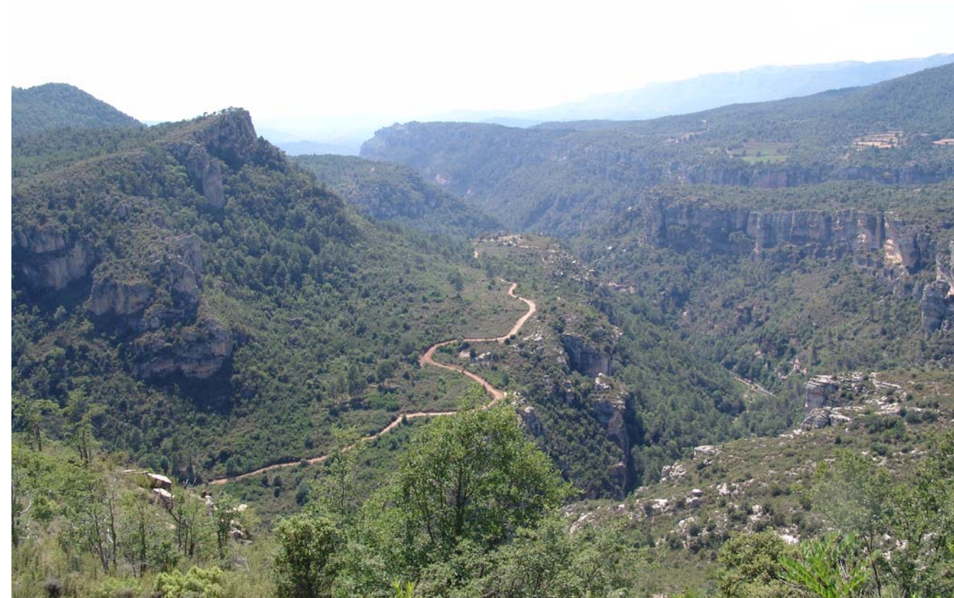
Figura 5.7. Paisatge de cingleres modelades en la sèrie de materials del Triàsic. S'observen dos nivells de costes amb els talussos recoberts per la vegetació i com els conreus i el traçat del camí aprofiten els replans estructurals del revers de les costes. El riu Siurana circula fortament encaixat i al fons, coronant la cinglera, s'albira el nucli de Siurana.

El paisatge dels cingles està força estès en el Camp de Tarragona a causa, sobretot, de la importància de la sedimentació de materials del Mesozoic que es va produir en aquesta àrea. Les cingleres caracteritzen el paisatge de petites àrees sovint de contacte entre un sector de muntanya i un lloc deprimit topogràficament. La vora sud de la Mussara, per exemple, està flanquejada per un cinyell de cingles disposat en direcció est-oest al llarg de varis quilòmetres que destaquen alterosos sobre el fons de la depressió d'Alforja i Vilaplana. També a la Mussara,