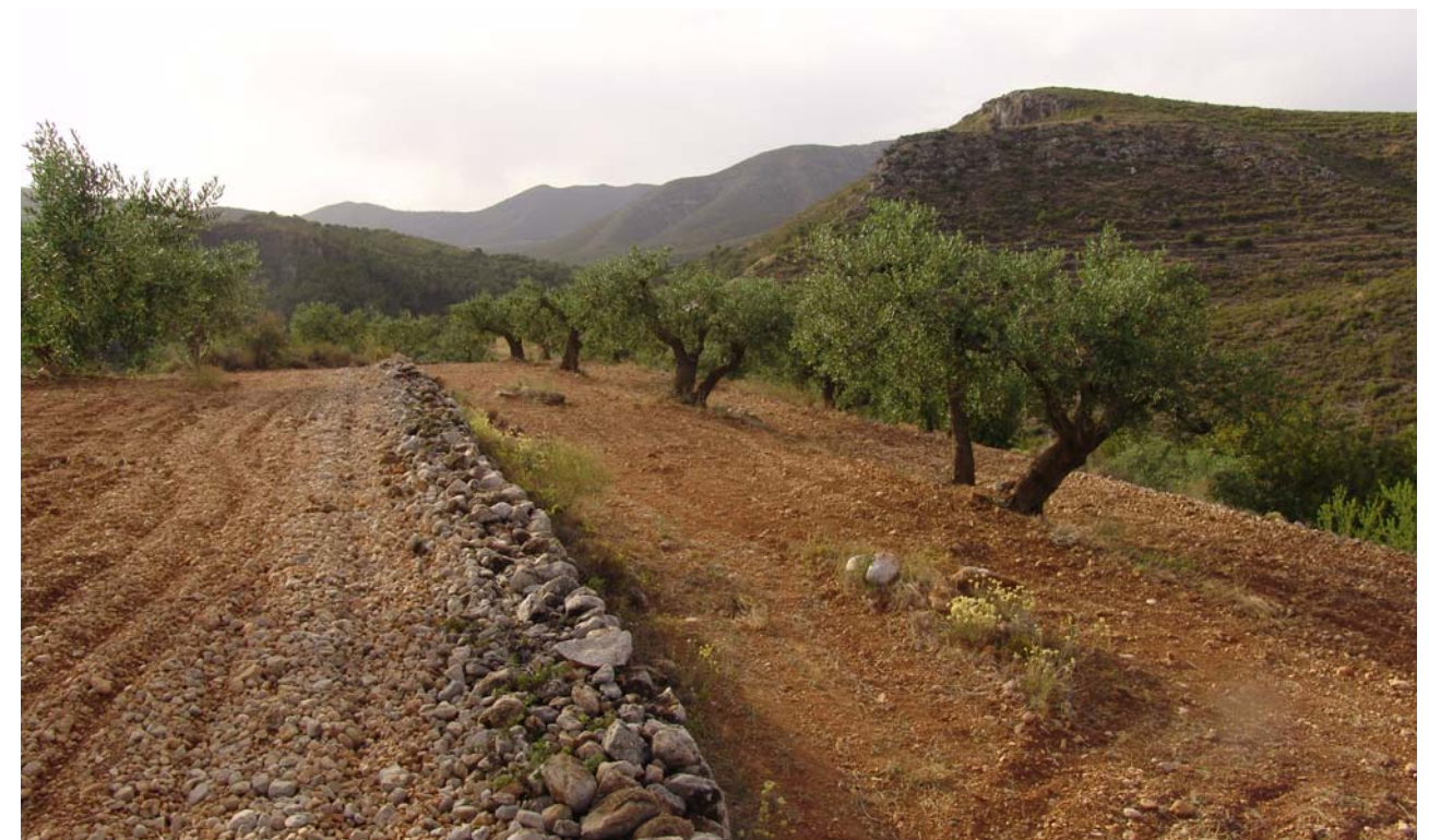
Figura 5.1. Feixes amb oliveres a les muntanyes del Montmell, un paisatge de muntanya mediterrània que s'interposa entre les planes agrícoles del Baix Penedès i de l'Alt Camp.

b) Un relleu accidentat, on les muntanyes prevalen sobre les planes: el Mediterrani, un mar entre terres, és més aviat un mar entre muntanyes. Les serralades i els massissos muntanyosos es disposen a poca distància de la costa i actuen com autèntiques muralles pètries que fan que el mar aparegui com encerclat, com un domini tancat. Al mateix temps, moltes d'aquestes muntanyes han actuat com a punts de referència per als navegants (al Camp de Tarragona el