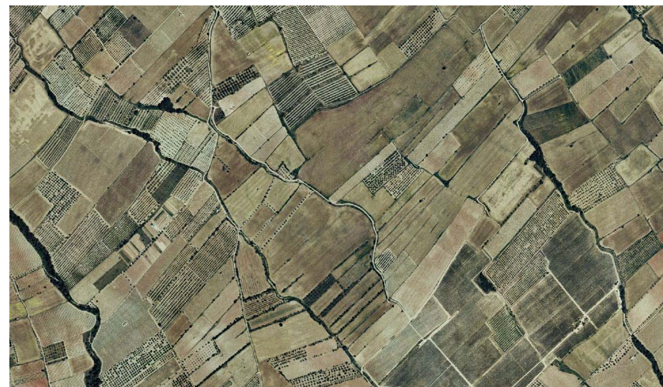
Figura 5.10. Mosaic agrícola a la plana de l'Alt Camp, entre el Pla de Santa Maria i Valls, amb cereals, oliveres i vinya, i amb els fragments de vegetació natural reduïts a estretes bandes de vegetació de ribera.

Encara que la identificació dels paisatges agroforestals varia amb l'escala, fins i tot en paisatges agrícoles molt homogenis es poden distingir elements naturals com estretes línies de vegetació que ressegueixen els canals de rec i els cursos d'aigua. El cert és que, en indrets molt favorables al conreu, els vestigis de bosc han pràcticament desaparegut i el paisatge que en resulta és una gran àrea agrícola homogènia, a vegades monòtona, on els canvis en els cultius d'una a una altra parcel·la, així com la mida i la forma de les mateixes, són els únics