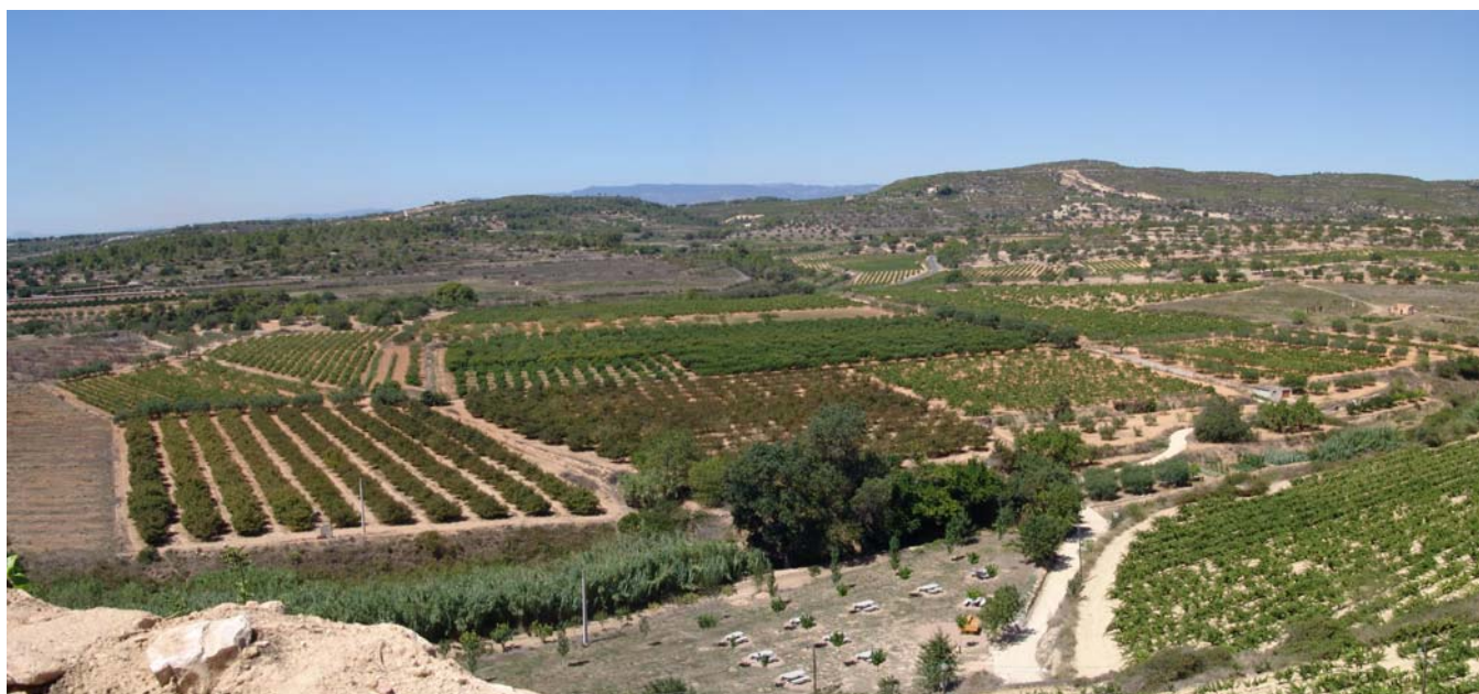
Figura 5.2. Policultiu de conreus llenyosos: avellaner, ametller, olivera, vinya i garrofer a La Nou de Gaià, una mostra de les preferències de l'agricultura mediterrània per l'arboricultura.

Montmell n'és un bon exemple). Les planes són l'excepció, ja que en molts casos corresponen a accidents tectònics. A dovelles de l'escorça enfonsades, com en el cas de la plana del Camp, quan el paroxisme alpí acabava d'aixecar les muntanyes circumdants. També hi ha estretes andanes litorals construïdes en els materials erosionats i dipositats al peu de les serres costaneres, durant molt de temps espais inhòspits a causa de les llacunes i maresmes que eren font de paludisme i avui són codiciades pel sector immobiliari.