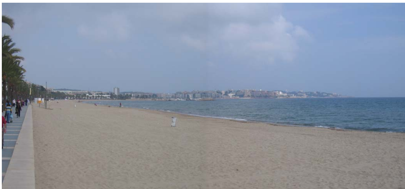
Figura 5.17. Salou és una de les primeres destinacions turístiques de la costa catalana. Les platges amples, de sorra fina i poc pendent, han estat considerades com molt adequades per a un turisme de tipus familiar.

Entre el cap Gros i el promontori del castell de Tamarit s'estén una altra faixa de costa baixa, que correspon al terme d'Altafulla. Malgrat que el poble corona un petit turó situat uns centenars de metres terra endins, manté un petit barri mariner avui dia amb funcions turístiques. El riu Gaià desemboca en aquest tram litoral i genera una petita zona humida, que introdueix un element de diversitat paisatgística i ecològica al front marítim de la plana costera.