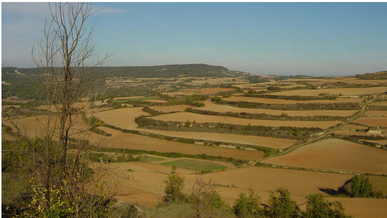
Figura 5.8. Paisatge agroforestal de la Baixa Segarra. Els camps estan esglaonats i separats per marges de vegetació arbustiva que ressegueixen les corbes de nivell. És un paisatge harmònic de línies i formes sinuoses amb forts contrastos cromàtics entre els colors ocres que predominen a l'hivern i les gammes de verd que introdueixen els cereals a la primavera.

Al Camp de Tarragona els mosaics agroforestals són força comuns arreu excepte a la gran plana del Camp, recoberta gairebé únicament pels conreus. Els mosaics de camps i boscos ocupen grans extensions als altiplans de la Baixa Segarra i a les planes lleugerament ondulades que es troben al fons de les fosses, conques i depressions, de manera que estan molt ben