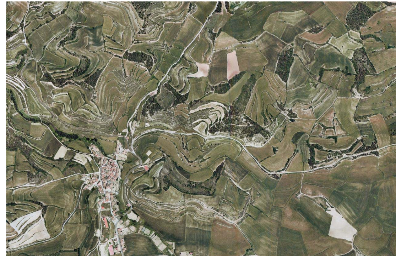
Figura 5.9. Mosaic agroforestal dels voltants de Conesa, a la unitat Baixa Segarra. La matriu agrícola està constituïda per camps de cereals que engloben claps forestals aïllats que mantenen poblacions de pins, alzines i roures de fulla petita. Les parcel·les, amb contorns curvilinis, adapten la seva forma i mida al relleu mentre que els marges de vegetació dibuixen les corbes de nivell. L'estructura de la xarxa de camins és radial amb origen en el nucli de població. El conjunt forma un paisatge harmònic que s'ha mantingut gairebé immutable durant segles.

representats i són les cèl·lules de paisatge principals a les unitats de paisatge de la Conca de Poblet, Plana del Baix Penedès, Baix Priorat i depressió d'Alforja i Vilaplana. A una escala més de detall també es distingeixen mosaics agroforestals en indrets del massís de Bonastre, dels camps de Santes Creus, a la plana de l'Alt Camp i a l'Alt i el Baix Gaià.