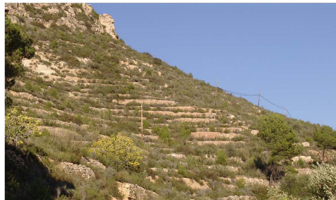
Figura 5.4. Vessant de la serra de la Figuera esglaonat en feixes abandonades en els darrers anys, un paisatge habitual a la muntanya calcària del Camp de Tarragona.

La vegetació natural va reprendre lentament la colonització dels espais abandonats. Avui, moltes muntanyes calcàries del Camp de Tarragona estan recobertes per unes comunitats vegetals similars, que tenen una mateixa data d'origen: els anys 50 i 60 del segle passat (principalment les pinedes de pi blanc, les brolles i les garrigues). Després de molts segles d'afaiçonament del paisatge mediterrani en relació amb les necessitats humanes, apareix ara un paisatge nou: les extenses masses de vegetació que recolonitzen sense cap tipus d'impediment uns espais perduts feia segles i que són afectades pel foc forestal de manera recurrent. D'aquesta