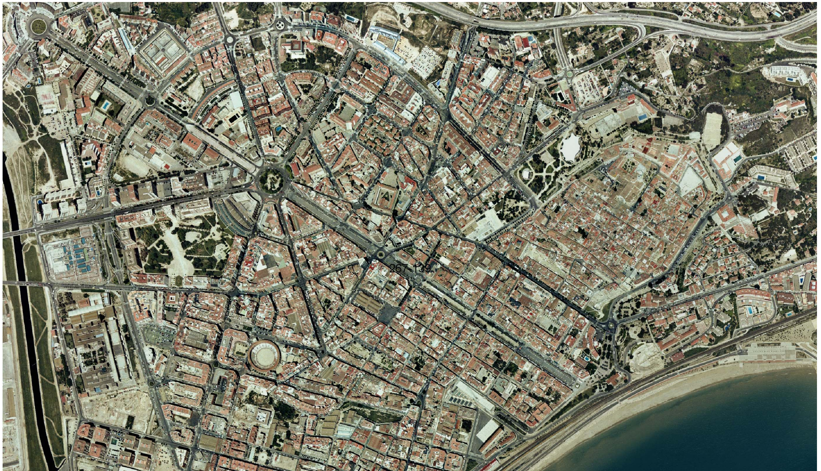
Figura 5.15. Fotografia aèria del centre de la ciutat de Tarragona, on es distingeixen els diferents sectors o barris de la ciutat. La ciutat vella, a la dreta de la imatge, es distingeix per la trama compacta i els carrers estrets i de traçat irregular. Els eixamples iniciats el segle XIX s'estenen fins a la riba del Francolí, amb els carrers que formen una malla geomètrica on destaca la plaça Imperial Tàrraco, de forma circular, des d'on surten la Rambla i les principals arteries de la ciutat.