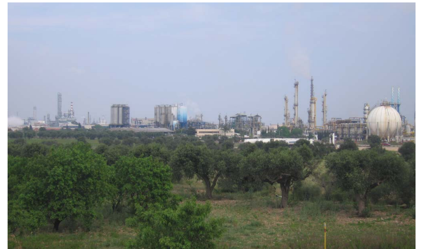
Figura 5.14. Al Camp de Tarragona la concentració d'indústries petroquímiques ha generat un paisatge metàl·lic constituït per una diversitat de cossos geomètrics i de laberints de canonades que segueixen itineraris tortuosos. És un paisatge que es transmuta amb la foscor de la nit, amb xemeneies que flamegen a costa dels gasos sobrers. És també un paisatge de risc, de núvols tòxics i de vessaments de substàncies contaminants. Mentre, en els camps propers, les oliveres, els ametllers i els garrofers resten impàvids de cara a la modernitat.