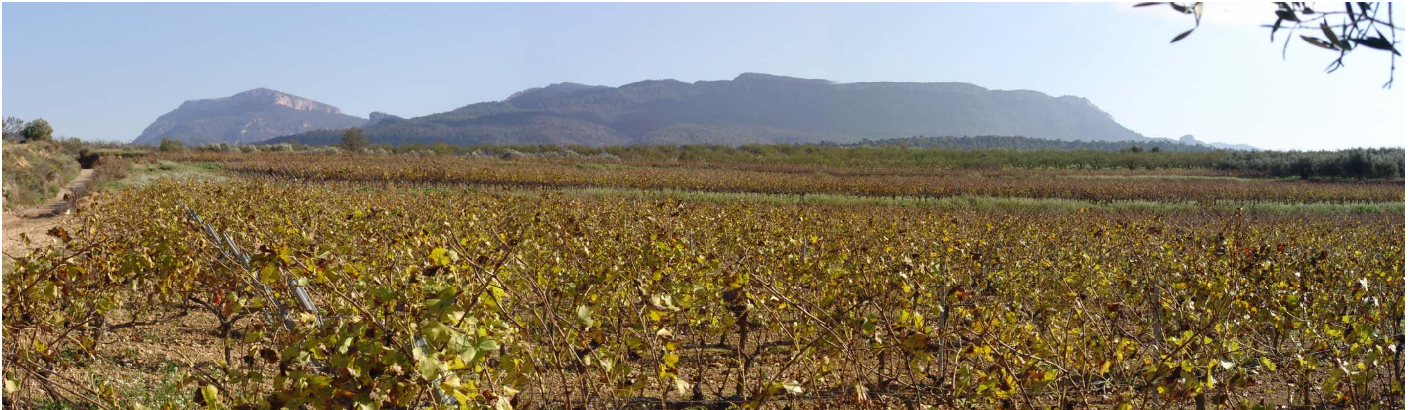
Figura 5.11. Paisatge de la vinya al Baix Priorat, prop de Capçanes. A la tardor els colors daurats dels pàmpols en contrats amb els verds de la vegetació i els matisos del blau de l'horitzó generen un paisatge amb un alt valor estètic, que és reforçat en aquest cas per les siluetes de la mola de Colldejou i la serra de Llaberia.

aspectes morfològics d'importància. Els mosaics que existeixen en aquests paisatges atenyen només als diferents tipus de conreu que s'hi troben. Els elements naturals estan reduïts a la més mínima expressió (veure figura 5.10).