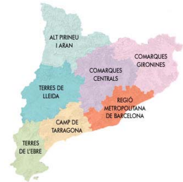
Fig. 1.2: Àmbits territorials d'aplicació dels catàlegs de paisatge