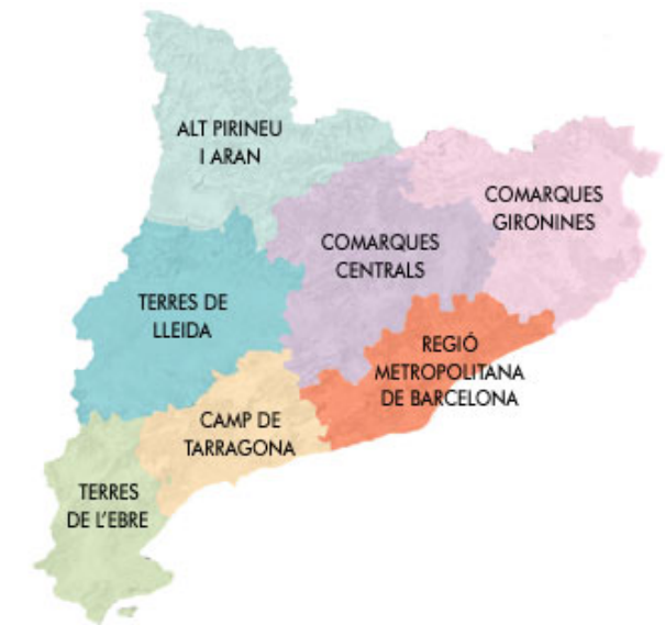
Fig. 1.2. Àmbits territorials d'aplicació dels catàlegs de paisatge