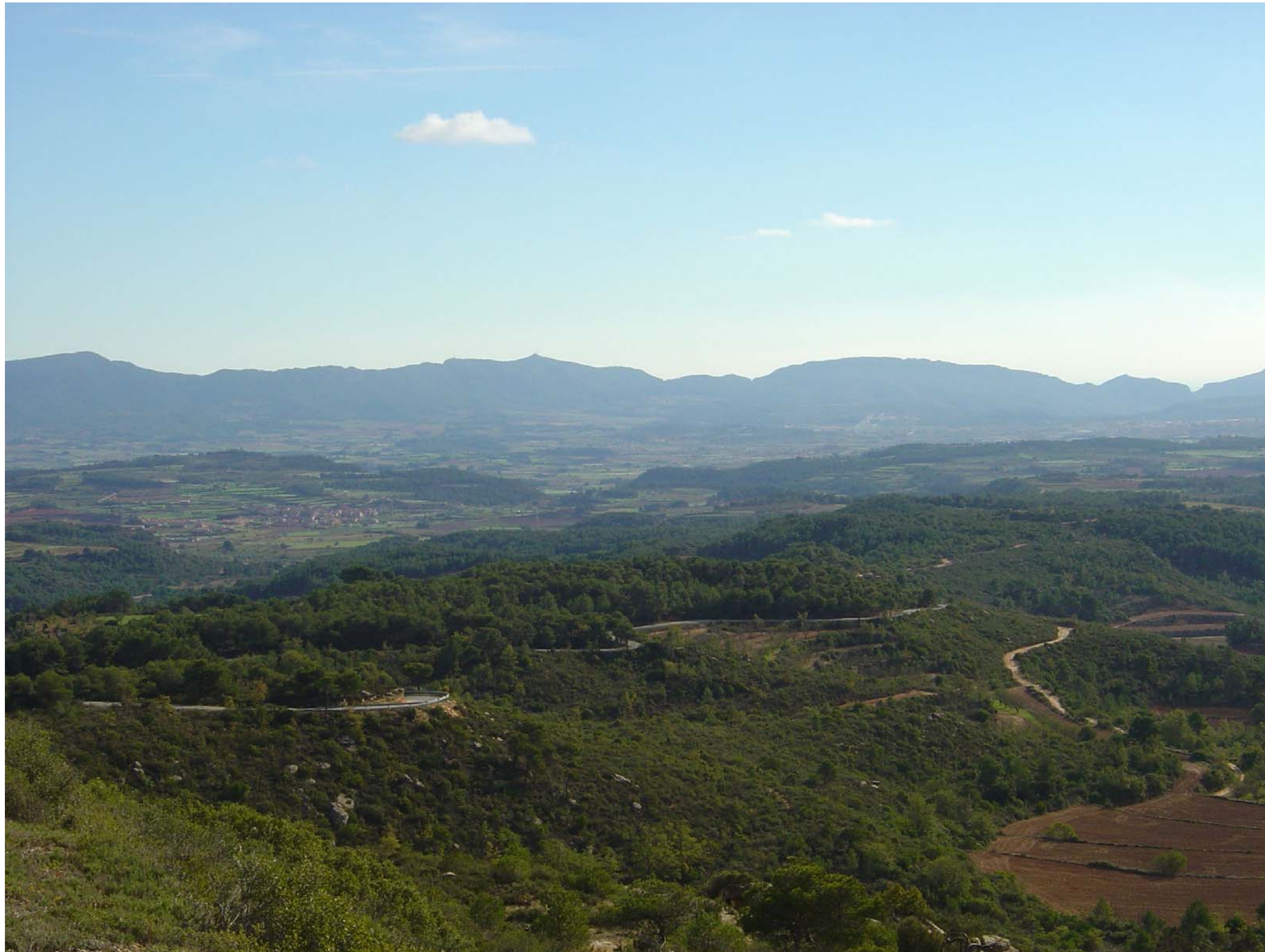
Figura 12.15: Vista panoràmica de Blancafort i Solivella des de la Serra del Tallat.