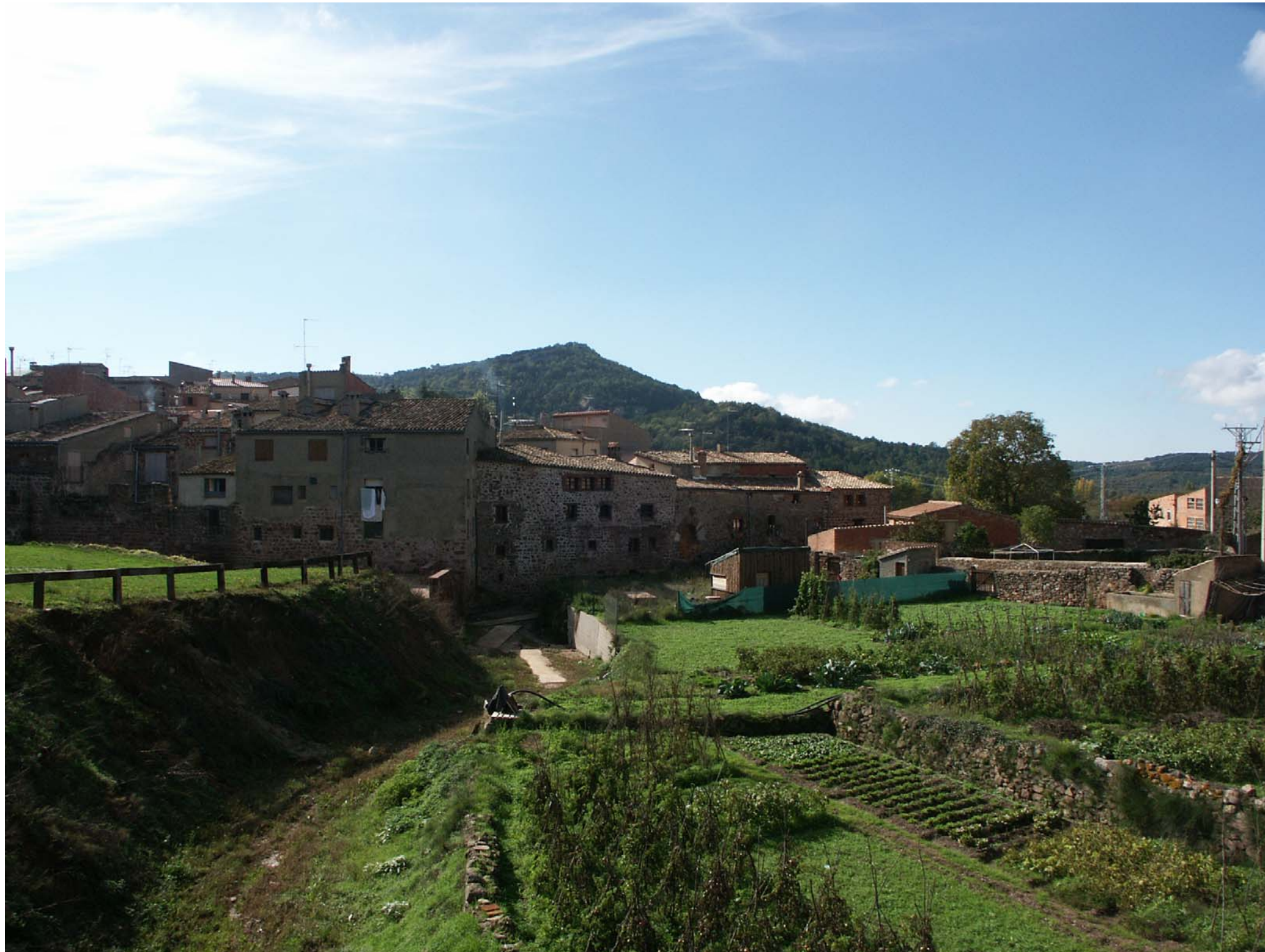
Figura 12.3: Nucli de Prades.