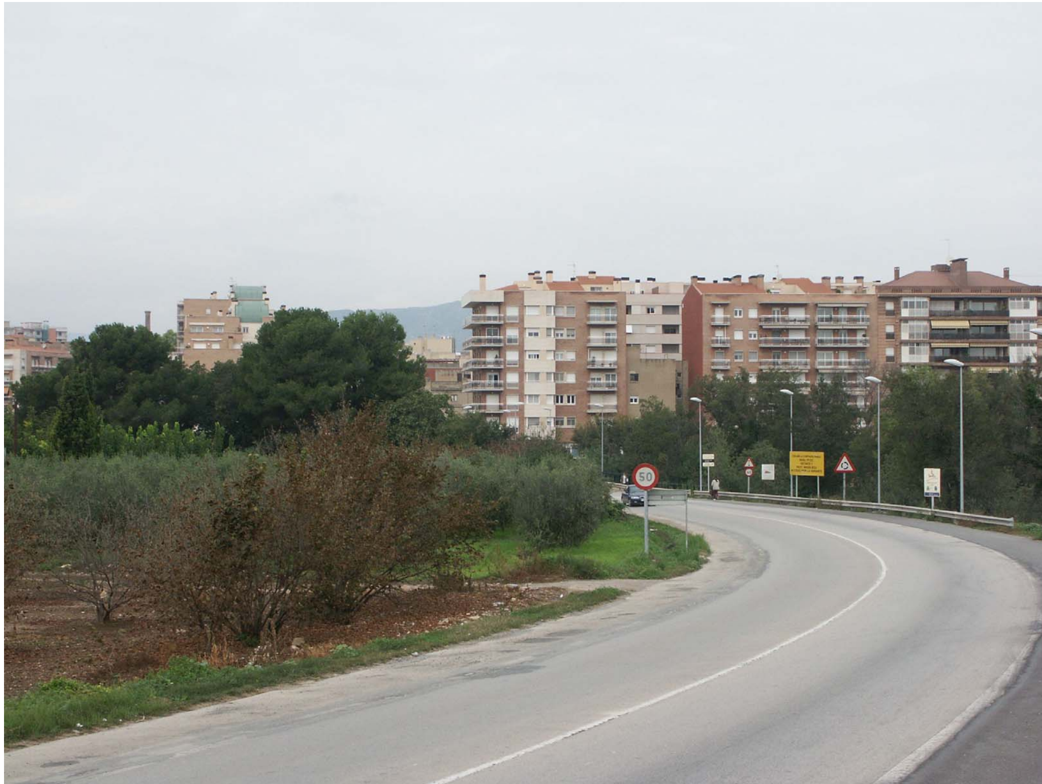
Figura 12.10: Accessos a la ciutat de Valls.