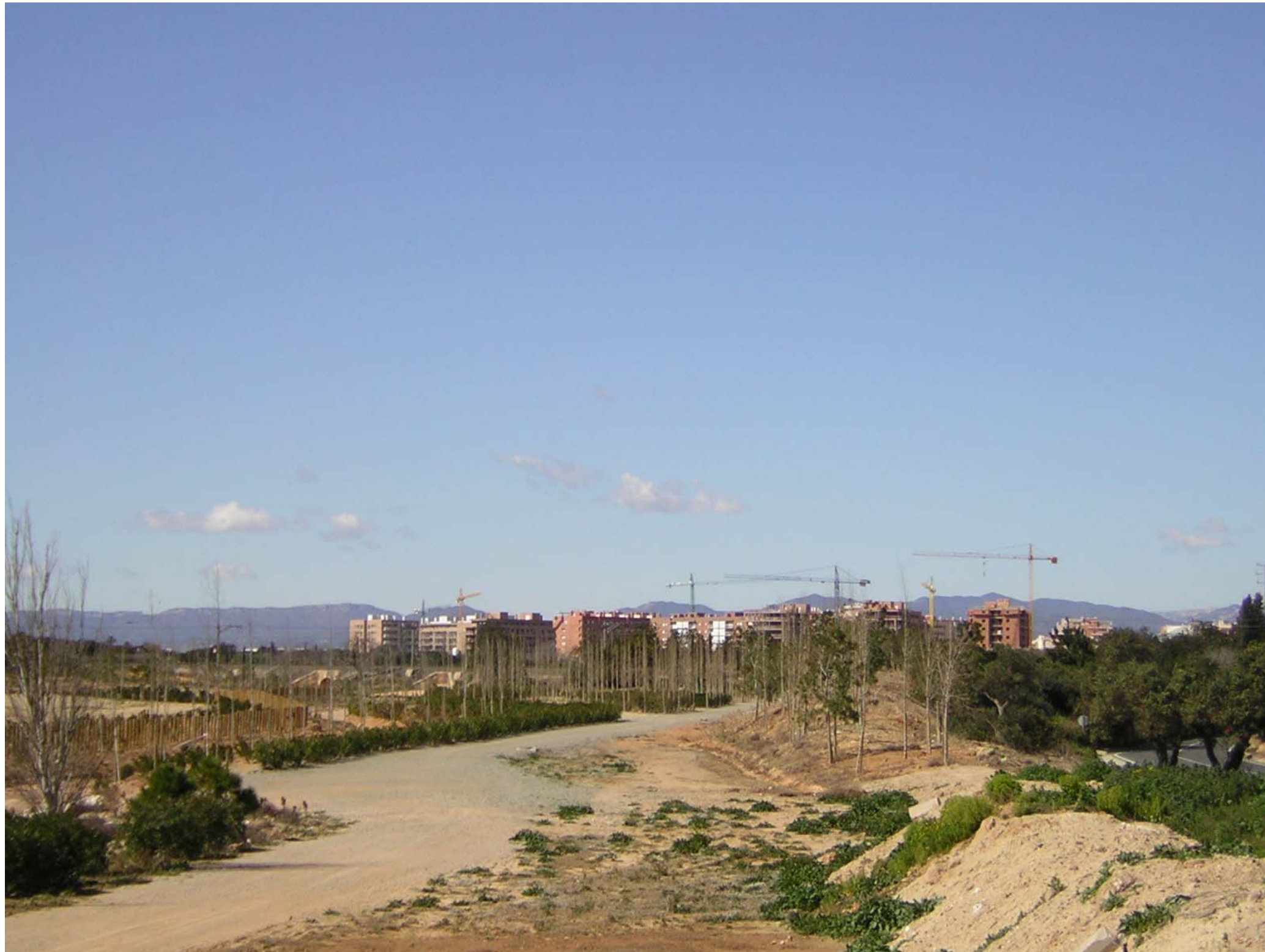
Figura 12.11: Espai periurbà del Baix Camp.