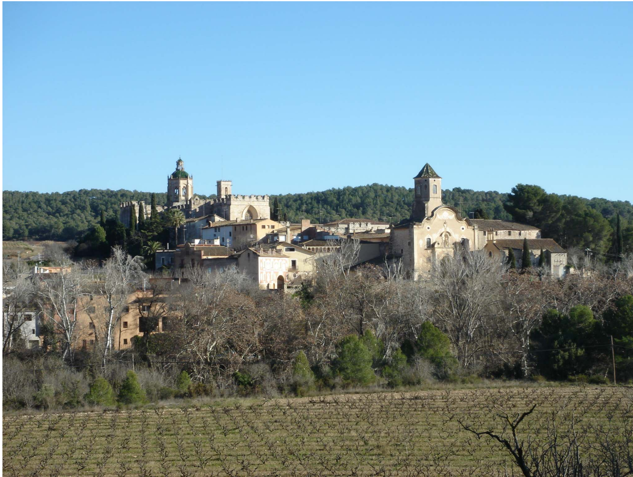
Figura 12.22: Monestir de Santes Creus.