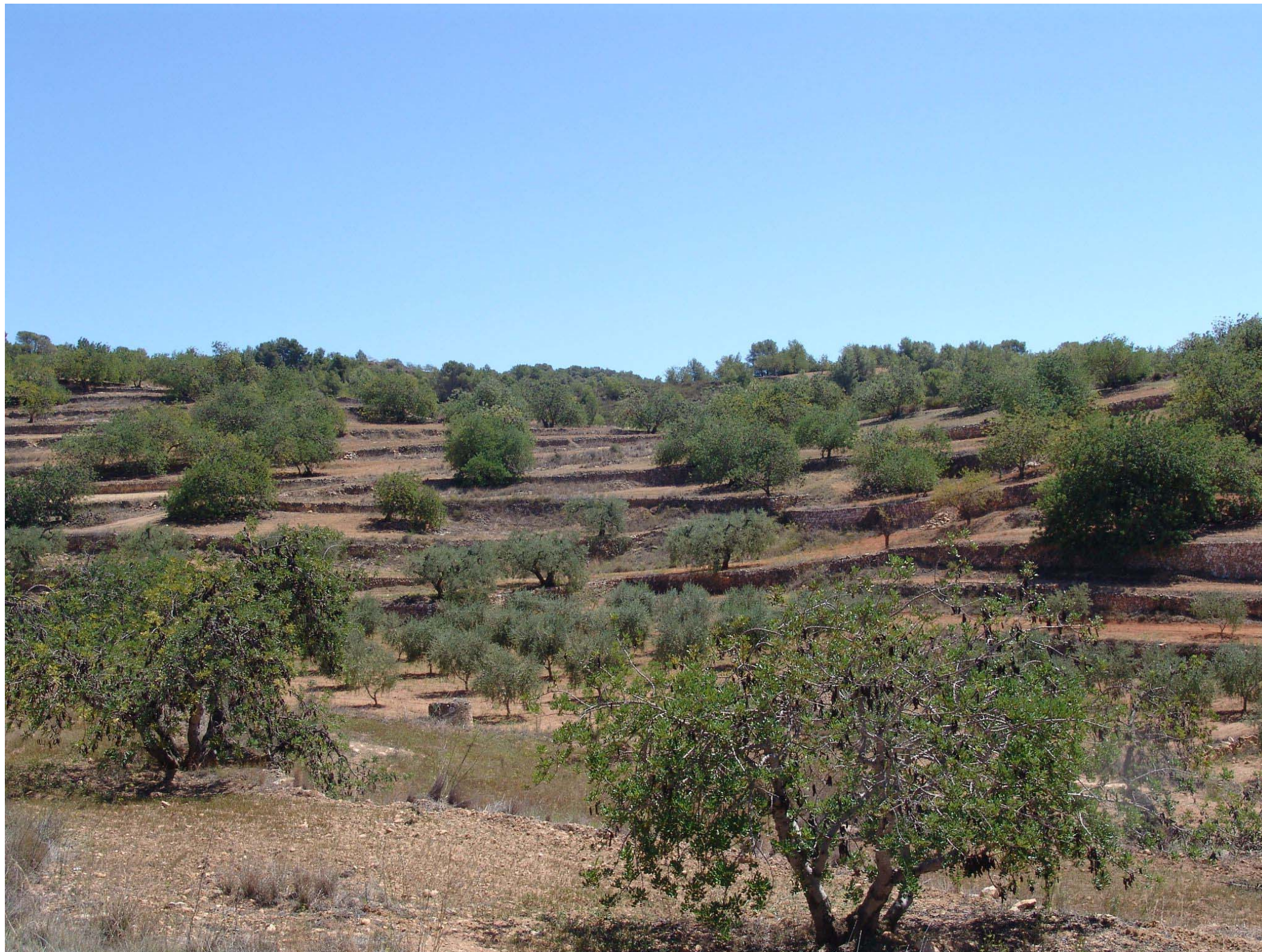
Figura 12.18: Paisatge del garrofet en un coster esglaonat a la Nou de Gaià.