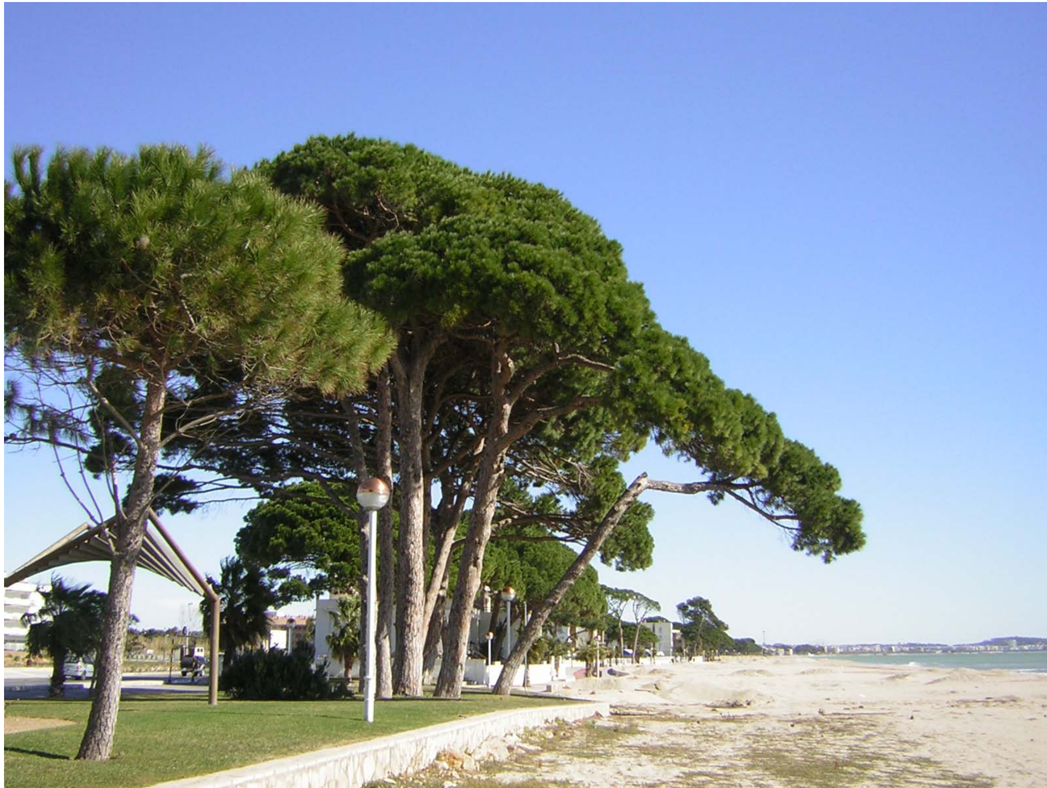
Figura 12.6: Platja de Vilafortuny.