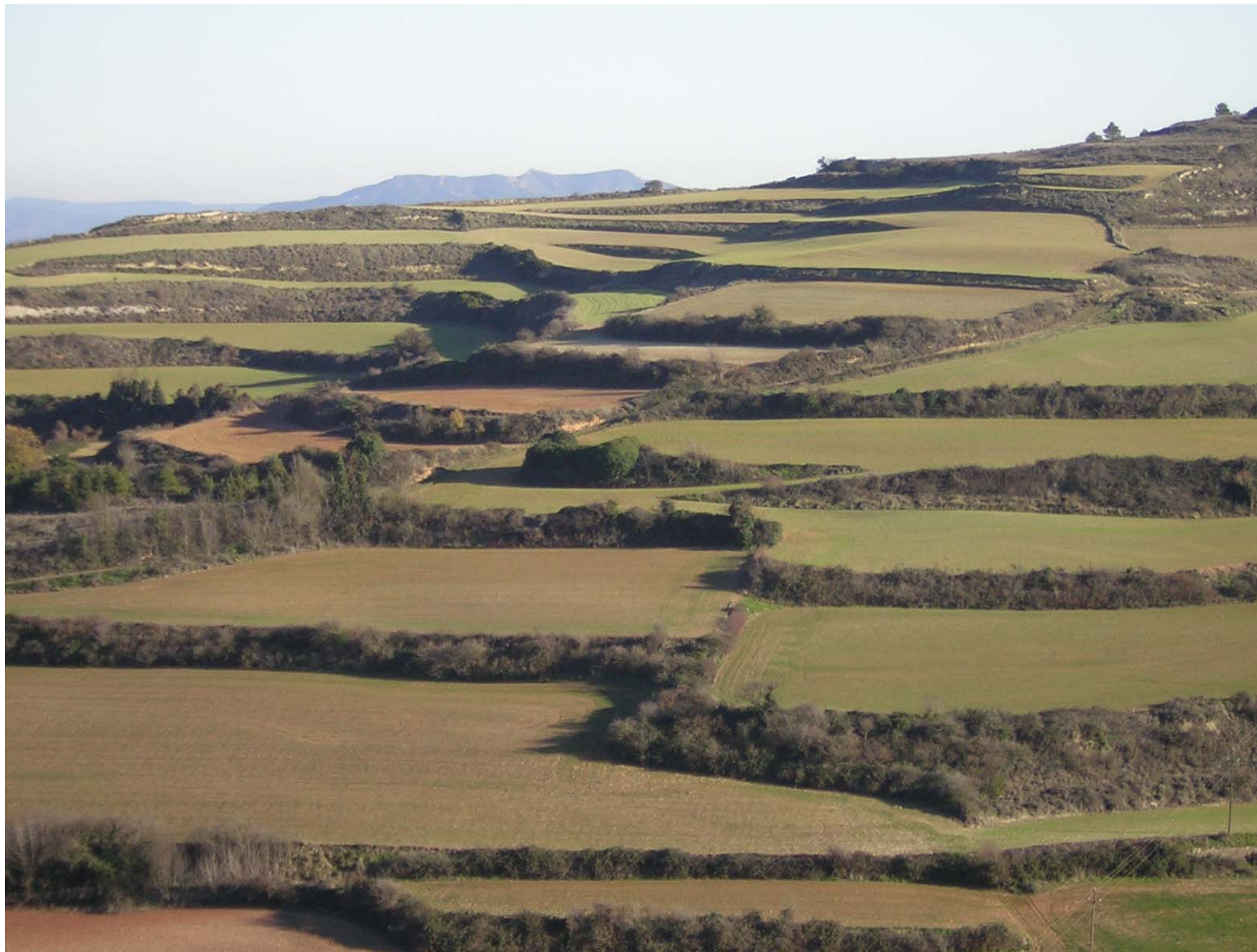
Figura 12.20: Conreus cerealístics de Santa Coloma de Queralt.