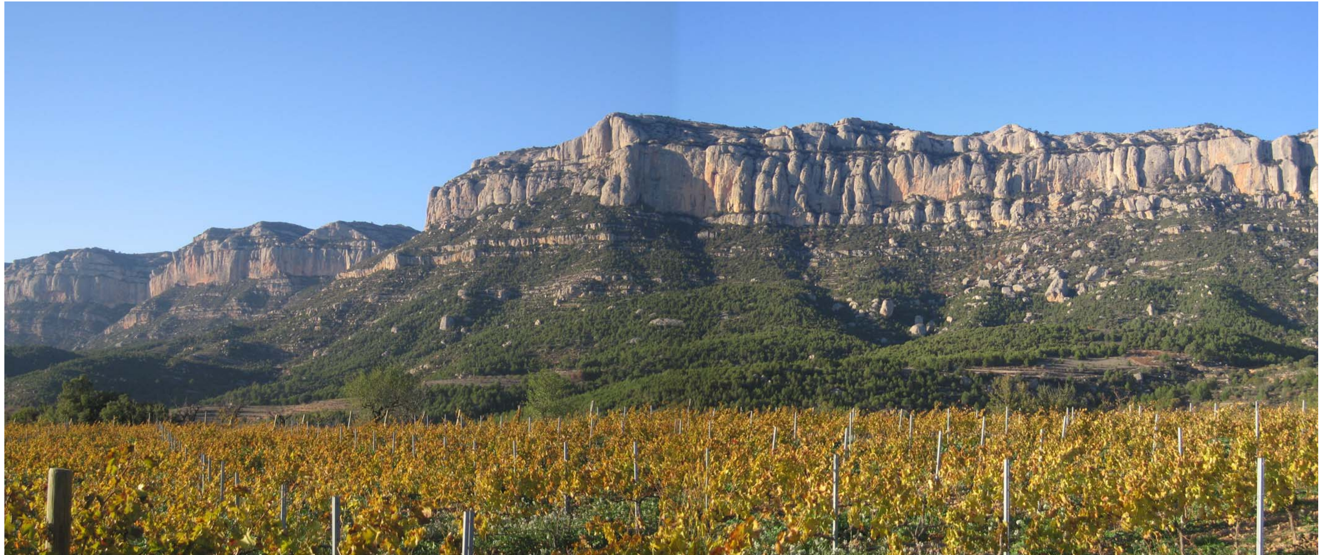
Figura 12.14: Cinglera de la Serra Major del Montsant