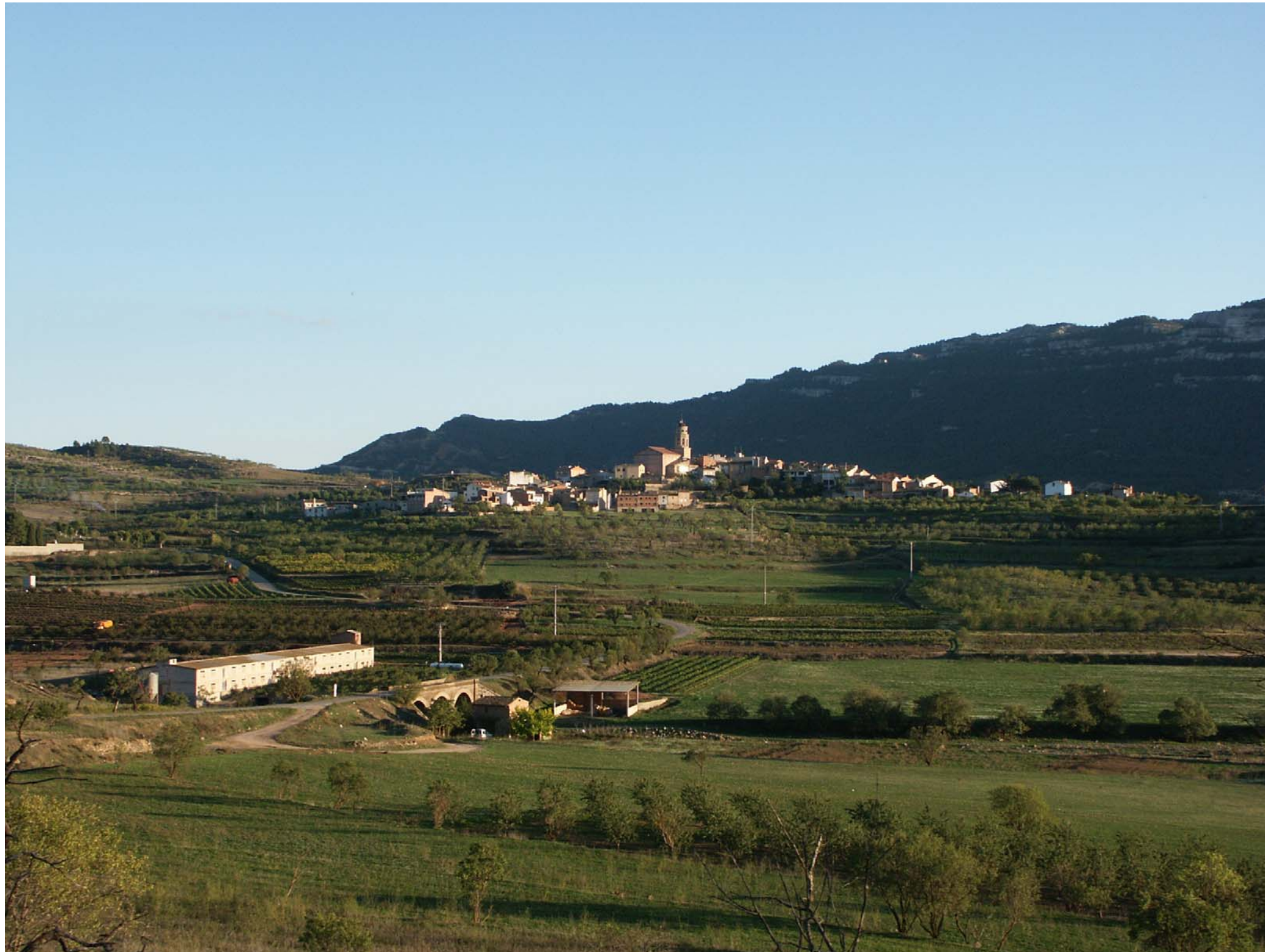
Figura 12.8: Nucli d'Ulldemolins.