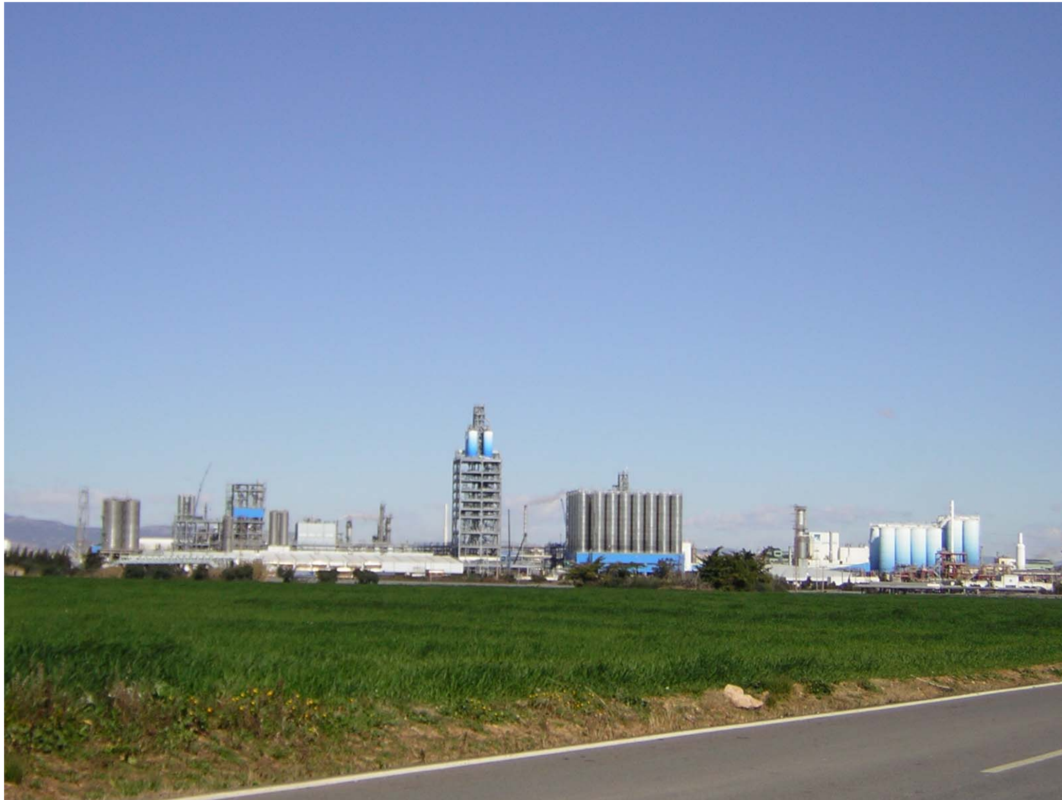
Figura 12.12: Polígon industrial de la Pobla de Mafumet.