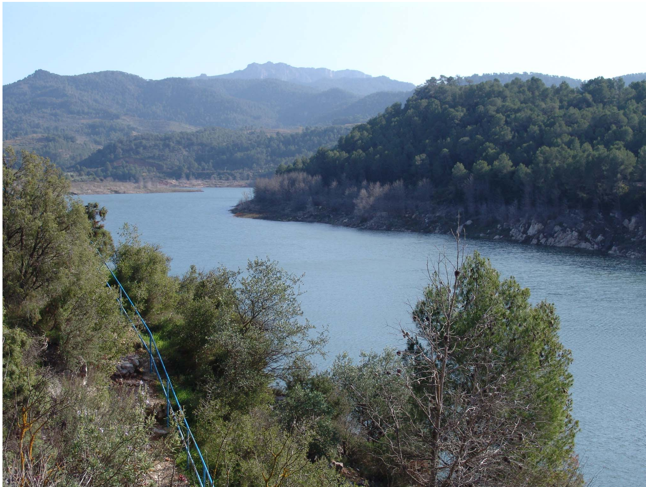
Figura 12.21: Pantà de Guiamets.