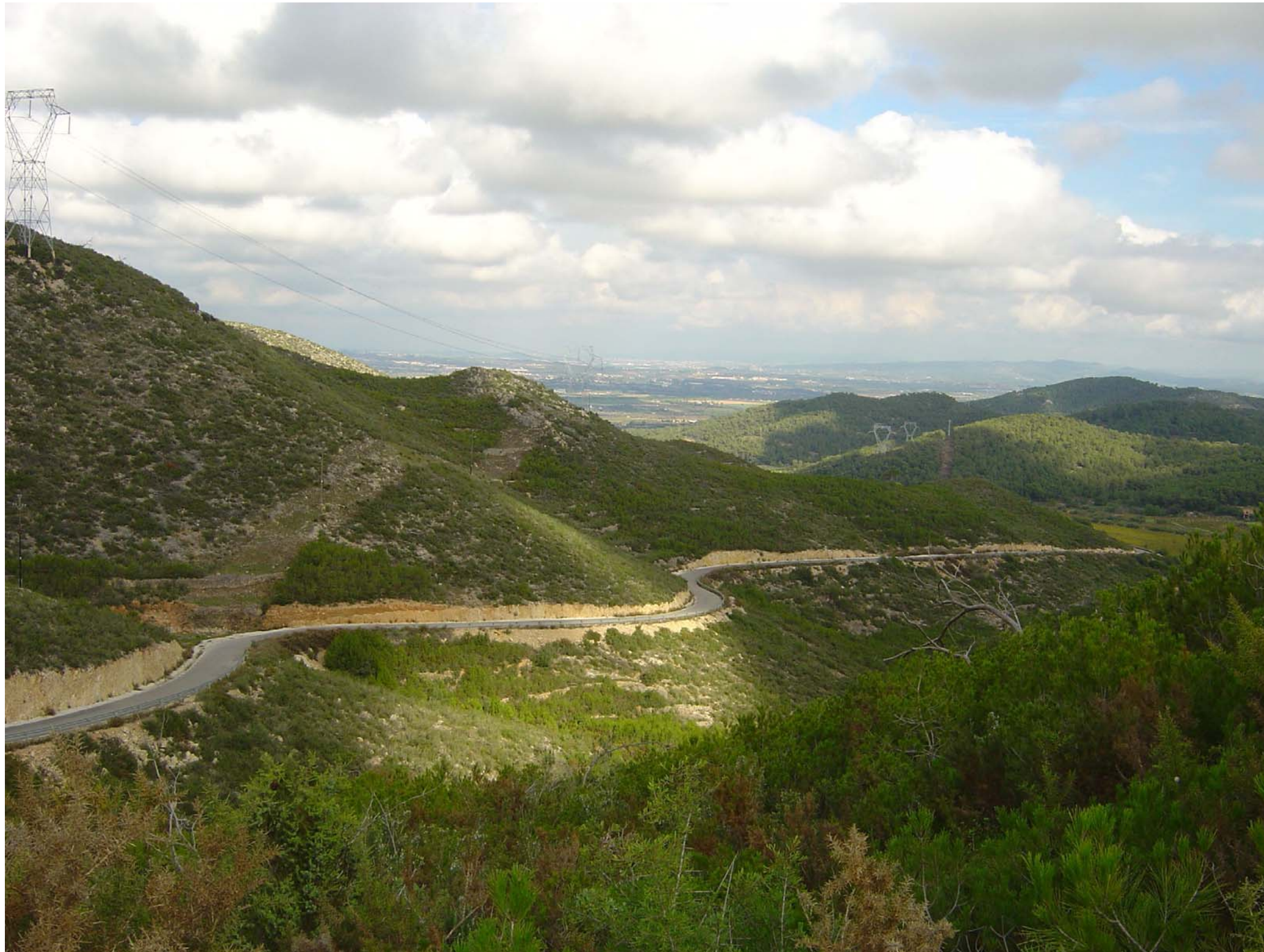
Figura 12.9: Carretera de Bonastre a Albinyana.