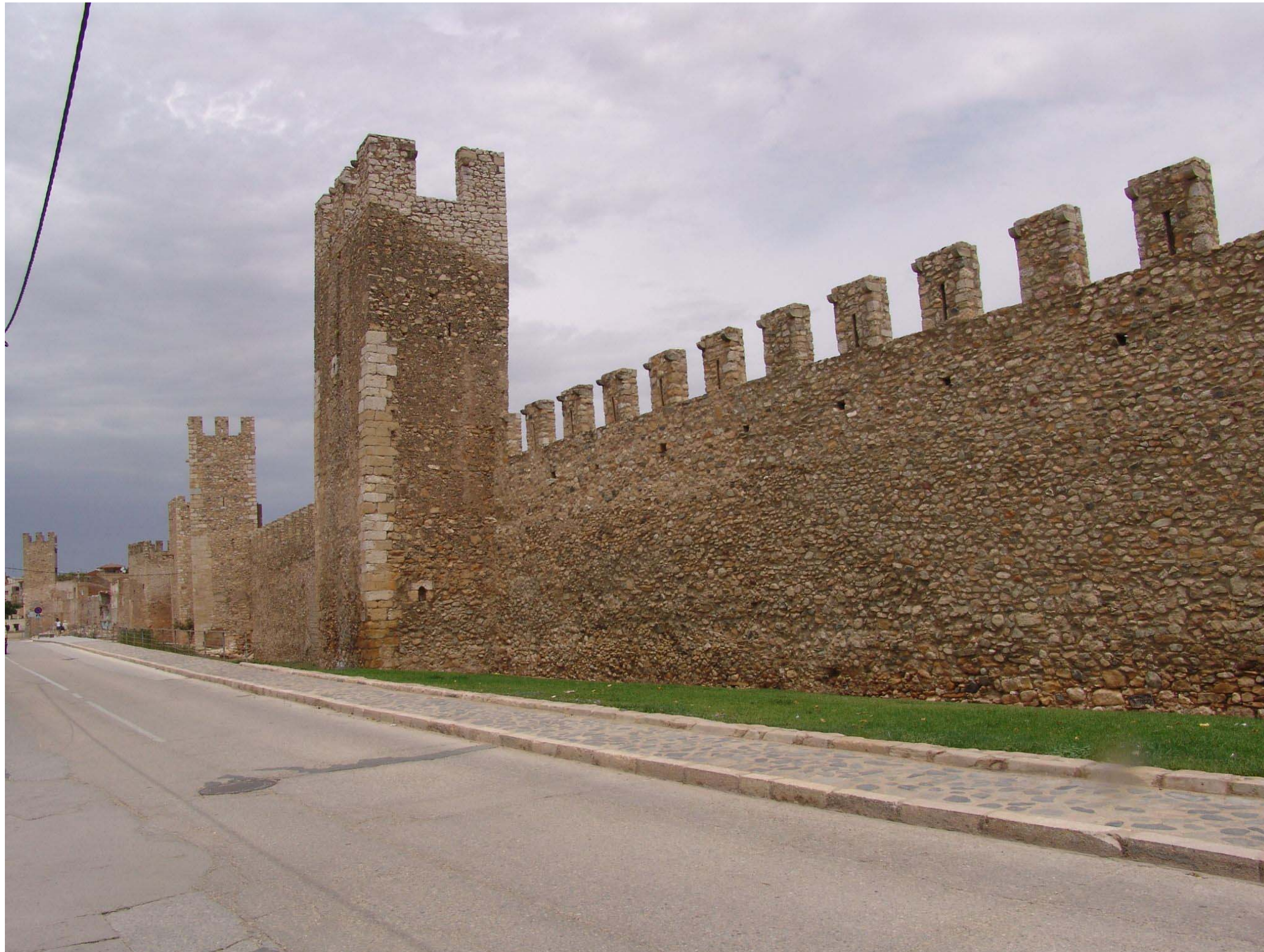
Figura 12.2: Muralles de "Montblanc.