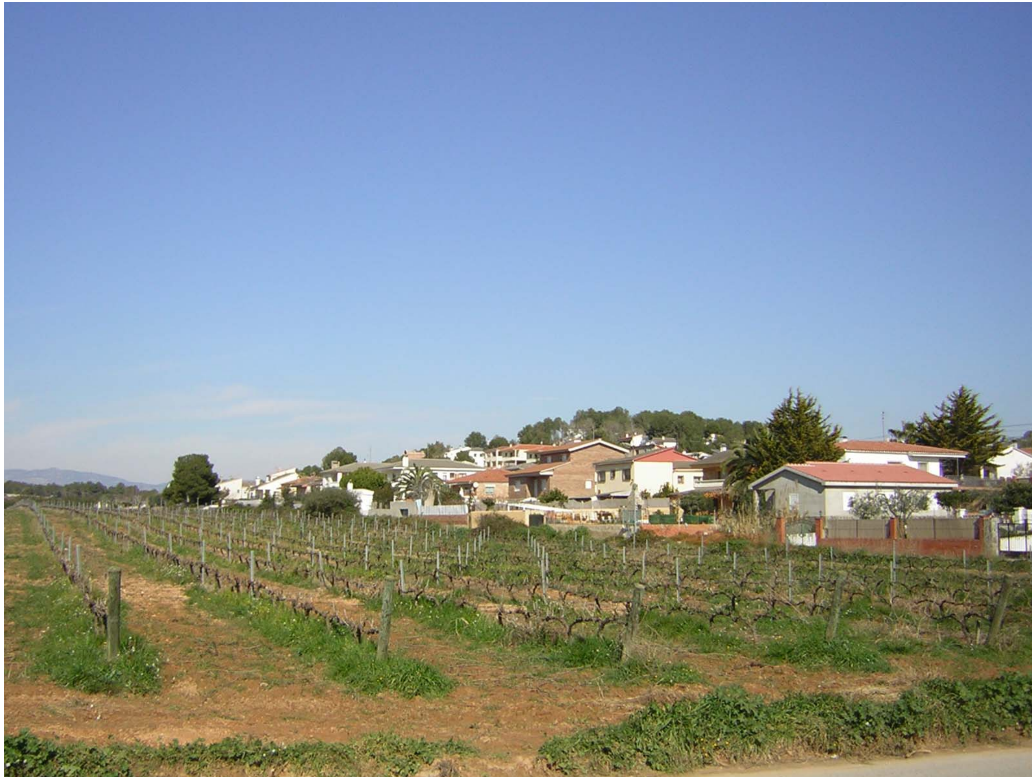
Figura 12.4: Urbanització.