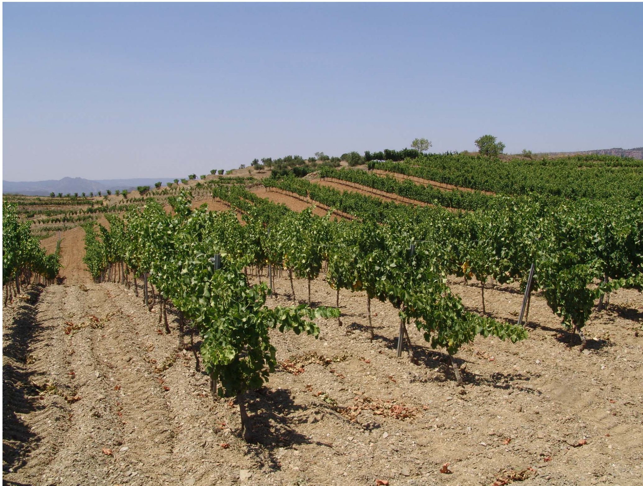
Figura 12.17: Camps de vinyes a Gratallops.