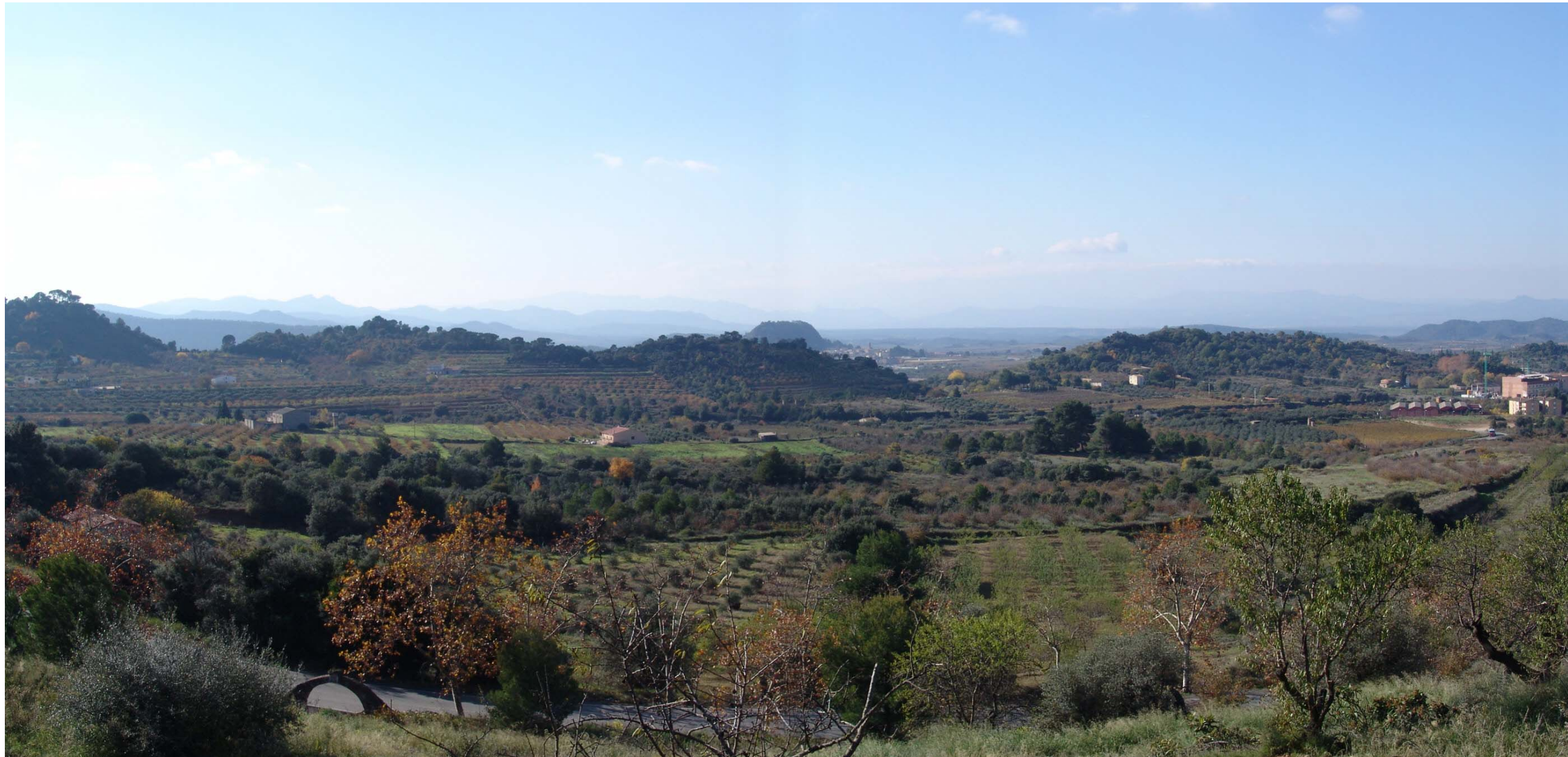
Figura 12.16: Mosaic agrícola entre Falset i Marçà.