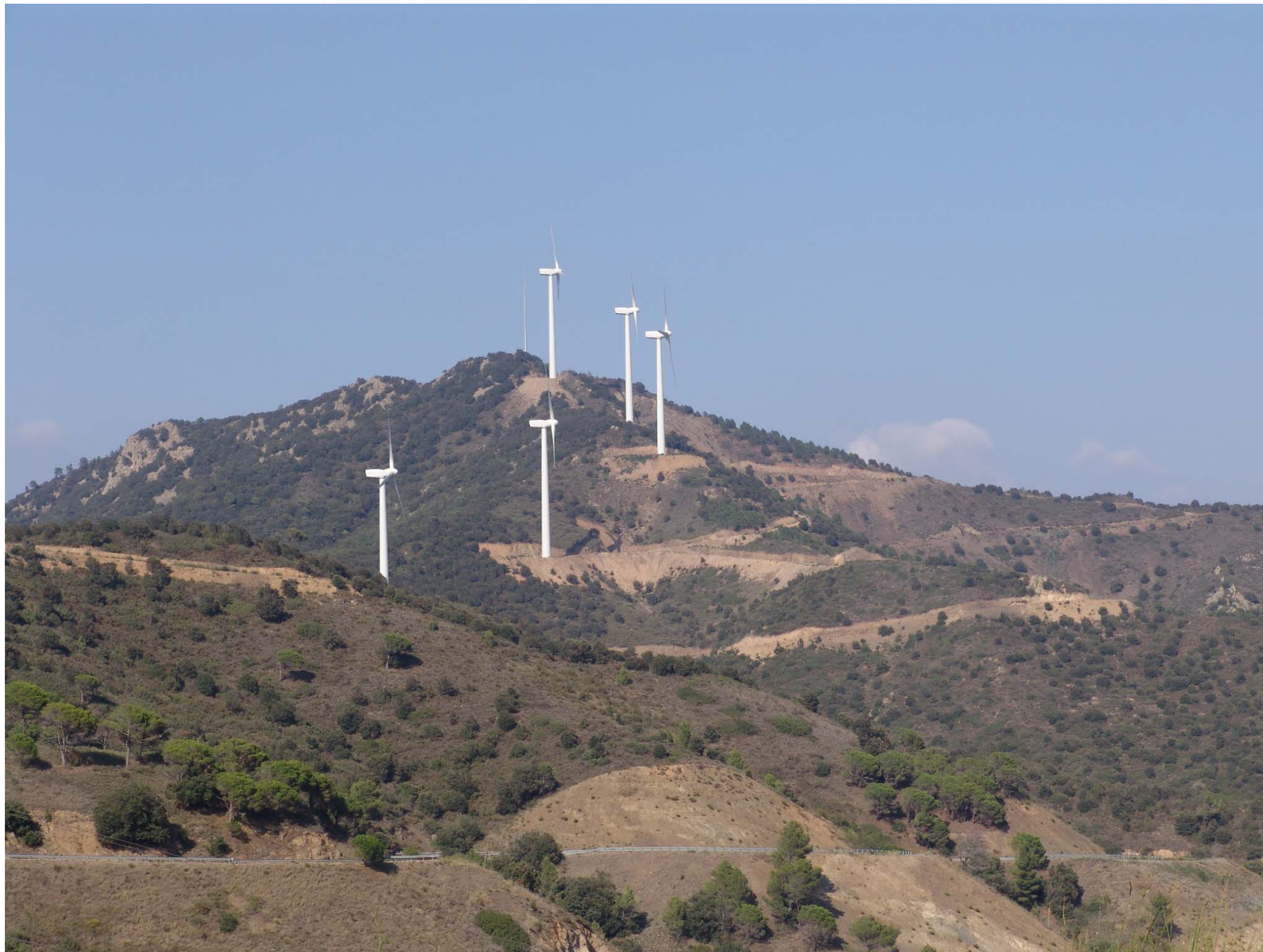
Figura 12.13: Parc eòlic del collet dels Feixos.