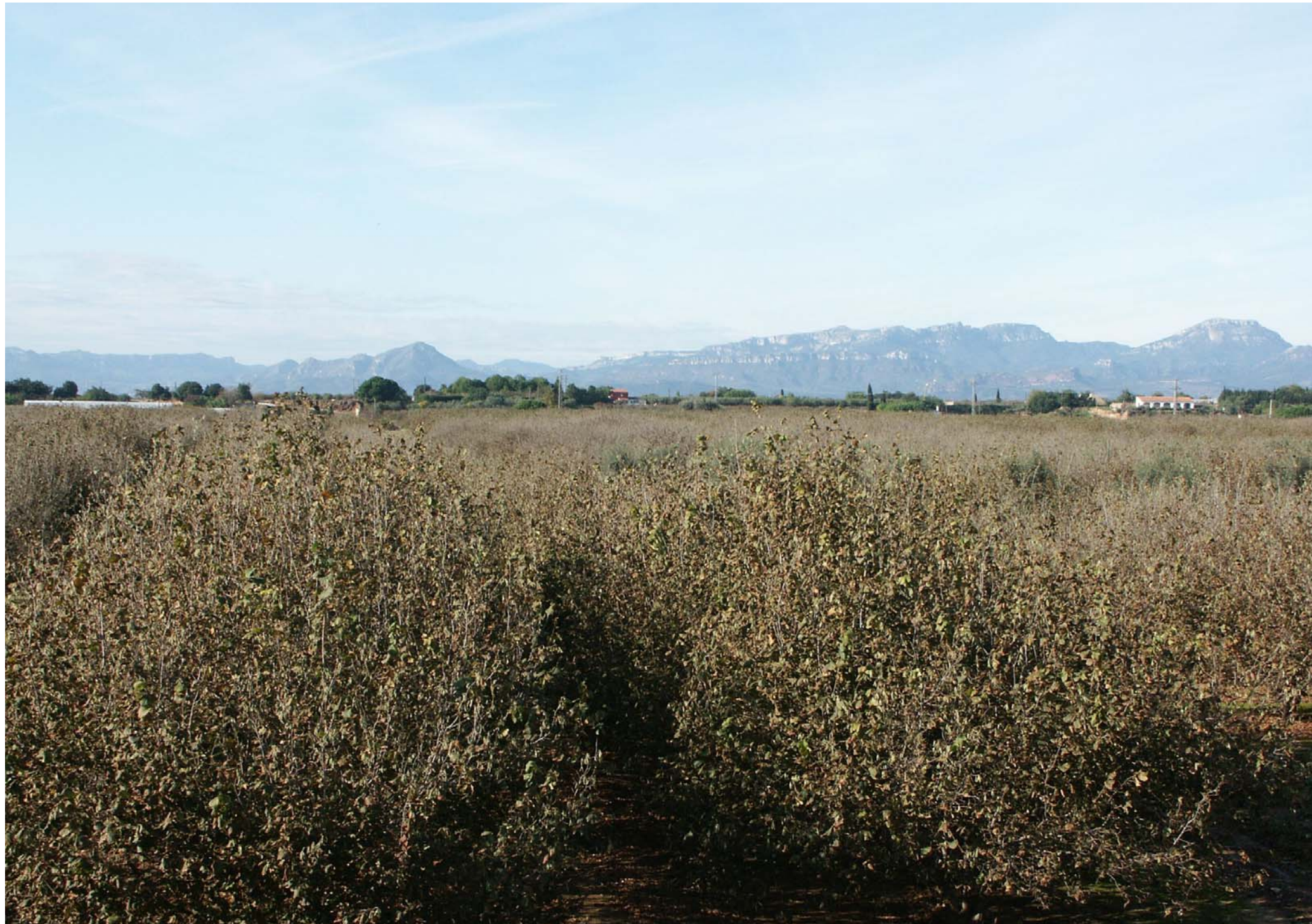
Figura 12.19: Camps d'avellaners a Riudoms.