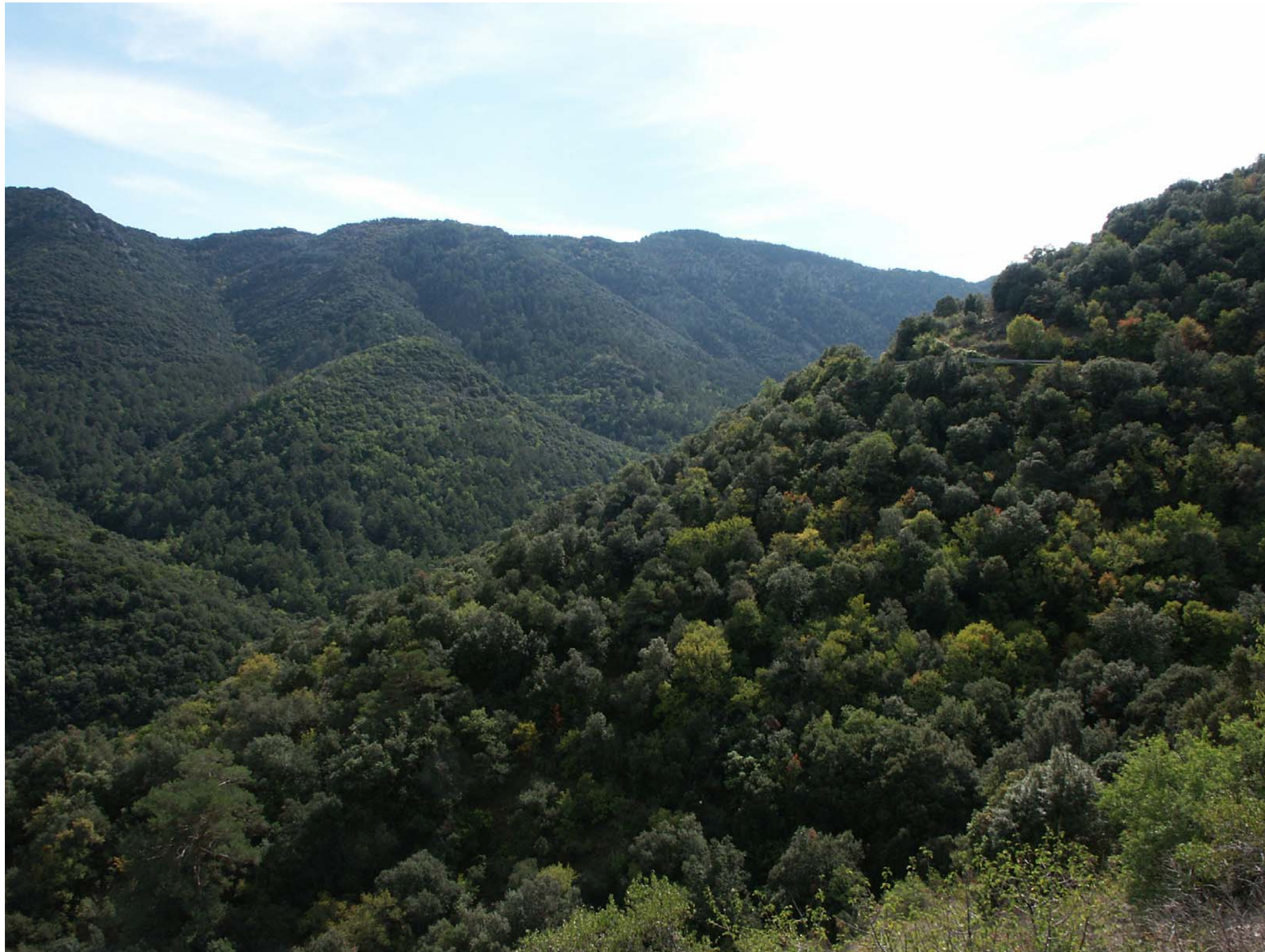
Figura 12.7: Muntanyes de Prades.