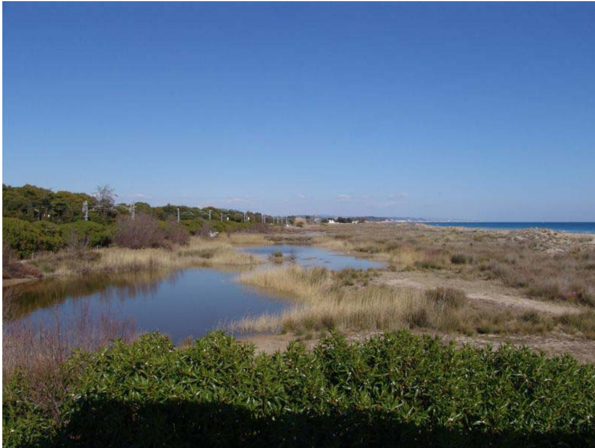
Figura 12.5: Dunes i maresmes dels Muntanyans a Torredembarra.