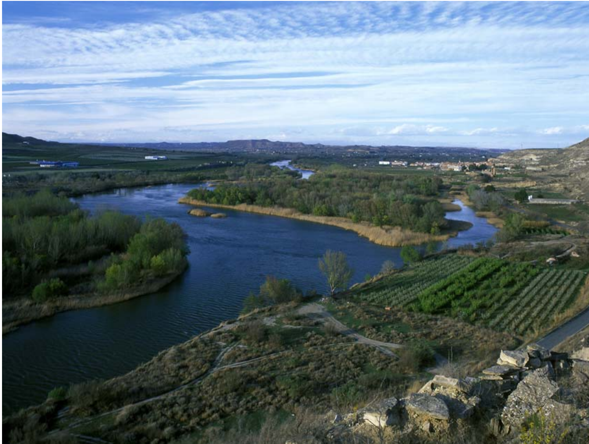
Fig. 12.19. Imatge panoràmica de l'Aiguabarreig Segre-Cinca a la Granja d'Escarp (Segrià), espai interfluvial d'una gran biodiversitat i en bon estat de conservació.