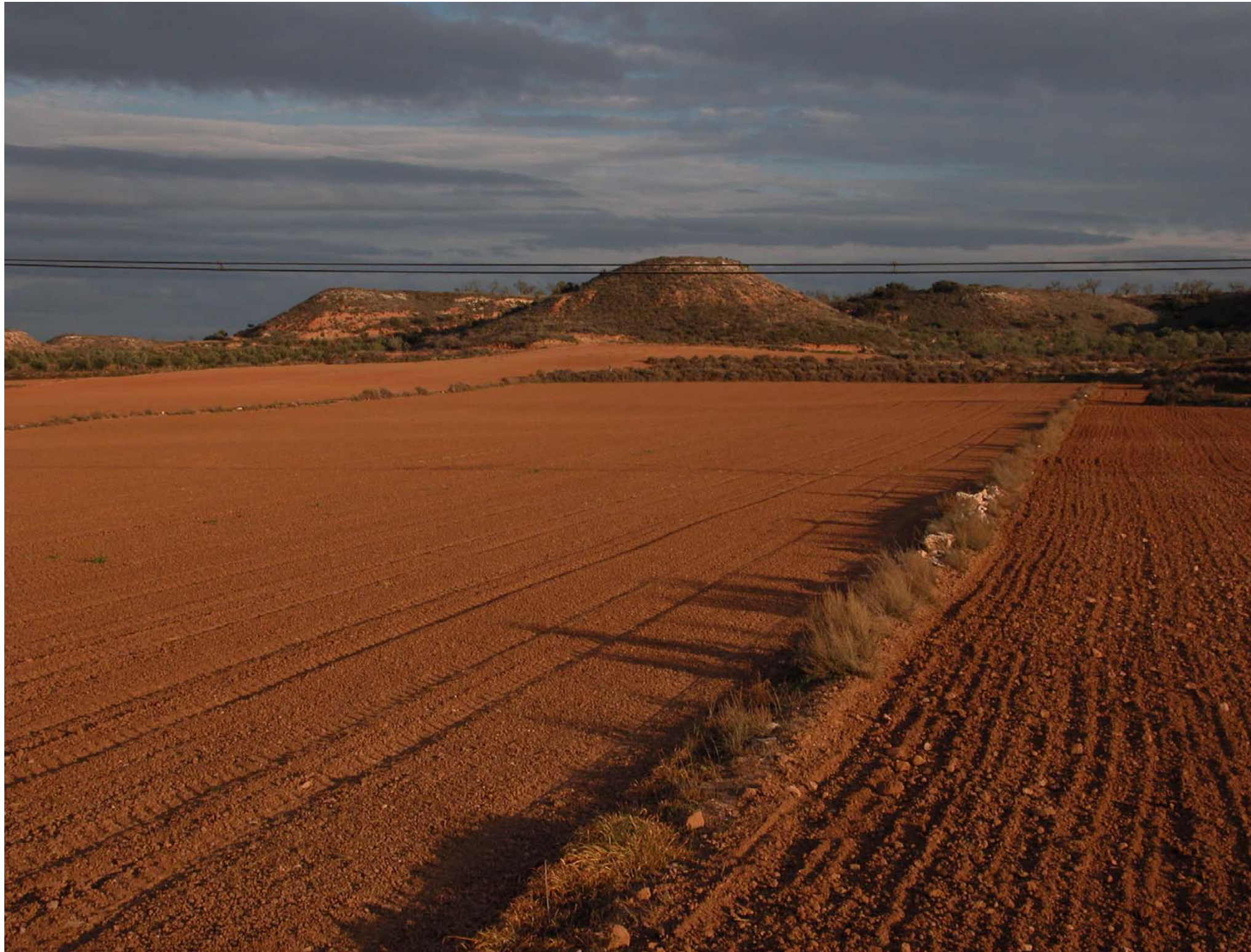
Fig 12.13. Tossals testimoni i conreus des de la carretera C-12 direcció Lleida, característics dels paisatges estèpics de Terres de Lleida.