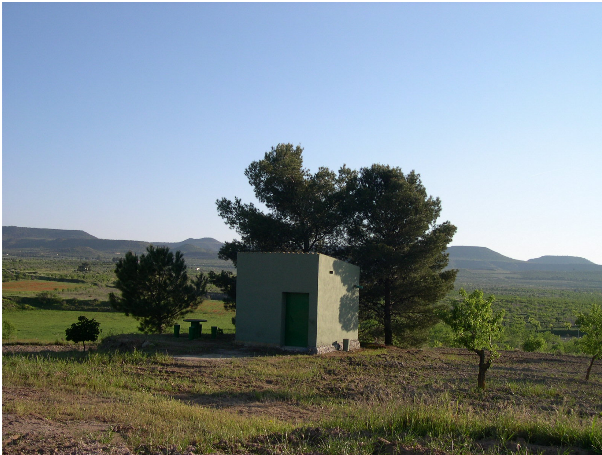
Fig. 12.5. Petit cobert d'eines a les Borges Blanques (Garrigues). El color dels paraments i els peus arbrats del seu voltant, d'acord a un patró tradicional, confereixen a la construcció una adequada integració al seu entorn.