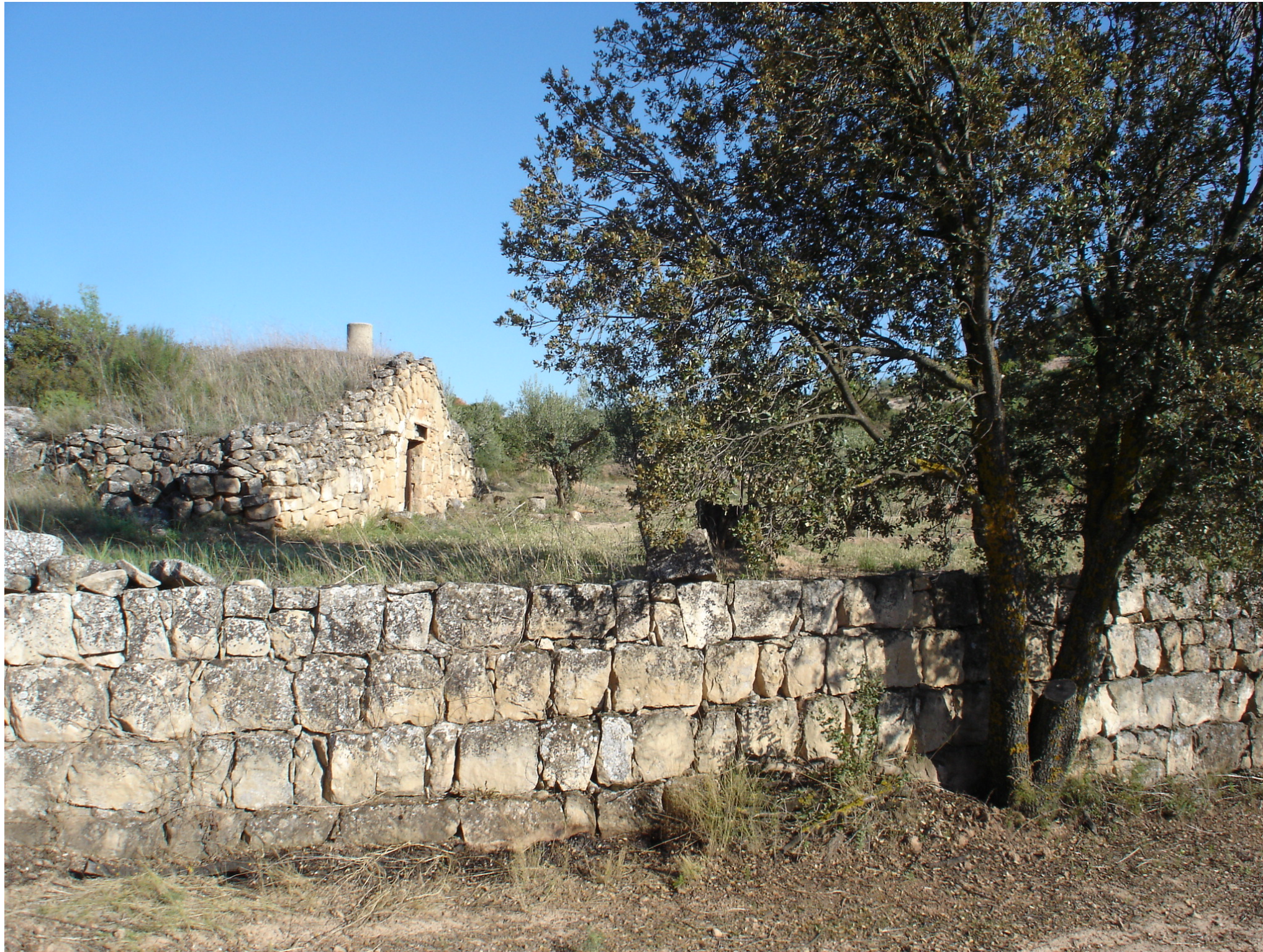
Fig. 12.17. Marge de pedra seca i cabana de volta entre oliveres, paisatge propi de la zona intermèdia entre l'extrem de la plana central de la Depressió catalana i la seva perifèria, més abrupta, que precedeix els contraforts prelitorals.