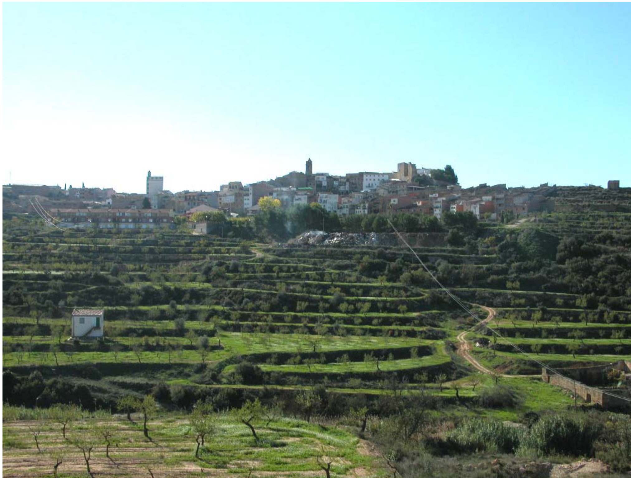
Fig. 12.12. La població d'Albagés, que forma part del patró de nuclis alineats seguint el curs del riu Set.