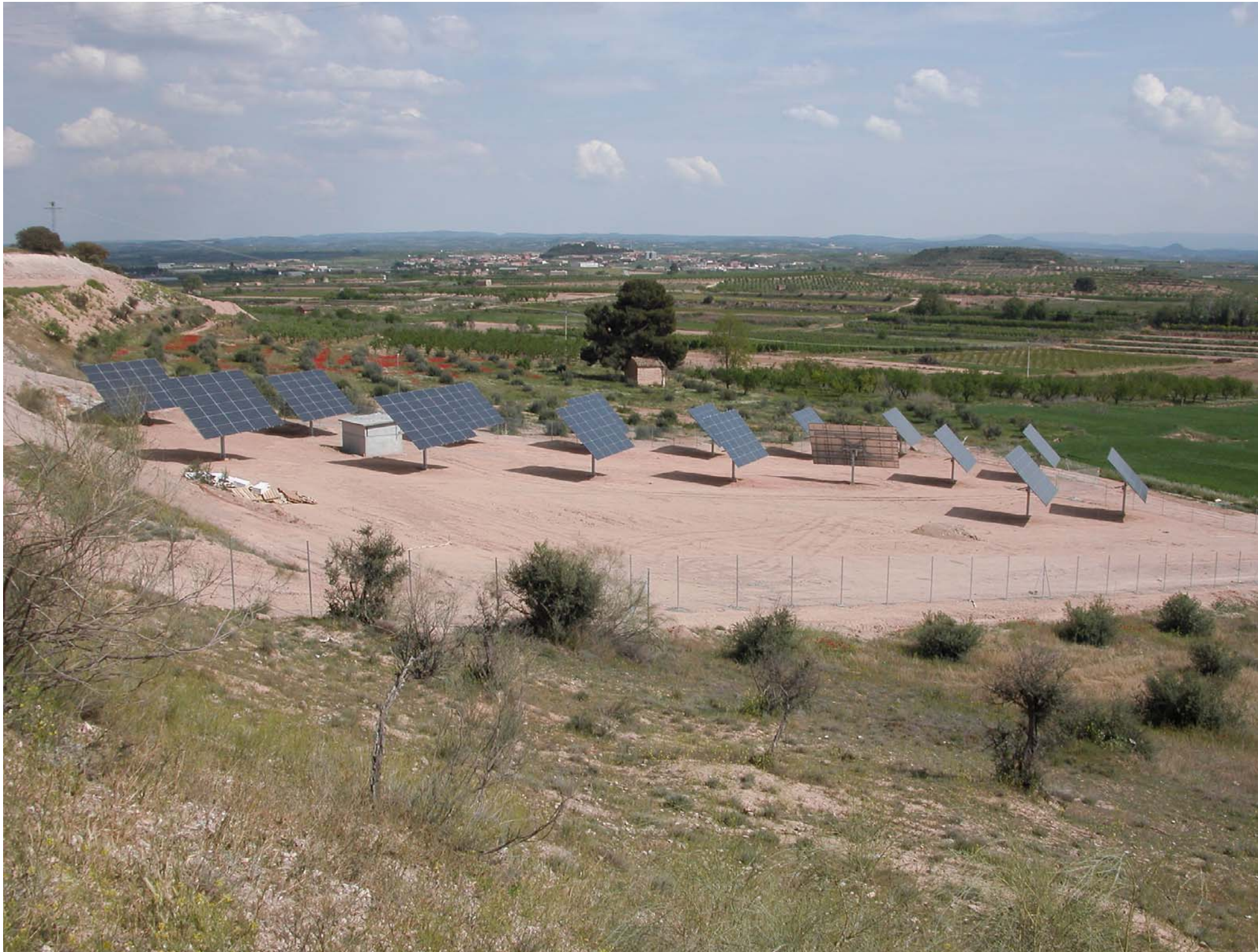
Fig.12.20. Parc solar al nord de Puiggròs, a la Plana d'Urgell.