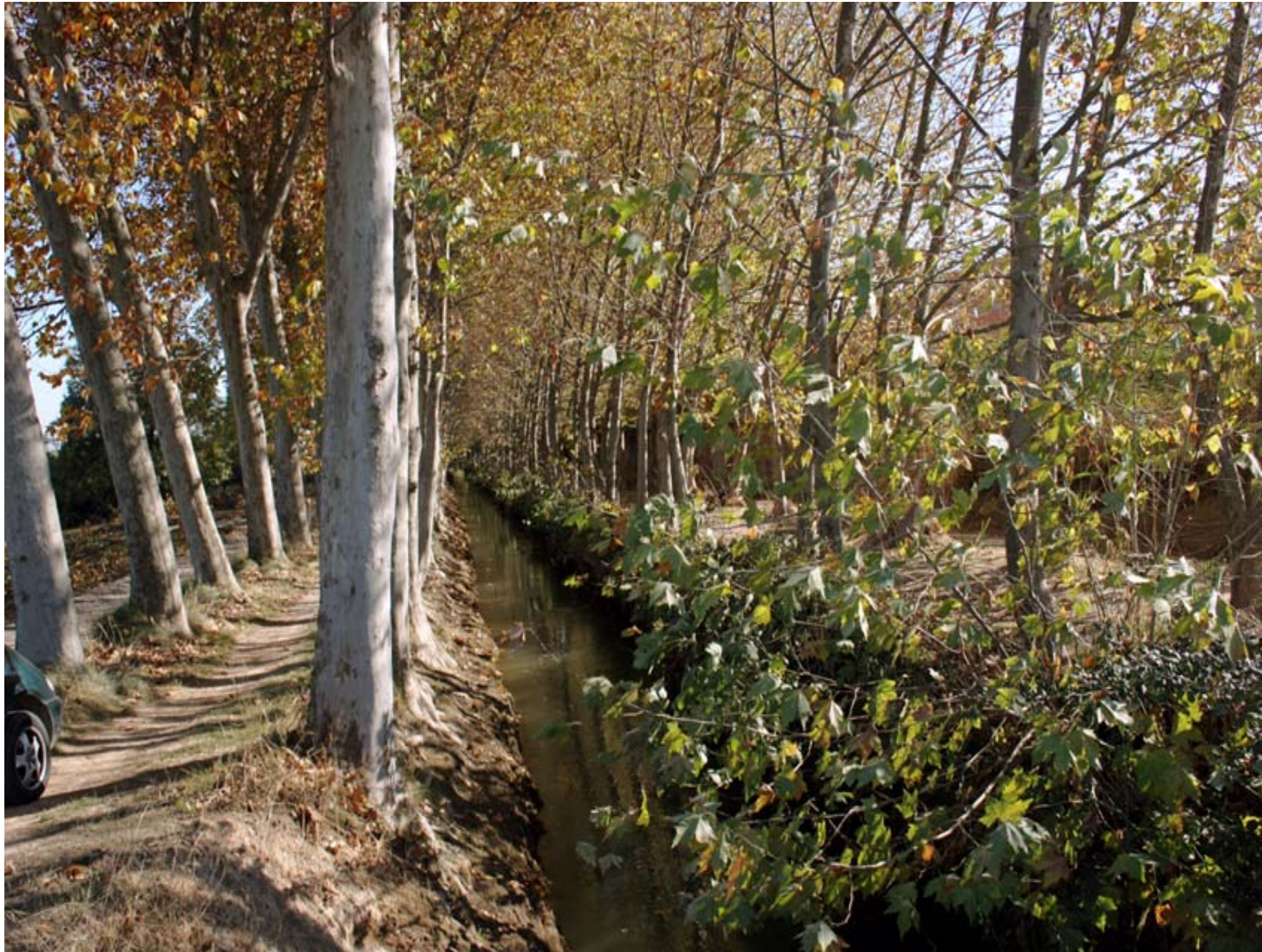
Fig. 12.18. Tram de banqueta arbrada del Canal d'Urgell a Juneda (Garrigues) amb plataners ( Platanus hispanica ) flanquejant les dues ribes del caixer i els respectius camins de Server.