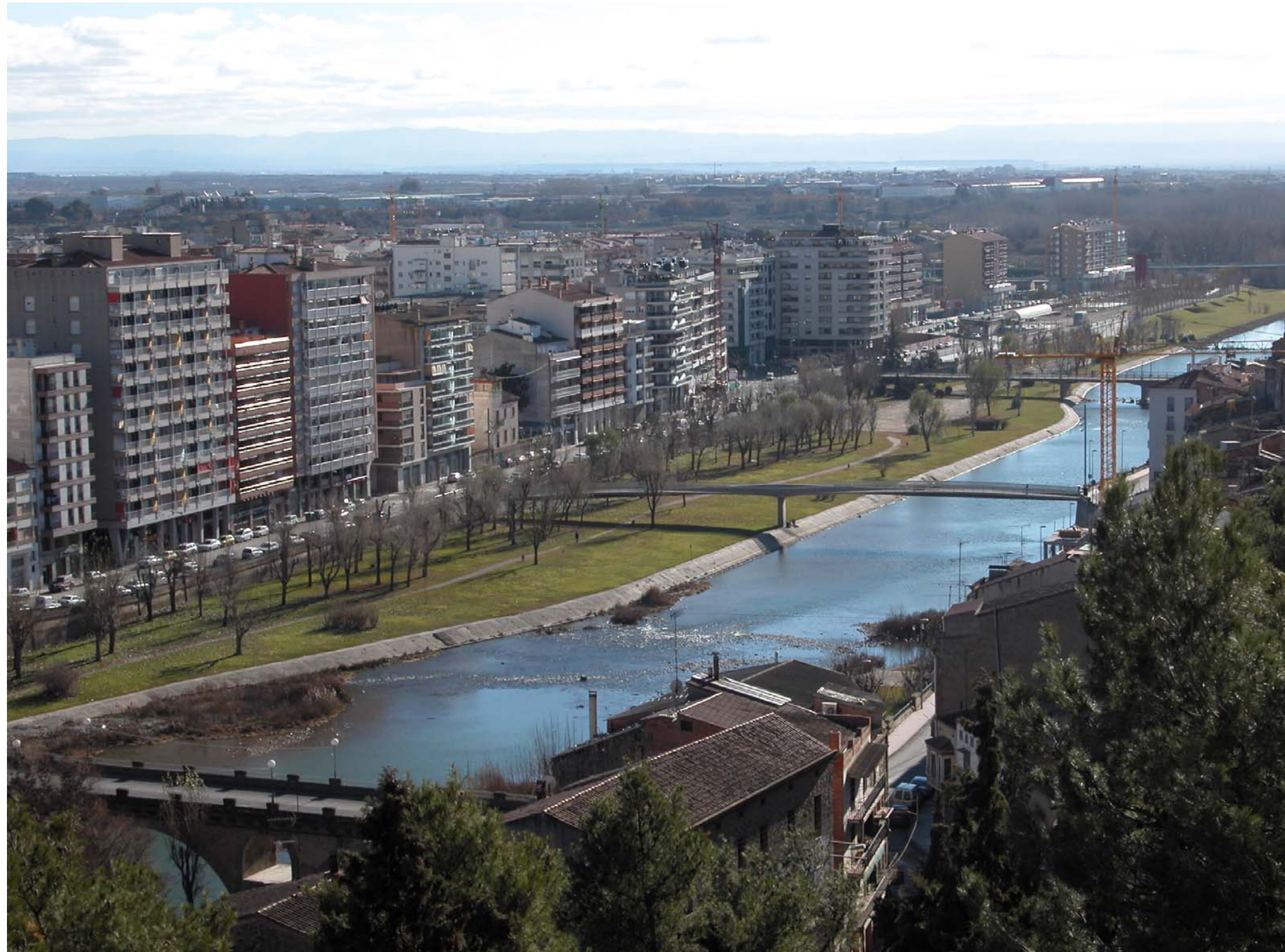
Fig. 12.3. Ciutat de Balaguer.