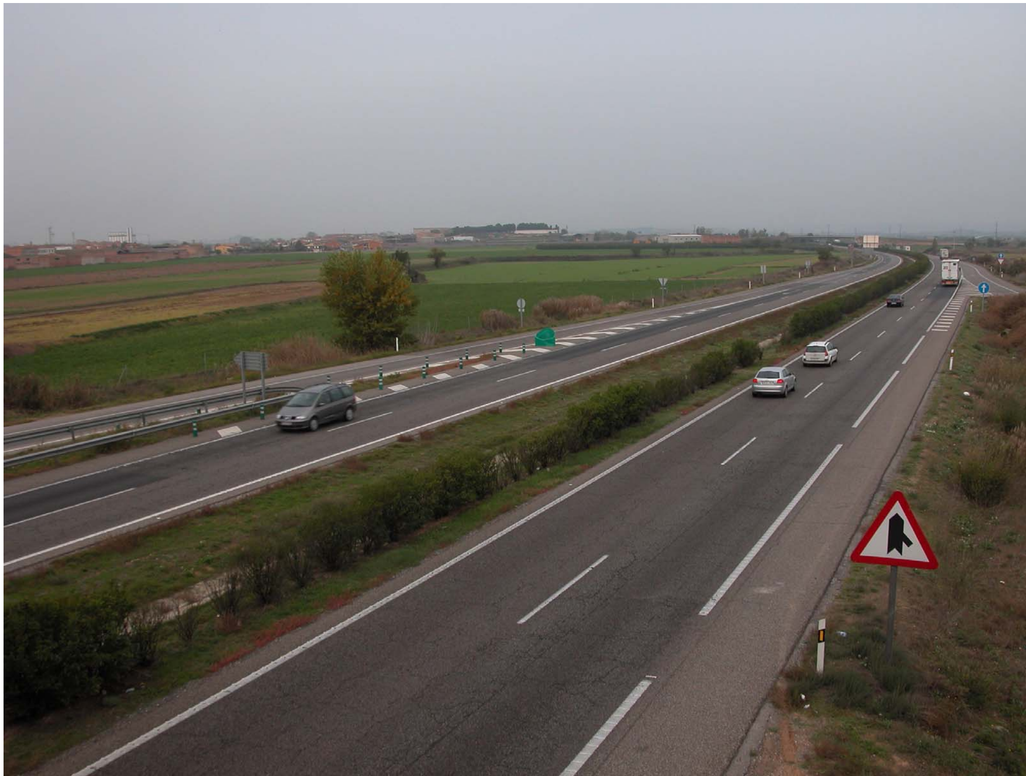
Fig.12.6. Autovia A-2 vista a l'est a la sortida de Bell-lloc.