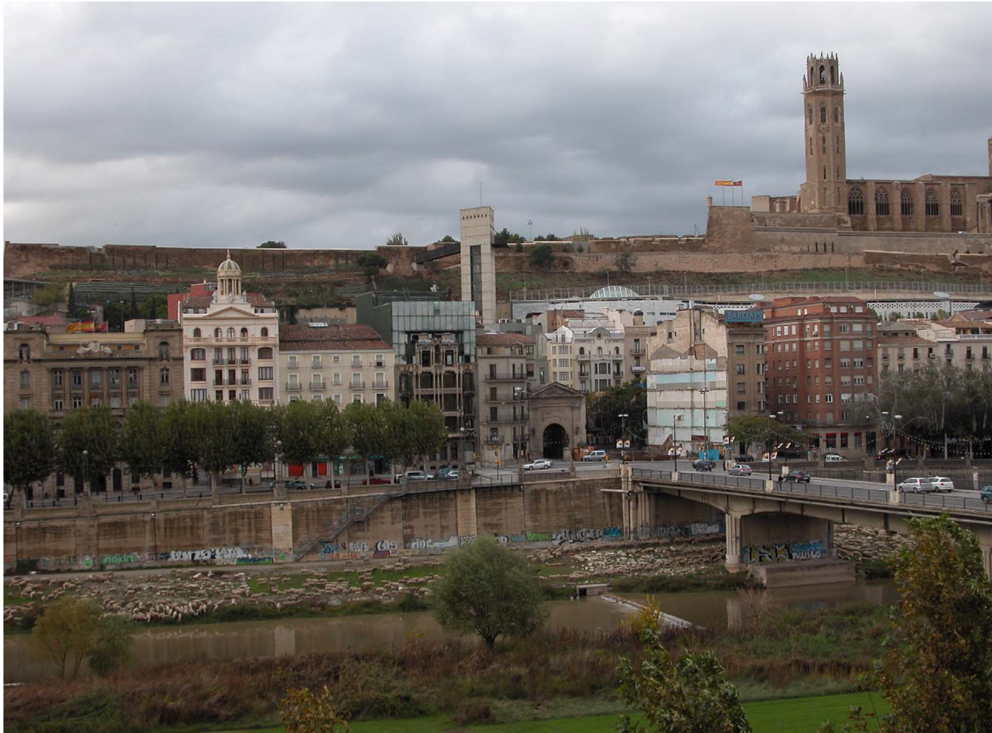
Fig. 12.2. La ciutat de Lleida, amb la Seu Vella i el riu Segre. Vista des del marge esquerre del riu.