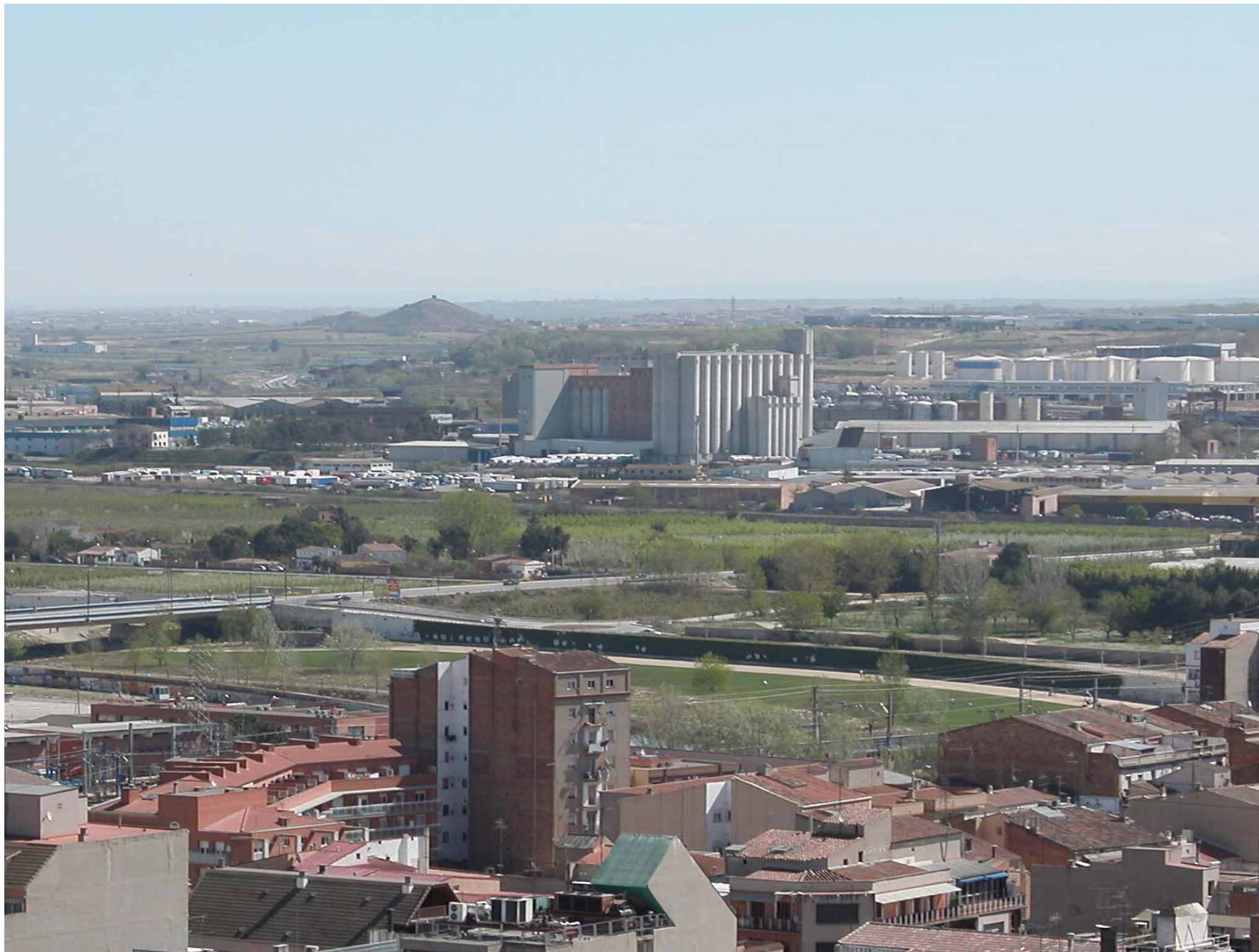
Fig. 12.9. Àrea industrial situada a la perifèria de la ciutat de Lleida.