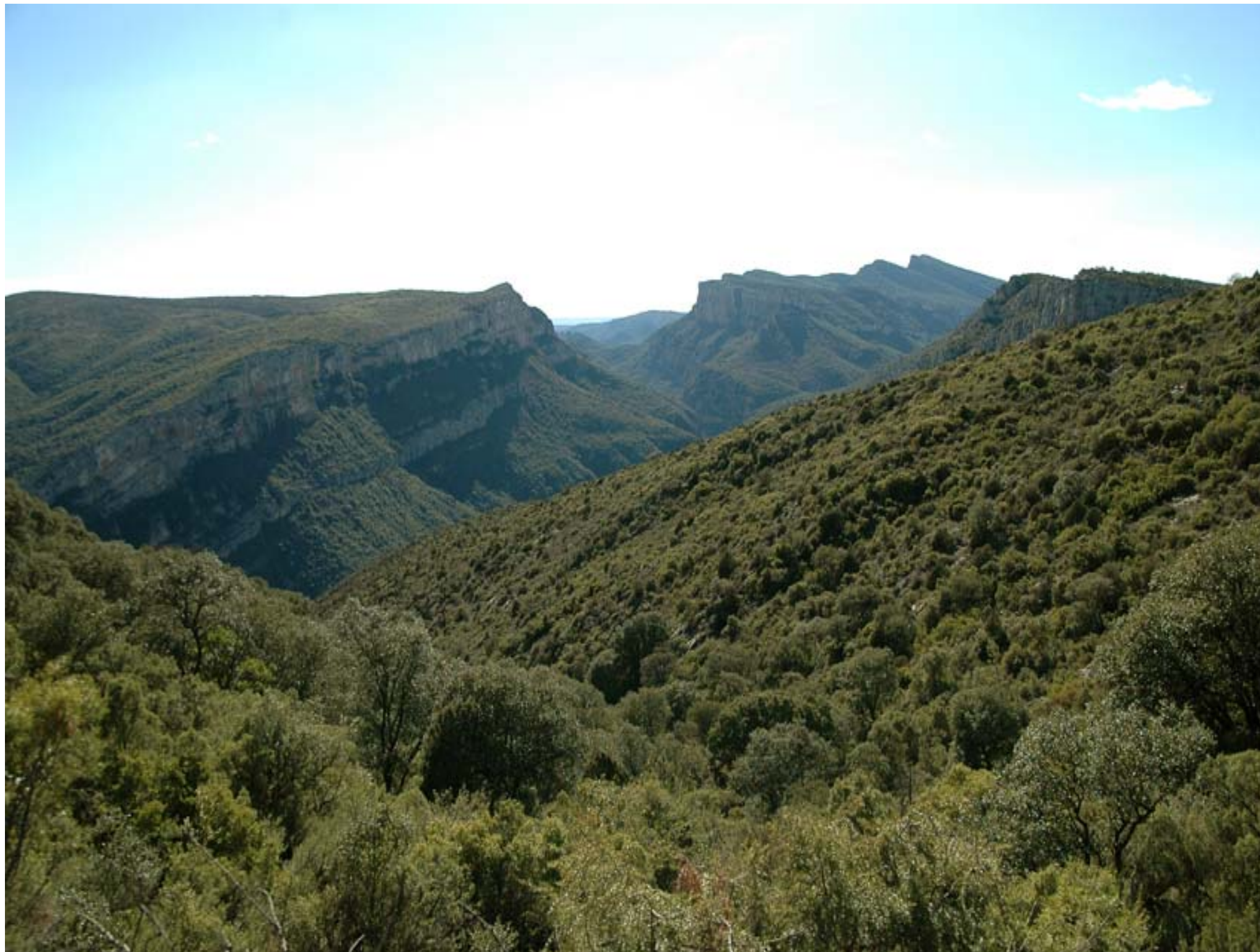
Fig. 12.4. La serra de Sant Jordi (Noguera), país del carrascar continental, contrafort del Montsec, que s'alça sobtat per damunt de la plana ponentina.