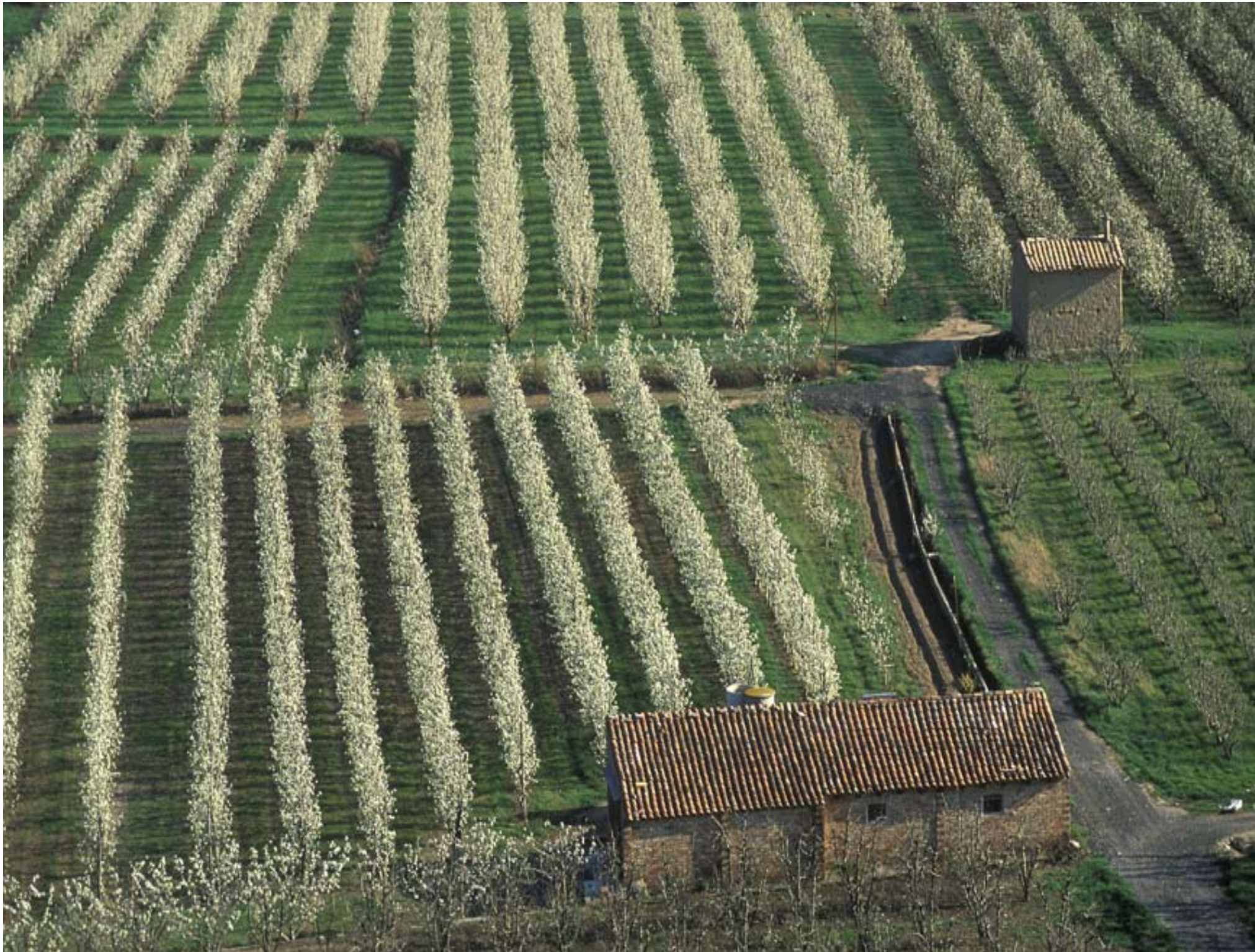
Fig. 12.22. Patró agrícola característic de l'Horta de Lleida caracteritzat per la linealitat i la geometria dels conreus, la presència de construccions agrícoles de servei al pagès i en particular, de la tàpia, tipologia constructiva autòctona desapareguda als anys 60.