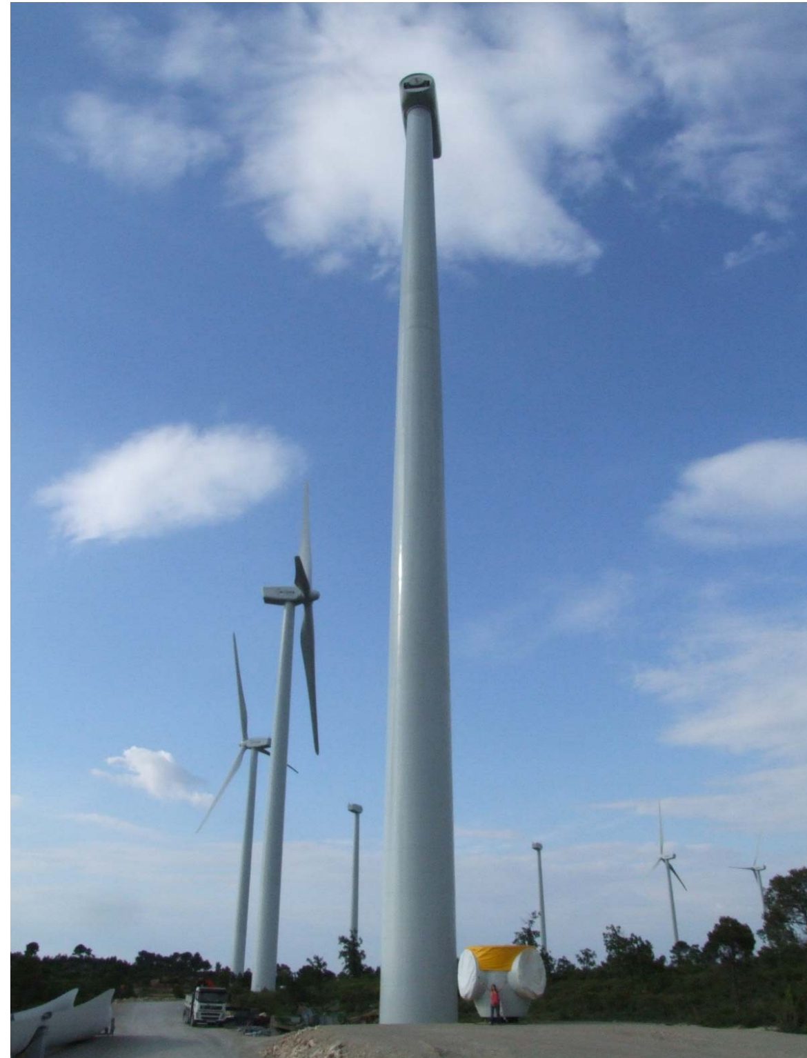
Fig. 12.10. Central eòlica de Vilobí, situada a la serra de Vilobí, al terme municipal de Fullella.