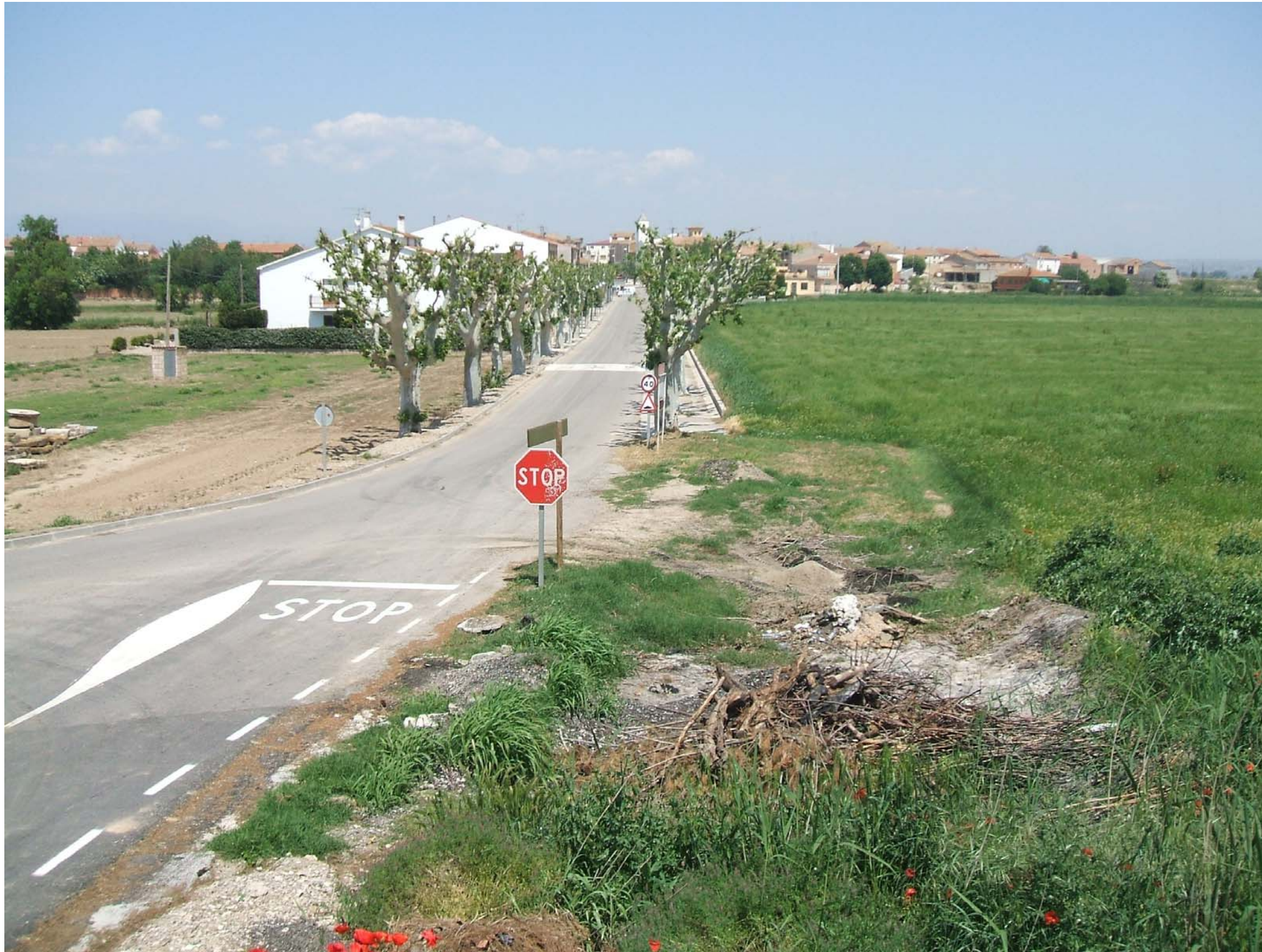
Fig. 12.7. Accés al nucli de Vallverd d'Urgell (Pla d'Urgell), amb una plantació de plataners flanquejant les dues vores de la carretera d'accés precedint i relligant l'entrada des del sòl no urbanitzable al sòl urbà.