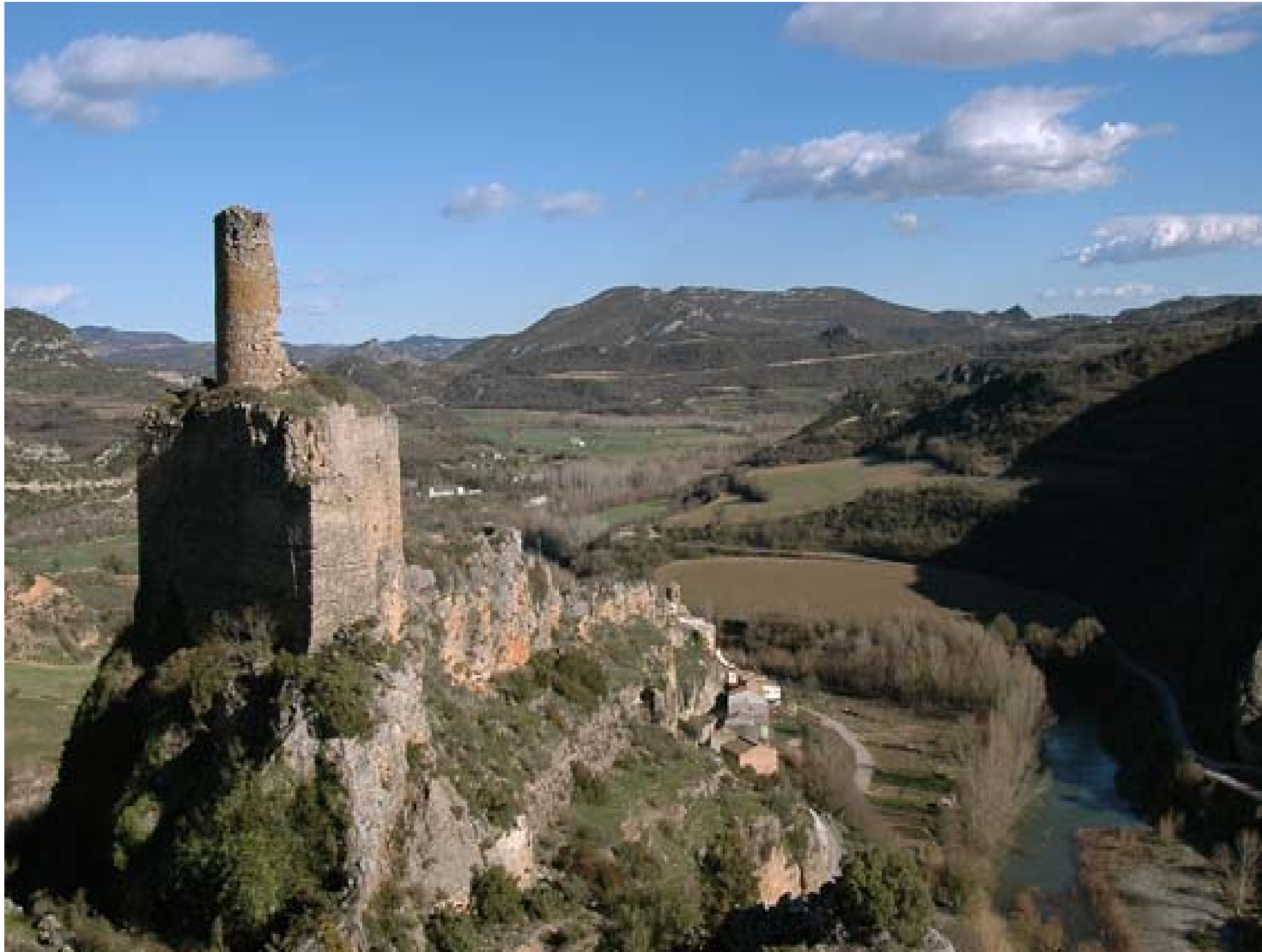
Fig. 12.21. Castell d'Alòs de Balaguer (Noguera), un espectacular exemple del paisatge de les fortificacions i construccions defensives que abunden a tota la perifèria de la Plana de Lleida i en els espais anomenats intermedis.