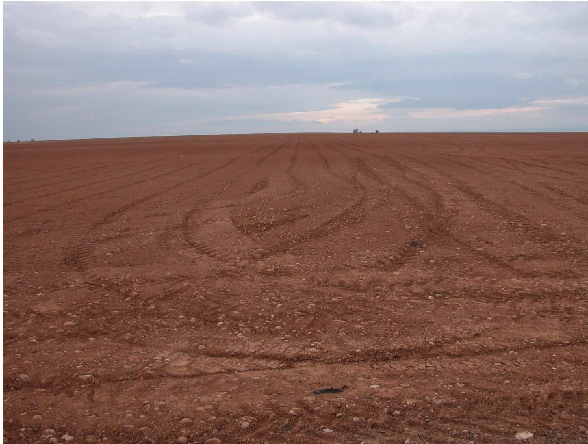
Fig. 12.8. Ondulacions suaus amb cereal de secà a les proximitats d'Almenar (Segrià) que avui caracteritzen el relleu de la Plana d'Almenar i Alguaire on s'ha d'ubicar el futur aeroport d'Alguaire- Lleida.