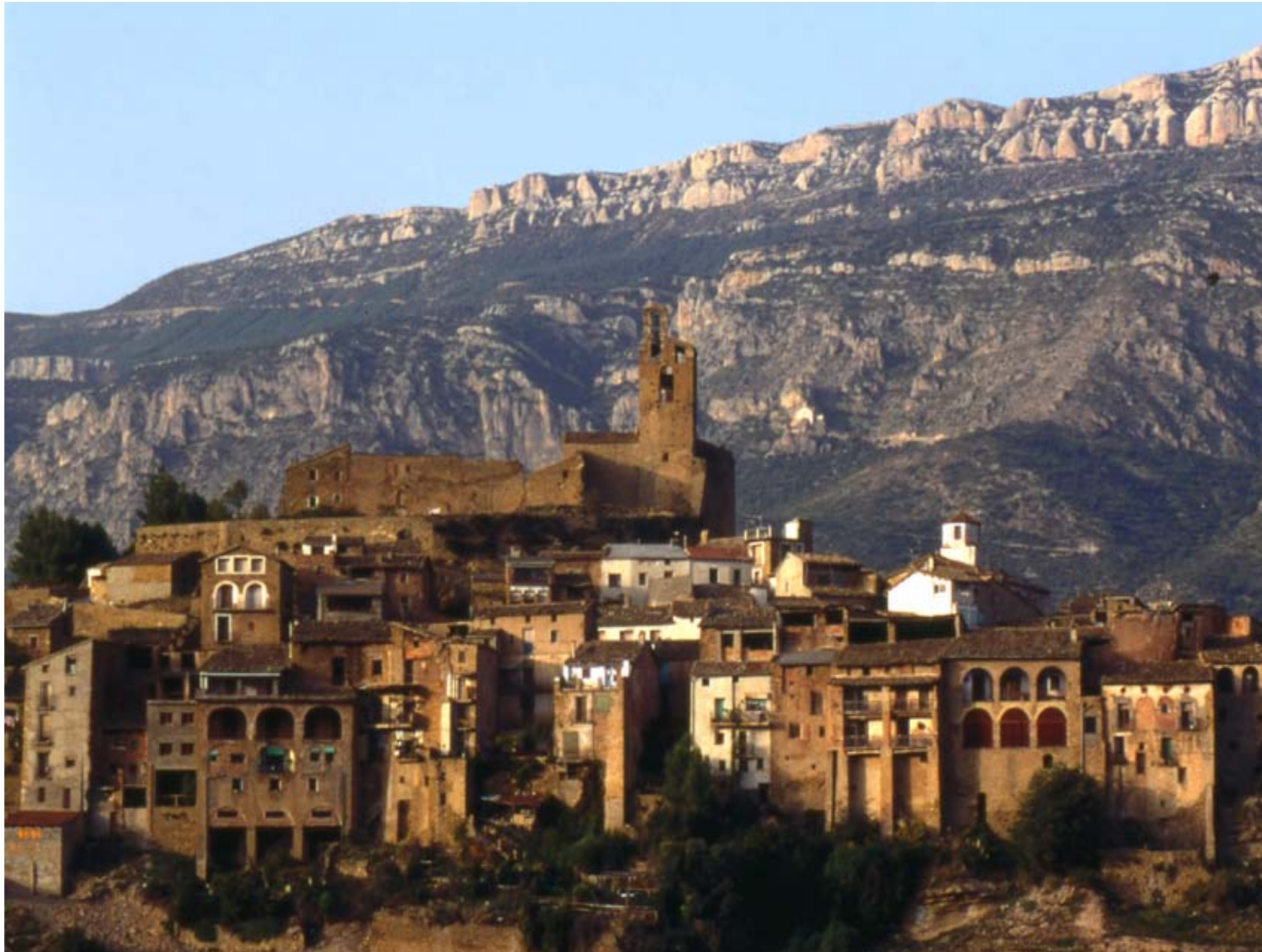
Fig. 12.11. La vila d'Àger (Noguera), amb el fons escènic del Montsec d'Ares, assentada sobre un turó antigament fortificat, segons un patró comú a tota l'àrea de ponent.