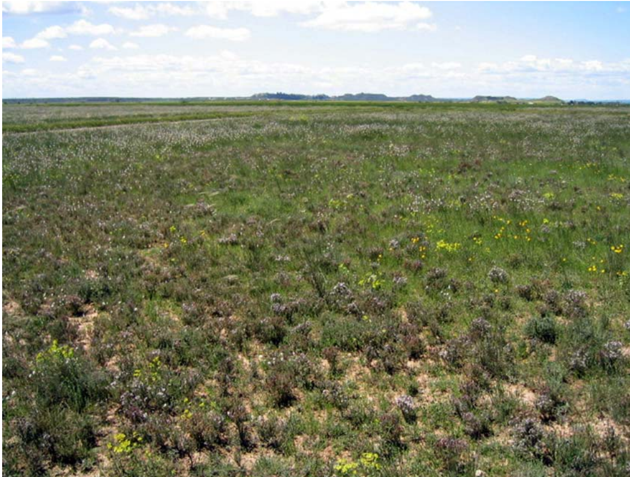
Fig. 12.16. La timoneda d'Alfés (Segrià), un dels hàbitats estèpics més singulars de Terres de Lleida tradicionalment lligat a la pastura i actualment en procés de regressió.