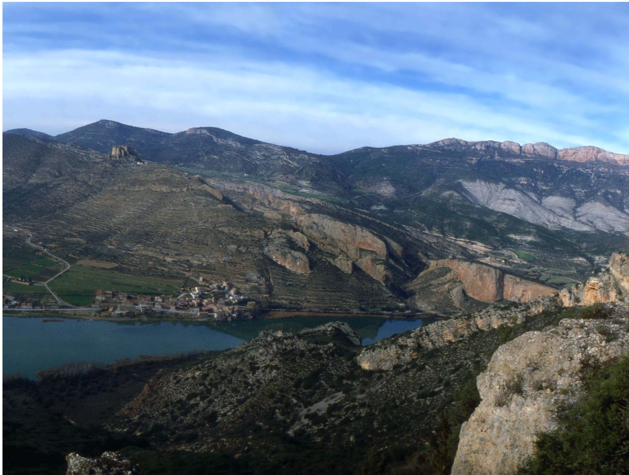
Fig. 12.14. La superposició visual de les serres de Mont-Roig, Carbonera, Òs, Montclar, Millà, Sant Mamet i el Montsec conformen el fons escènic més percebut i visible des de tota la plana de Lleida.