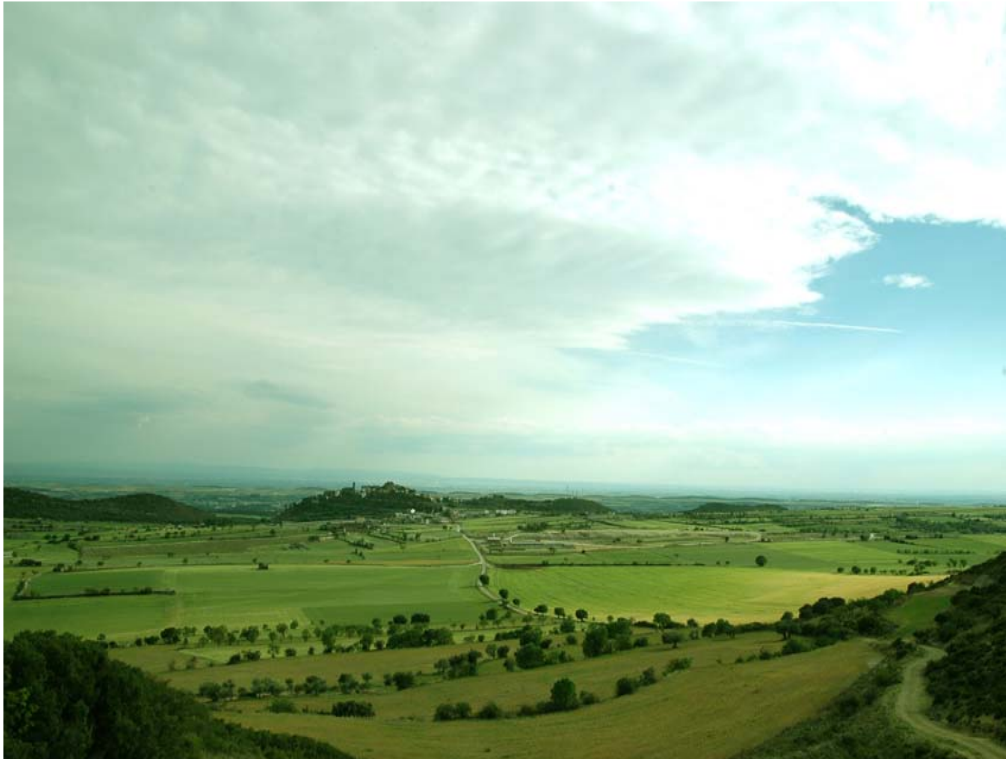
Fig. 12.15. Des de la Serra de Bellmunt (Urgell) observem magnífiques panoràmiques de la part més septentrional de l'Urgell, amb els nuclis aturonats que confegien la "terra de marca" cristiana en temps de la Reconquista (foto: G.Cano).