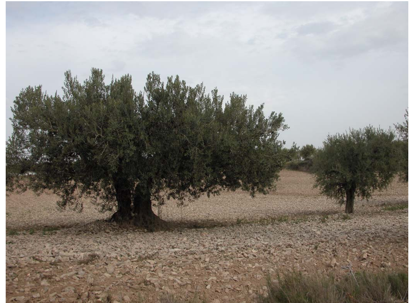
Fig. 11.6. Coster meridional del Fondo de les Avalls. Olivets, amb oliveres centenàries.

A les zones més planeres, on preferentment s'introduiran cultius extensius de regadiu amb rec per aspersió o fruiters amb rec localitzat (previsiblement), es produirà una transformació del paisatge a causa del canvi d'ús. A les zones més abruptes, on s'instaurarà el rec de suport, el canvi en el paisatge es preveu menys important que en altres zones, ja que hi ha perspectives de manteniment i potenciació del bosc, els camps d'ametllers i les oliveres actuals. En aquestes zones, es recomana el manteniment de les estructures parcel·làries i la conservació dels aterraments i les parets de pedra, tant per la identitat del paisatge com per a la conservació del recurs sòl.