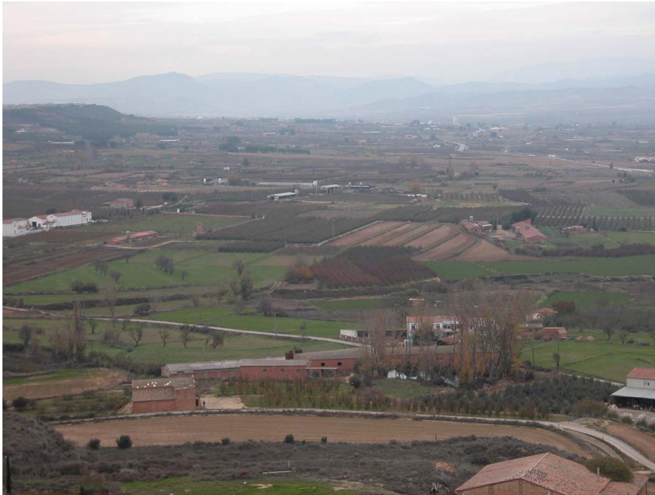
Fig. 11. 4. Horta de la Noguera Ribagorçana o de Pinyana al nord del Segrià. Vista des del Sagrat Cor d'Alguaire.

L'evolució d'aquest paisatge ha estat marcada per la progressiva transformació del territori. Aquesta, que fou una terra originàriament subdesèrtica, esdevingué amb els regatges una zona productiva. Alhora les torres i petits nuclis també han evolucionat i variat l'ús inicial. A la fi del segle XIX la població que vivia a l'horta era ben escassa; poc a poc i d'una manera gradual, el pagès va anar tenint un establiment permanent en la torre que va provocar el seu engrandiment. A partir dels anys 80 molta gent pagesa abandonà la torre com a habitatge i es desplaçà a la ciutat o al nucli rural pròxim. En