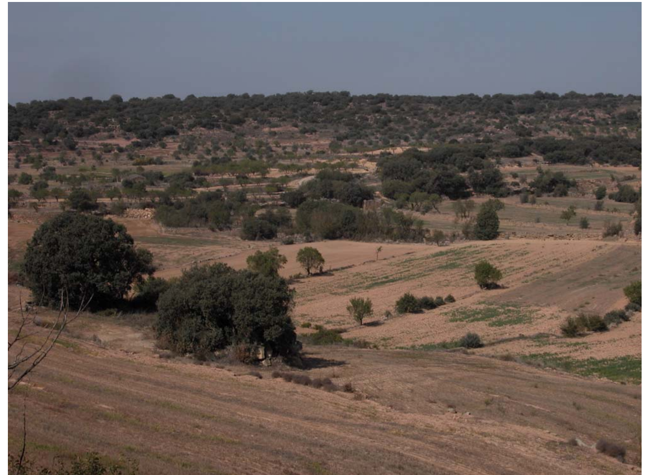
Fig. 11.7. Vista des de Ca l'Escuder al nord-oest, no lluny de Florejacs.