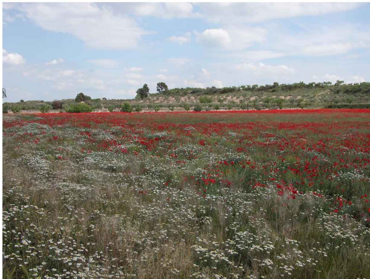
Fig. 11.3. Guarets amb esclat de roselles, entre Belianes i Arbeca.