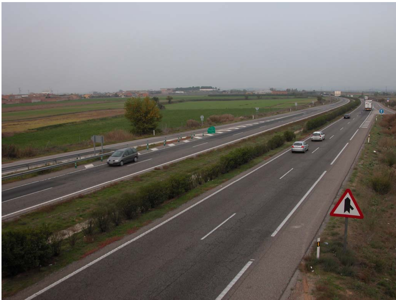
Fig. 11.2. Sortida Bell-lloc A-2 vista a l'est.

Per l'àmbit de Terres de Lleida hi creuen dues vies de comunicació molt importants: l'autovia A2 i el ferrocarril Lleida-Barcelona. Ambdues, conjuntament, configuren un important eix de mobilitat del territori.