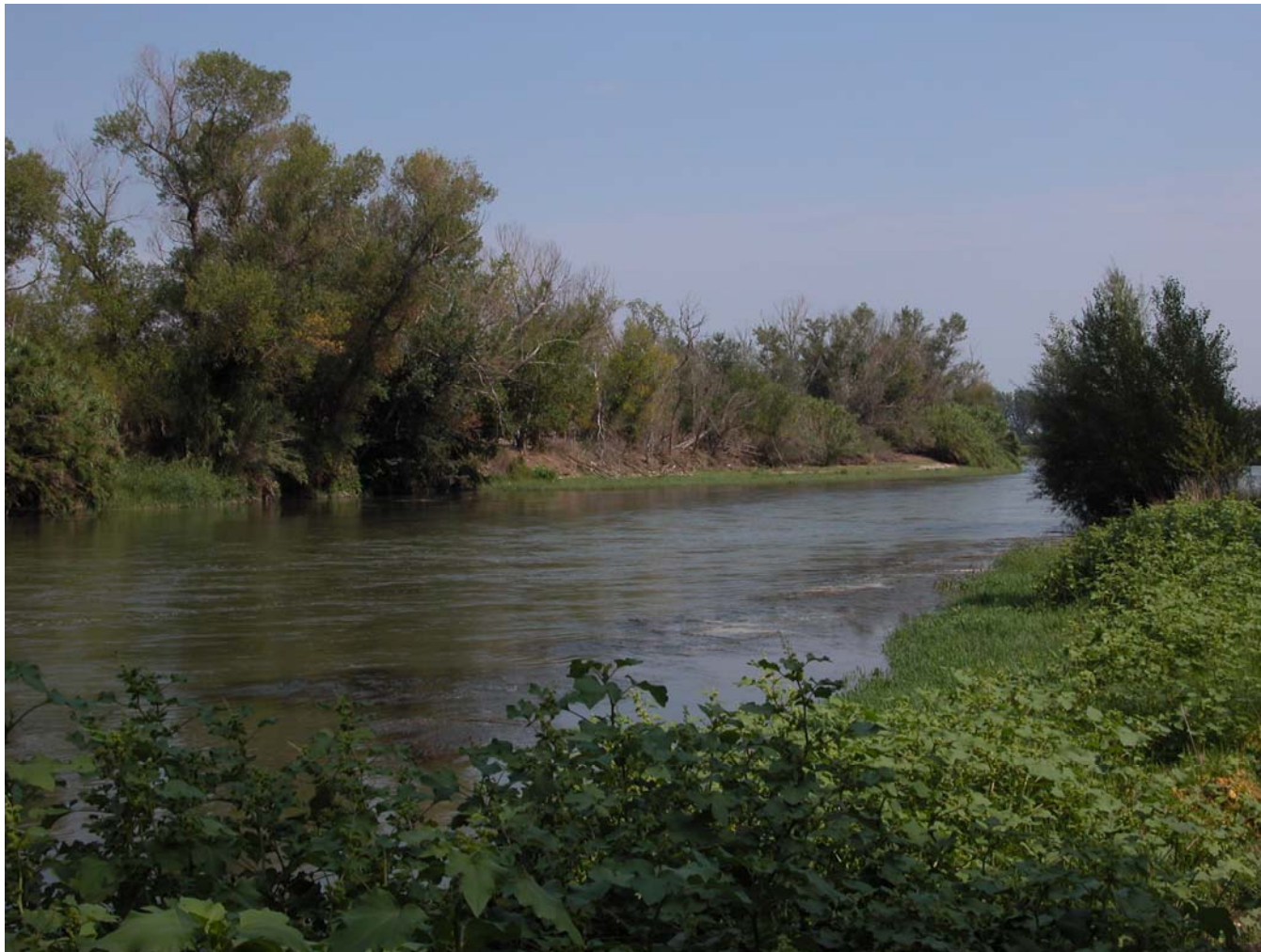
Fig. 11.9. Riu Segre, marge dret, vegetació higronitròfila i de ribera. Vista des del marge esquerre.