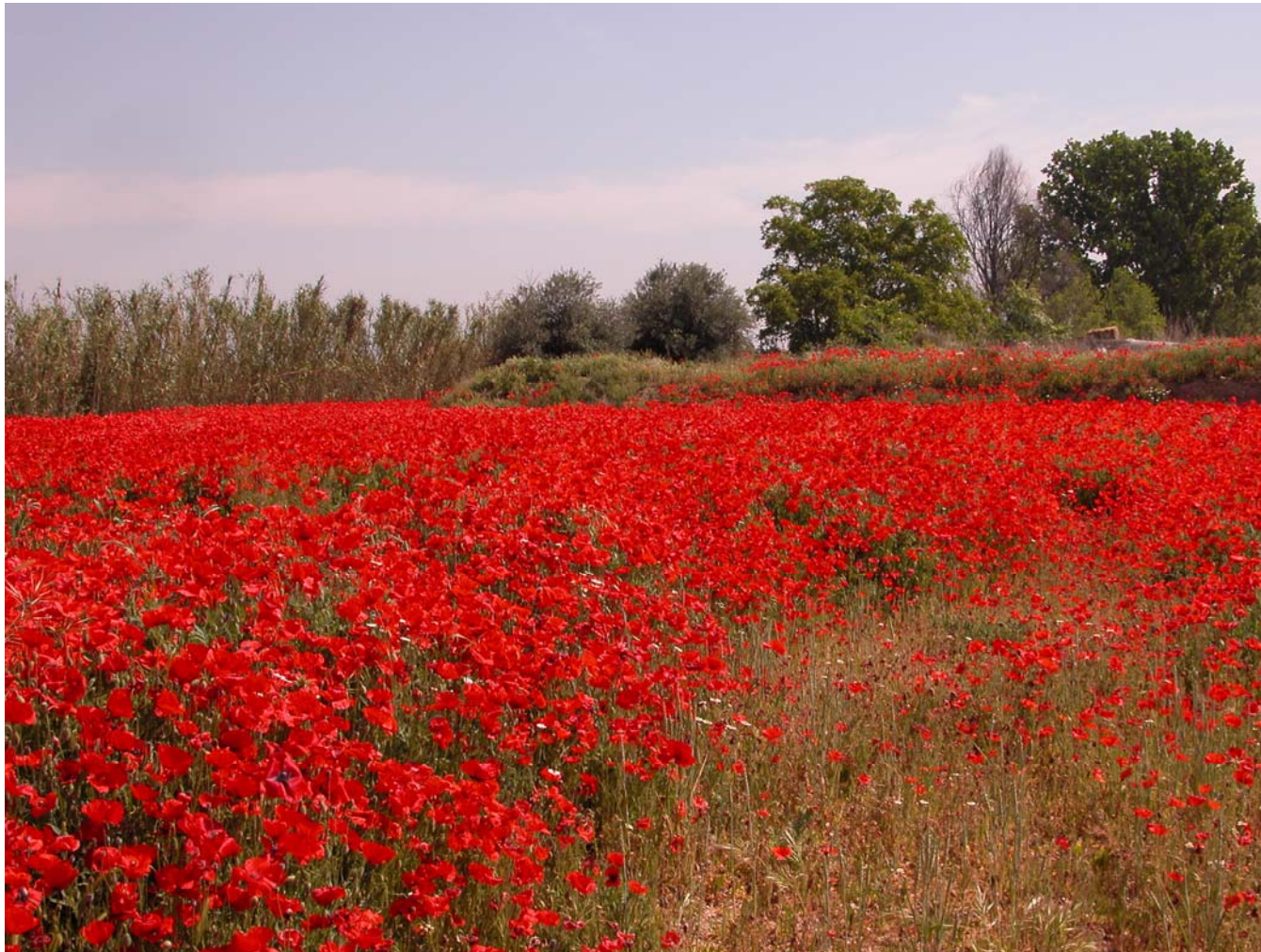
Fig. 11.8. Guarets que sostenen un esclat de roselles. A mig camí entre Linyola i Vallverd.