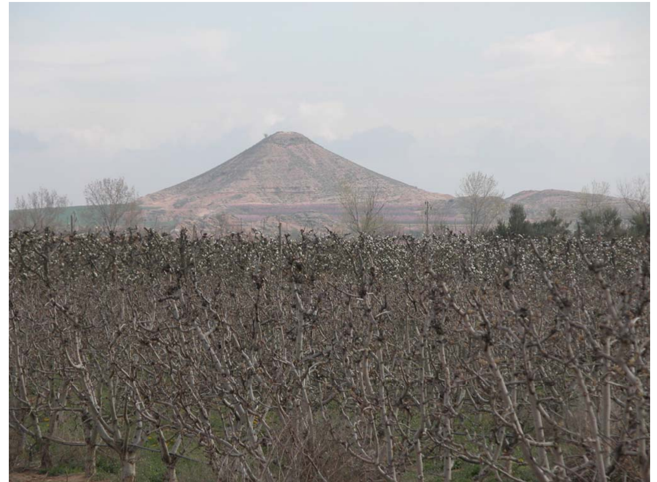
Fig. 11.5. Conreus de fruiters i Montfred al fons.