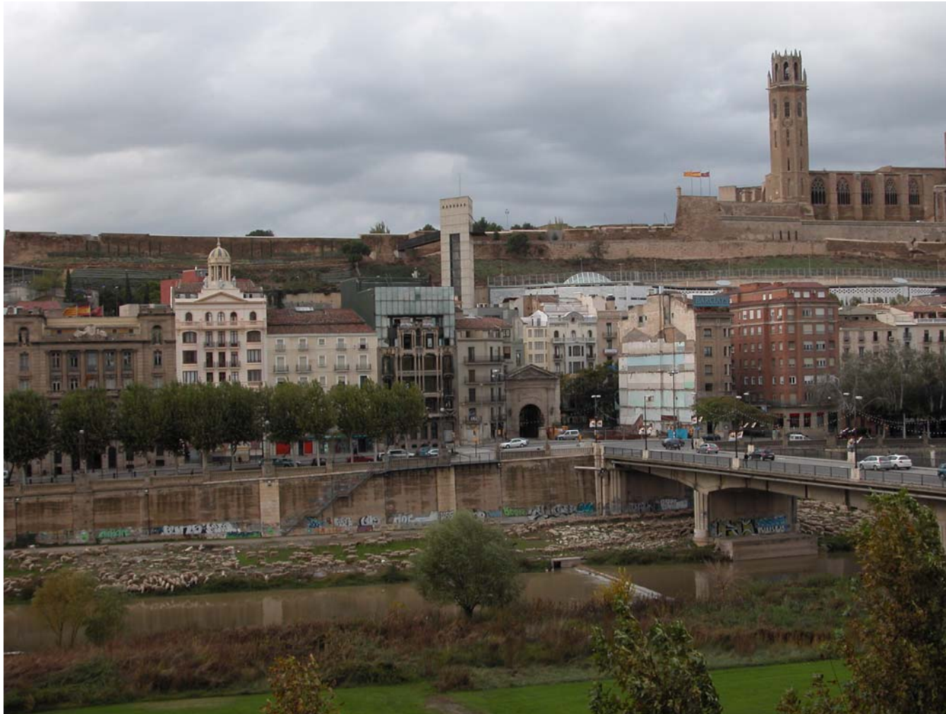
Fig. 11.10. Seu Vella i riu Segre amb ramat de corders abeurant al riu. Vista des del marge esquerre del riu.

continuen passant desapercebuts pels habitants del territori. D'altra banda, l'ampliació i extensió de la xarxa viària en els darrers anys, en gran part determinada pel traçat d'antics camins, i per la forma i les dimensions del parcel·lari ha motivat que la unitat es presenti actualment seccionada i individualitzada en diversos segments, essent una unitat territorial especialment complexa.