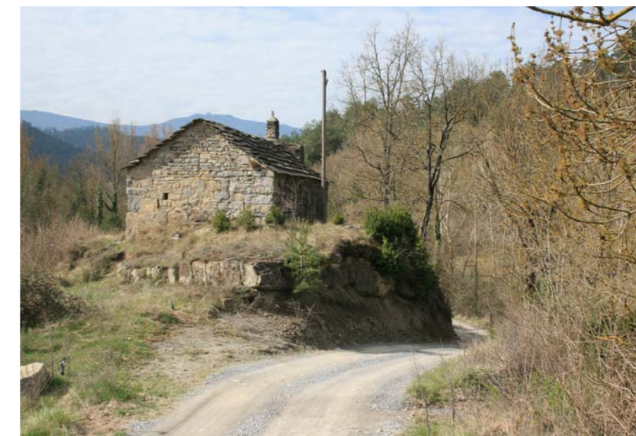
Figura 2.10 Sant Joan del Noguier, edifici de tradició romànica documentat el 1245, Sora.

el de Duocastella o Rocafiguera. El 890 s'esmentà el poble de Sant Quirze de Besora ( Sancti Quirici di Bizaura ), el 898 Santa Maria de Besora, el 906 la vall i església de Sant Pere de Sora i el 1020 el castell de Sarreganyada, que donà pas a l'ermita de Bellmunt (1587).