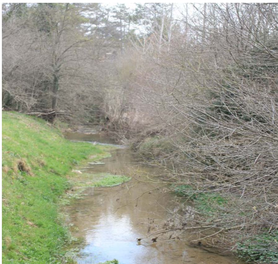
Figura 2.6 Riera de Sora i bosc de ribera.

El sector que resta a la Catalunya Central s'inicia al Puig de Sant Jaume (1291 m) per cercar el vessant meridional de la serra de Bellmunt (1248 m), dirigir-se vers ponent, travessar el Ter prop del Bofí, continuar per la vall de la riera de Cussons fins Corbatera, des d'on s'enfila al serrat de Guinard (891 m) i al serrat dels Tudons (902m) per capgirar cap l'Alzina Grossa (933 m) i trobar-se de nou amb les Comarques Gironines.