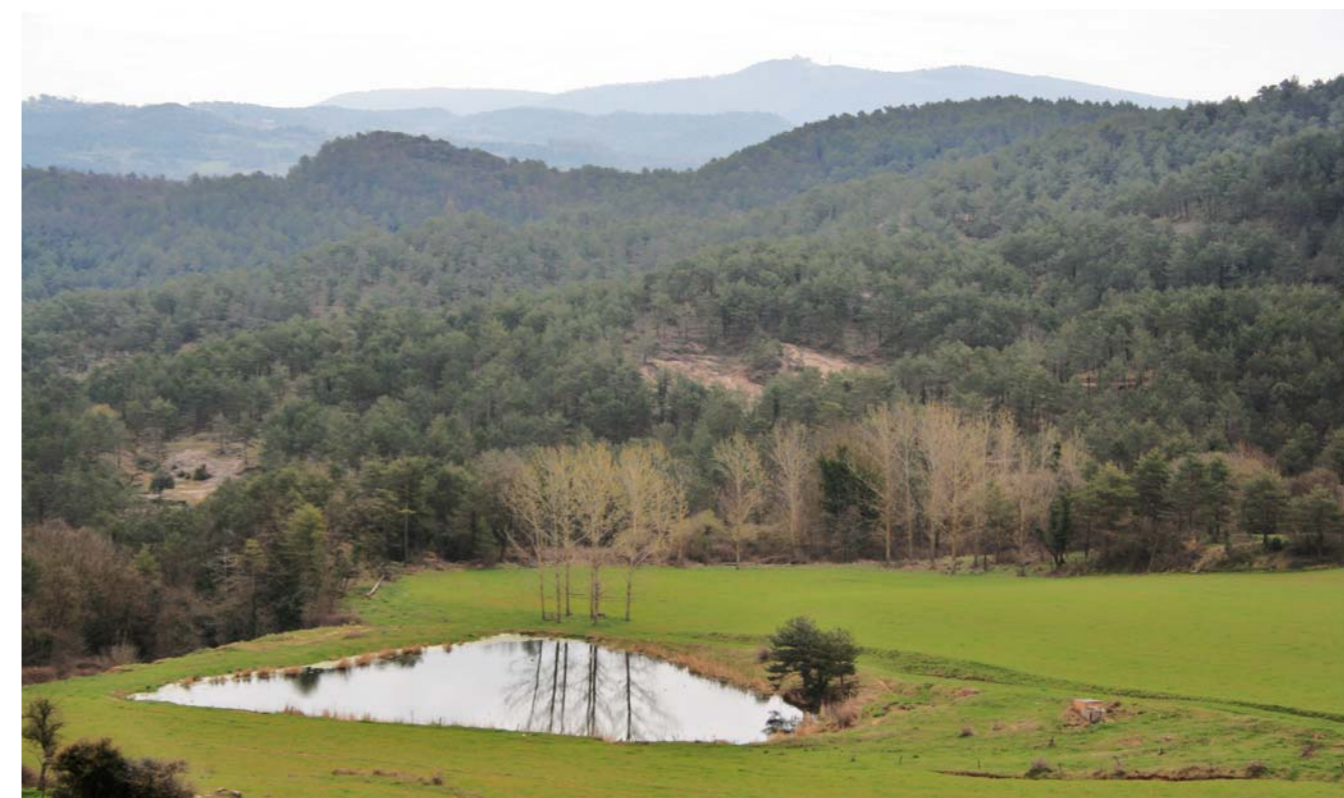
Figura 2.1 El muntanyam suau domina els paisatges de l'Alt Ter. Boscos, conreus i bassa a Sora.