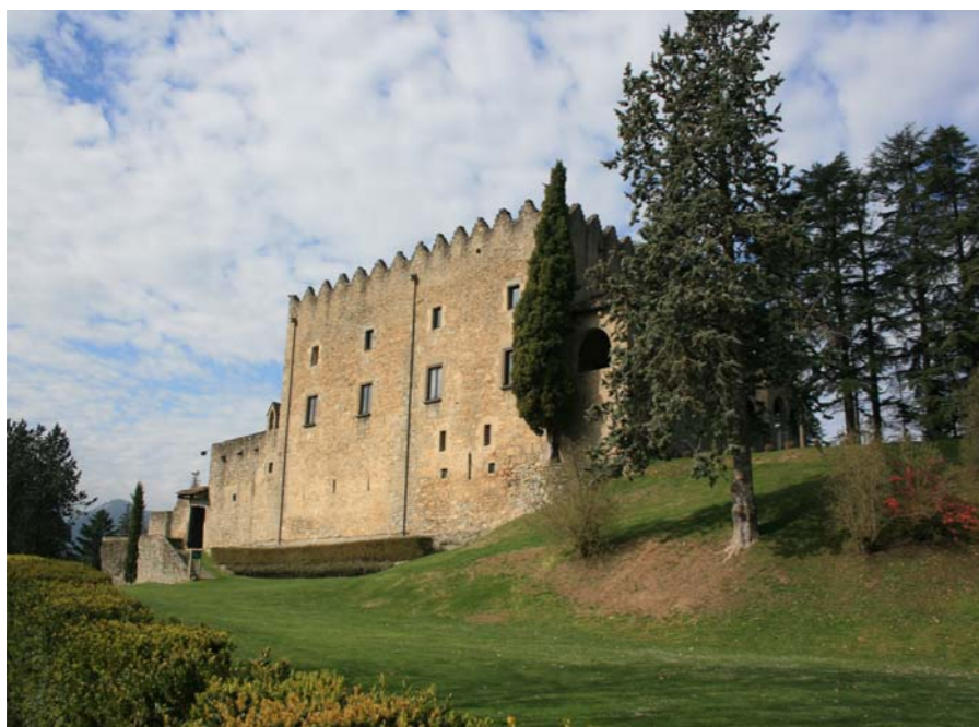
Figura 2.8 El Castell de Montesquiú, documentat el 1285, Montesquiú.

A l'edat del Bronze pertany l'hàbitat continuat de les Tombes del Faig i el megàlit de Saderra, a l'extrem occidental de la serra de Bellmunt. A l'edat de Ferro pertany un jaciment emplaçat al lloc que ocupa avui el castell de Besora. En aquest període es desenvolupà la cultura Iber, que es caracteritzava per triar emplaçaments a les zones elevades o aturonades, fàcilment defensables i amb amplis dominis visuals. Fou el moment de l'aparició de les societats complexes amb coneixements i tècniques agràries força importants; la seva capacitat de modificar el paisatge va donar un salt qualitatiu amb l'ús del ferro. Els llocs més antropitzats degueren ser la vall del Ter, al voltant de Saderra (Orís) i les terres de conreu a mitja vessant del turó del castell de Besora, que degueren presentar un important artifatge. Tot i això, el minse nombre de pobladors ja de temps Neolítics motivaria que el paisatge natural, els boscos de roures, fossin la característica principal de la unitat. La producció de ferro degué centrar-se vora els meners, més al nord, fora de la unitat, i els de la contrada no degueren sofrir tanta pressió antròpica. Seder, Torelonense, Bisaura són noms preromans recognoscibles en la toponímia actual.