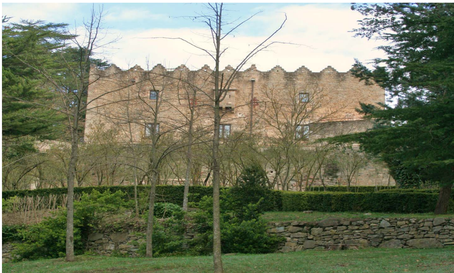
Figura 2.16 El castell de Montesquiu.

Altres elements naturals que es poden destacar del punt de vista estètic, són la sequoia de Rocafiguera (Sora) o la Balma dels Ferrers a Santa Maria de Besora, així com la zona dels serrats i costes de Torelló, caracteritzada per petites serres amb vessants erosionats amb presència de vegetació a la carena, i la Serra de Bufadors, particular formació on el vent circula per les esclatxes produint sons característics.