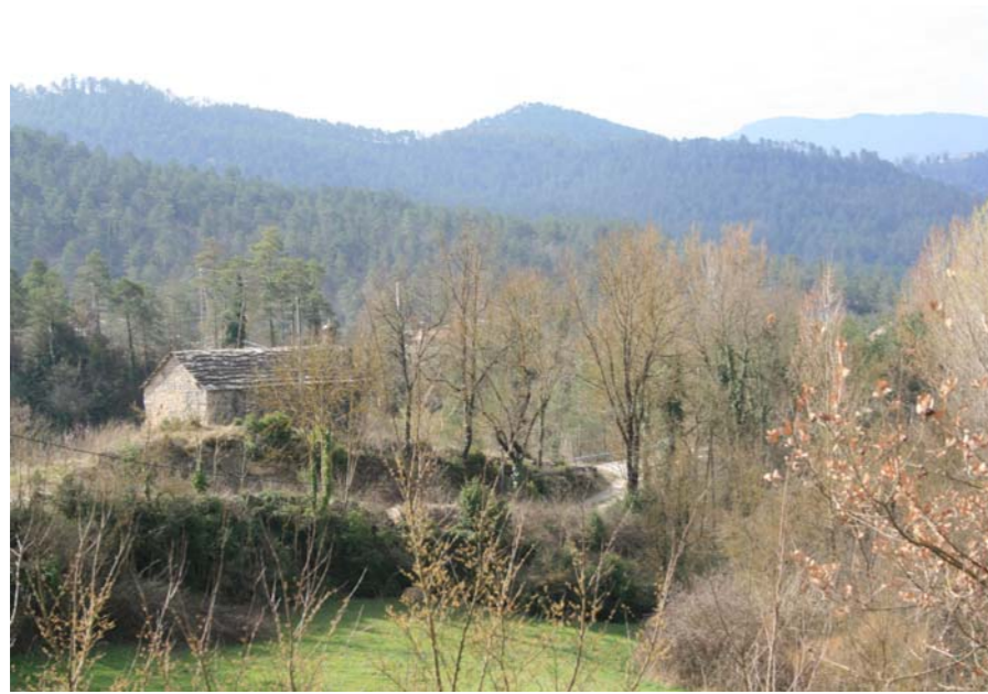
Figura 2.17 Sant Joan de Noguera voltat d'arbres en període de foliació. Sora.

Encara que la presència humana en el territori és molt antiga, mai no ha estat molt nombrosa. No obstant al corredor del Ter, lloc de pas natural, trobem evidències d'aquesta presència, com el poblat ibèric dels Ocells, o el tram de via romana a la Cogulera, ambdós a Sant Quirze de Besora.