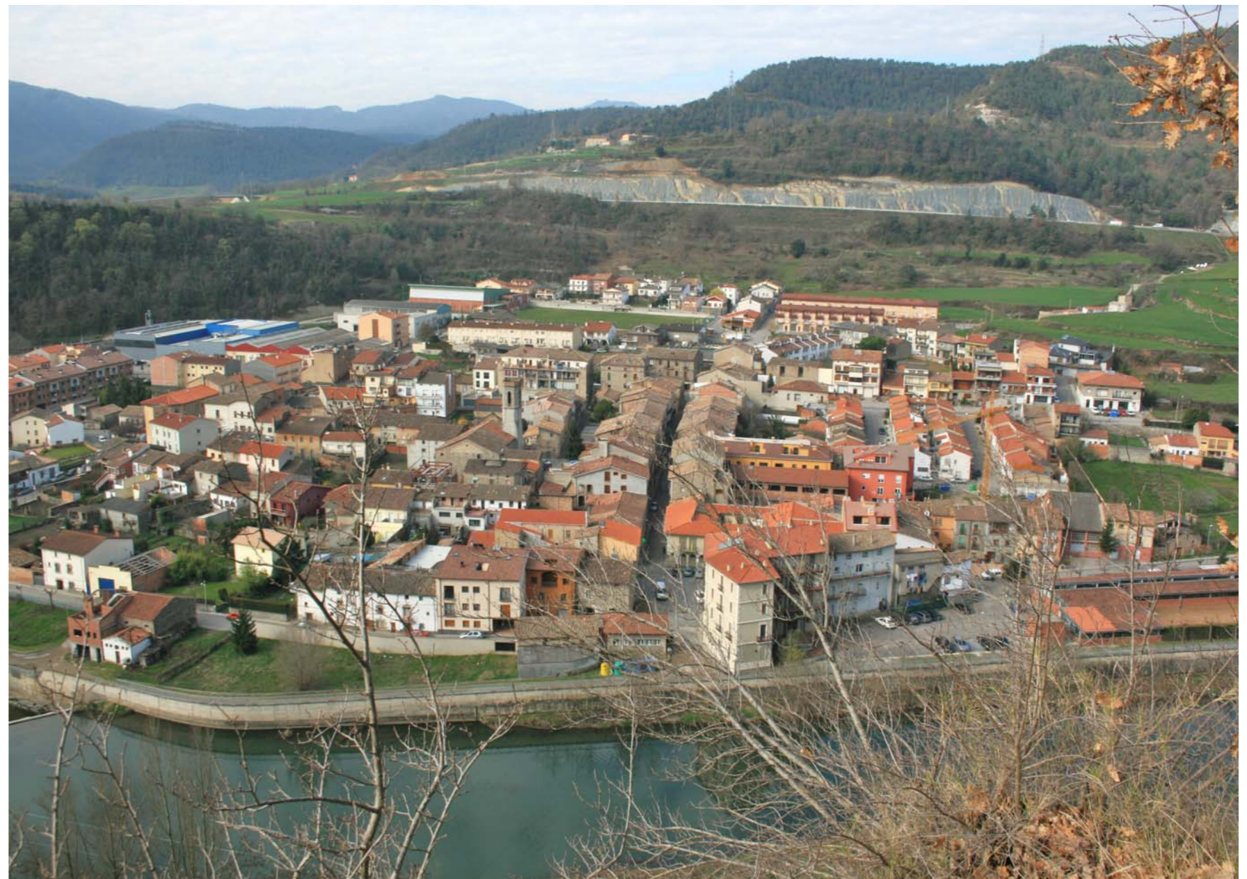
Figura 2.18 Vista de Montesquiú des del Rocal.

Els boscos de l'Alt Ter constitueixen un tipus de paisatge en el qual la funció productiva ha deixat pas gradualment a un funció més recreativa i de conservació dels sistemes naturals, on s'hi desenvolupen activitats com la caça, la pesca fluvial, l'excursionisme i la recollida de bolets.