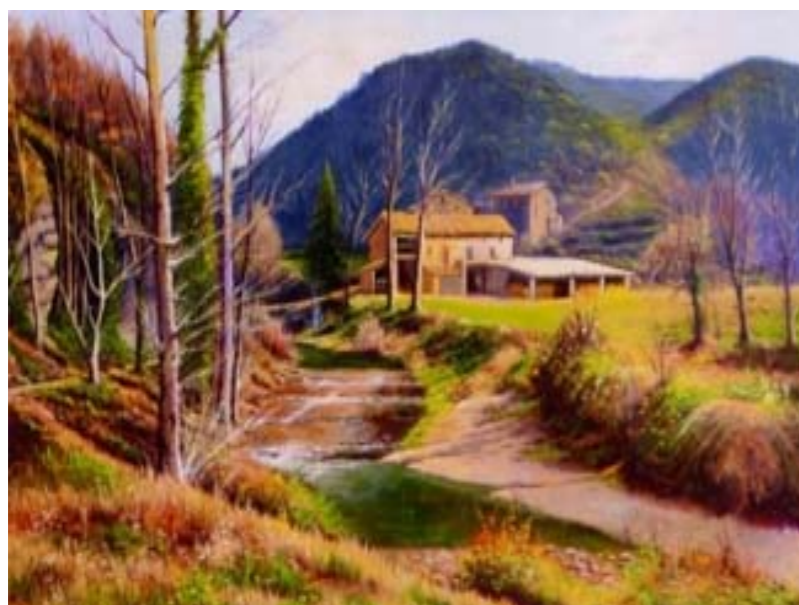
Figura 2.13 Pintura de Jordi Rovira.

«Com pare amorosíssim que a sos fillets enyora i a cada un d'ells el cerca per dar-li l'abundor, a Montesquiú visita i Sant Quirze de Besora, després a grans gambades s'apropa a Torelló. I així va baixant sempre mirant tota la Plana de Vic, com l'aucella que vola mar endins,