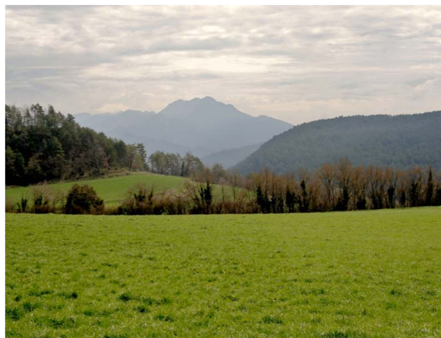
Figura 2.9 Conreus, muntanyes suaus i serralades com telé de fons són el paisatge dominant al veïnat de Cussoms, Sora.

Aquestes terres no oferien les condicions exigides pels romans pel seu establiment i l'únic vestigi localitzat és un tram de via, més tard camí ral, que connectava Vic (Ausa) amb Ripoll, aprofitant el Ter per obrir-se vers el nord. La manca d'una àmplia vall va reduir aquesta contrada a la funció de pas, fet que propicià la preservació del paisatge i la concentració de l'actuació antròpica a la vall del Ter. Únicament la