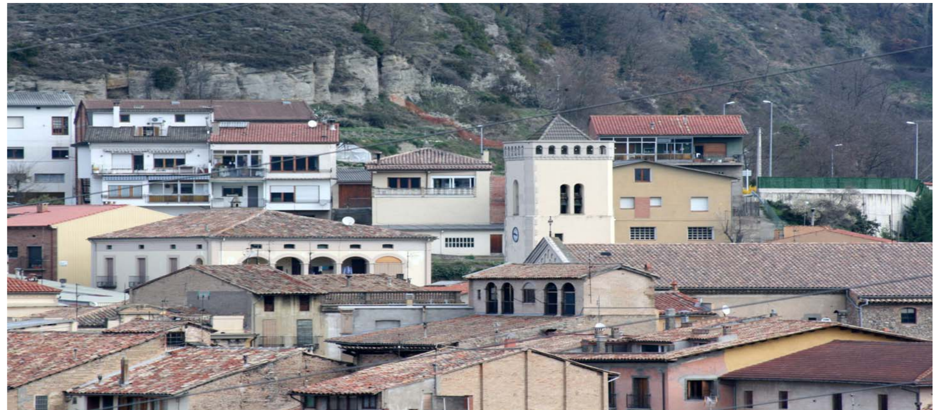
Figura 2.12 Vista parcial de Sant Quirze de Besora.

Els elements naturals són clarament dominants tant en aquest sector com a la resta de la unitat. En aquesta zona muntanyosa (d'entre 800