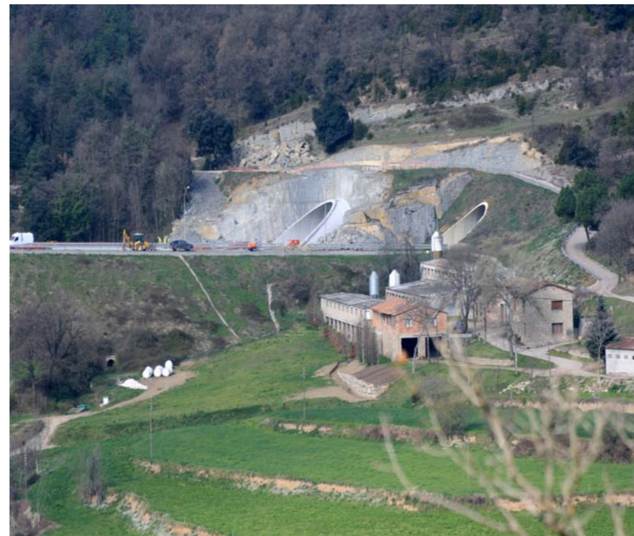
Figura 2.20 Obres de desdoblament de la C-17.

Un mirador destacat a la part sud-oriental és el del Santuari de la Mare de Déu de Bellmunt (1248 m) (mirador 15, veure mapa 2.2), amb vistes al nord a les serres veïnes de la unitat fins al Pirineu (Puigmal), al nord-oest el Pedraforca i la serra de Queralt, a l'est el Puigsacalm i els relleus tabulars del Cabrerès, i tancant pel sud la Plana de Vic, amb el Montseny al fons i al sud-est Montserrat. El castell de Santa Maria de Besora (1031 m) (44) permet vistes dels serrats pròxims i de les poblacions de Santa Maria i Sant Quirze de Besora. Un altre mirador destacat però situat a la unitat veïna del Lluçanès és el Santuari de la Mare de Déu dels Munts (1057 m) (32), amb vistes panoràmiques fins els Pirineus, el Cabrerès, el Montseny, la vall del Ter i el Lluçanès. Un altre bon punt d'observació, a ponent, Sant Pere de Serrallonga (1050 m) presenta vistes sobre Alpens i la part occidental de l'Alt Ter.