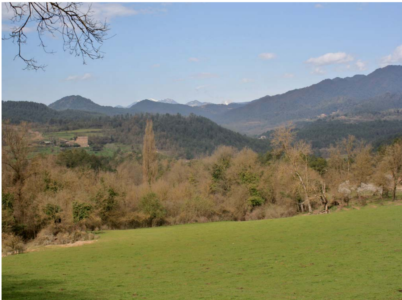
Figura 2.2 Conreus i boscos al camí de Cussoms, prop de la Plana Llisa.