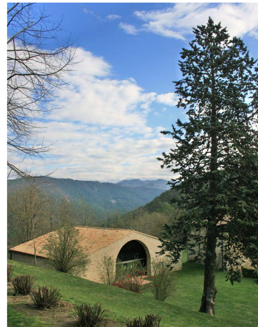
Figura 2.15 Construcció annexa al Castell de Montesquiú.

El Bisaura, que queda integrat dins la unitat excepte la part de Vidrà, és actualment marca territorial, que entre altres aspectes vol promocionar el paisatge i la cultura local. Un exemple és la mostra d'art el Bisaurart. La iniciativa va sorgir a l'any 1988 quan un grup d'artistes bisaurencs