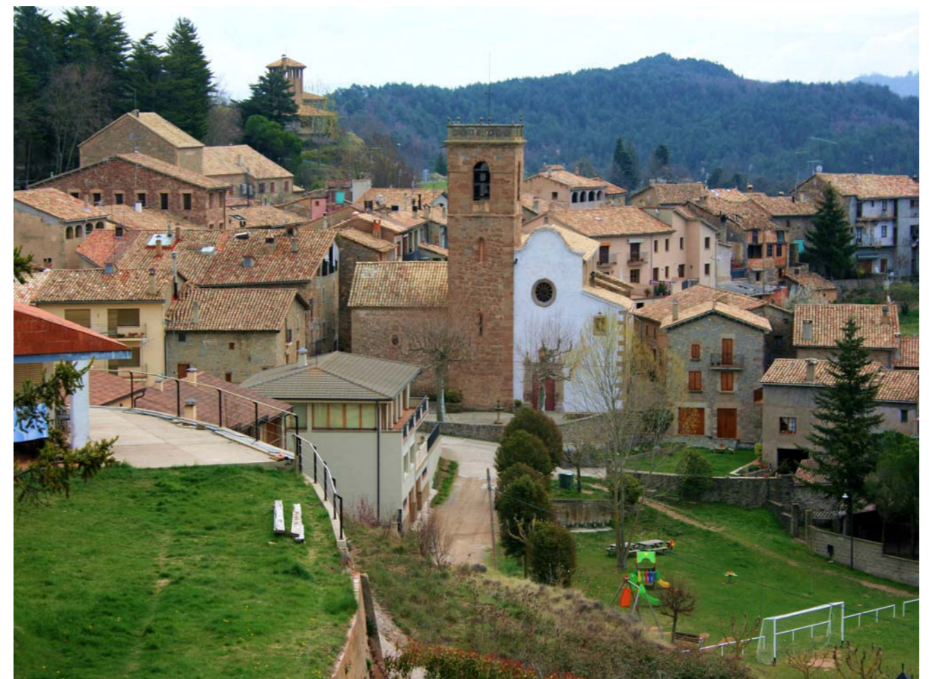
Figura 2.3 Vista parcial d'Alpens, amb l'església de Santa Maria, barroc neoclàssic molt modificat.