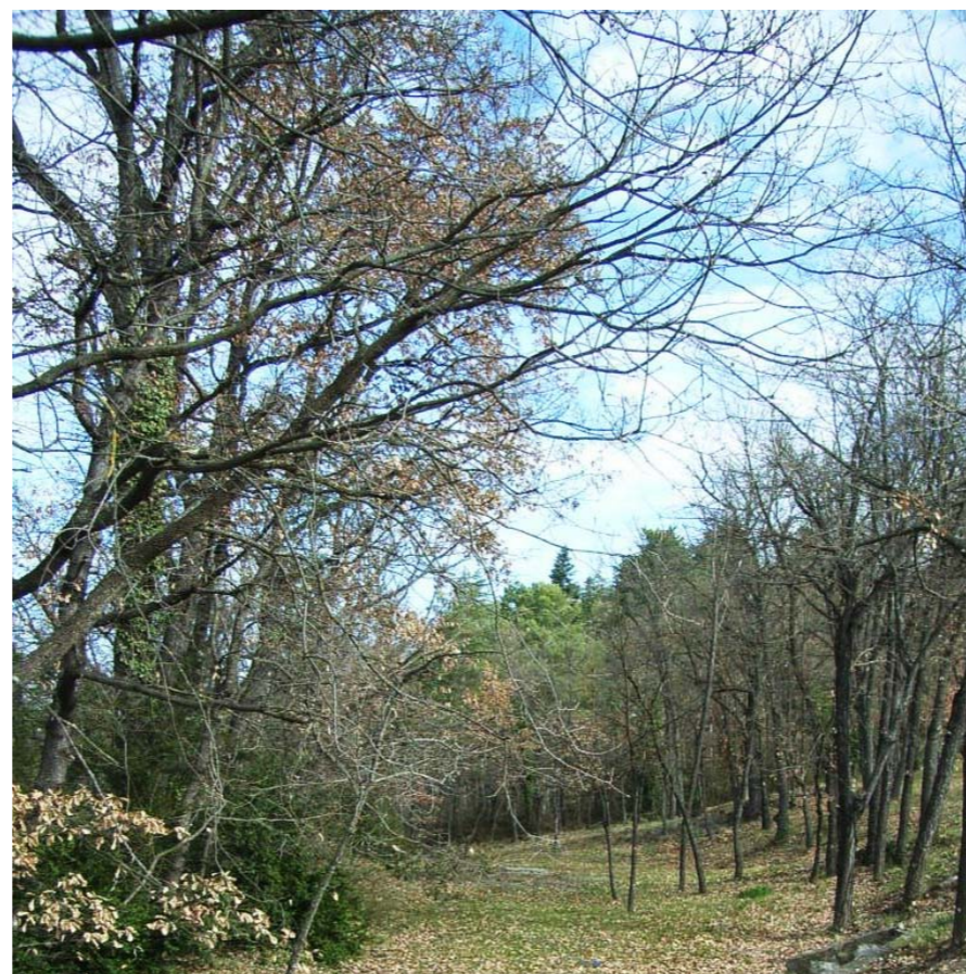
Figura 2.7 Alzinar proper al castell de Montesquiú, Montesquiú.

El clima de l'Alt Ter en aquest sector correspon al mediterrani prepirinenc oriental, amb unes precipitacions que oscil·len entre els 850 i 1100 mm anuals, amb màximes aportacions a l'estiu o la primavera i mínimes a l'hivern, temperatures mitjanes anuals entre 9 i 12 °C.