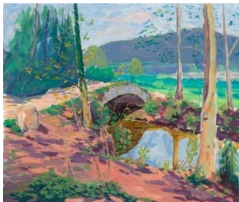
Figura 2.14 Pintura de David Casadesús.

La importància de les activitats forestals a la unitat, pels boscos de pins, roures i faigs de la serra de Milany, el serrat de la Garrafa, el bosc de la Coma, la serra de Bufadors i el serrat de la Roura, fou remarcable