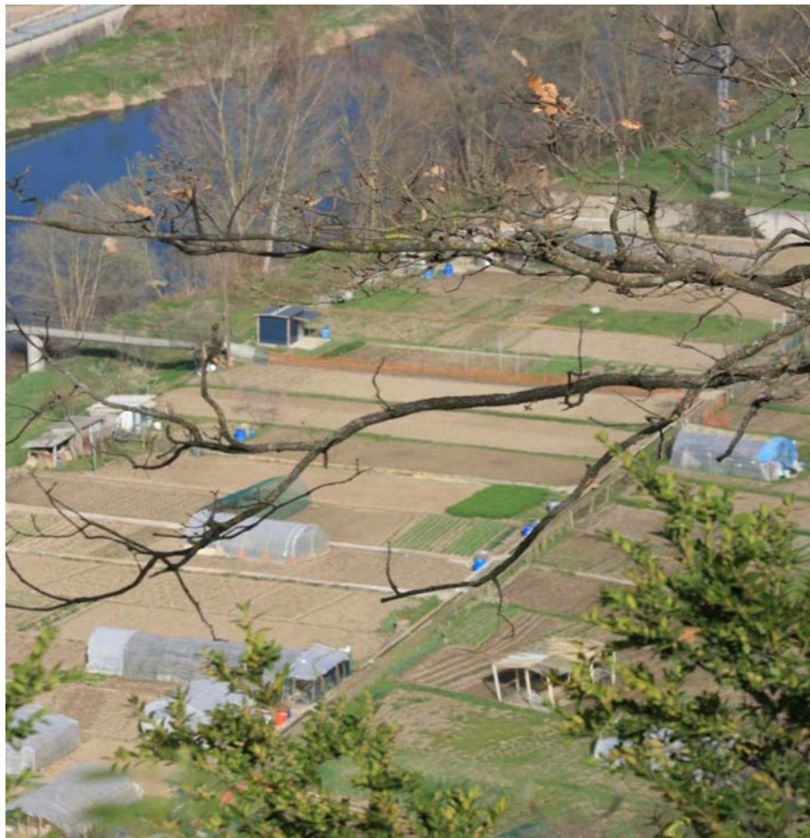
Figura 2.11 L'horta sempre ha estat un excel·lent complement de l'economia familiar. Hortes a la riba del Ter. Montesquiu.

A partir del segle XVI es produí a l'Alt Ter un creixement continuat basat en la indústria tradicional dels paraires i teixidors. L'agricultura i la ramaderia sempre foren mancades d'espais prou aptes i la màxima pressió sobre el paisatge a partir del segle XVII provingué de la indústria metal·lúrgica basada en la «farga catalana», que tenia la màxima concentració fora de la contrada, però comptà amb un important centre a la Roca Figuera (la Farga de Bebié). Les fargues tingueren una notable incidència en el paisatge, tant per la degradació produïda a l'entorn de les mines com per la desforestació provocada per l'ús del carbó vegetal com a combustible. Per obtenir una tona de ferro es