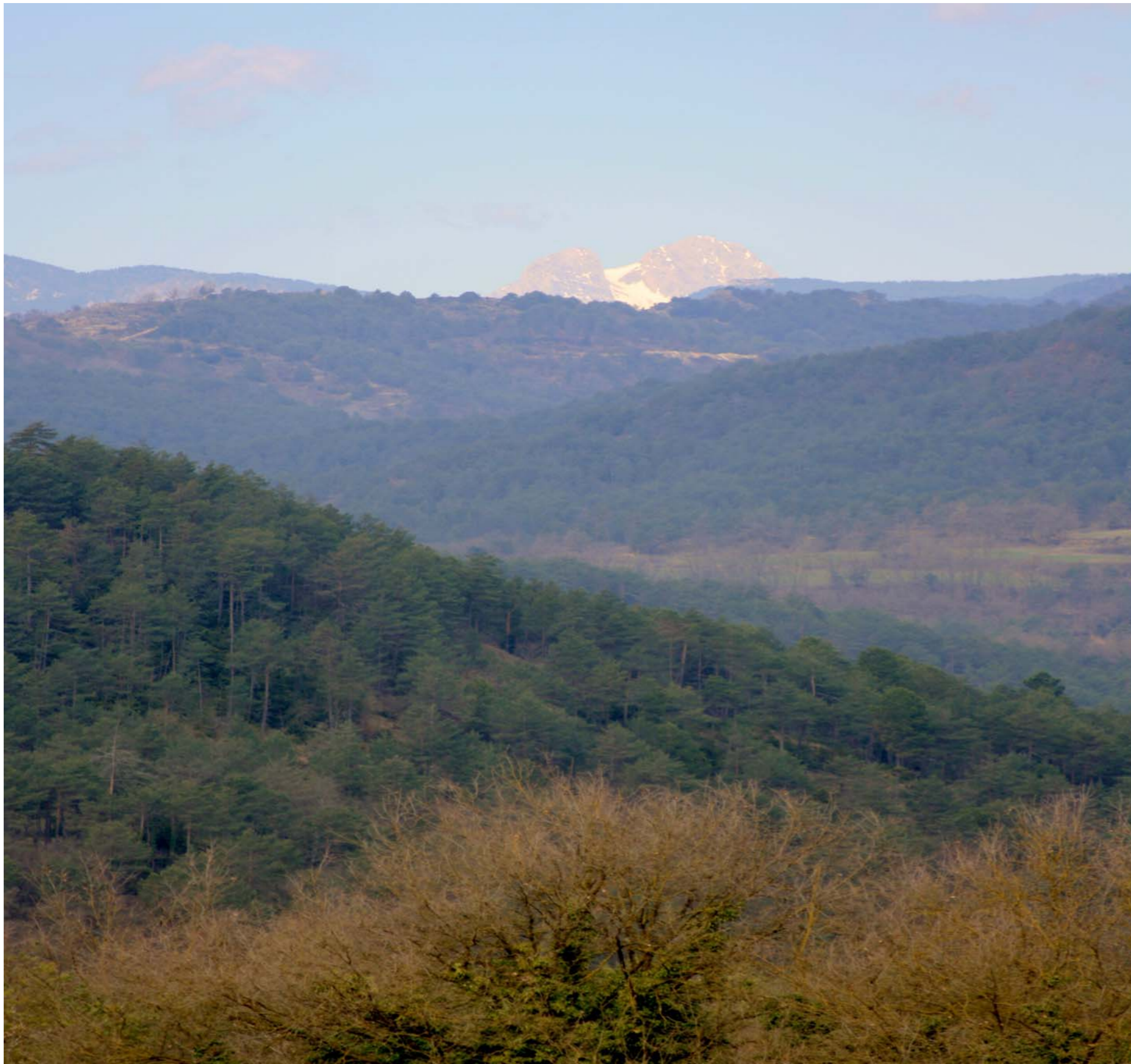
Figura 2.21 Prop de la Plana Llisa, camí de Cussoms, s'albira, en últim terme, la silueta del Pedraforca. Sora.

- La presència del consorci de la Vall del Ges, Orís i Bisaura des de l'any 2005, fomenta una gestió conjunta de bona part d'aquest sector de la unitat de paisatge.