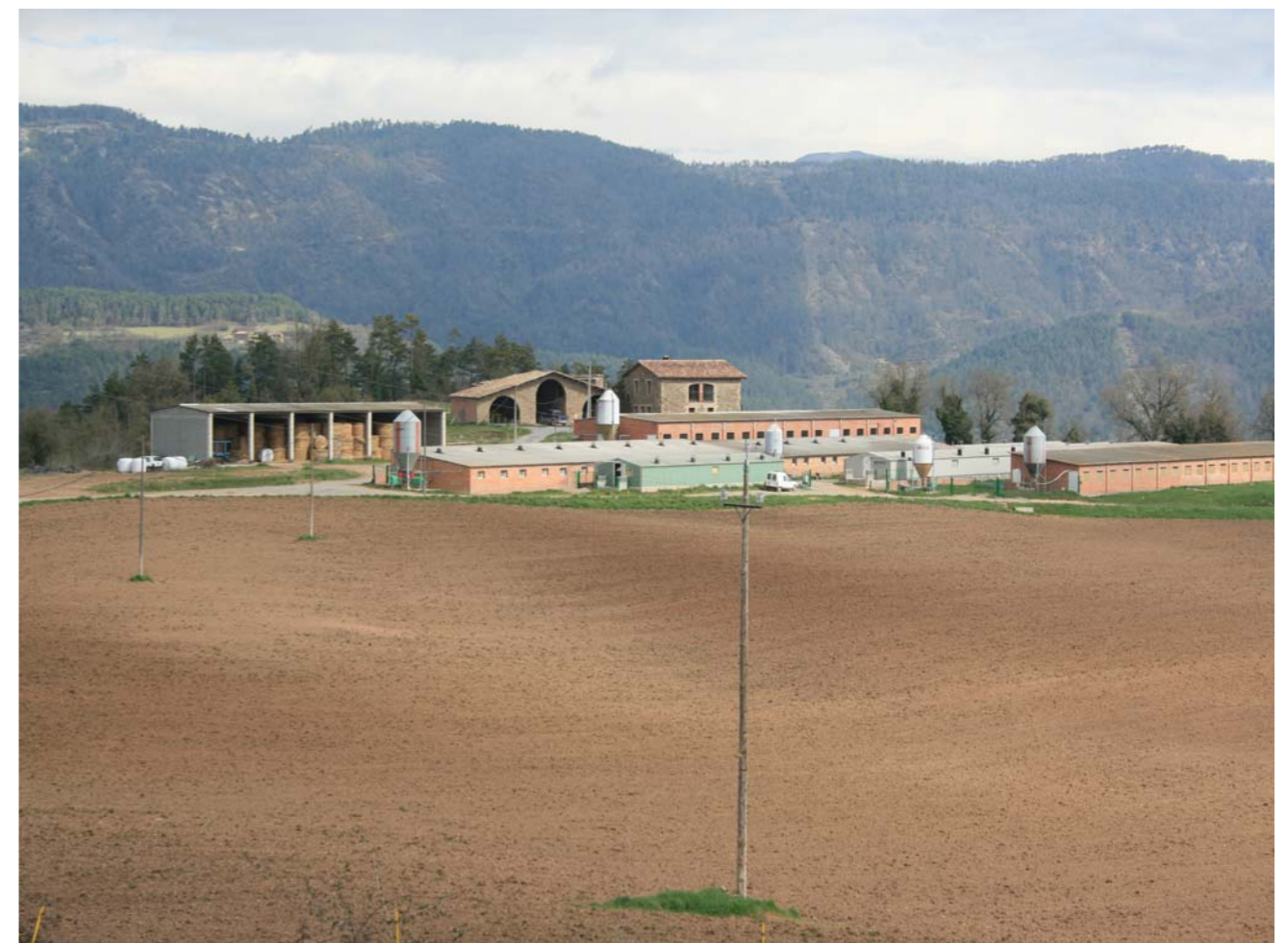
Figura 2.5 La ramaderia constitueix un pilar bàsic de l'economia de l'Alt Ter. Granja a el Coll, Sora.