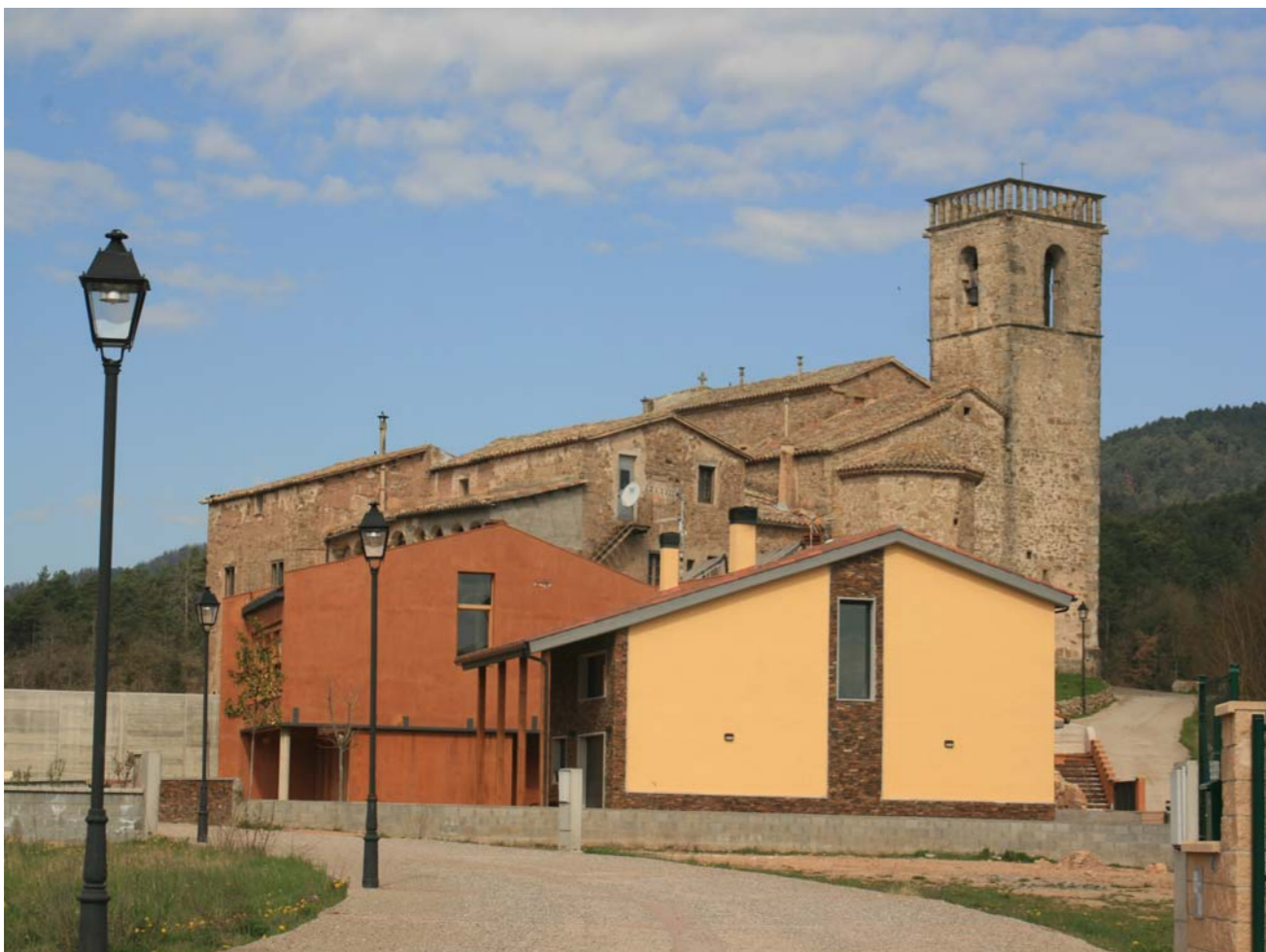
Figura 2.4 Sora, amb l'església de Sant Pere de Sora, refeta a principis del segle XII.