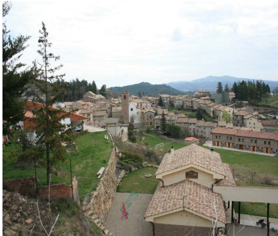
Figura 2.19 El nucli d'Alpens.

També destaquen els valors identitaris relacionats amb el santuari de la Mare de Déu de Bellmunt i especialment els monestirs de Santa Maria de Ripoll, de Sant Joan de les Abadesses i el Santuari de Montgrony, tots ells a l'Alt Ter però fora de l'àmbit de les Comarques Centrals, degut a l'important paper que representen en la cultura, la identitat i la història de Catalunya.