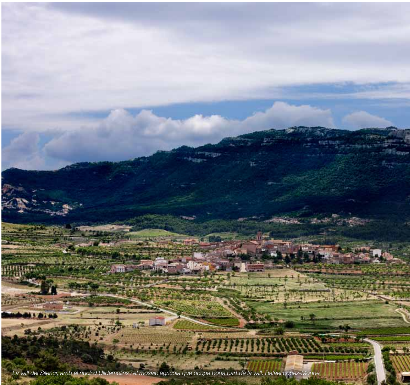
La vall del Silenci, amb el nucli d'Ulldemolins i el mosaic agrícola que ocupa bona part de la vall. Rafael López-Monné

Un sòl no urbanitzable on les actuacions permeses (equipaments d'interès públic, explotació de recursos naturals, construccions agràries, i reconstrucció i rehabilitació de masies i cases rurals...) contribueixin a emfasitzar els paisatges per mitjà d'una bona integració en l'entorn tant de les construccions com dels espais lliures associats