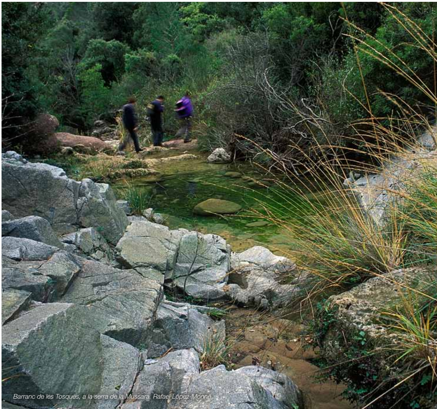
Barranc de les Tosques, a la serra de la Mussara. Rafael López-Monné

Uns paisatges naturals 1 de qualitat que compaginin l'activitat agropecuària, d'extracció i aprofitament sostenible dels recursos naturals i l'ús turístic i de gaudi