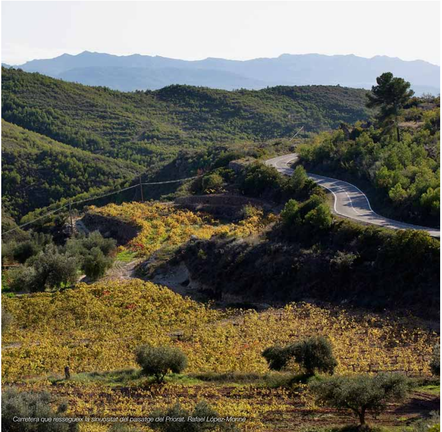
Carretera que ressegueix la sinuositat del paisatge del Priorat. Rafael López-Monné

Unes vies de comunicació integrades en el territori i en el paisatge que permetin la connectivitat ecològica i la continuïtat paisatgística i social del territori