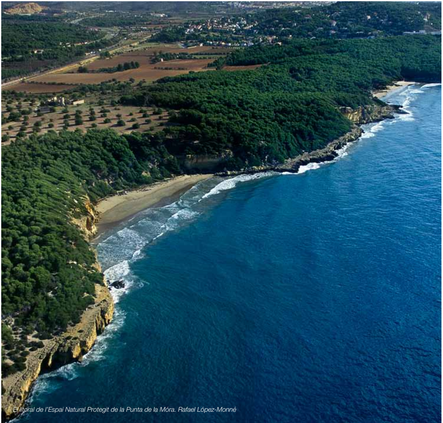
El litoral de l'Espai Natural Protegit de la Punta de la Móra. Rafael López-Monné

Uns paisatges litorals naturals i agrícoles gestionats integralment, preservats de la urbanització i les infraestructures, que resultin accessibles al gaudi i l'ús social amb respecte pels valors naturals i estètics