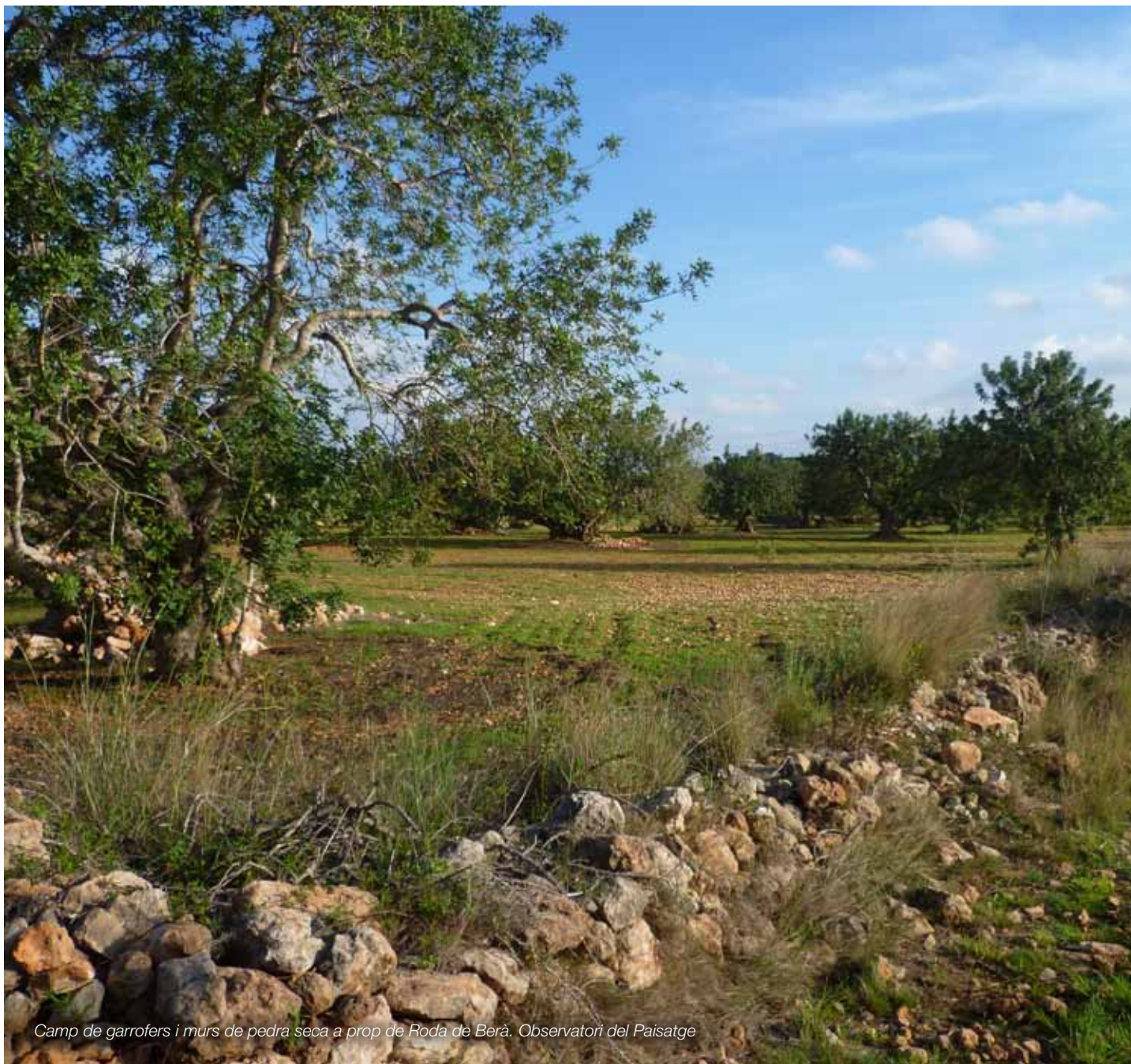
Camp de garrofers i murs de pedra seca a prop de Rodà de Berà.

Un paisatge del garrofer que generi espais agrícoles de qualitat en espais agrícolament marginals a partir del treball de la pedra seca, conservat com a referent estètic i identitari del litoral mediterrani tarragoní, i que creï espais tampó/de transició entre els espais urbanitzats i els espais naturals