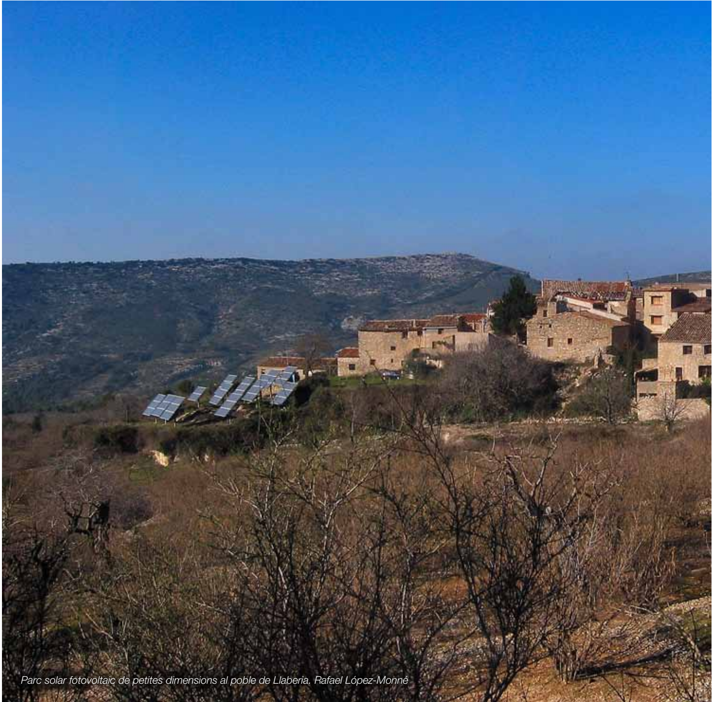
Parc solar fotovoltaic de petites dimensions al poble de Llaberia. Rafael López-Monné

Uns parcs eòlics i parcs solars fotovoltaics, planificats amb visió de conjunt a escala regional i implantats d'acord amb els elements que configuren el paisatge