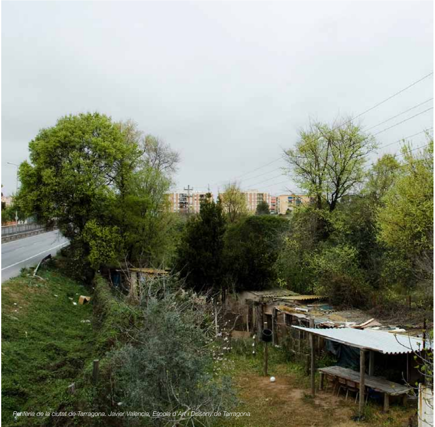
Perifèria de la ciutat de Tarragona. Javier Valencia, Escola d'Art i Disseny de Tarragona

Uns espais periurbans de les grans i mitjanes ciutats, dissenyats amb criteris d'integració i aportació de nous elements d'interès en el paisatge