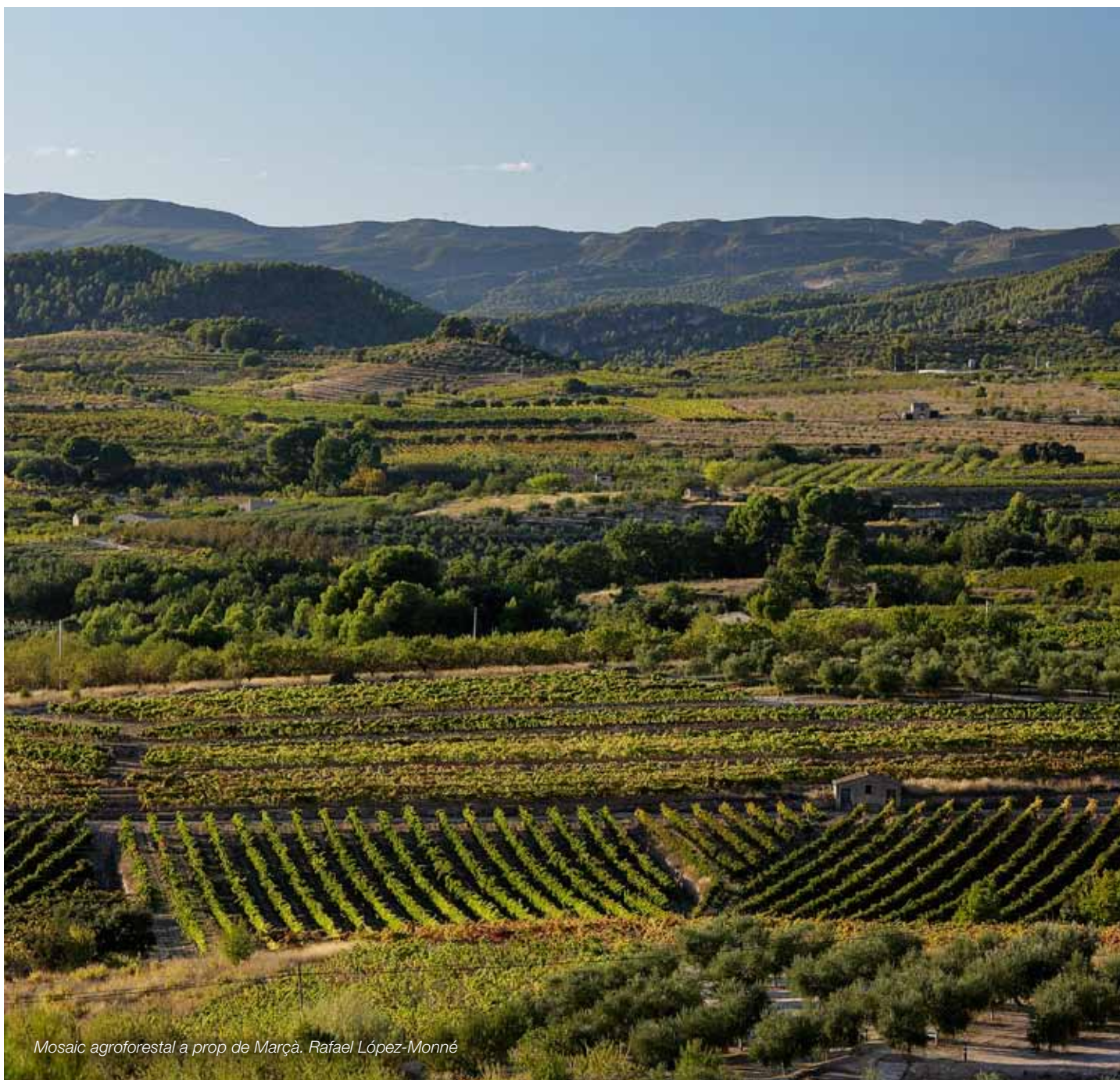
Mosaic agroforestal a prop de Marçà. Rafael López-Monné

Uns mosaics agroforestals de conreus de secà, productius, i vinculats al manteniment dels elements de pedra seca de suport a l'agricultura, o exemples vius de paisatges de la trilogia mediterrània per excel·lència (blat, vinya i olivera/ametller)