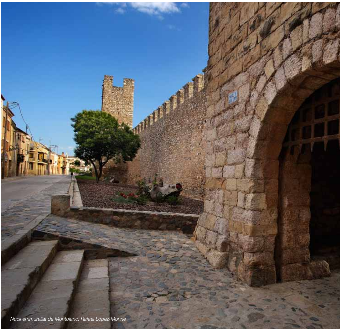
Nucli emmurallat de Montblanc. Rafael López-Monné

Un paisatge urbà rehabilitat, valorat per la trajectòria històrica pròpia i de qualitat arquitectònica, endreçat i dissenyat per a assegurar la bona qualitat de vida dels ciutadans