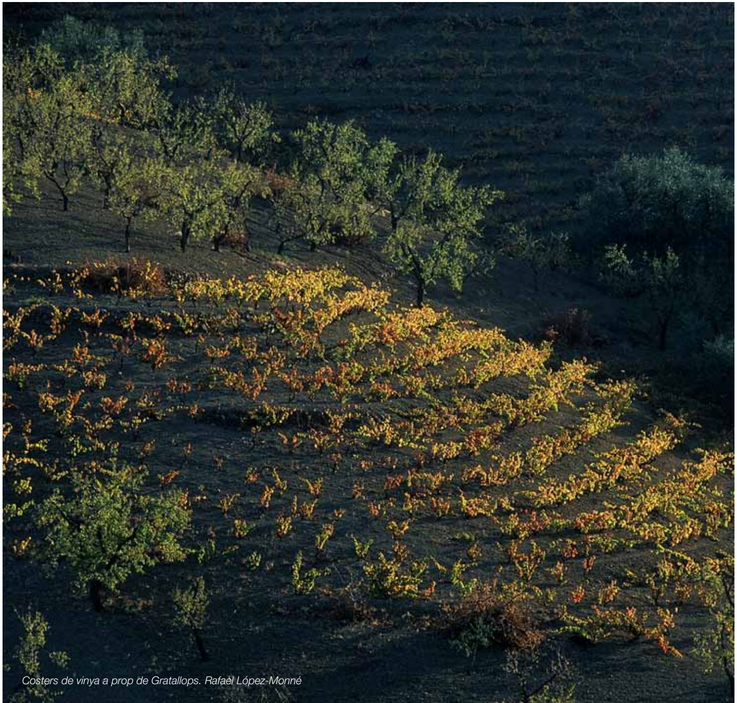
Costers de vinya a prop de Gratallops. Rafaël López-Monné

Uns paisatges de la vinya ben conservats i gestionats que potenciïn els productes vinícoles que s'hi produeixen, on la vinya conviu amb altres conreus de secà generant mosaics agrícoles