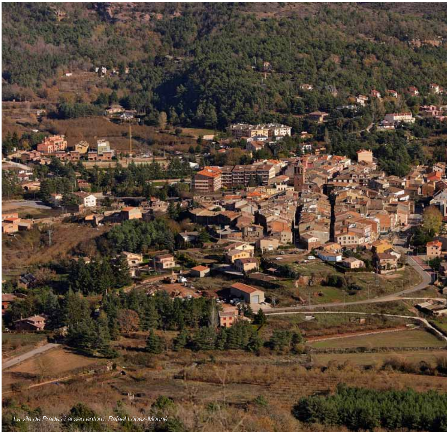
La vila de Prades i el seu entorn. Rafael López-Monné

Uns assentaments urbans amb un creixement ordenat, dimensionat d'acord amb les necessitats reals i que no comprometi el futur del caràcter agrícola dels espais circumdants als nuclis urbans