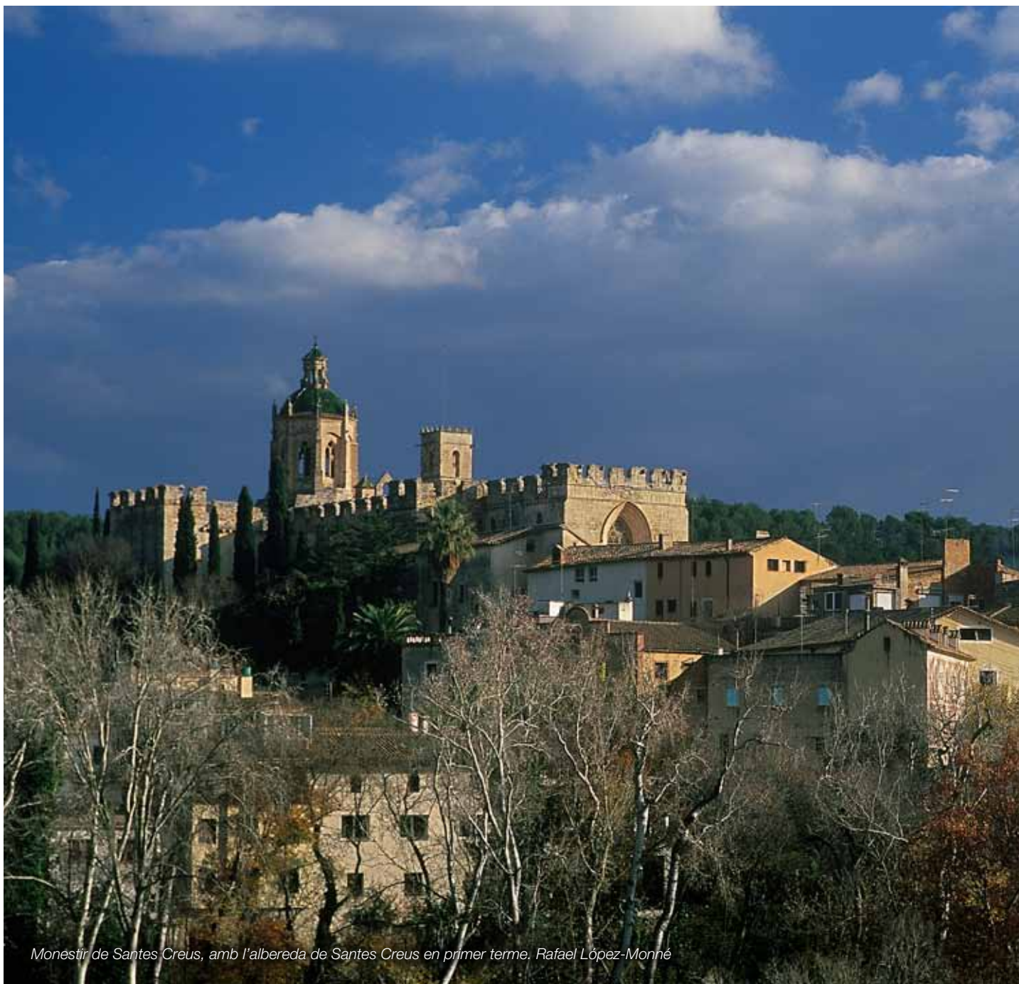
Monestir de Santes Creus, amb l'albereda de Santes Creus en primer terme. Rafael López-Monhé

Un paisatge del patrimoni històric vinculat a les construccions defensives, a les construccions religioses i a les construccions productives, dotat d'un contingut de significació territorial i paisatgística