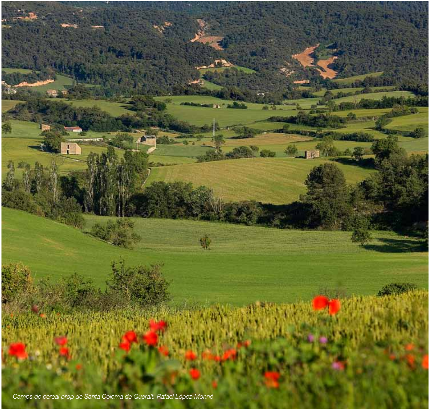
Camps de cereal prop de Santa Coloma de Queralt. Rafael López-Monné

Uns paisatges dels conreus herbacis de secà, característics de la baixa Segarra, que es mantinguin nets d'elements que en trenquin la configuració topogràfica i el mosaic agroforestal