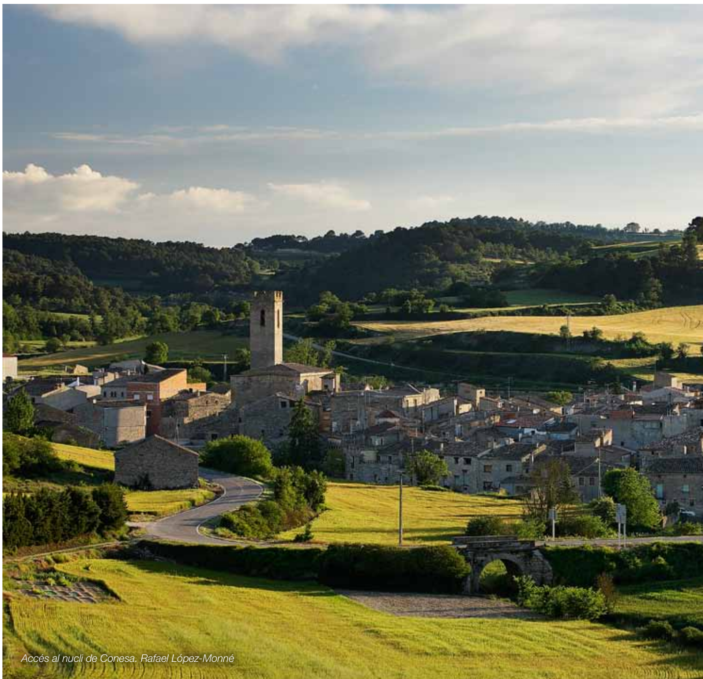
Accés al nucli de Conesa. Rafael López-Monné

Uns accessos als nuclis urbans ordenats paisatgísticament que facilitin la transició entre els espais oberts i els paisatges urbans i que reforcin el caràcter i la identitat de les poblacions