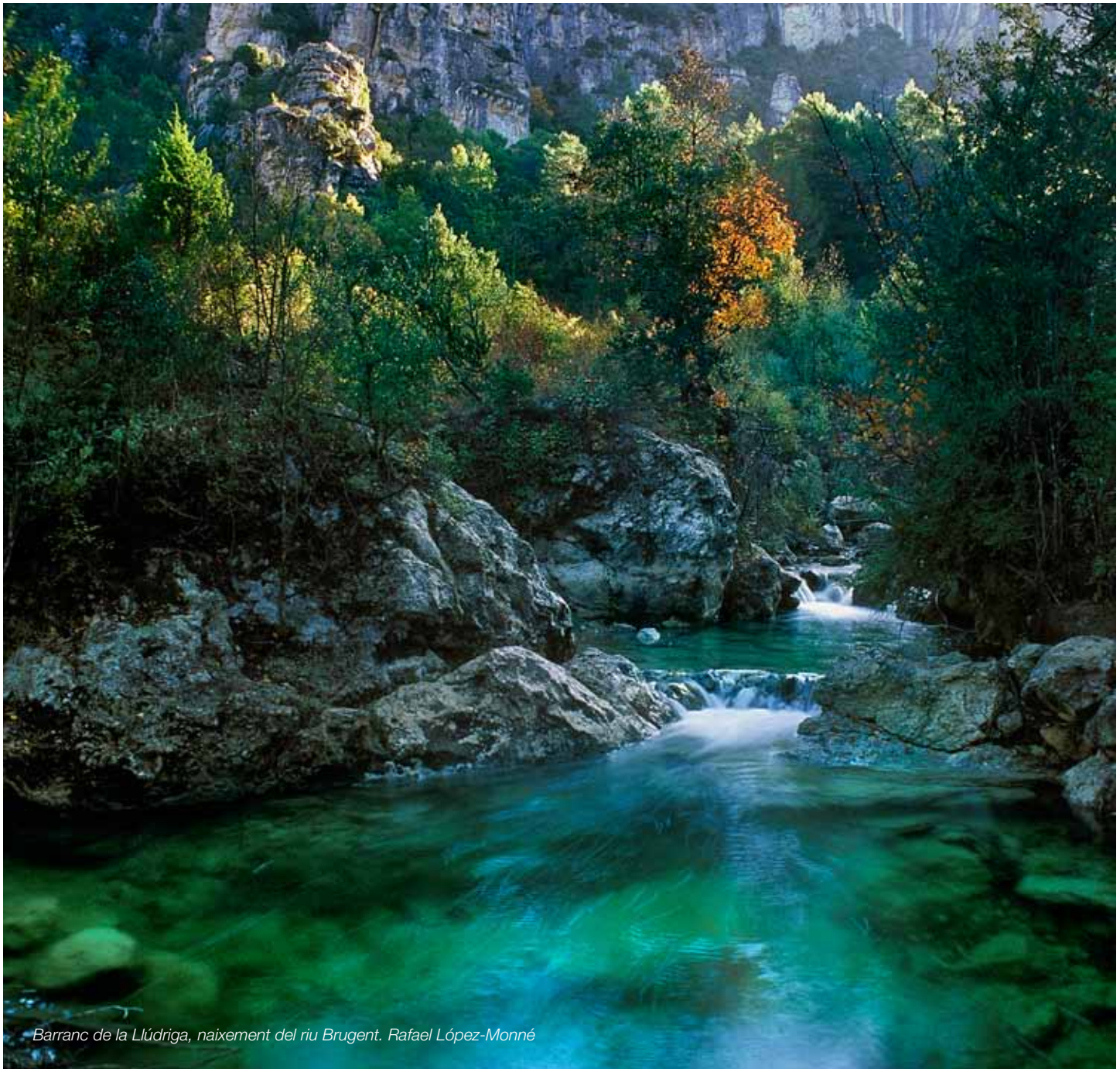
Barranc de la Llúdriga, naixement del riu Brugent. Rafael López-Monné

Uns paisatges fluvials, especialment dels rius Francolí i Gaià, però també del conjunt de barrancs i rieres, conservats d'acord amb la seva dinàmica i funcionalitat i accessibles per a activitats de gaudi