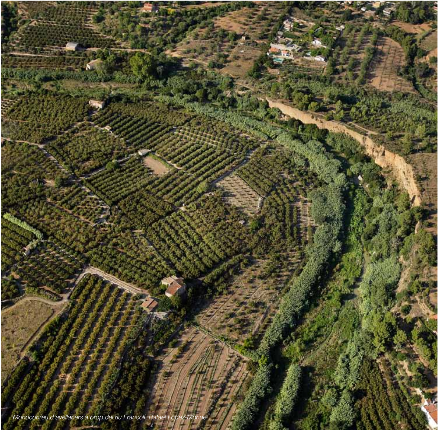
Monoconreu d'avellaners a prop del riu Francolí. Rafael López-Monné

Un paisatge de l'avellaner del sector central del Camp gestionat a partir de la seva singularitat i identitat i que permeti la revaloració dels productes agrícoles