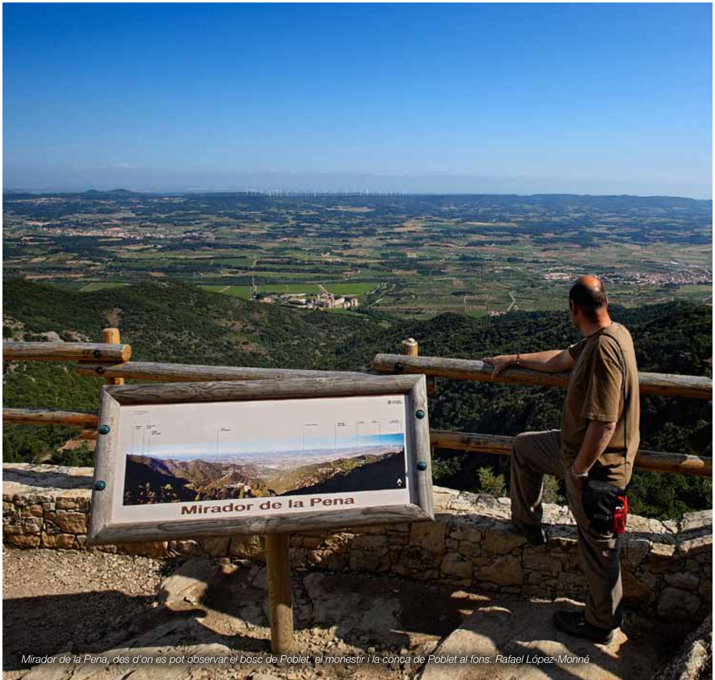
Mirador de la Pena, des d'on es pot observar el bosc de Poblet, el monestir i la conca de Poblet al fons. Rafael López-Monné

Una xarxa de miradors des dels quals destaquin les panoràmiques més rellevants i que permetin descobrir la diversitat i els matisos dels diferents paisatges del Camp de Tarragona