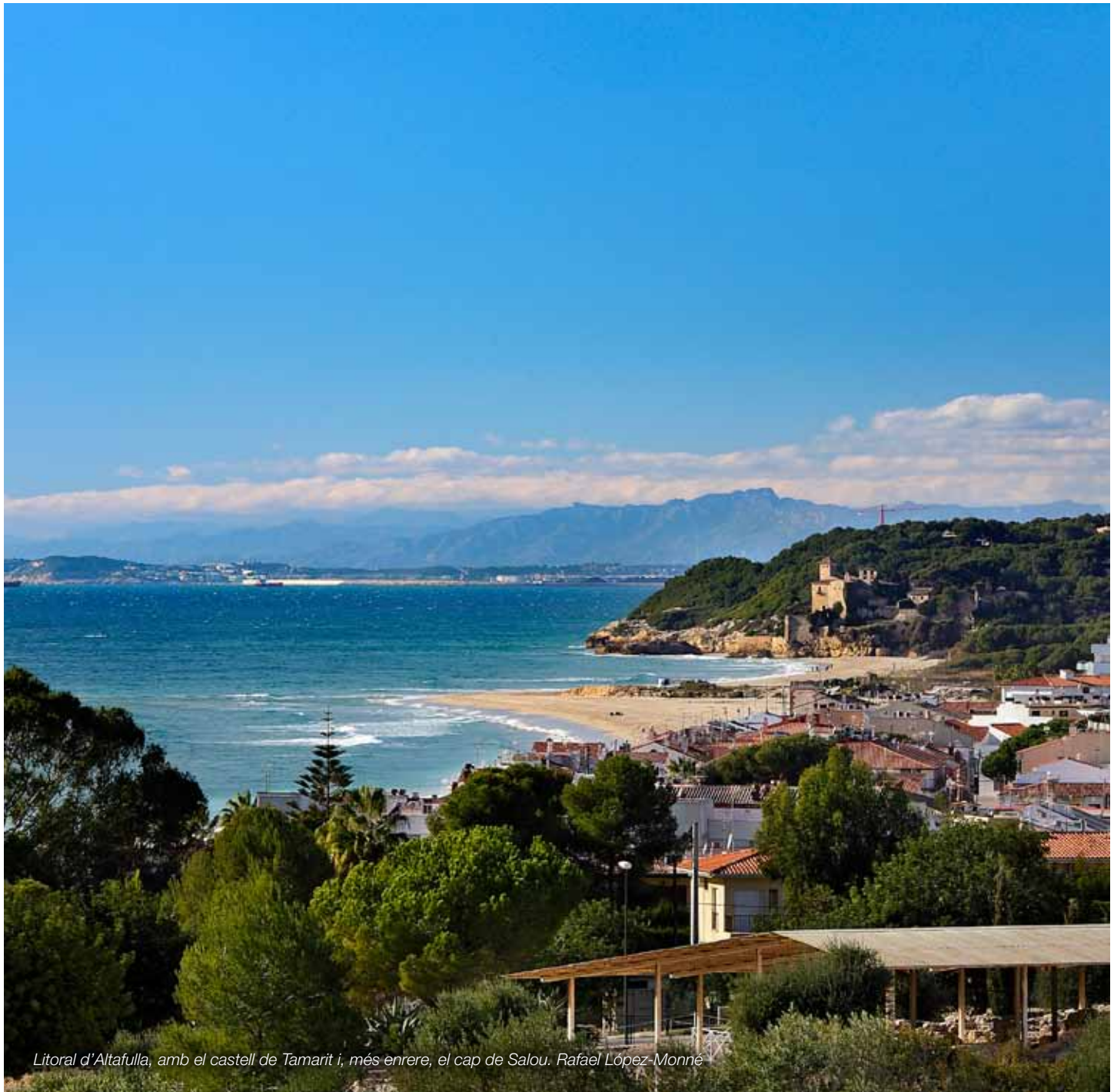
Litoral d'Altafulla, amb el castell de Tamarit i, més enrere, el cap de Salou. Rafael López-Monné

Uns paisatges litorals urbanitzats amb unes intervencions dirigides a dotar-los de qualitat, a preservar-ne la identitat i a millorar-ne l'accessibilitat per al gaudi i l'ús social