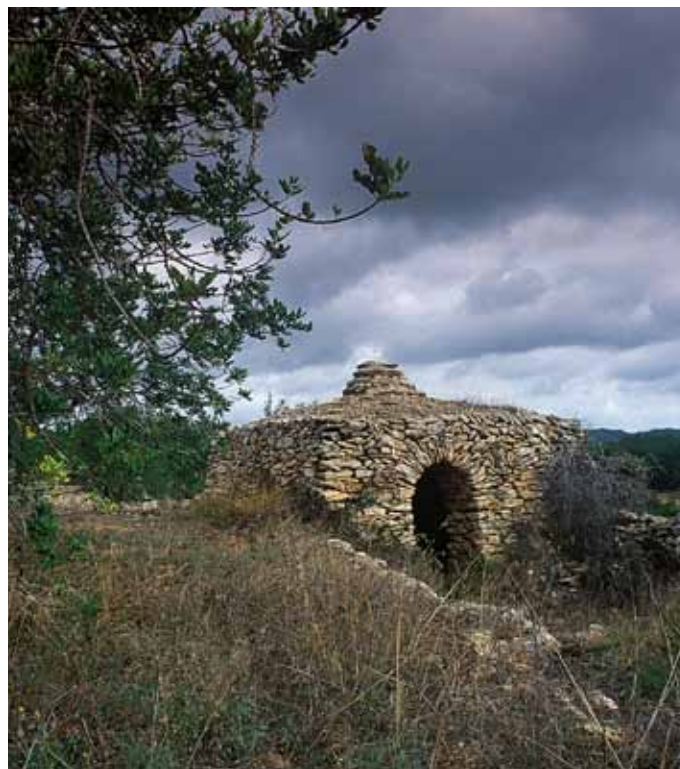
Les construccions de pedra seca també són presents en el paisatge del garrofer i contribueixen al gran valor cultural i estètic d'aquest paisatge. Rafael López-Monné