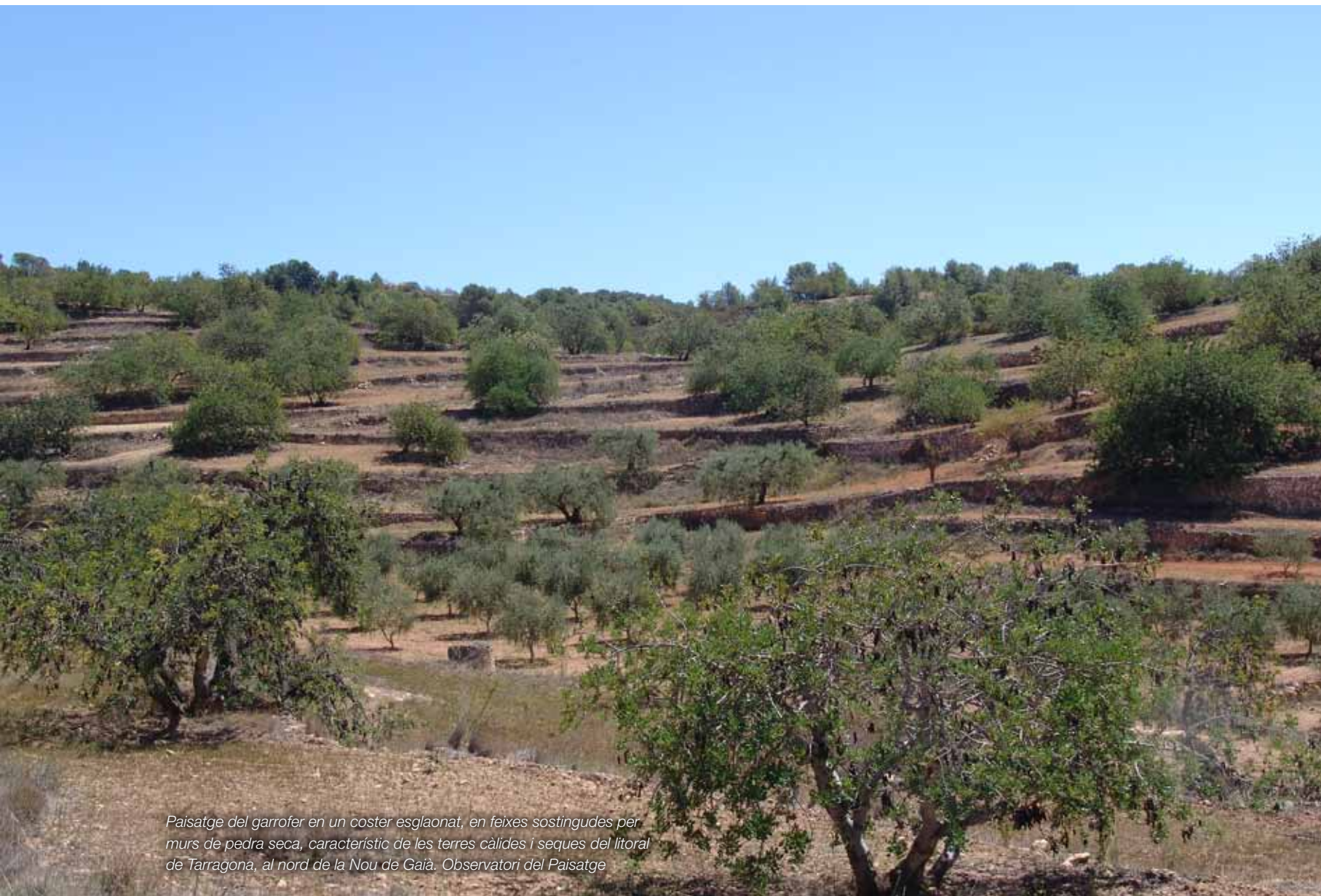
Paisatge del garrofer en un coster esglaonat, en feixes sostingudes per murs de pedra seca, característic de les terres càlides i seques del litoral de Tarragona, al nord de la Nou de Gaià. Observatori del Paisatge

El paisatge del garrofer és un paisatge agrícola tradicional en forta regressió, característic de les terres de secà dels costers, que reuneix els valors propis dels paisatges agraris mediterranis amb un alt significat identitari. Antigament havia estat molt estès i era característic de les terres litorals calcàries, seques i càlides, des de Sitges fins al Perelló, pel que fa a Catalunya, i de les terres costaneres del país.