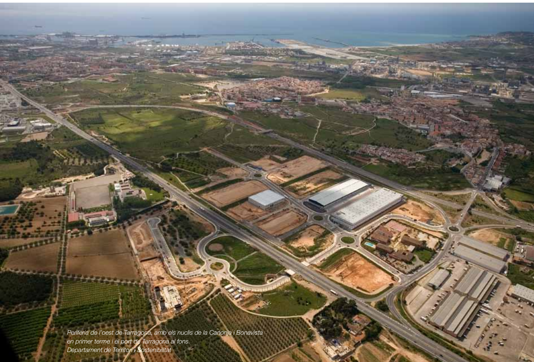
Perifèria de l'oest de Tarragona, amb els nuclis de la Canonja i Bonavista en primer terme i el port de Tarragona al fons. Departament de Territori i Sostenibilitat

L'anell de nous creixements que envolta el nucli urbà de la ciutat de Tarragona reuneix totes les característiques dels paisatges periurbans. Entre el traçat de l'autopista AP-2 i la línia de costa ha cristal·litzat un paisatge que, al marge del nucli urbà de Tarragona, presenta barris residencials, polígons industrials, grans àrees comercials i recreatives, i infraestructures de serveis. Una xarxa viària molt densa, que inclou carreteres, autovies, una autopista i la línia de ferrocarril genera noves cèl·lules de paisatge de petites dimensions en els nusos viaris i en els llocs on conflueixen en paral·lel dos o més traçats de les infraestructures de comunicació. En els espais intersticials que resten entre els espais construïts es mantenen camps de conreu, els últims reductes d'un paisatge agrari en