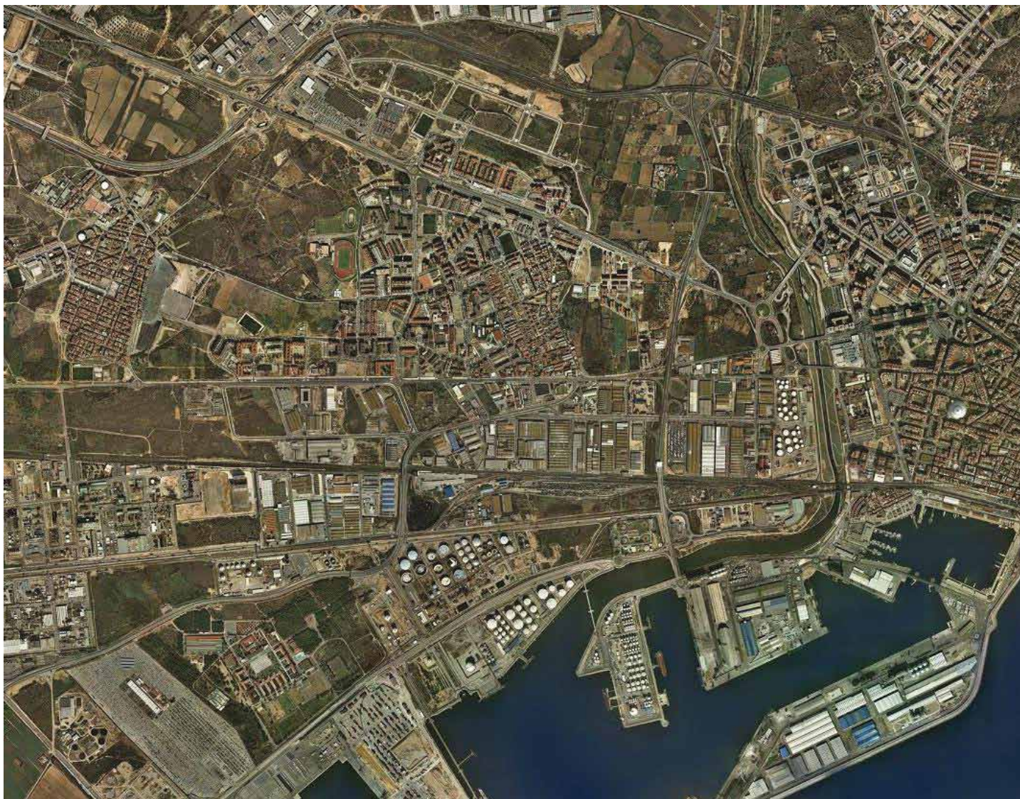
Paisatge híbrid de la perifèria de Tarragona format per usos del sòl industrials, residencials, agrícoles i erms. ICC