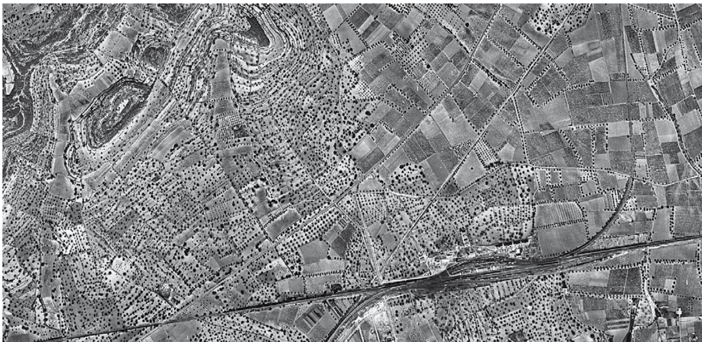
Fotografia aèria de l'any 1956 del sector entre el Vendrell i Coma-ruga. S'aprecien els camps de garrofers de l'esquerra de la imatge sobre els sòls prims de la base del turó de la torre del Telègraf, precisament en el paratge conegut com els Garrofers. A la dreta, conreus herbacis sobre sòls al·luvials. A la part inferior destaca la línia de ferrocarril Barcelona-València, més ampla a l'estació de Coma-ruga.