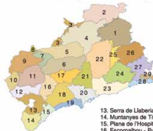
Unitats de paisatge del Camp de Tarragona