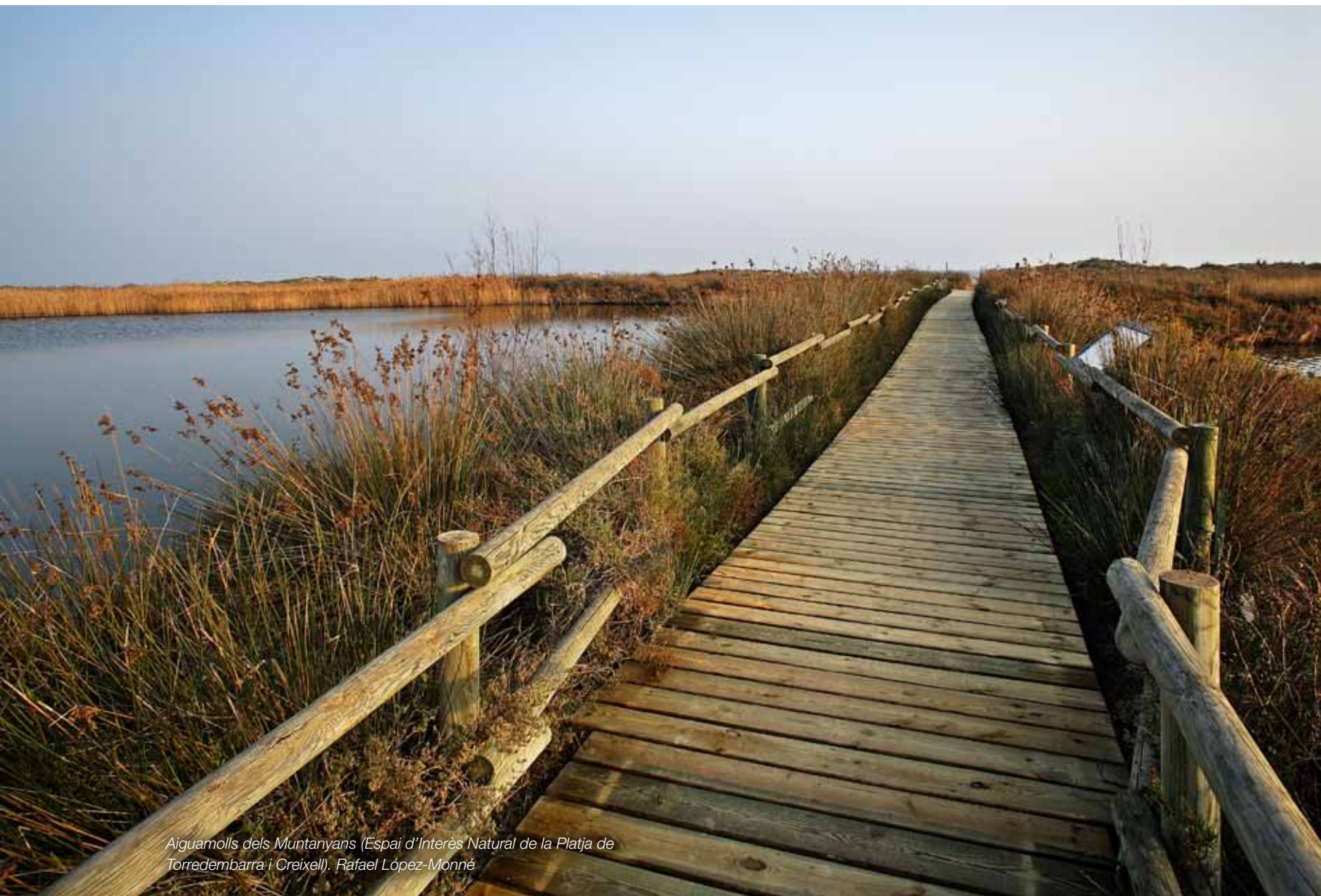
Aiguamolls dels Muntanyans (Espai d'Interès Natural de la Platja de Torredembarra i Creixell). Rafael López-Monné

Al nord del promontori de Tamarit i fins a la desembocadura del riu Foix s'inicia un llarg tram de costa baixa que es correspon amb el front litoral del baix Gaià i de la plana del Penedès. L'espai litoral limitat entre la línia de costa i els traçats de les autopistes AP-7 i C-32 ha viscut durant les darreres dècades una transformació intensa que ha canviat les característiques d'aquest paisatge.