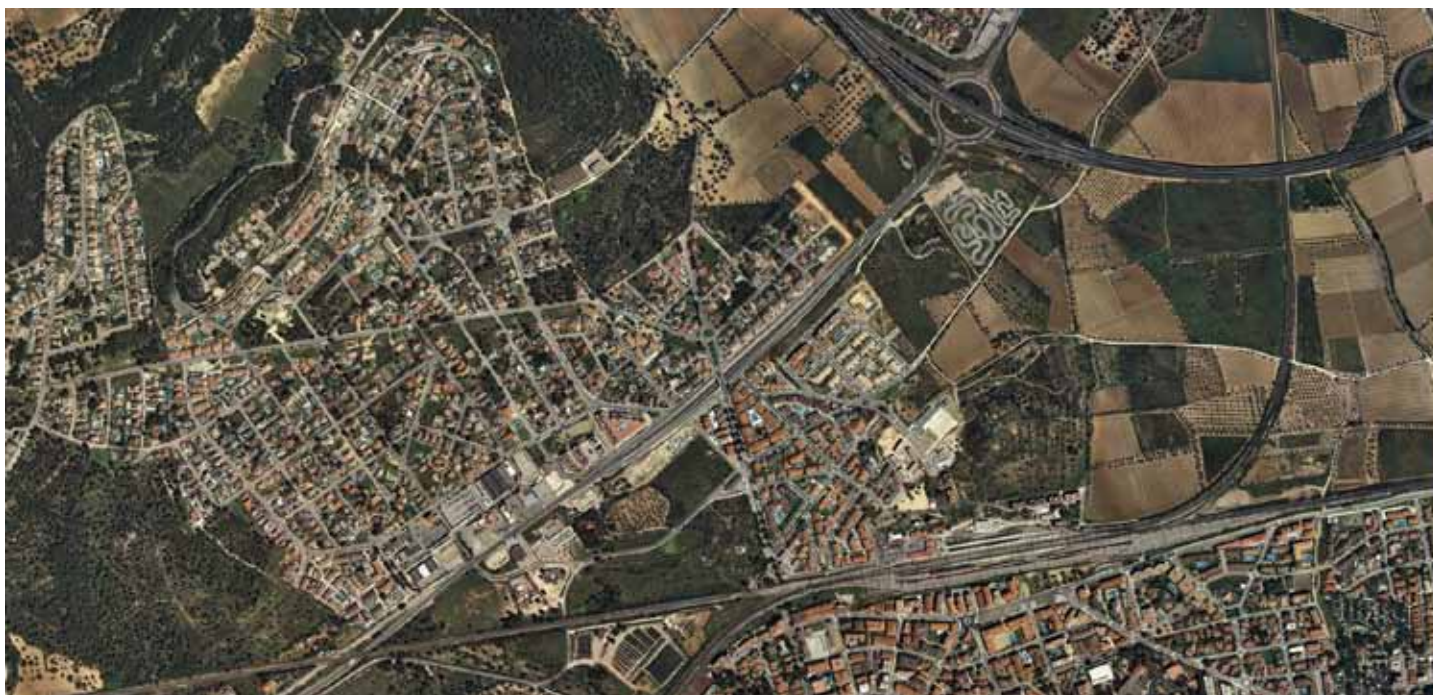
El mateix sector a l'any 2010. Els camps de garrofers i el conjunt del paisatge agrícola han desaparegut sota l'avenç de les urbanitzacions i el desenvolupament de la xarxa viària. ICC