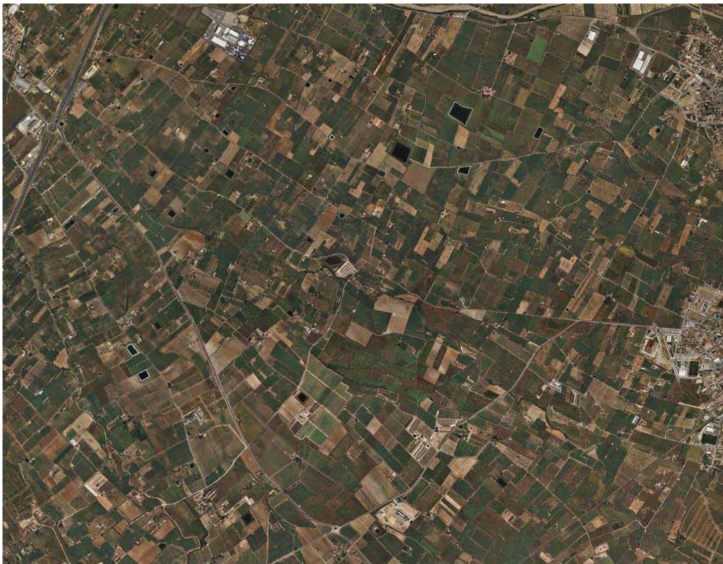
Monoconreu d'avellaner als camps del Francolí. ICC