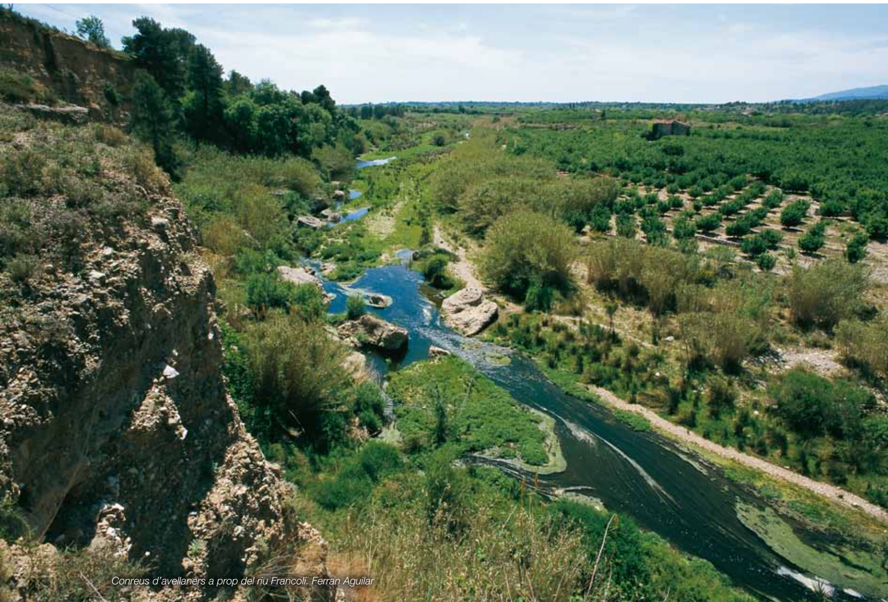
Conreus d'avellaners a prop del riu Francolí. Ferran Aguilar

Els camps d'avellaners del Baix Camp constitueixen l'àrea contínua més extensa d'aquest conreu a tot Europa, i és el conreu que més caracteritza i singularitza el Camp de Tarragona.