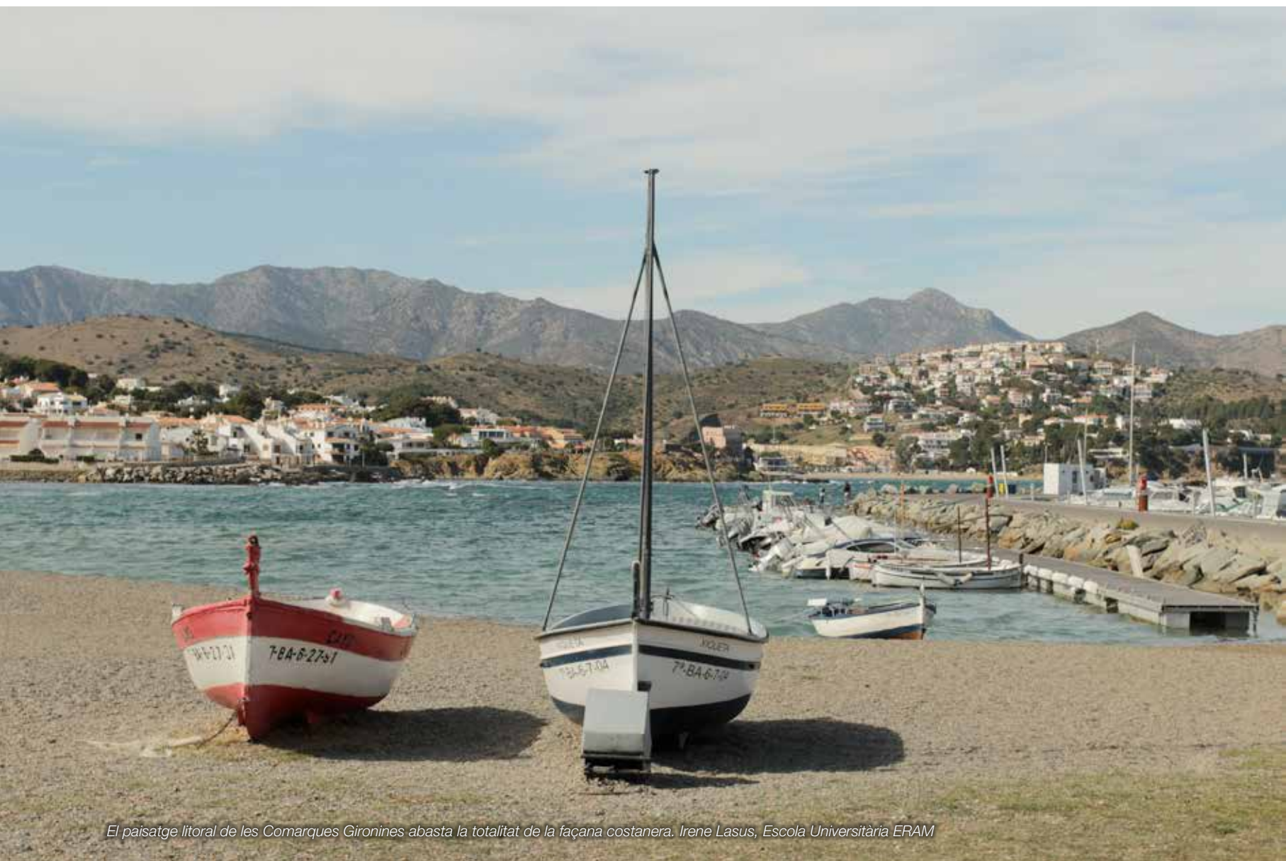
El paisatge litoral de les Comarques Gironines abasta la totalitat de la façana costanera. Irene Lasus, Escola Universitària ERAM

El paisatge litoral de les Comarques Gironines és un territori dinàmic que durant el segle xx ha experimentat canvis significatius, a causa, principalment, dels processos de desenvolupament econòmic i dels respectius canvis d'usos del sòl. Segurament no es pot parlar de la costa sense parlar del turisme, el motor més decisiu per a l'evolució territorial d'aquest espai i, sobretot, la raó per la qual la Costa Brava, ja des dels anys trenta, i més especialment a partir dels seixanta, es va convertir en un espai apreciat pels seus habitants i pels visitants i va formar part de l'imaginari turístic col·lectiu.