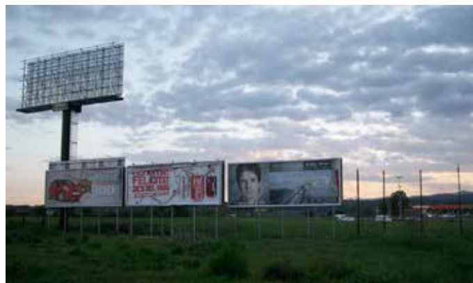
Als marges de les carreteres i a les entrades de les poblacions és on es disposen amb poc ordre panells publicitaris, naus industrials i infraestructures de diverses tipologies. Observatori del Paisatge