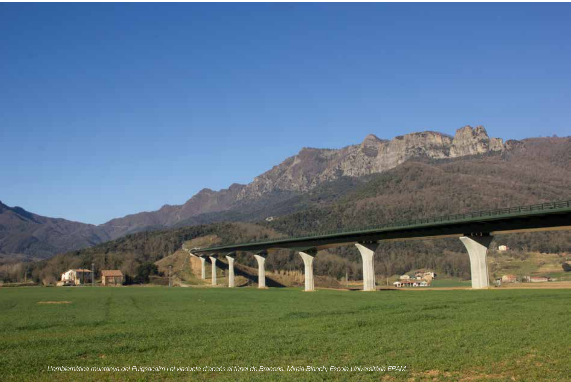
L'emblemàtica muntanya del Puigsacalm i el viaducte d'accés al túnel de Bracons. Mireia Blanch, Escola Universitària ERAM

El paisatge d'atenció especial (PAE) de la vall d'en Bas agafa part de les unitats de paisatge de valls d'Olot i Cabrerès-Puigsacalm i engloba un total de quatre municipis: les Preses, Olot, Riudaura i la Vall d'en Bas.