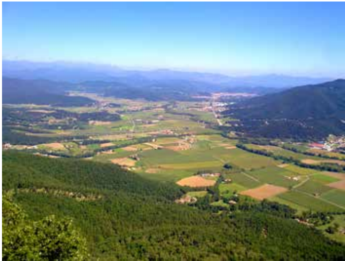
La vall d'en Bas des de l'ermita de Sant Miquel de Castelló. Observatori del Paisatge

sen la vall d'en Bas, factor que justifica ja d'entrada la necessitat de preservar els seus nombrosos valors paisatgístics. A banda de l'elevat valor estètic intrínsec d'aquesta vall, objecte de les mirades de molts artistes i tot un reclam per al turisme, la plana té un clar valor productiu, en què predomina el cultiu de blat de moro. Igualment, la vall d'en Bas exerceix de connector entre espais protegits com l'EIN Serres de Milany-Santa Magdalena, l'EIN Puigsacalm-Bellmunt, l'EIN Collsacabra i el Parc Natural de la Zona Volcànica de la Garrotxa (PNZVG), fet que dóna mostra dels valors ecològics que es poden trobar a la vall, la qual exerceix un clar rol de connector.