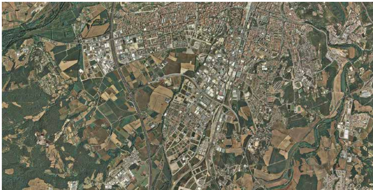
El mateix sector a l'any 2013. En només 20 anys es pot observar l'avanç urbanístic al pla de Salt així com el creixement de la zona industrial del Perelló i Mas Xirgu a l'entrada sud de l'àrea urbana de Girona.