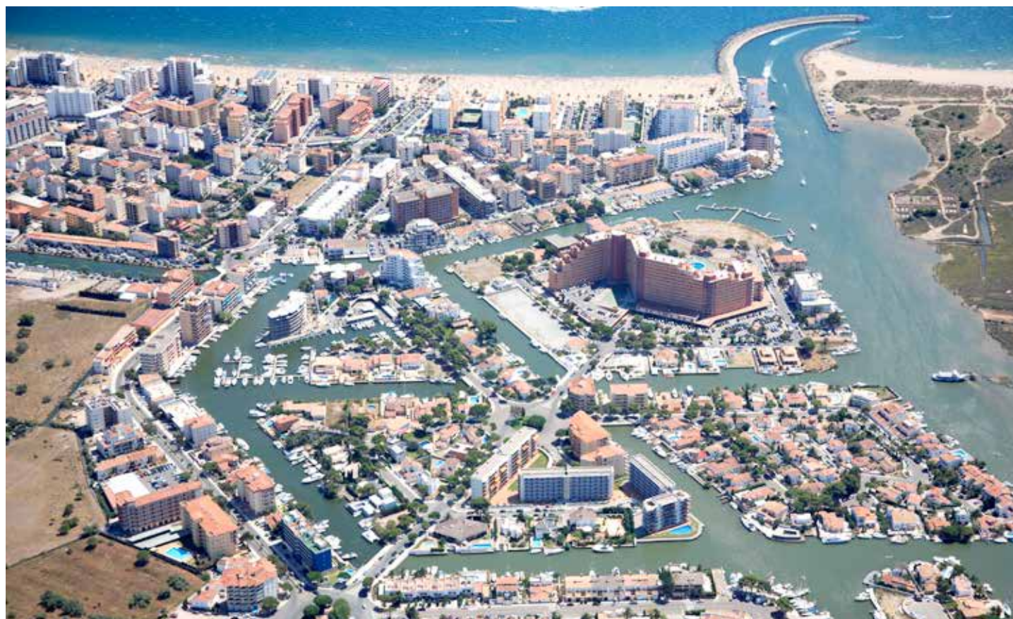
Vista de la urbanització Santa Margarida de Roses. Departament de Territori i Sostenibilitat