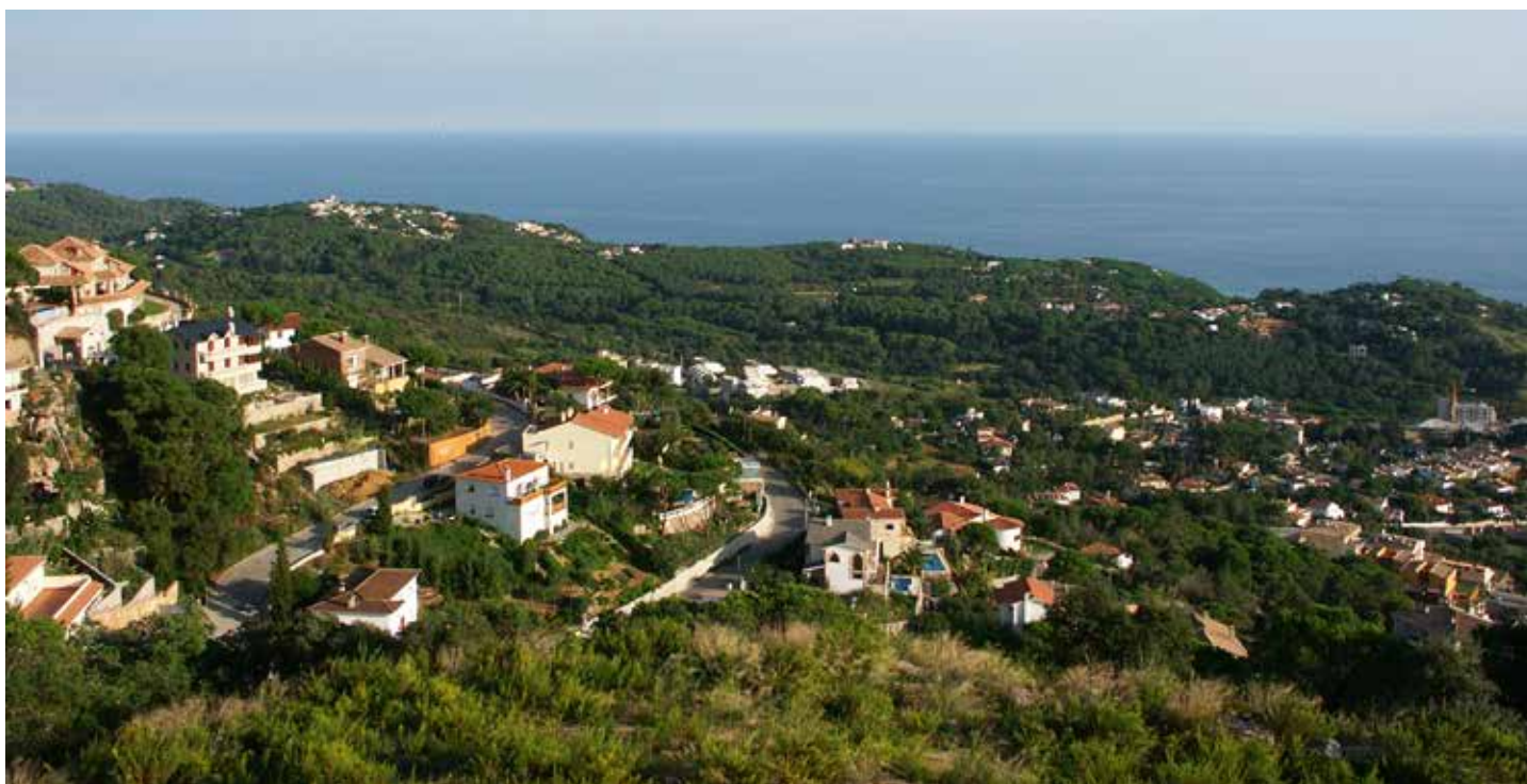
Urbanitzacions a les muntanyes properes a Lloret de Mar. Observatori del Paisatge