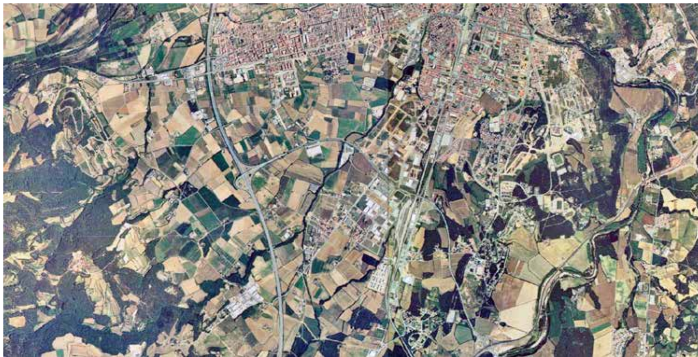
Fotografia aèria de l'any 1993 del sector entre Girona, Salt i Vilablareix. ICGC